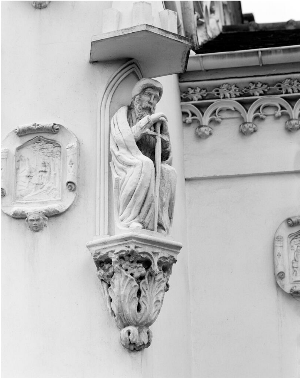
Détail d'une sculpture en haut-relief à l'angle de la façade.