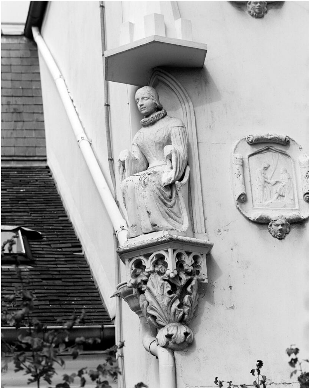
Détail d'une sculpture en haut-relief à l'angle de la façade.