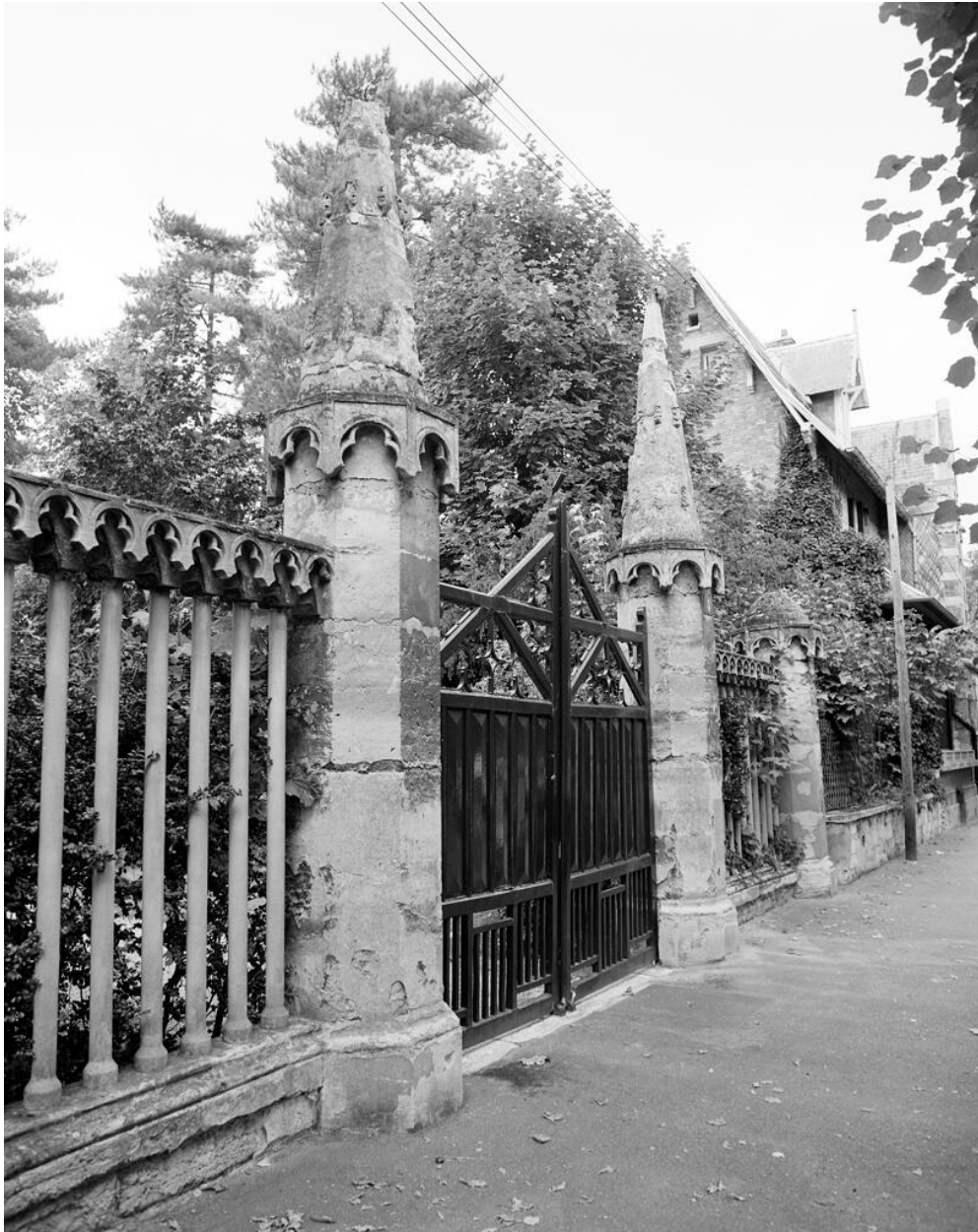
Portail de la maison.