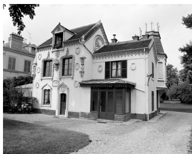
Façade vers la rue.