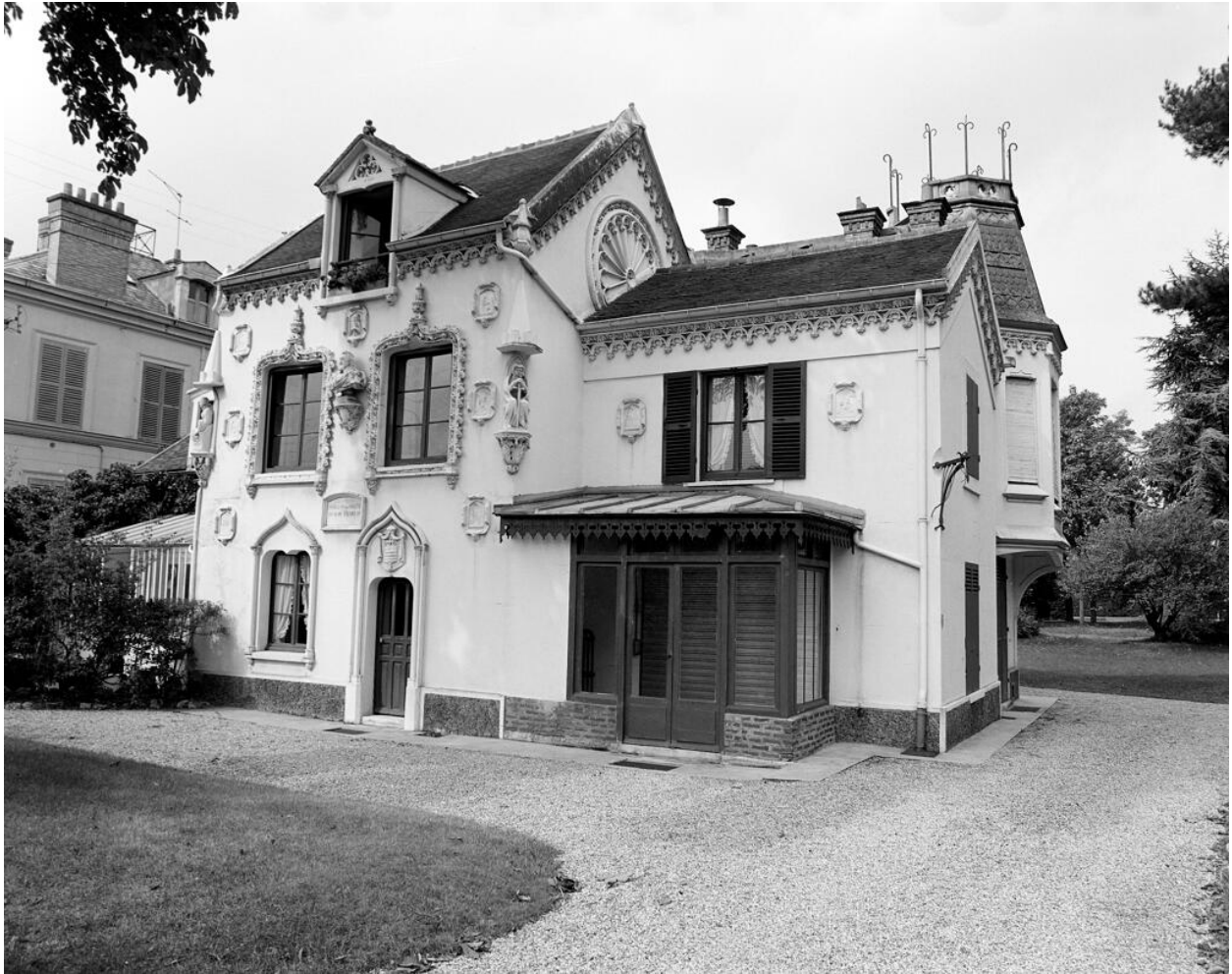
Façade vers la rue.