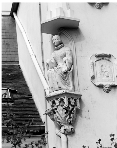
Détail d'une sculpture en haut-relief à l'angle de la façade. IVR11_19767800182X