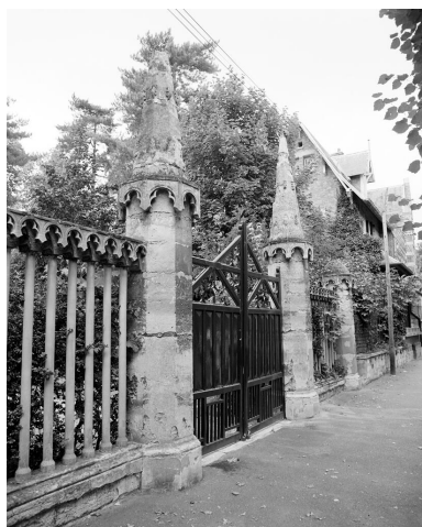
Portail de la maison.