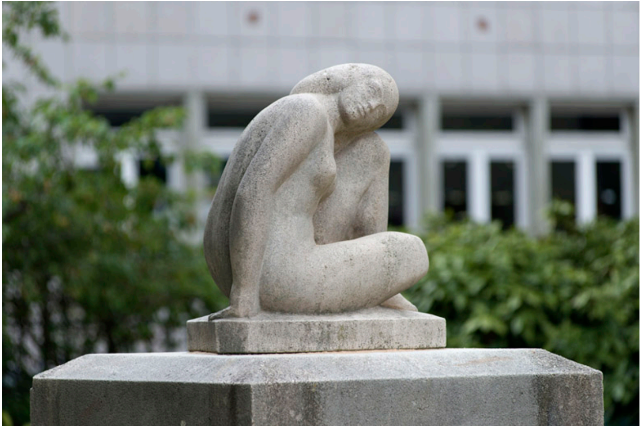
femme assise vue de trois quart