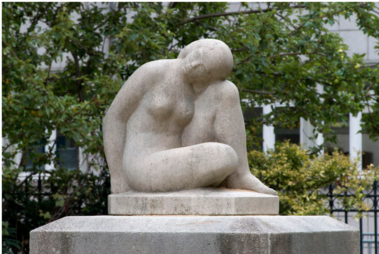
Statue de femme assise vue du face.