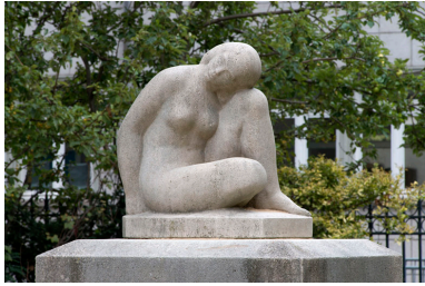
Statue de femme assise vue du face. IVR11_20157500286NUC4A