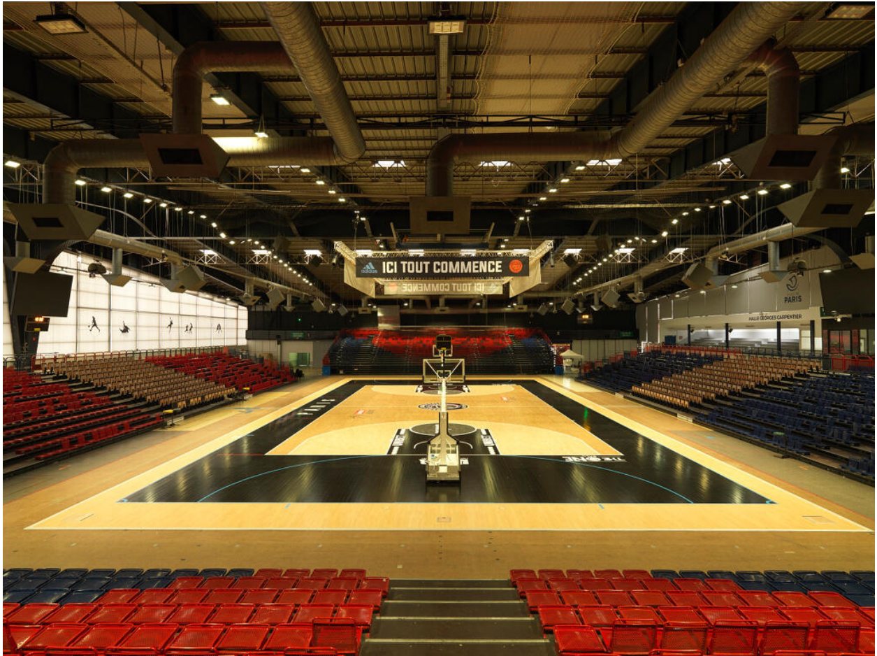
Le centre sportif Georges Carpentier.