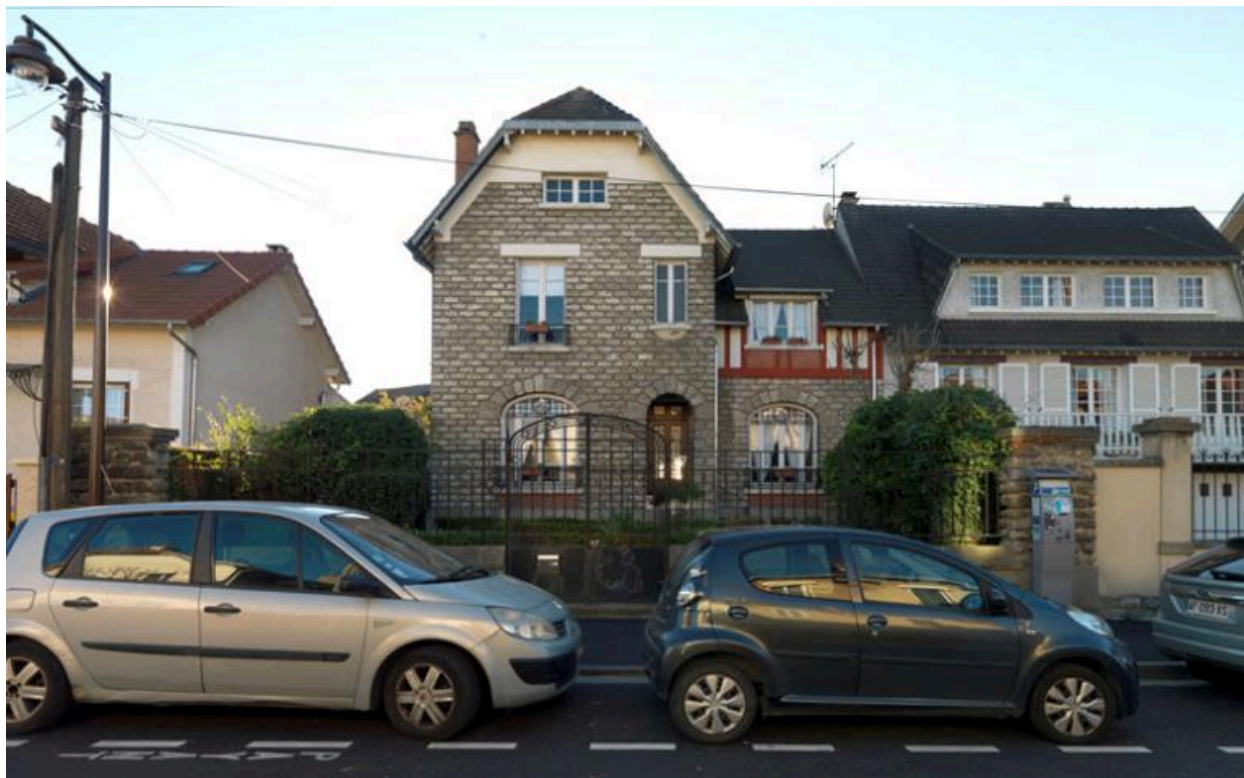
Vue de la façade principale.