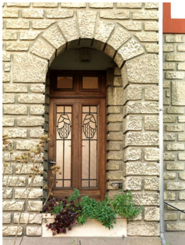
Détail de la loggia d'entrée et des ferronneries de la porte.