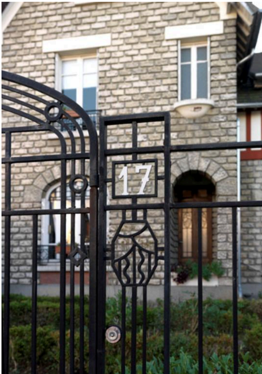
Vue de détail de la ferronnerie du portail.