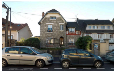
Vue de la façade principale. IVR11_20167800771NUC4A