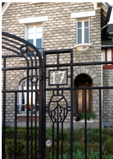
Vue de détail de la ferronnerie du portail. IVR11_20167800787NUC4A