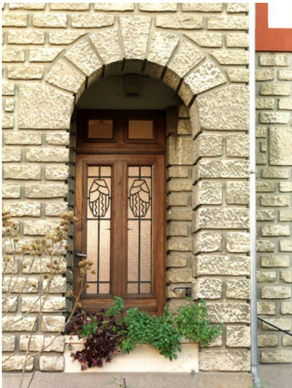
Détail de la loggia d'entrée et des ferronneries de la porte.