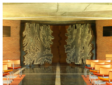
Vue des portes qui s'ouvrent lorsqu'un cercueil doit être dirigé vers le four crématoire.