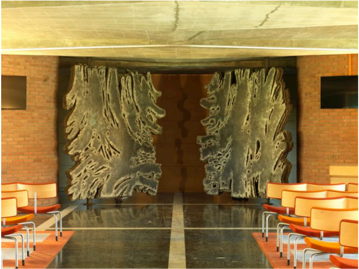
Vue des portes qui s'ouvrent lorsqu'un cercueil doit être dirigé vers le four crématoire.