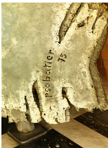
Détail de la signature et du traitement du métal.