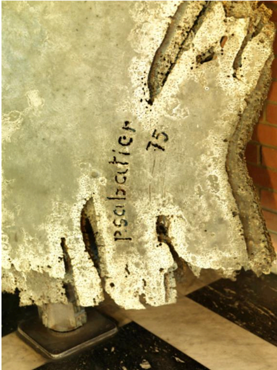
Détail de la signature et du traitement du métal.