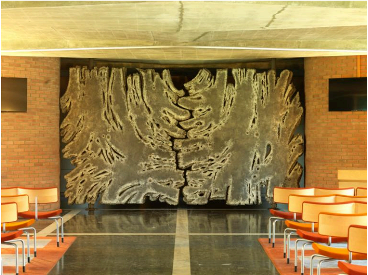
Vue actuelle des deux portes fermées.