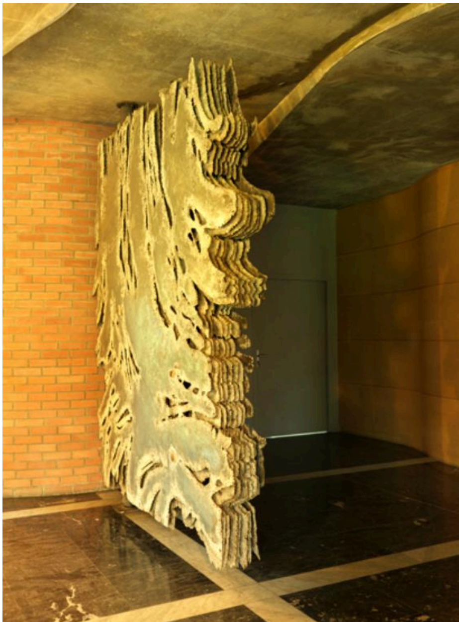
Détail d'une des portes montrant le principe de superposition des feuilles de métal.