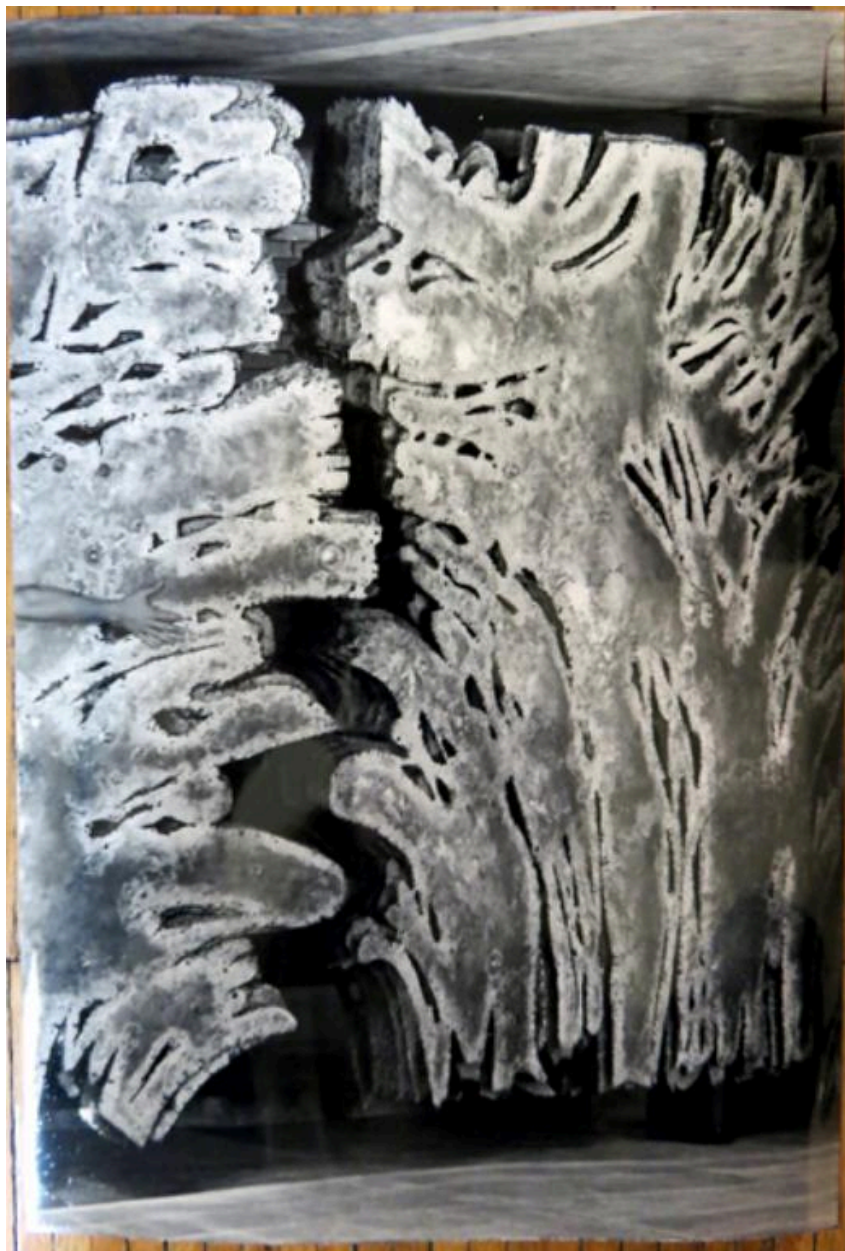
Vue des Portes de l' Au-delà, peu après leur pose (circa 1975).