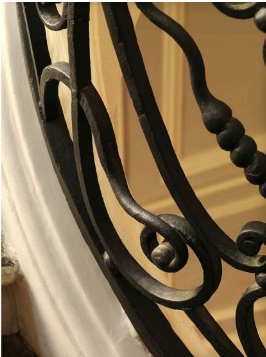
Détail d'un ornement en fer rond puis carré dans le premier panneau tournant.