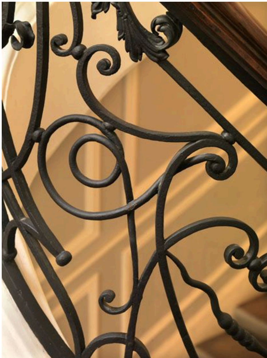
Détail d'un ornement en fer rond puis carré dans le premier panneau tournant.