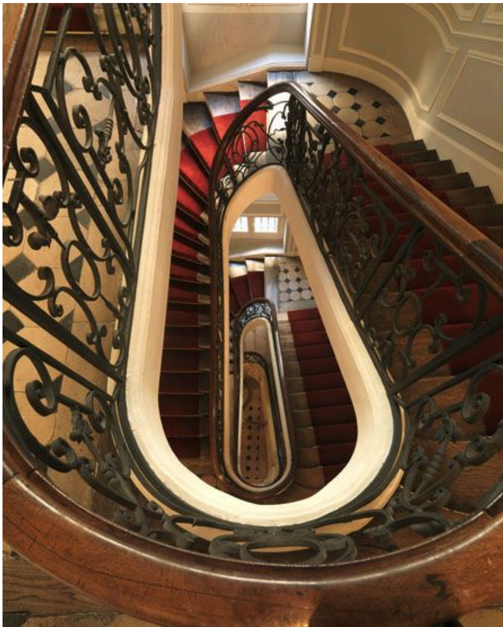
Vue du vide central en plongée depuis le dernier palier.