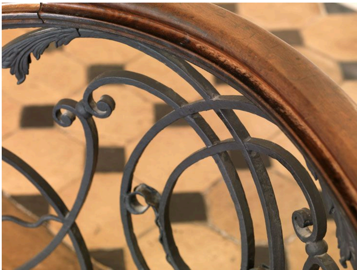
Détail des fers entrecroisés dans le premier panneau.