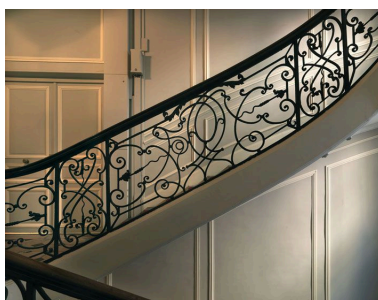
Le panneau rampant de la deuxième volée. IVR11_20097501633NUC4A