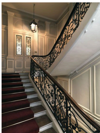
La première et la deuxième volée. IVR11_20097501632NUC4A