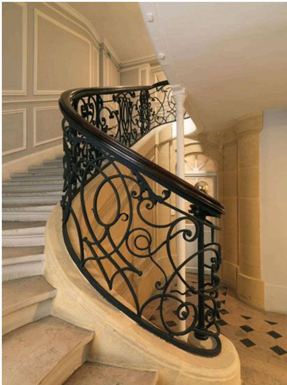
Vue du premier panneau tournant.