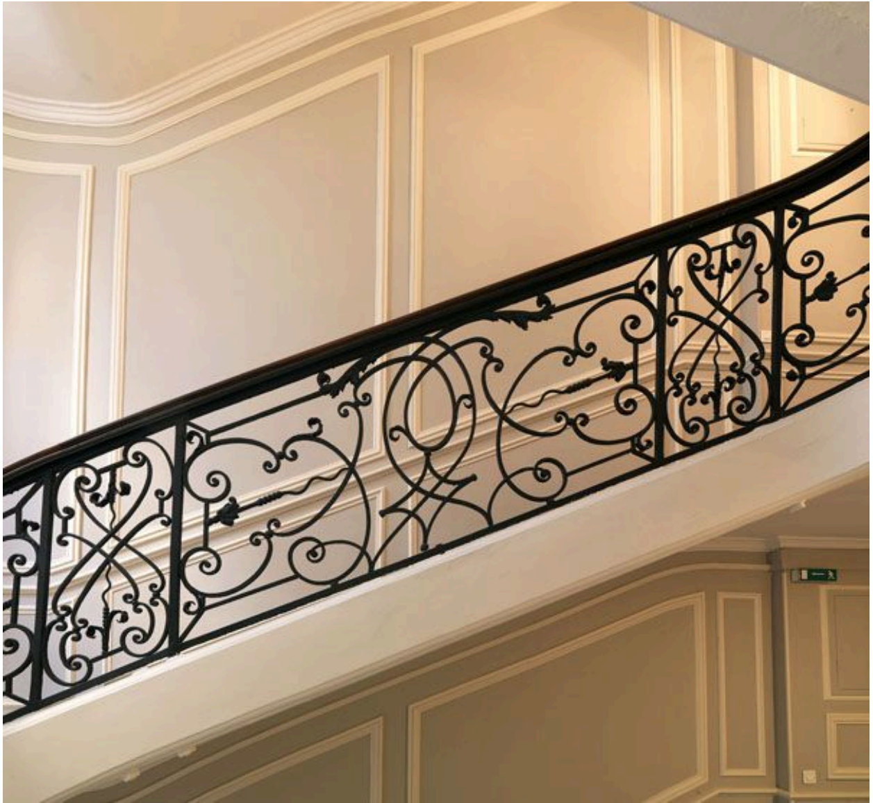
Un panneau rampant et ses deux pilastres dans la première volée.