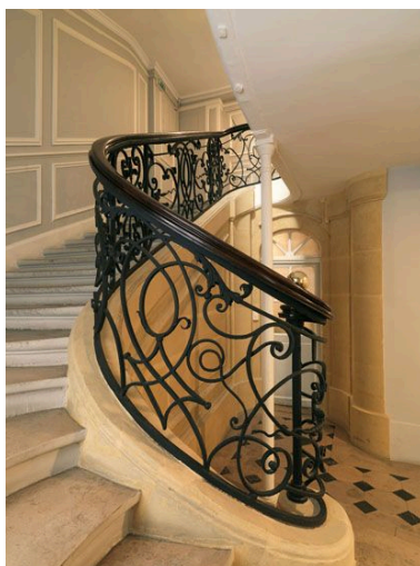
Vue du premier panneau tournant. IVR11_20097501626NUC4A

IVR11_20127500862NUDA