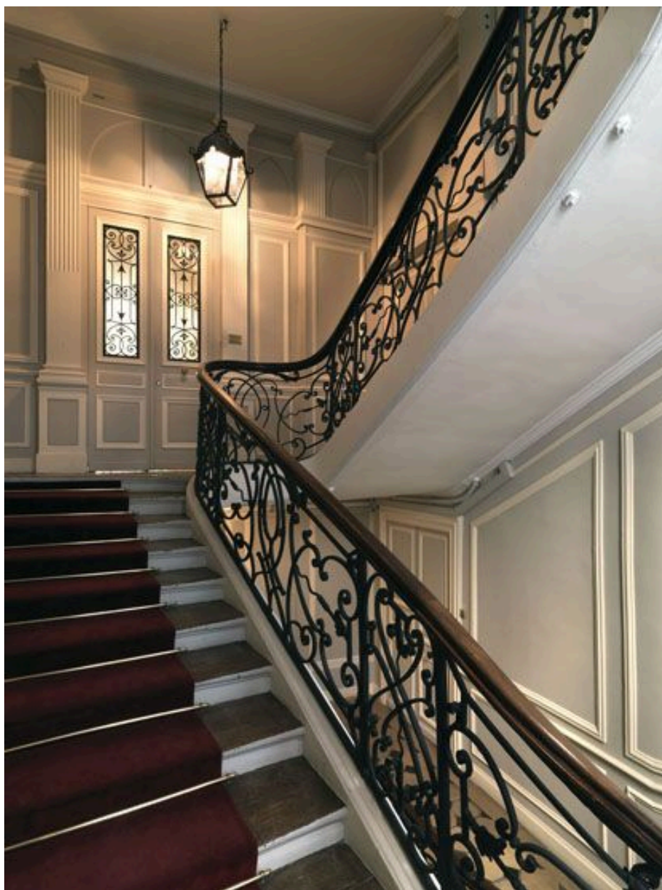
La première et la deuxième volée.