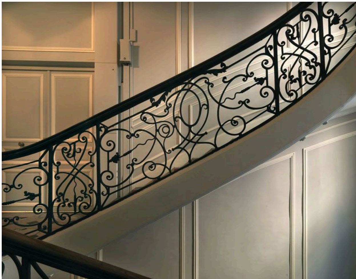
Le panneau rampant de la deuxième volée.