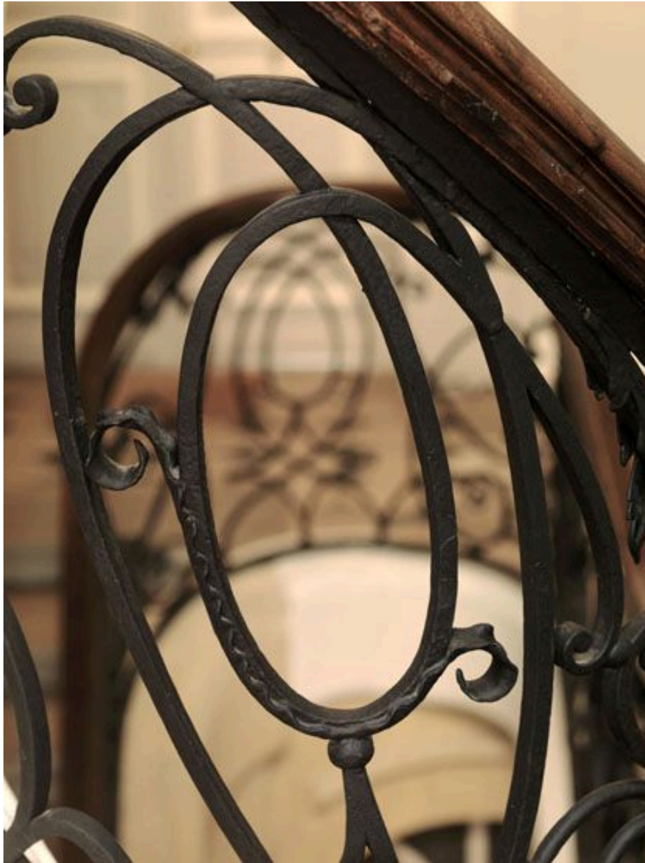
Détail d'un médaillon central.