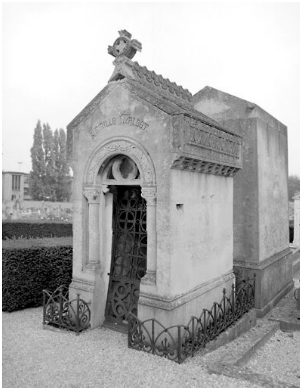
Vue d'ensemble. La grille en fonte porte la signature de Bardoux (Deuil).