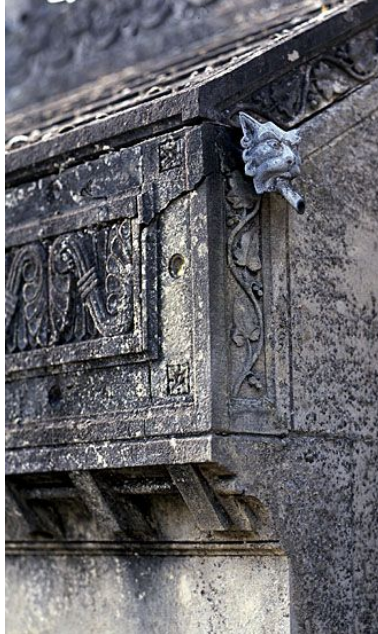
Détail : petite gargouille à l'arrière de la chapelle.