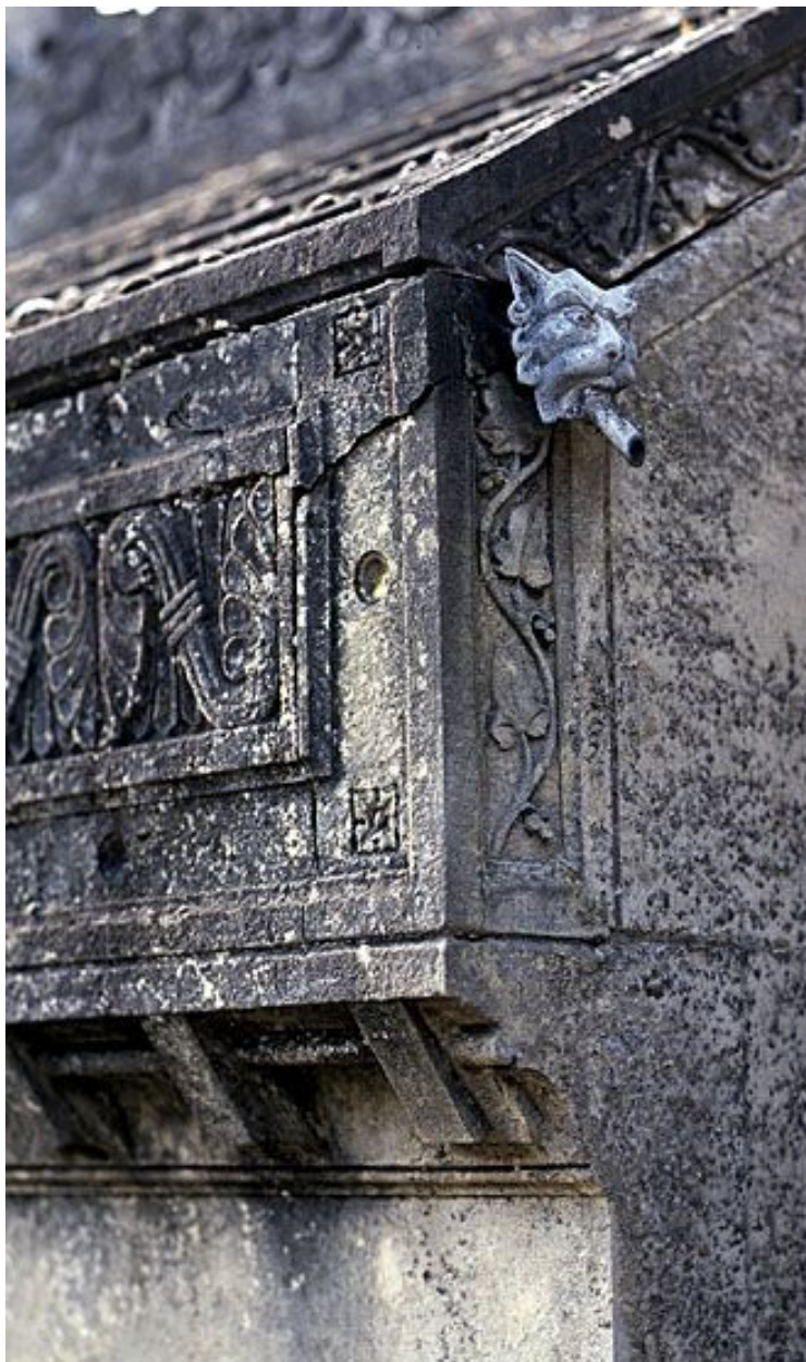
Détail : petite gargouille à l'arrière de la chapelle.