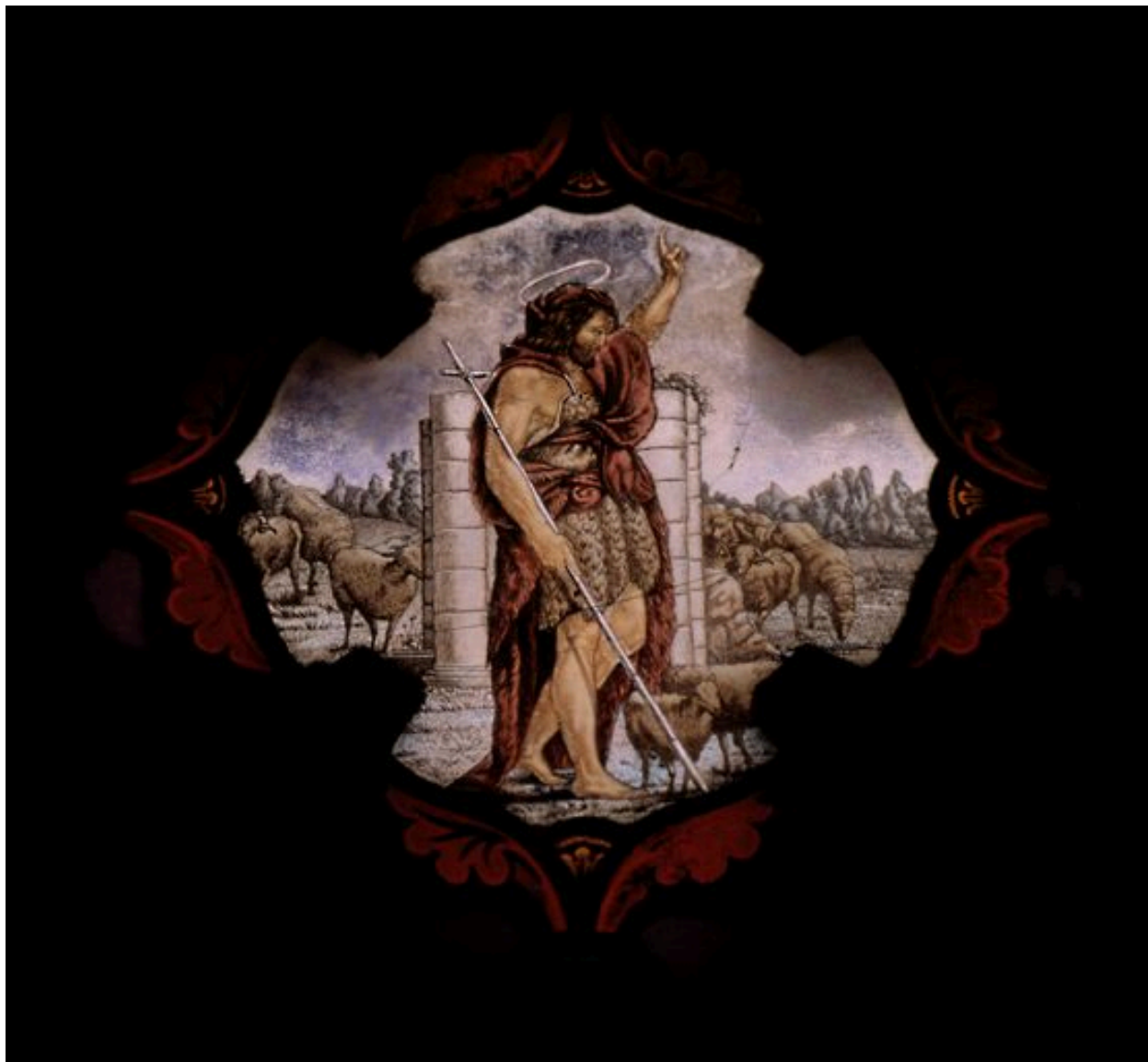
Verrière : saint Jean Baptiste. Dernier quart du 19e siècle.