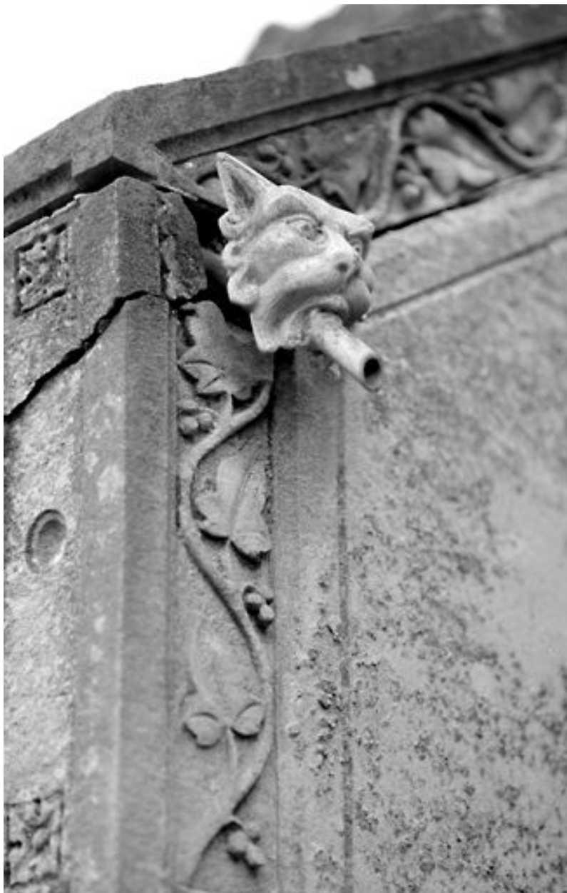
Détail : petite gargouille à l'arrière de la chapelle.