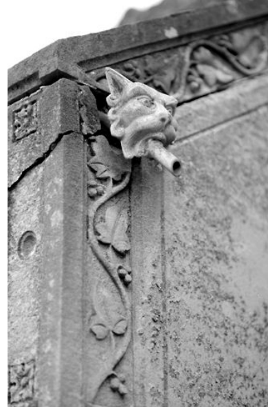
Détail : petite gargouille à l'arrière de la chapelle. IVR11_20027700833X