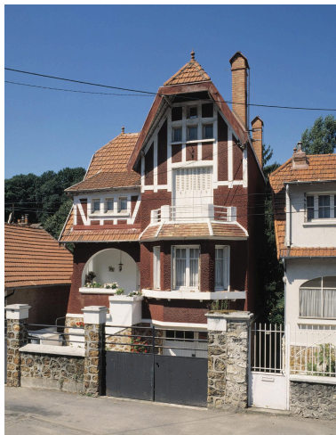
La façade sur rue. IVR11_20017800027XA