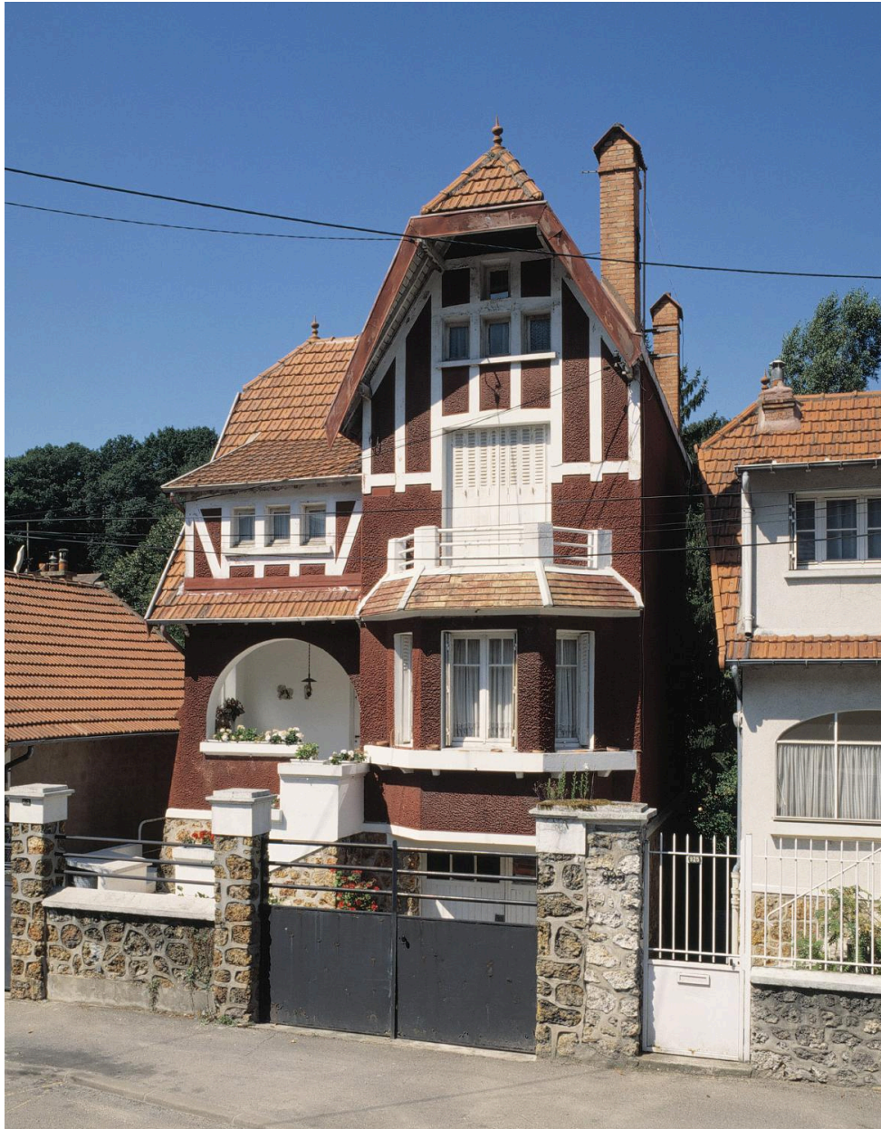
La façade sur rue.