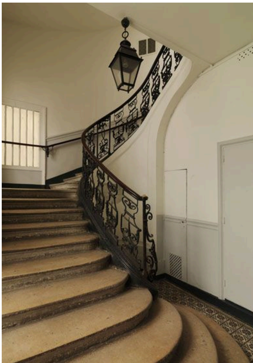
Vue d'ensemble du départ de l'escalier.