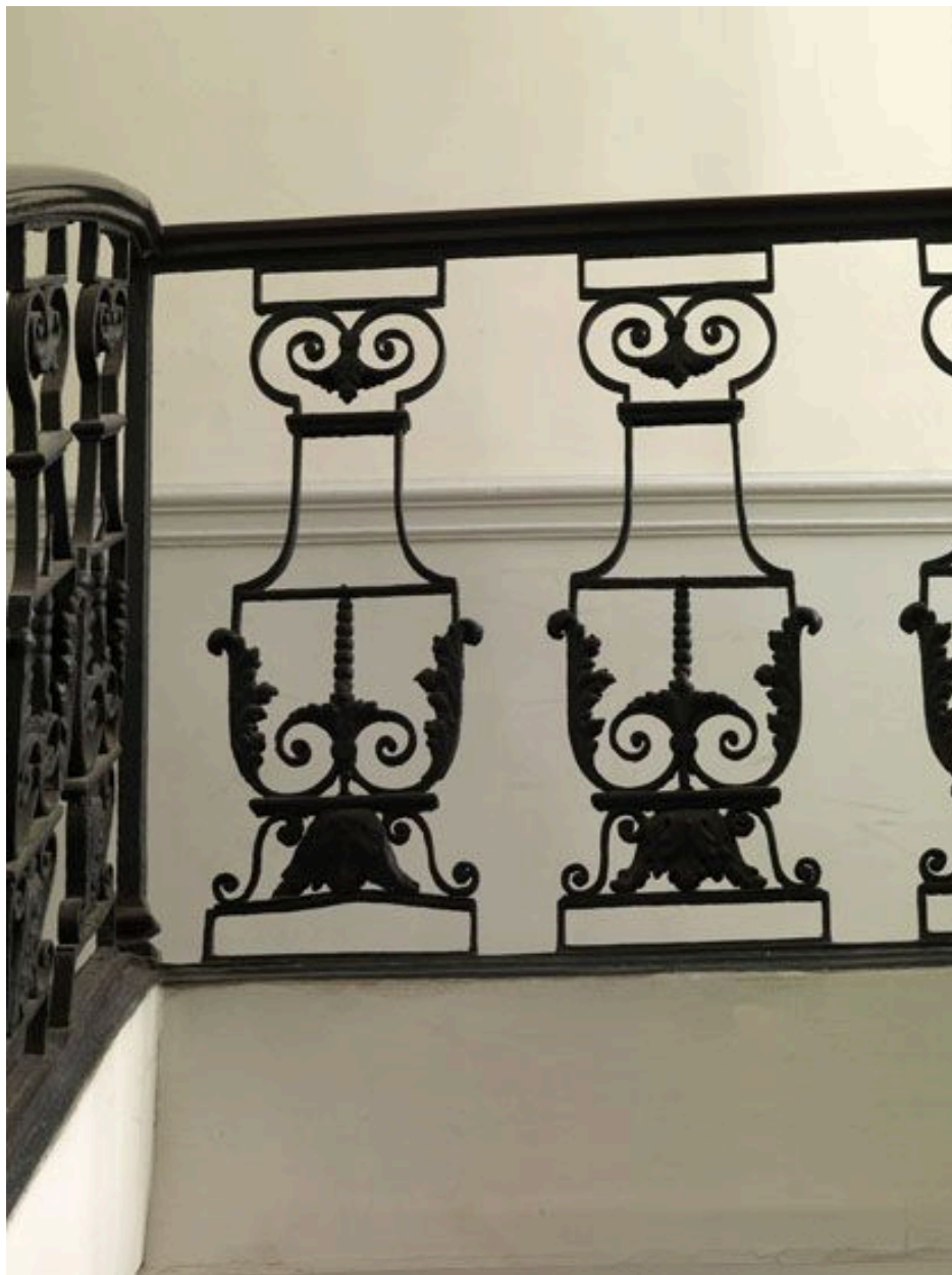
Balustres droits du dernier palier en partie refaits.