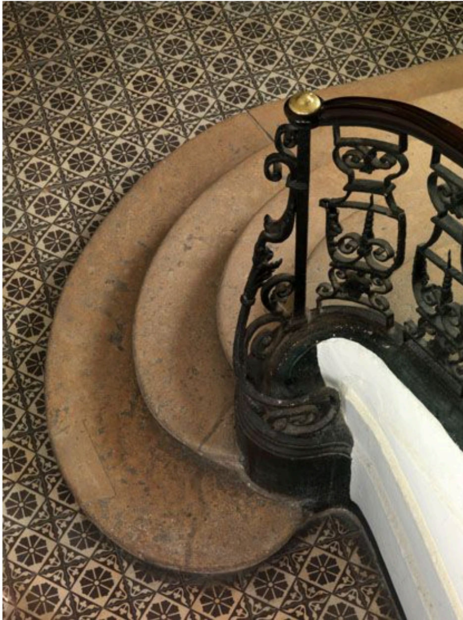
Vue du départ de l'escalier.