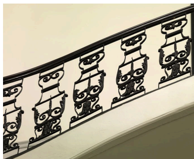
Balustres rampants.