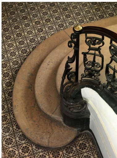
Vue du départ de l'escalier. IVR11_20107500204NUC4A