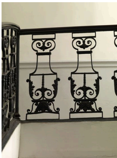
Balustres droits du dernier palier en partie refaits. IVR11_20107500208NUC4A