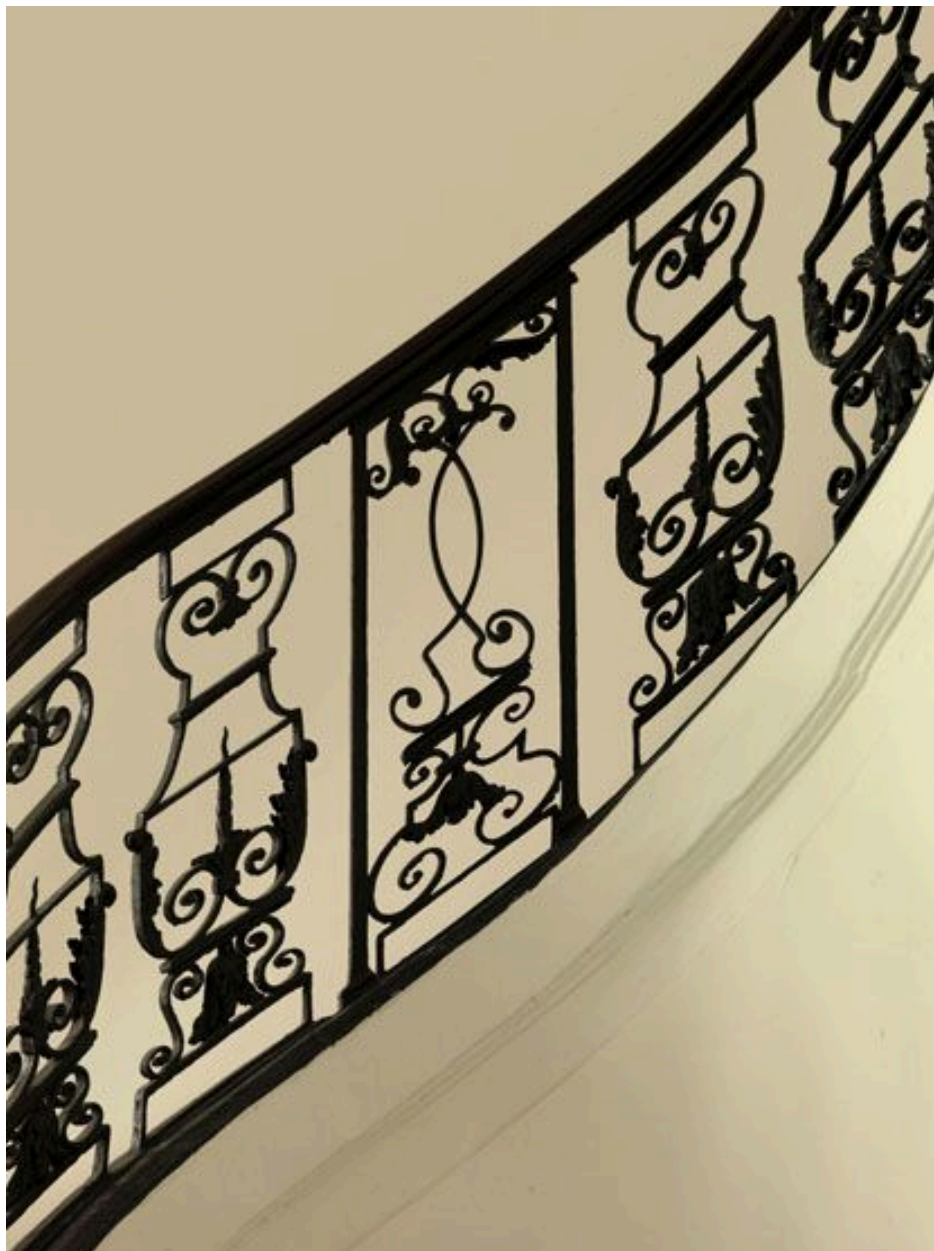
Détail des balustres rampants et d'un pilastre central.