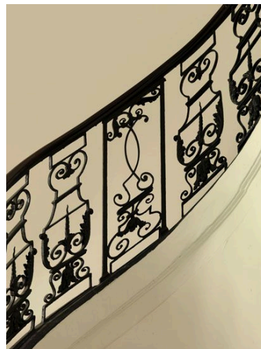
Détail des balustres rampants et d'un pilastre central. IVR11_20107500206NUC4A