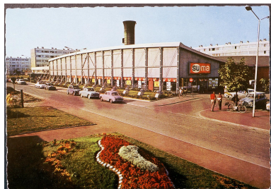
Vue d'ensemble. IVR11_20019100777NUCAB