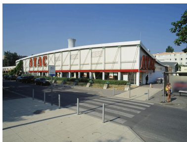
Vue d'ensemble. IVR11_20039100982XA