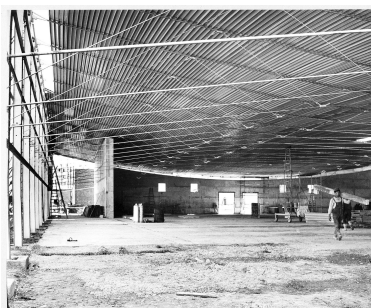
Autre vue du bâtiment en cours de construction. 1961. IVR11_20019100760NUCB