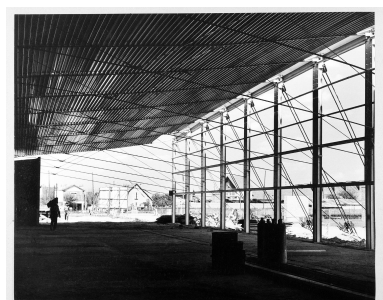
Vue du bâtiment en cours de construction. 1961. IVR11_20019100759NUCB