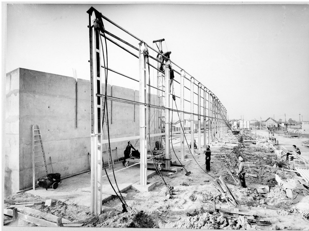
Construction du centre commercial (première charpente à câble en France, architecte Jean Heckly). 1961.