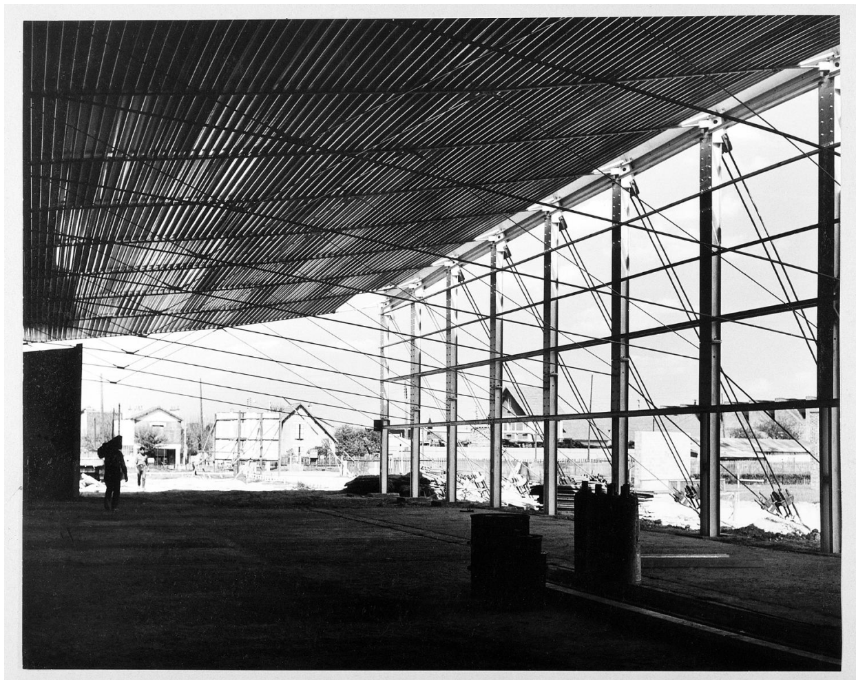
Vue du bâtiment en cours de construction. 1961.