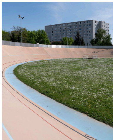
Piste du vélodrome de Saint-Denis