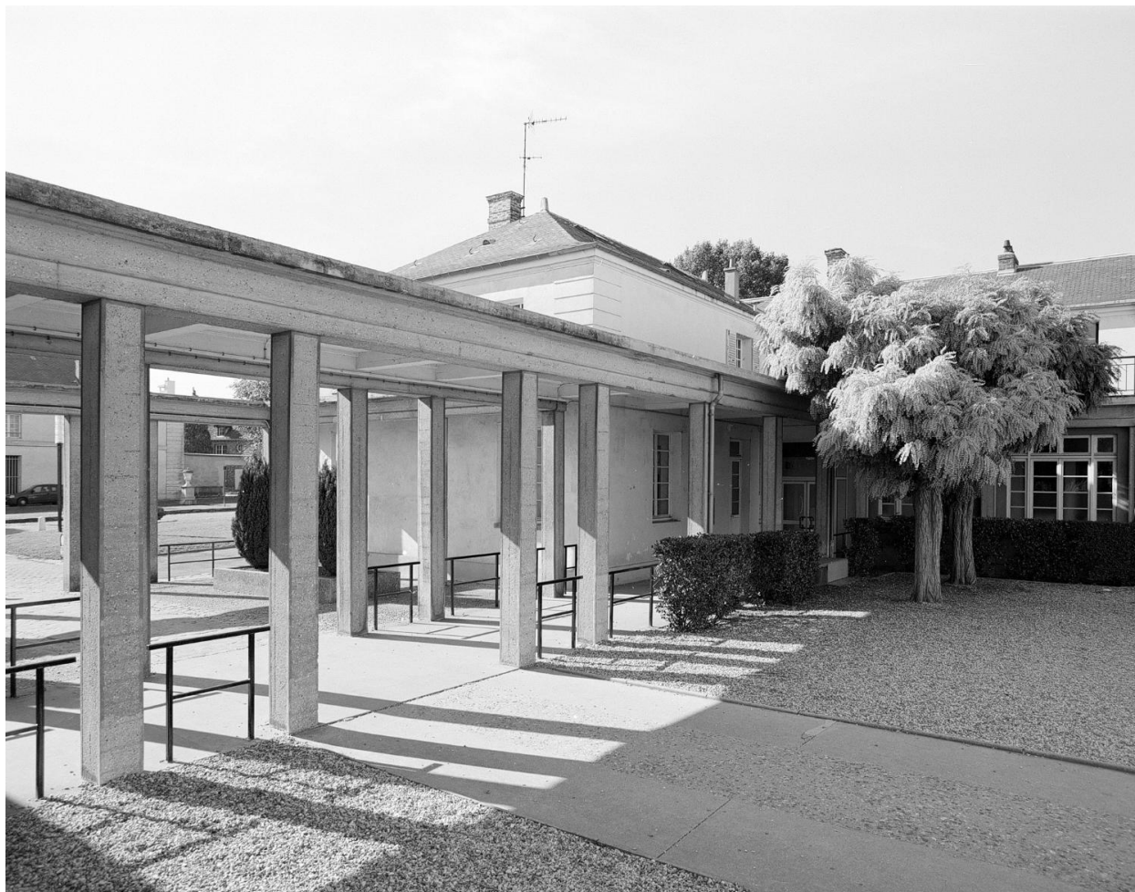
La galerie-portique vue de la cour de l'école.