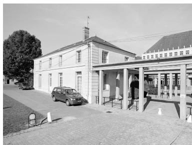
Sur le côté gauche de la cour d'honneur, pavillon et portique d'accès à la cour de l'école. IVR11_20019100538X