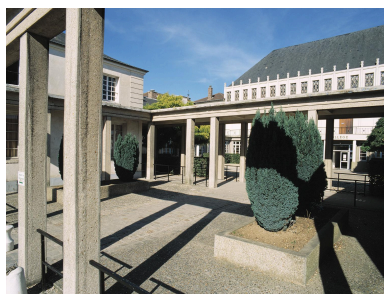
Vue d'ensemble de la petite cour délimitée par la double galerie-portique.