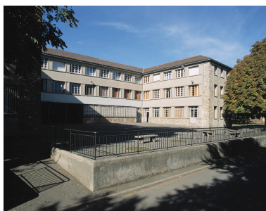
Façade postérieure du bâtiment scolaire construit en 1950.