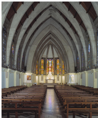
Chapelle : vue d'ensemble de la nef en direction du chœur.