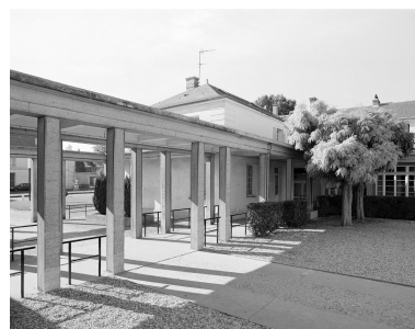
La galerie-portique vue de la cour de l'école.