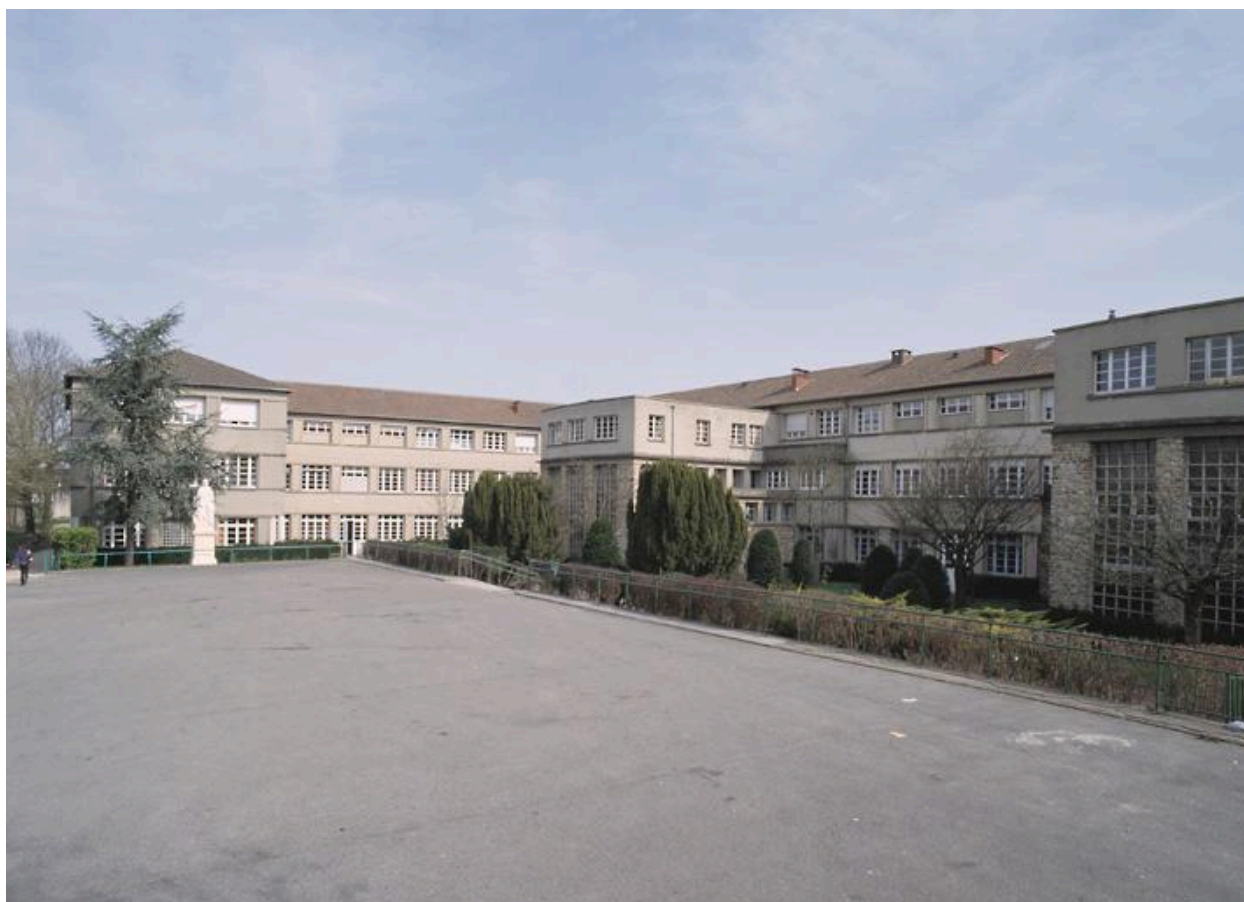
Vue côté cour du bâtiment scolaire construit en 1950.