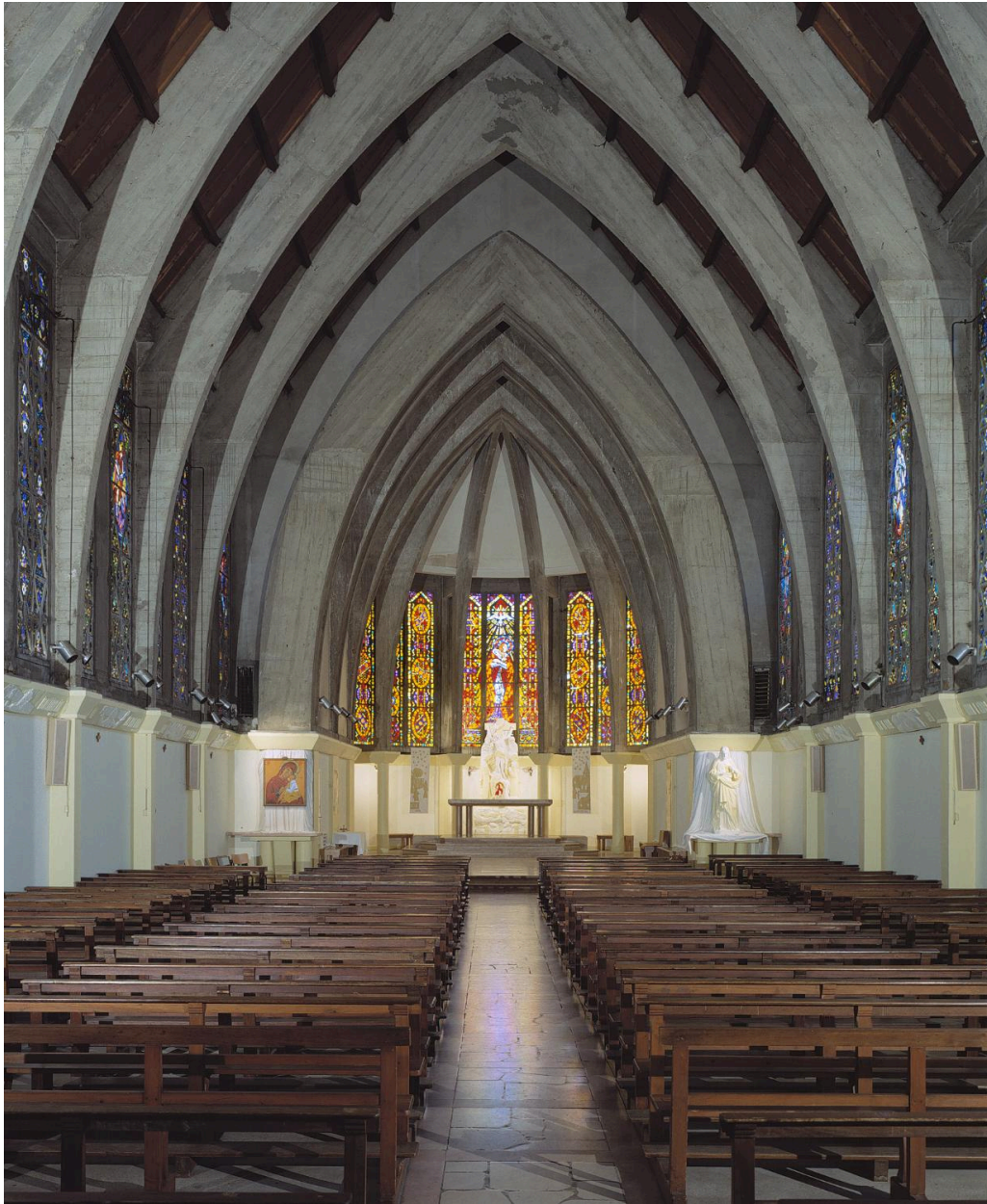
Chapelle : vue d'ensemble de la nef en direction du chœur.