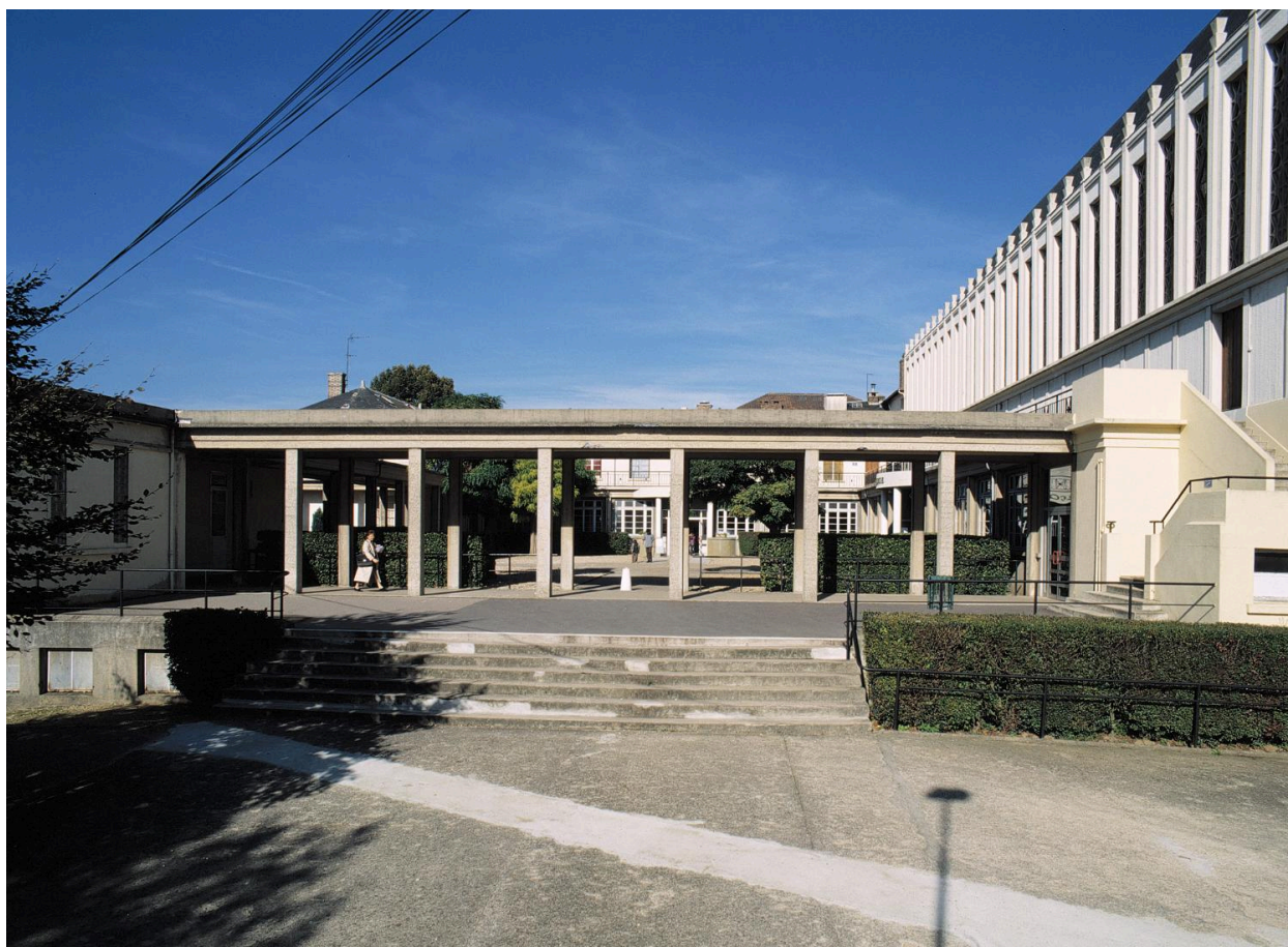
Le portique donnant accès à la cour d'école bordée d'un côté par la chapelle Saint-Charles-Borromée.