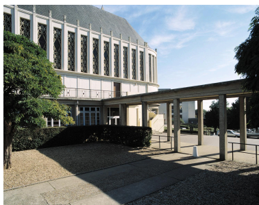
Le portique donnant accès à la cour d'école.