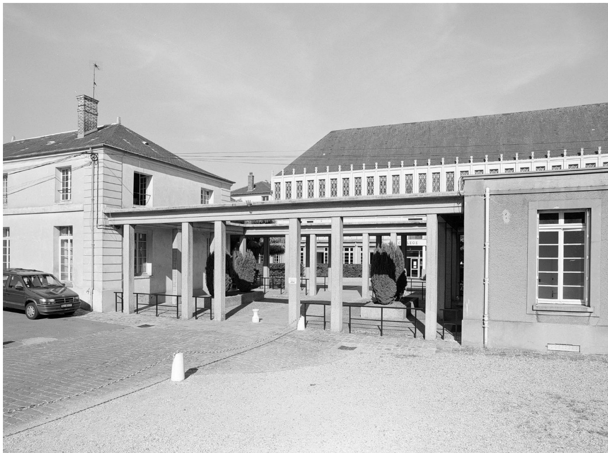
Vue d'ensemble de la double galerie-portique qui donne accès à la cour de l'école.