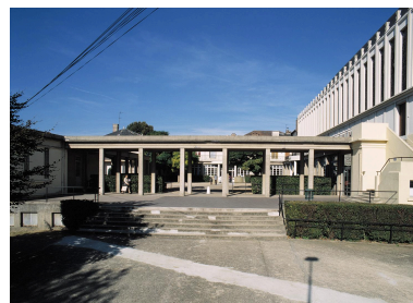
Le portique donnant accès à la cour d'école bordée d'un côté par la chapelle Saint-Charles-Borromée.