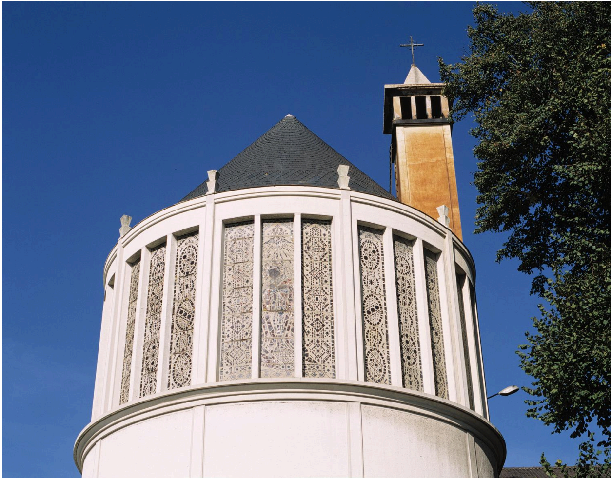
Détail de la baie du chevet et du clocher de la chapelle.