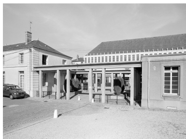
Vue d'ensemble de la double galerie-portique qui donne accès à la cour de l'école.