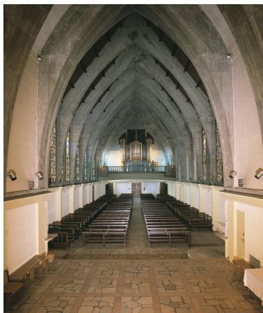
Chapelle : vue d'ensemble de la nef en direction de la tribune d'orgue.