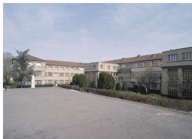
Vue côté cour du bâtiment scolaire construit en 1950. IVR11_20029100341XA