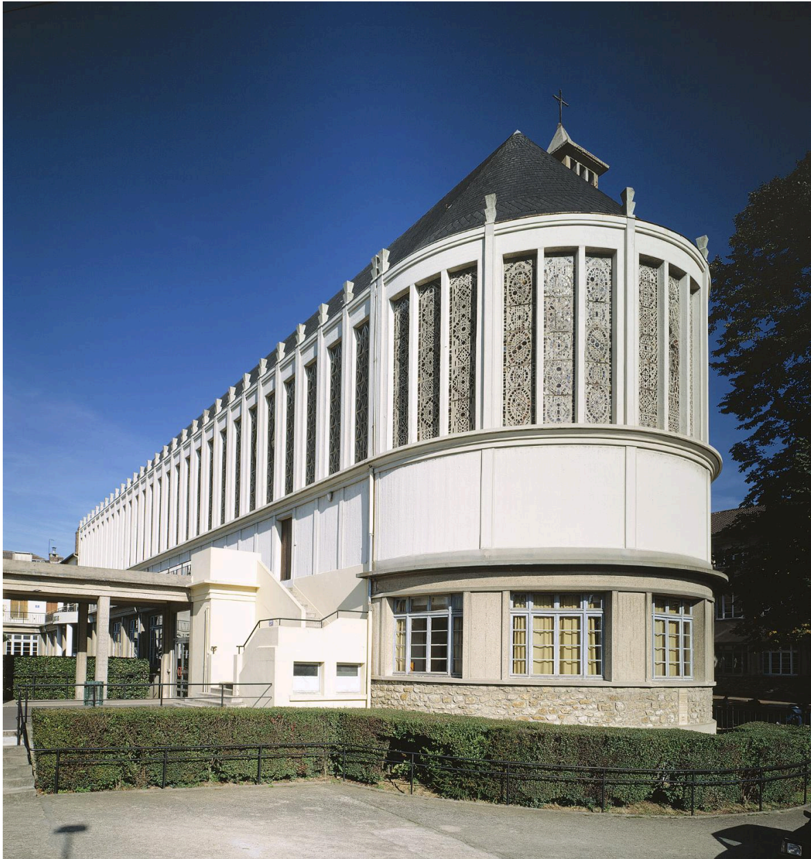
Vue d'ensemble de la chapelle Saint-Charles-Borromée.