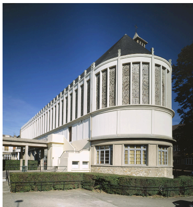
Vue d'ensemble de la chapelle Saint-Charles-Borromée.