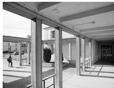
Vue de la galerie-portique conduisant aux bâtiments de l'école.