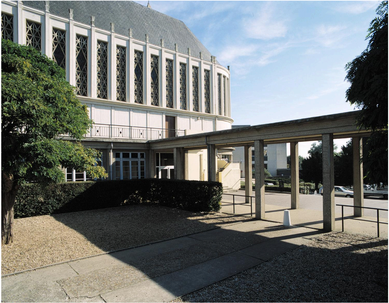
Le portique donnant accès à la cour d'école.