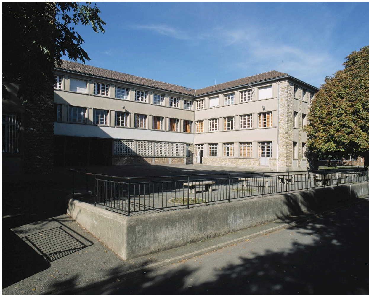
Façade postérieure du bâtiment scolaire construit en 1950.