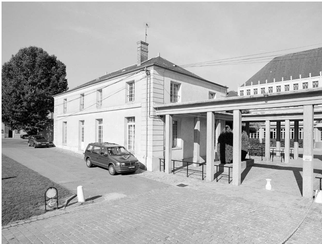
Sur le côté gauche de la cour d'honneur, pavillon et portique d'accès à la cour de l'école.