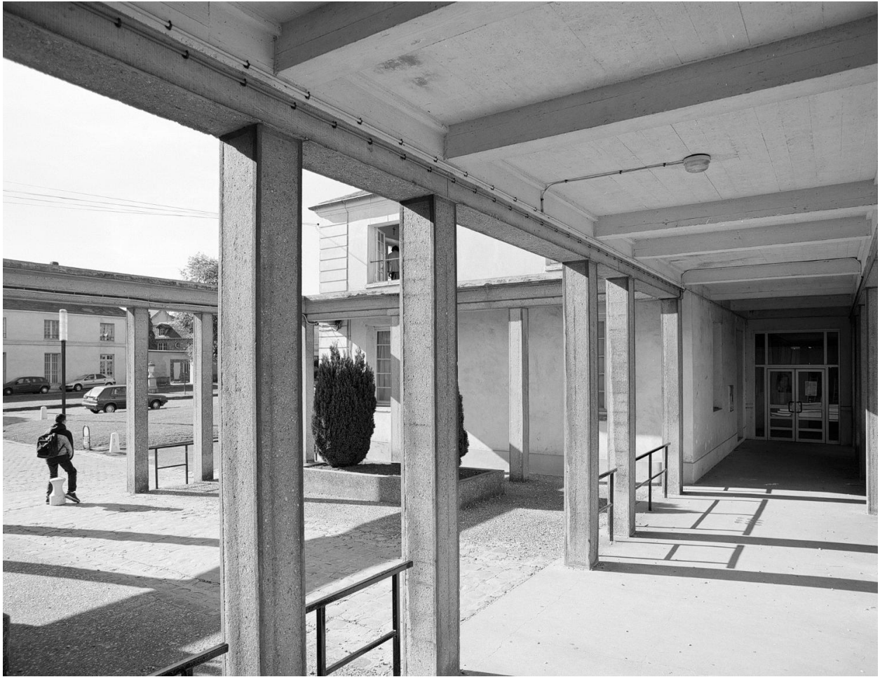
Vue de la galerie-portique conduisant aux bâtiments de l'école.