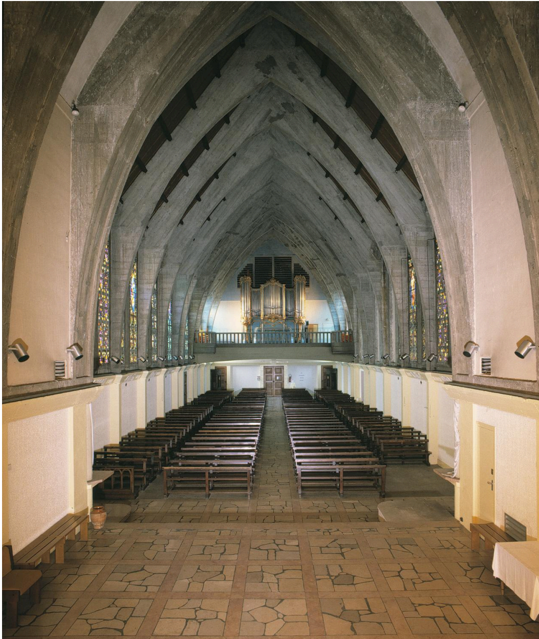
Chapelle : vue d'ensemble de la nef en direction de la tribune d'orgue.