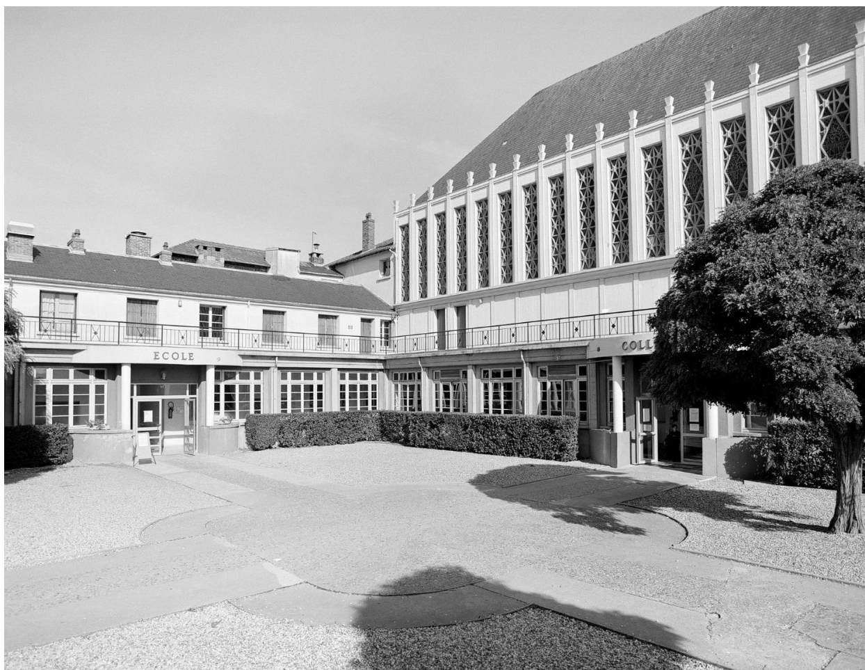
Vue d'ensemble de la cour bordée par l'école et par la chapelle.