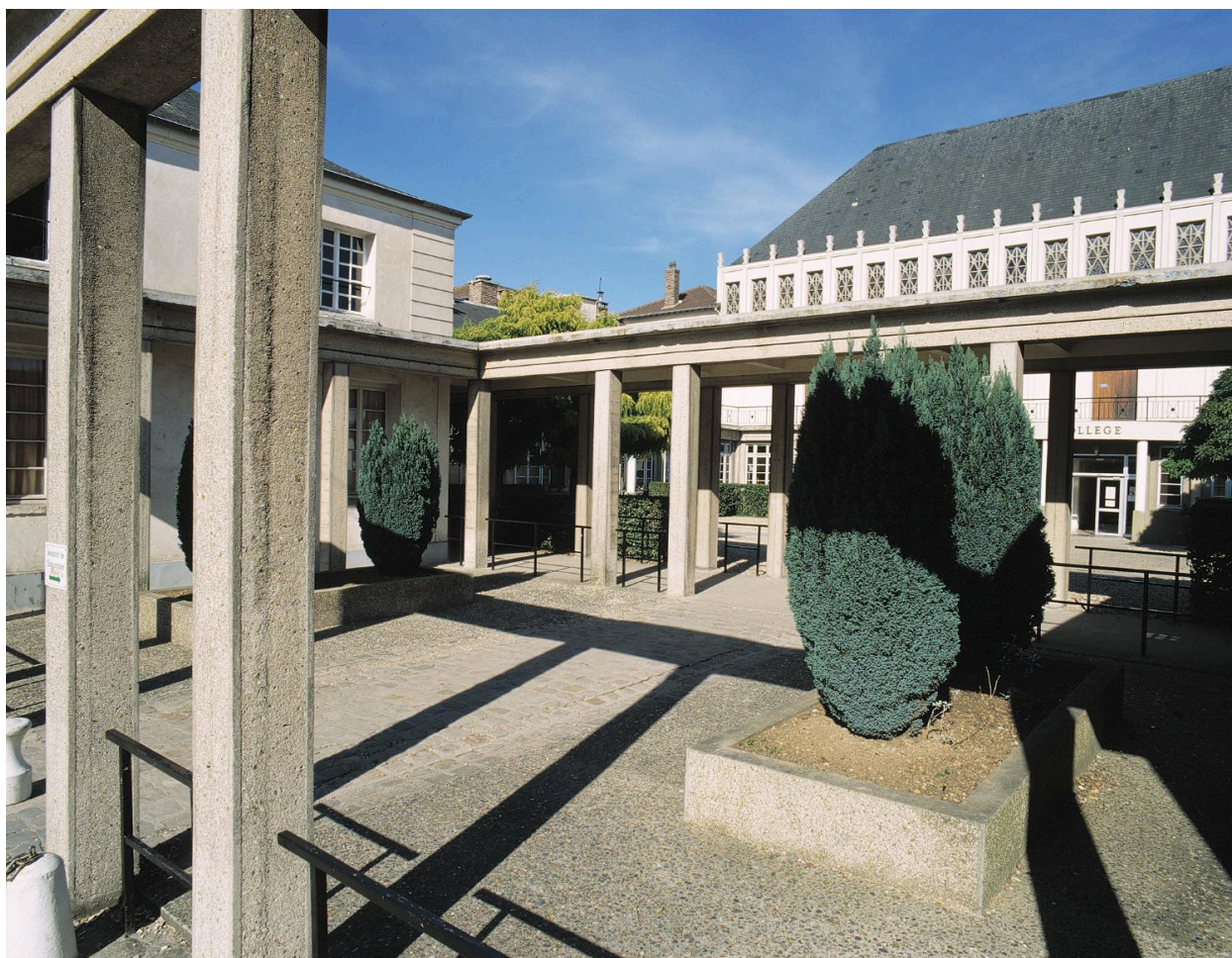
Vue d'ensemble de la petite cour délimitée par la double galerie-portique.