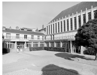
Vue d'ensemble de la cour bordée par l'école et par la chapelle.