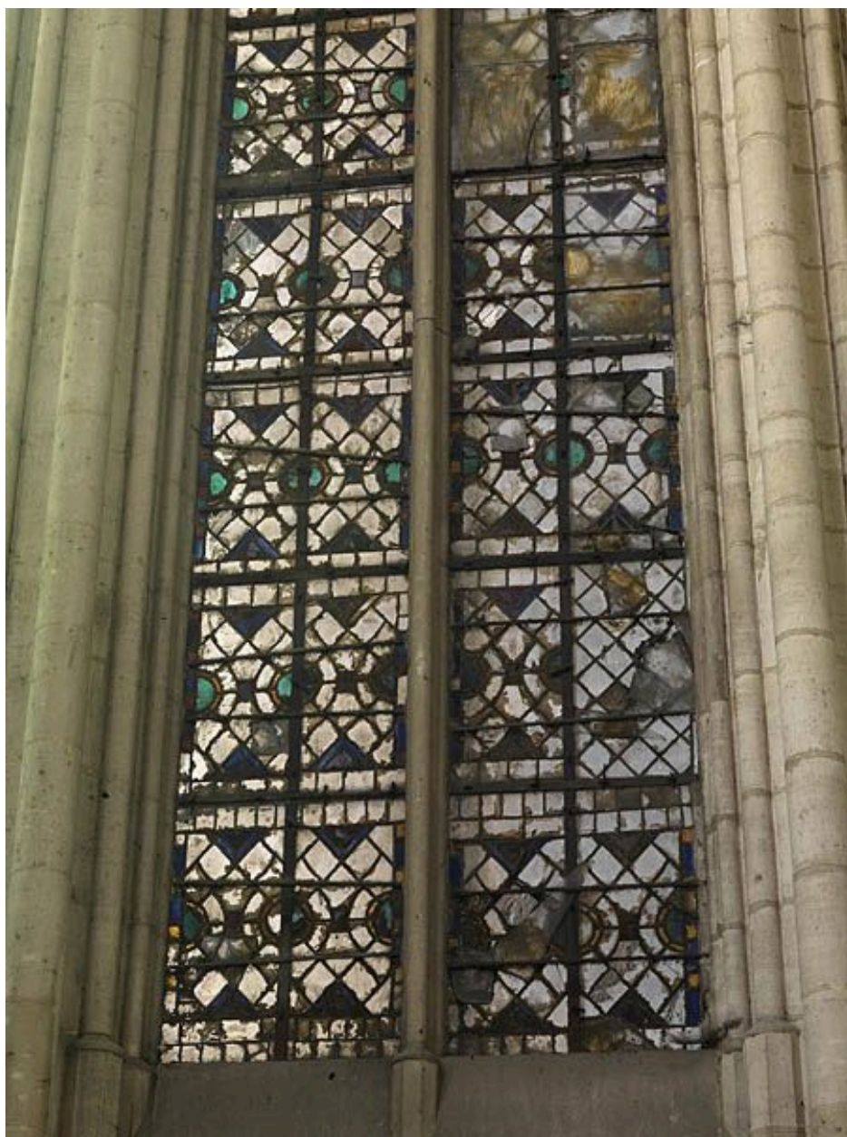
La partie basse de la verrière de la baie 24.