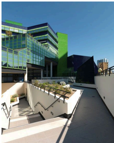
Vue d'une des façade du bâtiment avec un espace de circulation conduisant vers la rue de la Préfecture. En arrière plan, la tour des Cerclades.