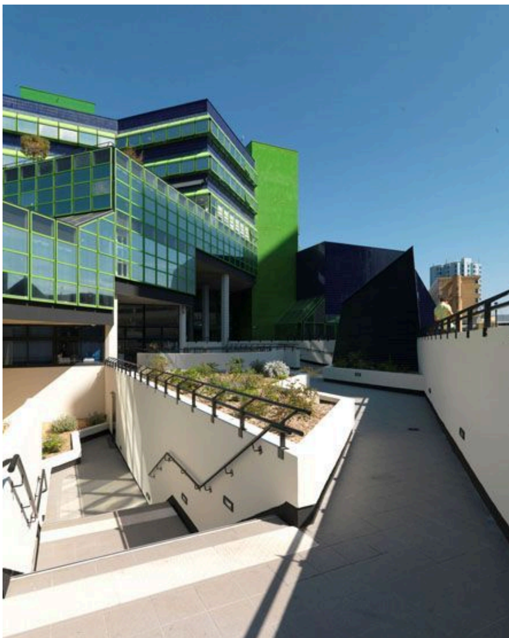
Vue d'une des façade du bâtiment avec un espace de circulation conduisant vers la rue de la Préfecture. En arrière plan, la tour des Cerclades.