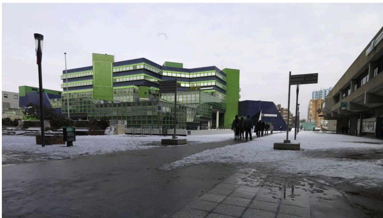
Vue d'ensemble depuis le parvis de la Préfecture.