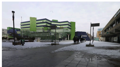
Vue d'ensemble depuis le parvis de la Préfecture. IVR11_20129500040NUC4A