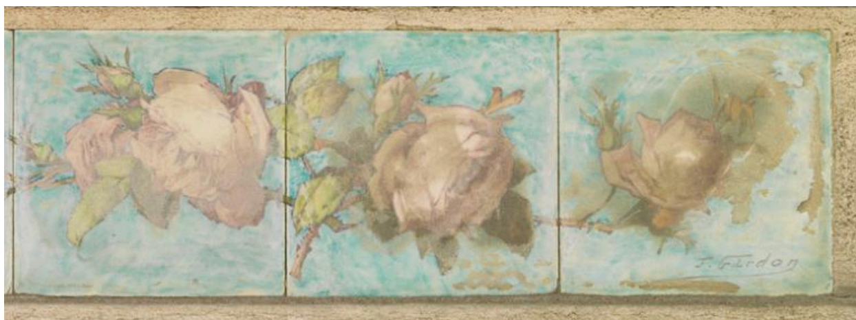
Détail d'un linteau en céramique, signé par le peintre Gardon qui a occupé cette maison.