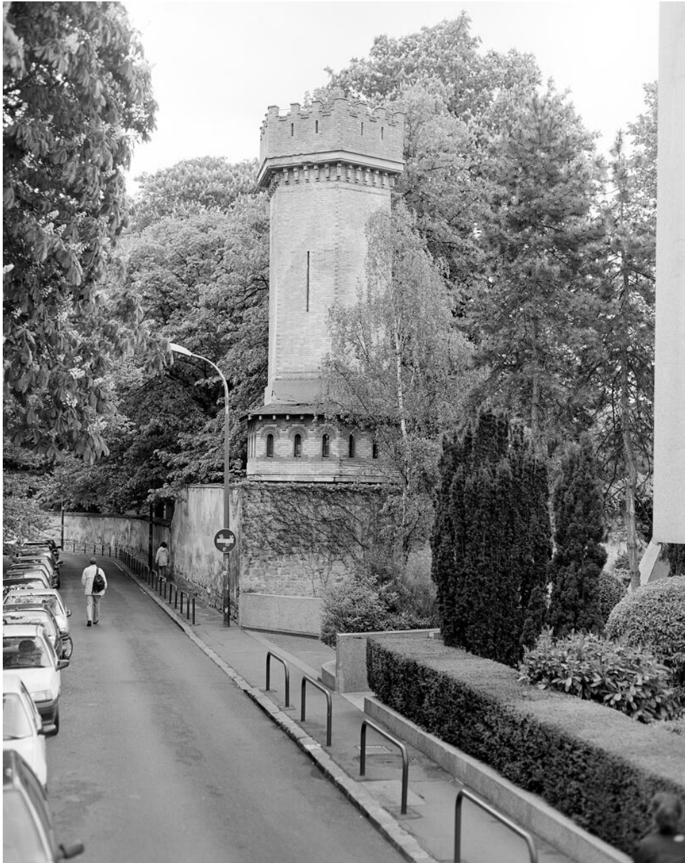
Tour d'eau de l'ancien Castel Gamio conservée par le docteur Debat dans le jardin de la villa des Tourneroches