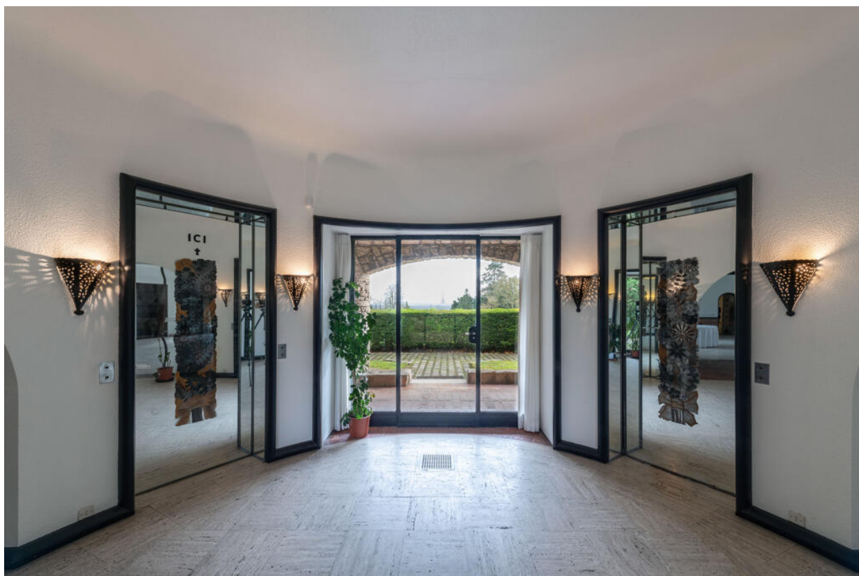
Villa des Tourneroches, hall d'entrée, baie vitrée donnant vue sur Paris accostée par deux portes à miroirs églomisés