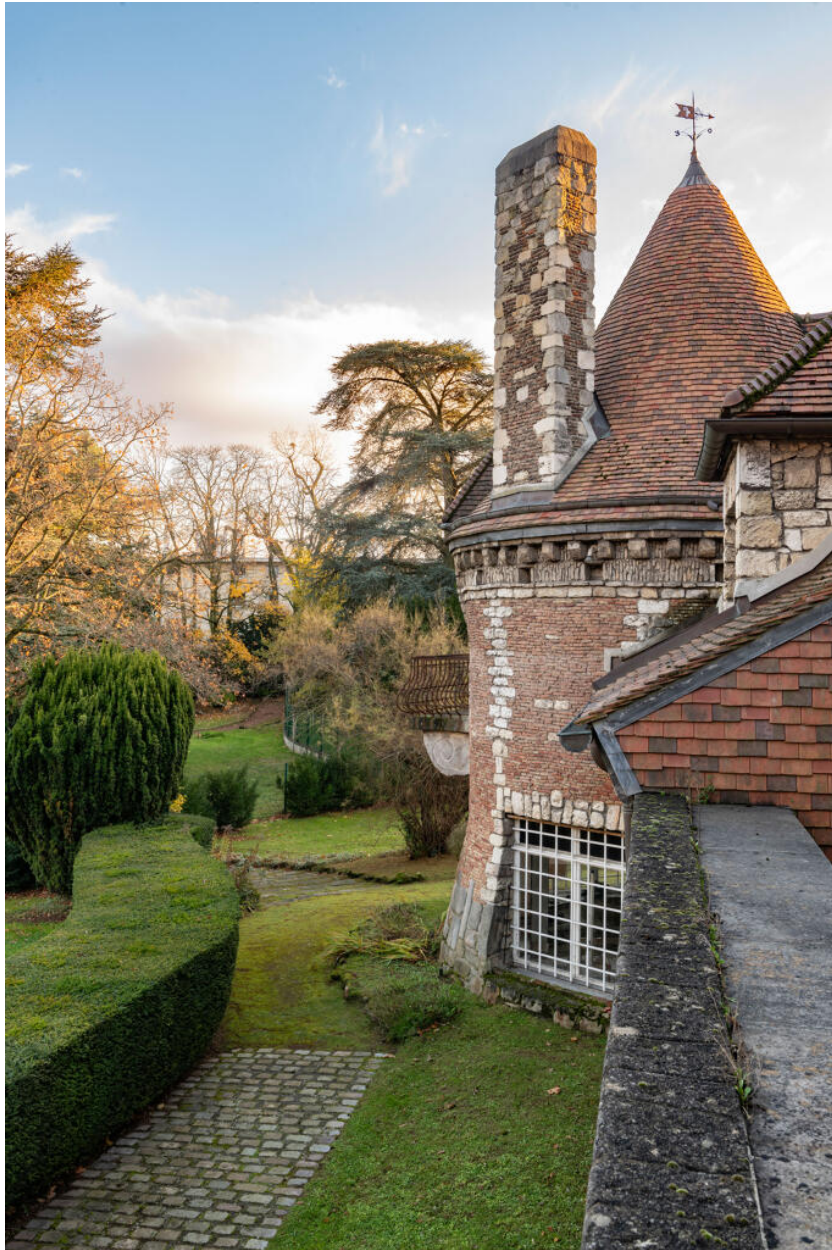
Villa des Tourneroches, tour sud-est