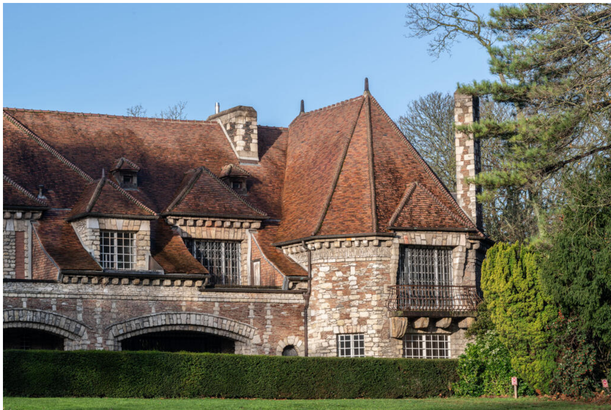
Villa des Tourneroches, vue de la façade orientale