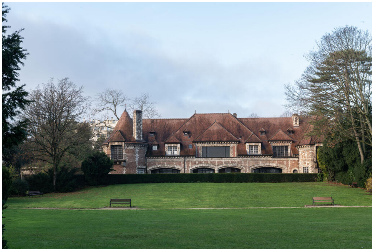
Villa des Tourneroches. Architecte : Henri Jaquelin