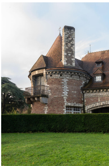
Villa des Tourneroches, tour sud-est IVR11_20249201009NUC4A