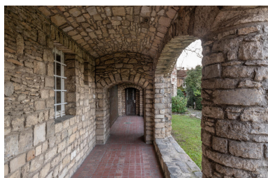
Villa des Tourneroches, galerie couverte au rez-de- chaussée de la façade orientale IVR11_20249201007NUC4A