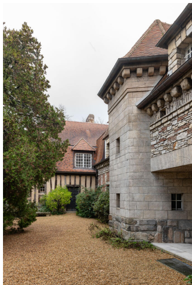
Villa des Tourneroches façade ouest et aile nord-ouest IVR11_20249201024NUC4A