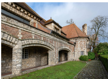
Villa des Tourneroches, galerie couverte au rez-de- chaussée de la façade orientale IVR11_20249201006NUC4A