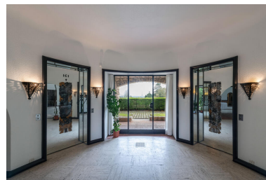
Villa des Tourneroches, hall d'entrée, baie vitrée donnant vue sur Paris accostée par deux portes à miroirs églomisés