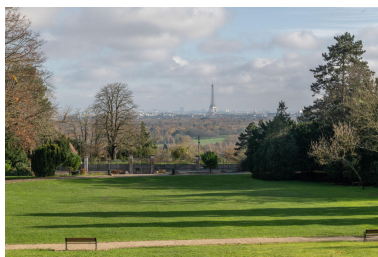
Jardin des Tourneroches, vue sur Paris IVR11_20249201002NUC4A