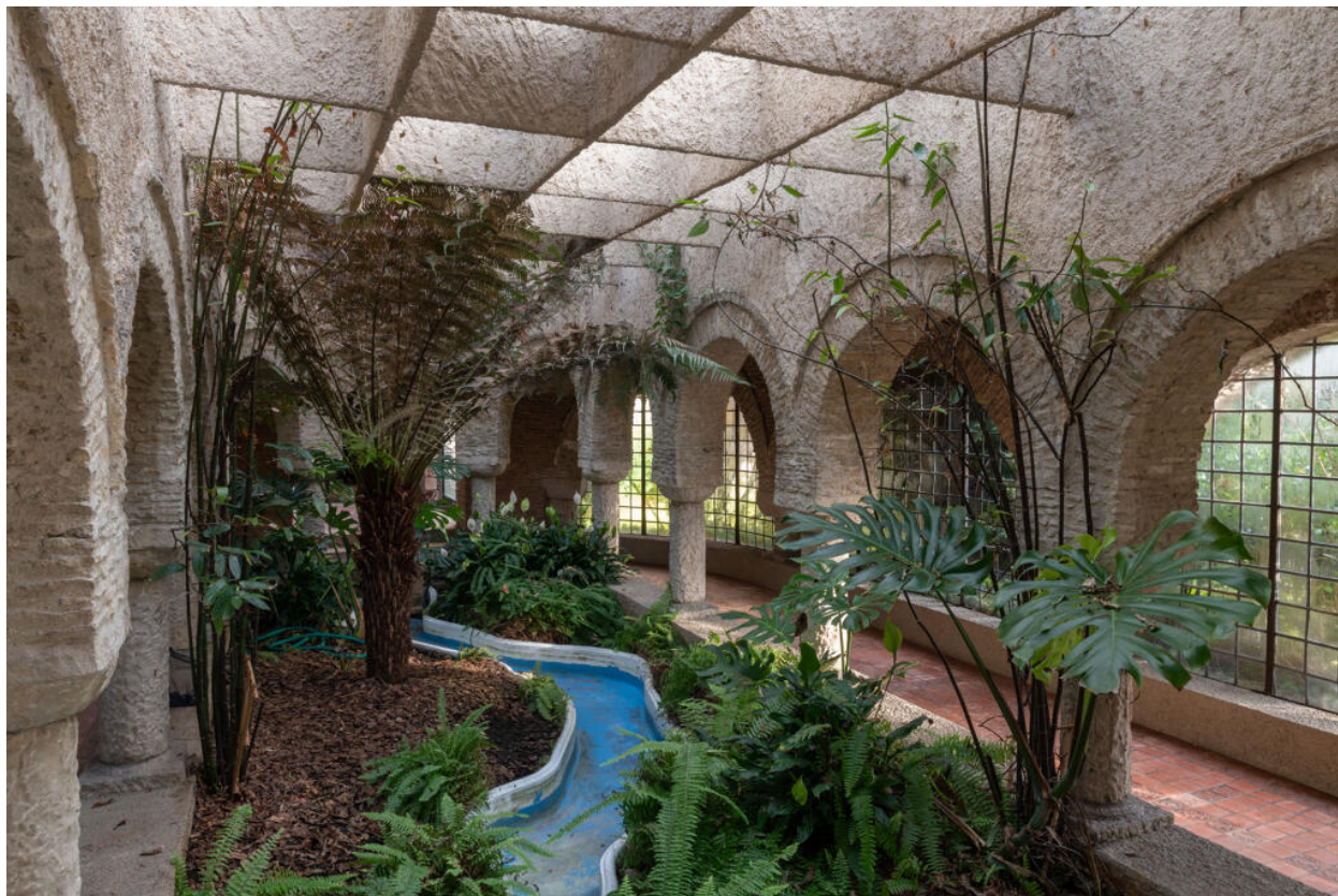
Villa des Tourneroches, jardin d'hiver