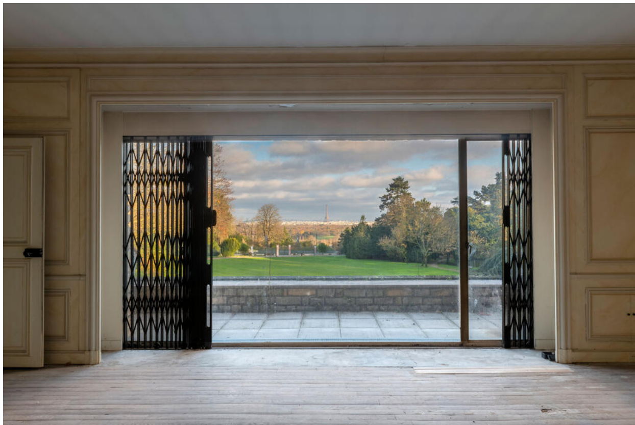
Villa des Tourneroches, vue sur le jardin et sur Paris depuis la chambre principale