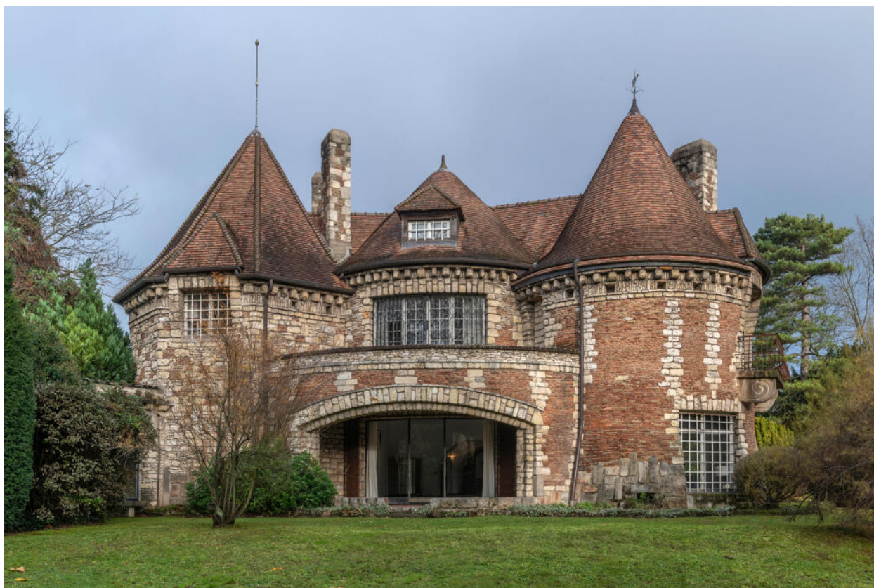
Villa des Tourneroches, façade sud