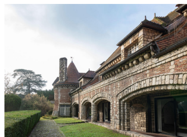
Villa des Tourneroches, galerie couverte au rez-de- chaussée de la façade orientale IVR11_20249201008NUC4A