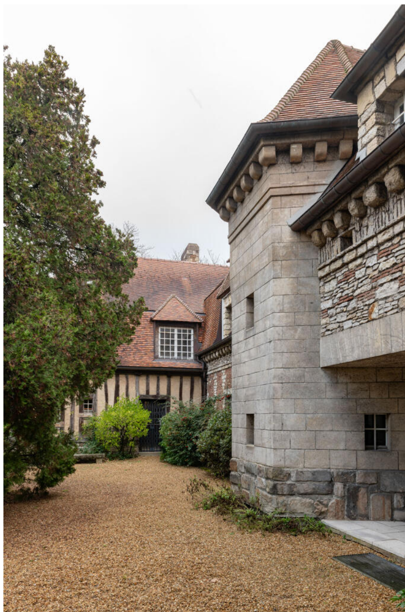
Villa des Tourneroches façade ouest et aile nord-ouest