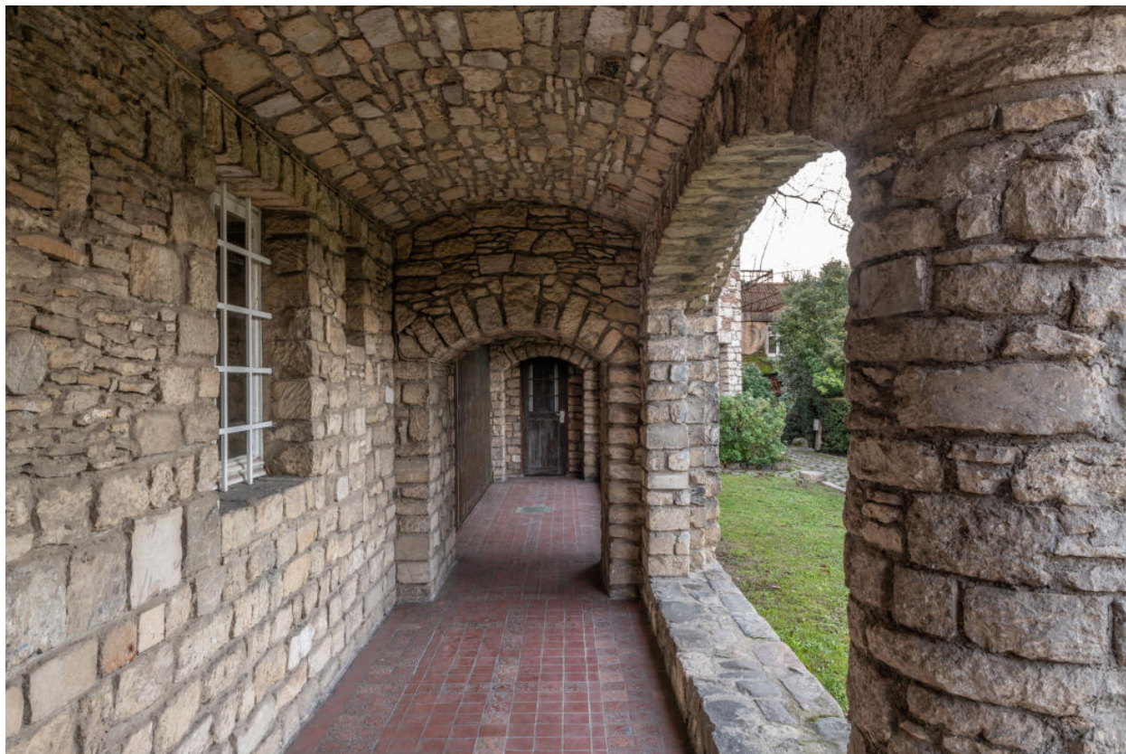
Villa des Tourneroches, galerie couverte au rez-de-chaussée de la façade orientale