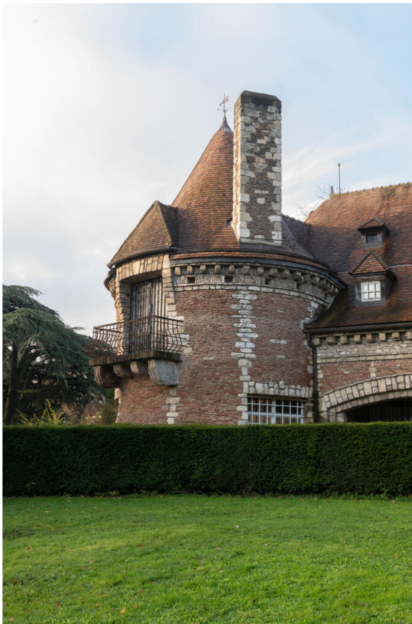
Villa des Tourneroches, tour sud-est