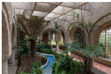
Villa des Tourneroches, jardin d'hiver IVR11_20249201050NUC4A