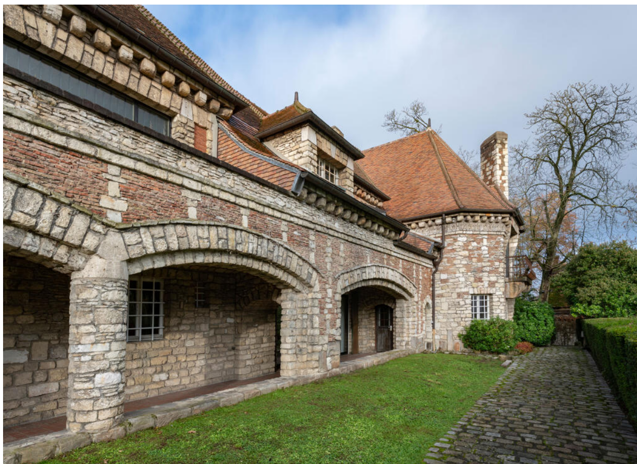
Villa des Tourneroches, galerie couverte au rez-de-chaussée de la façade orientale