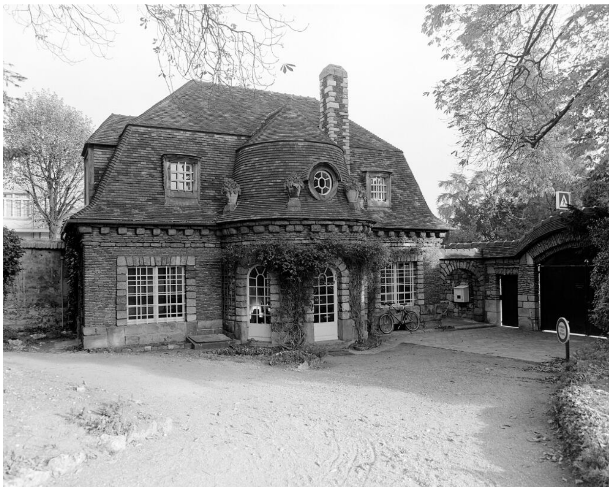
Villa des Tourneroches, maison de gardien.