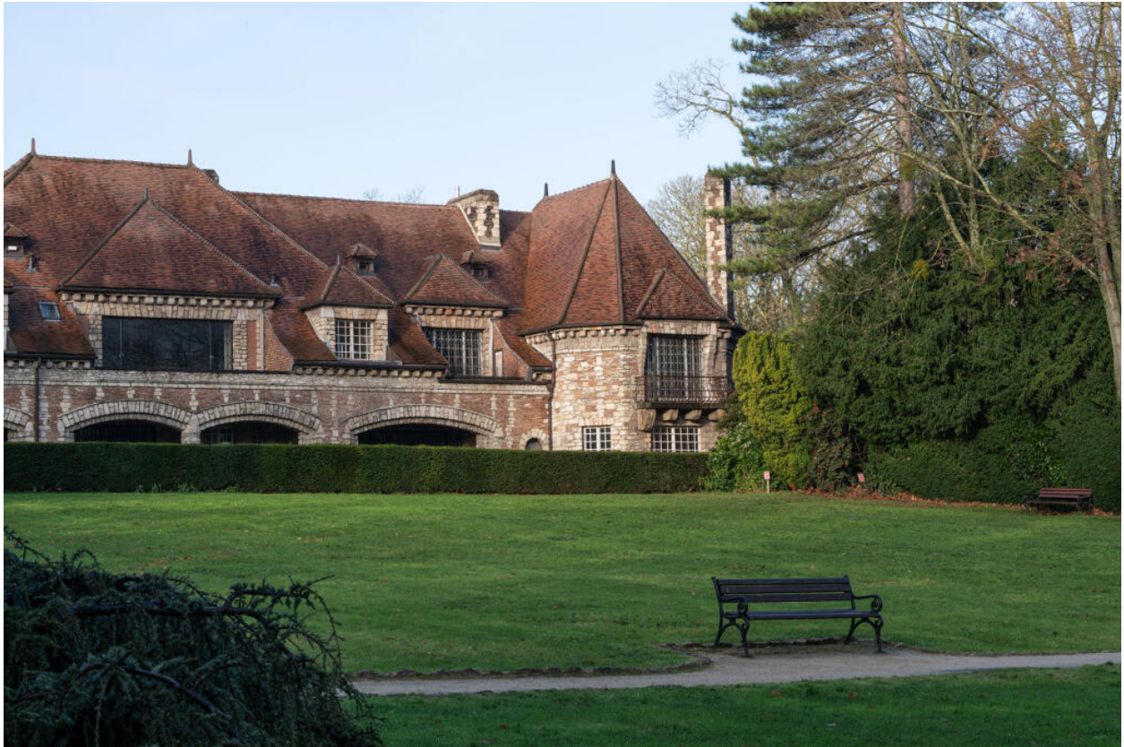
Villa des Tourneroches, vue de la façade orientale