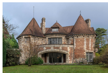
Villa des Tourneroches, façade sud IVR11_20249201020NUC4A