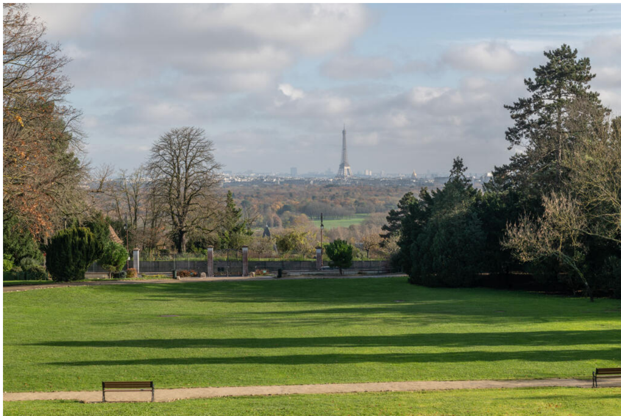
Jardin des Tourneroches, vue sur Paris