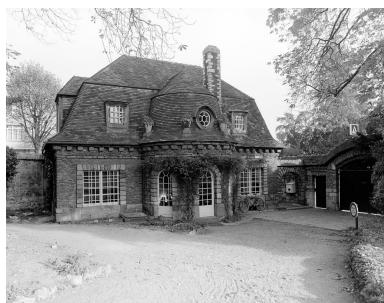
Villa des Tourneroches, maison de gardien. IVR11_19969201029X