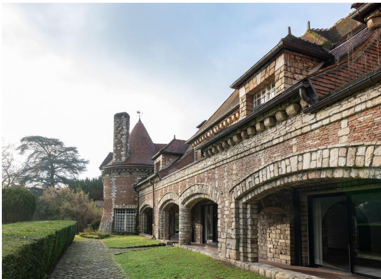
Villa des Tourneroches, galerie couverte au rez-de-chaussée de la façade orientale