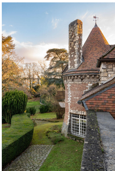
Villa des Tourneroches, tour sud-est IVR11_20249201010NUC4A