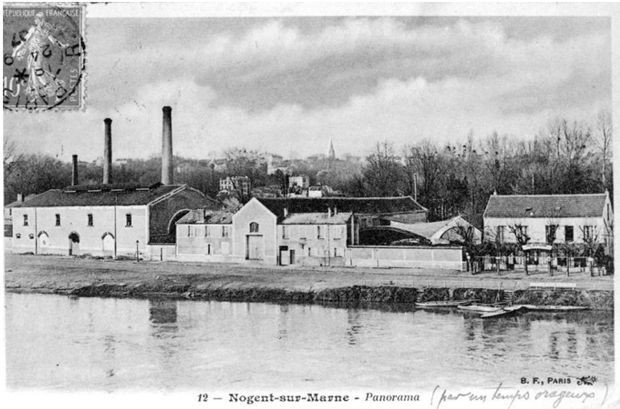
Vue d'ensemble. Carte postale.