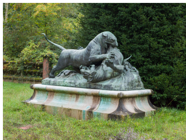
Vue de trois quarts IVR11_20237800356NUC4A