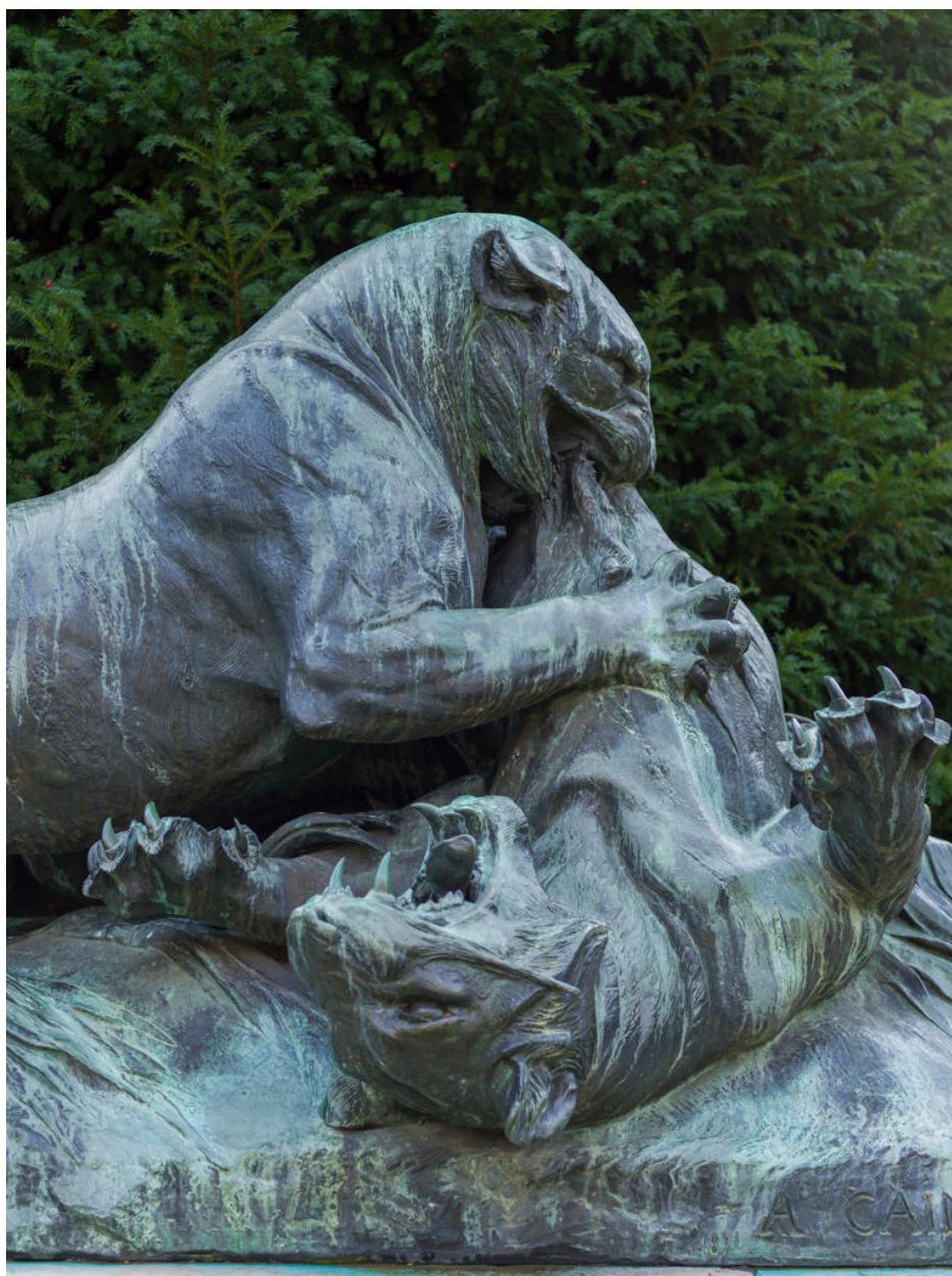
Détail des tigres