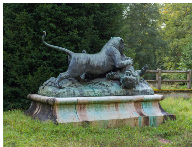
Vue de trois-quarts arrière IVR11_20237800357NUC4A