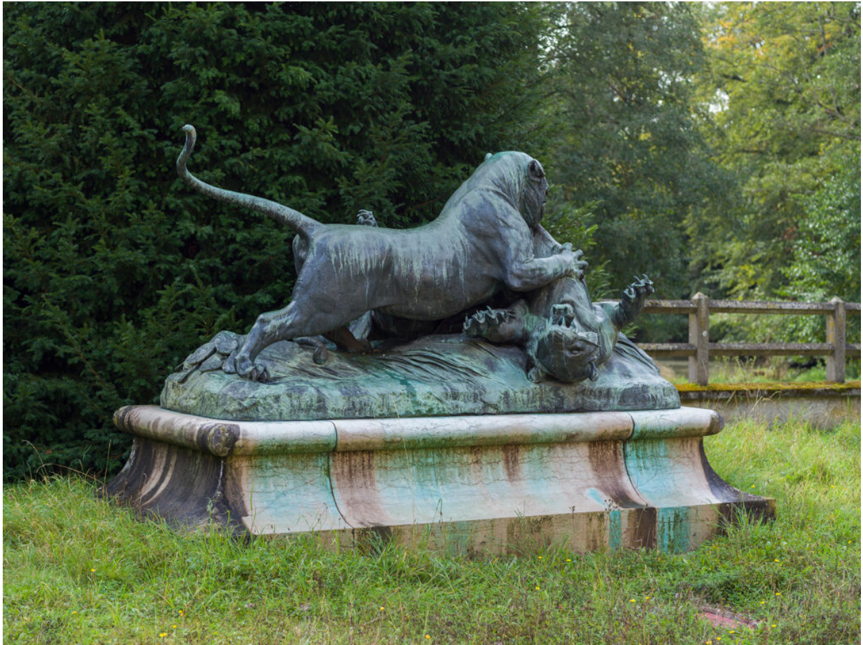
Vue de trois-quarts arrière