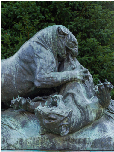
Détail des tigres IVR11_20237800359NUC4A