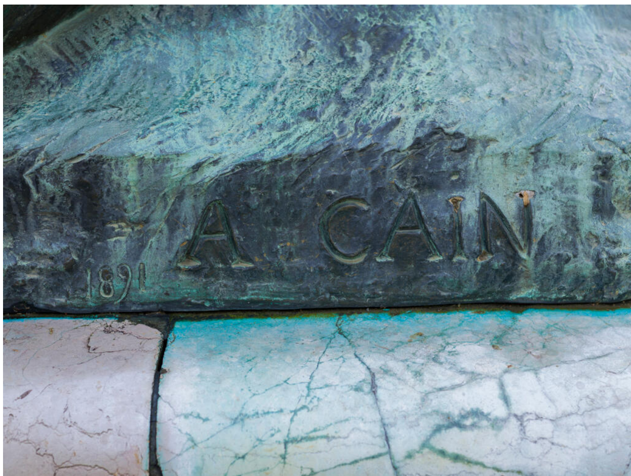
Détail de la signature