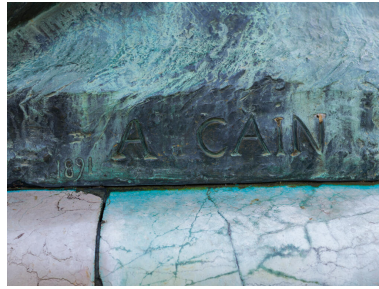
Détail de la signature IVR11_20237800360NUC4A