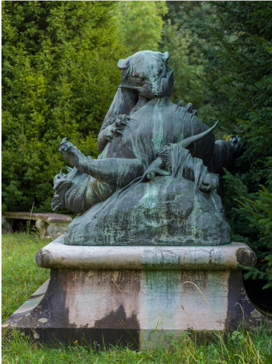
Vue de face. La tête du buffle convoitée est visible sur la droite.