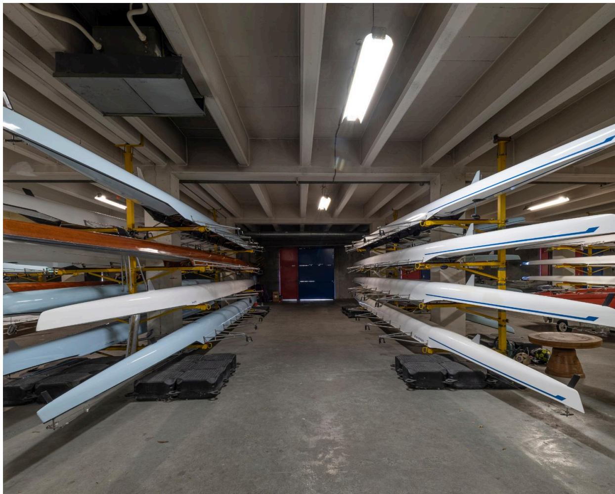
Vue générale du hangar à bateaux situé au sous-sol.