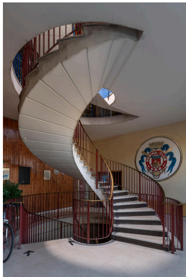
Le hall d'accueil du Rowing-Club et l'escalier hélicoïdal conduisant aux bureaux et au bar situés à l'étage.

IVR11_20219300725NUC4A