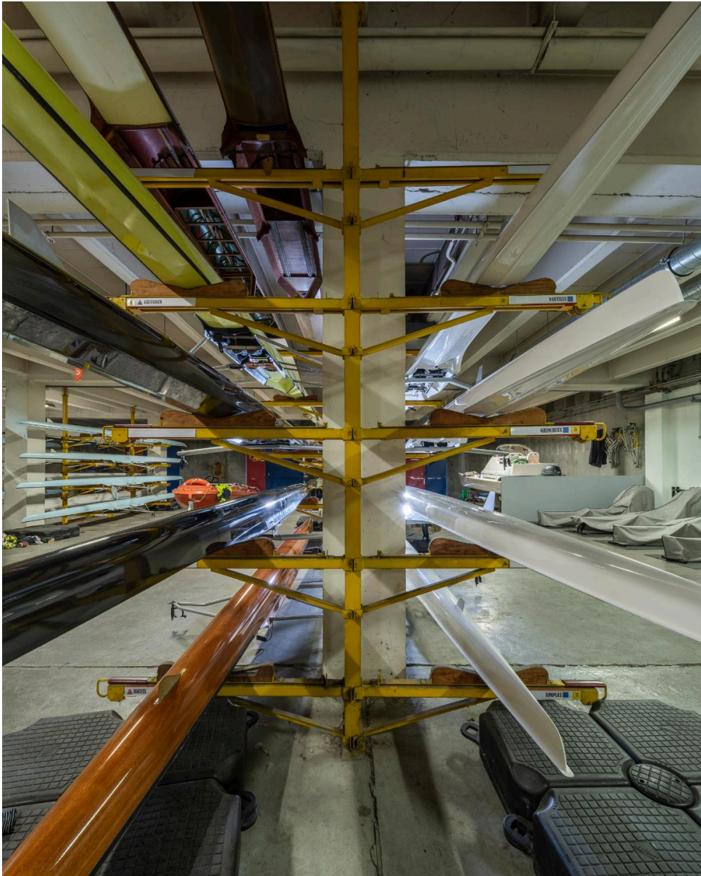
Le hangar à bateaux situé au sous-sol.