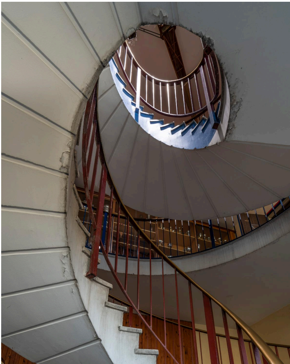
Détail de l'escalier hélicoïdal conduisant à l'étage.