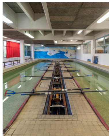
Détail du tank à ramer à huit places.

IVR11_20219300730NUC4A