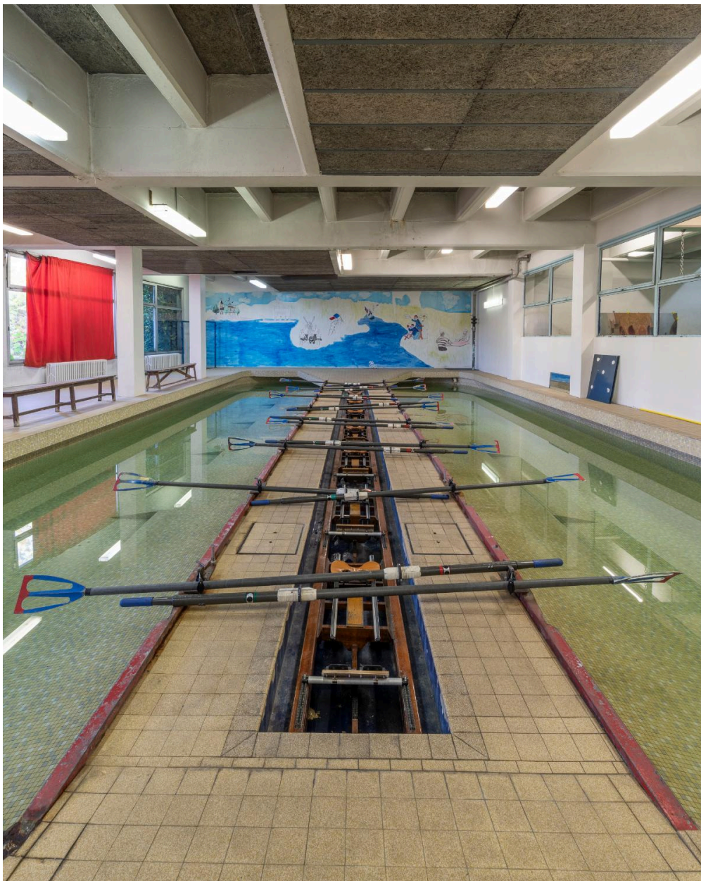
Détail du tank à ramer à huit places.