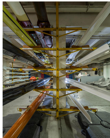
Le hangar à bateaux situé au sous-sol.

Phot. Philippe Ayrault IVR11_20219300726NUC4A