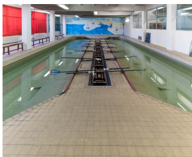
Le tank à ramer situé au-sous-sol. Comportant huit places, il est le premier de ce type à avoir été construit à même un bâtiment. Il permet de s'entraîner en toute saison.

IVR11_20219300728NUC4A