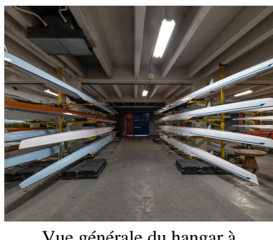
Vue générale du hangar à bateaux situé au sous-sol.

IVR11_20219300727NUC4A