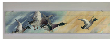
Vue de l'un des deux panneaux représentant des vols d'oiseaux : canards.