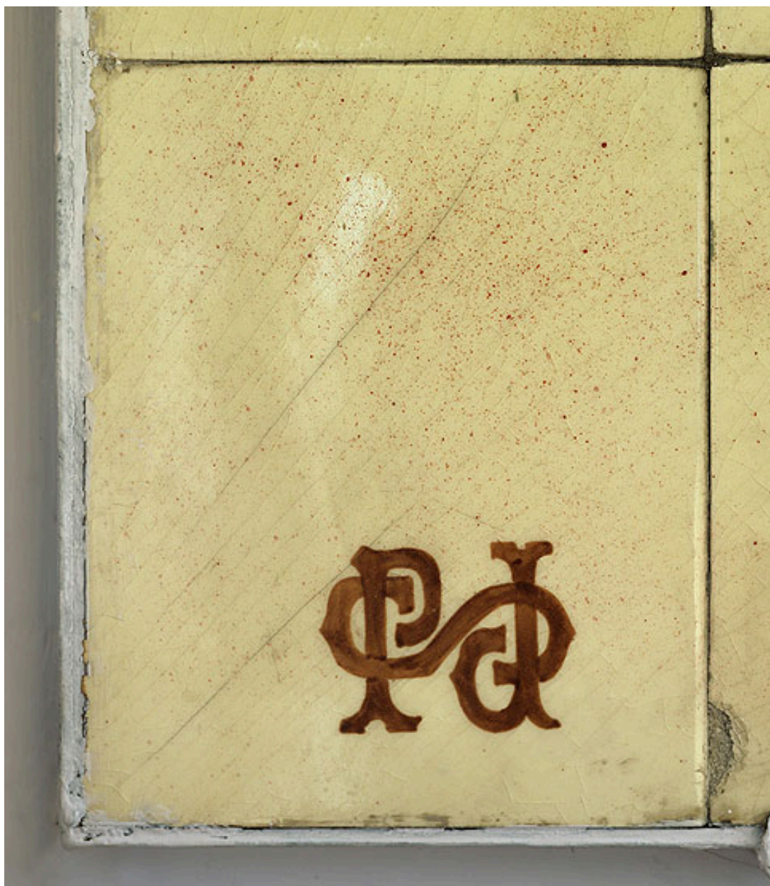
Détail de la marque de la faïencerie de Sarreguemines à l'angle inférieur gauche du panneau de la danseuse au tutu jaune.