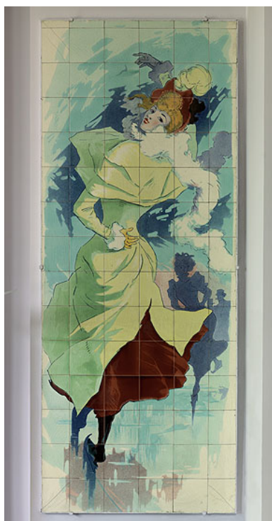
Vue de l'un des quatre panneaux exécutés par la faïencerie de Sarreguemines d'après des dessins de l'affichiste Jules Chéret, fin du XIXe siècle-début XXe siècle. Patineuse au manteau jaune. Autr. Jules (dessinateur) Chéret, Autr. Faïencerie de Sarreguemines (entreprise) IVR11_20089500224NUC4A