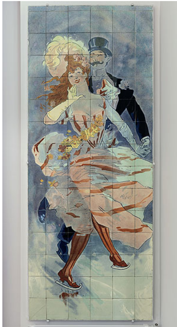
Vue de l'un des quatre panneaux exécutés par la faïencerie de Sarreguemines d'après des dessins de l'affichiste Jules Chéret, fin du XIXe siècle-début XXe siècle. Couple de patineurs.