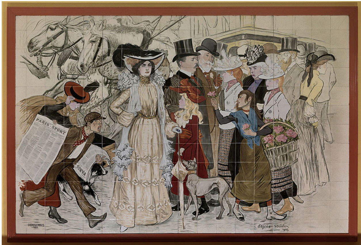
Vue du panneau ""Le Boulevard"", 1902, exécuté par la faïencerie de Sarreguemines d'après une oeuvre de Théophile Alexandre Steinlen.