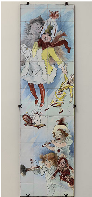
Vue d'ensemble du panneau représentant une fillette et des jouets. IVR11_20089500238NUC4A