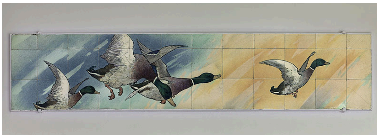
Vue de l'un des deux panneaux représentant des vols d'oiseaux : canards.