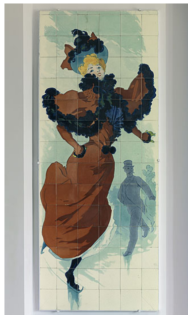
Vue de l'un des quatre panneaux exécutés par la faïencerie de Sarreguemines d'après des dessins de l'affichiste Jules Chéret, fin du XIXe siècle-début XXe siècle. Patineuse au manteau rouge. Autr. Jules (dessinateur) Chéret, Autr. Faïencerie de Sarreguemines (entreprise) IVR11_20089500225NUC4A