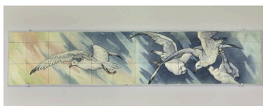
Vue de l'un des deux panneaux représentant des vols d'oiseaux : mouettes.