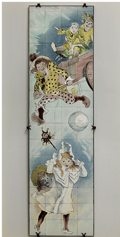
Vue d'ensemble du panneau avec une fillette et un garçonnet tirant un chariot.