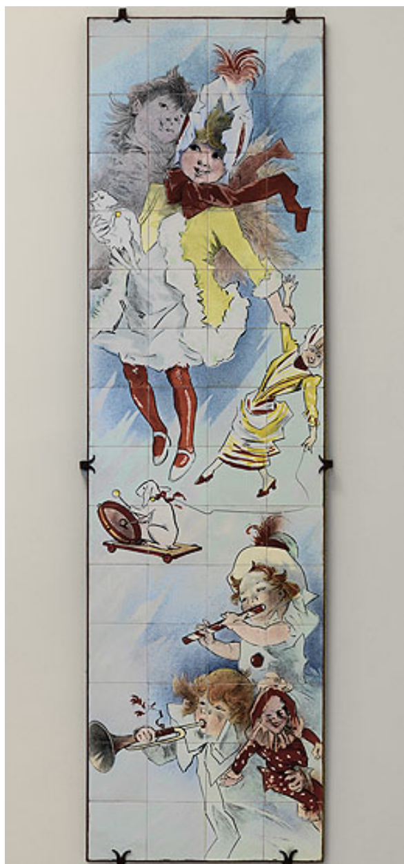
Vue d'ensemble du panneau représentant une fillette et des jouets.