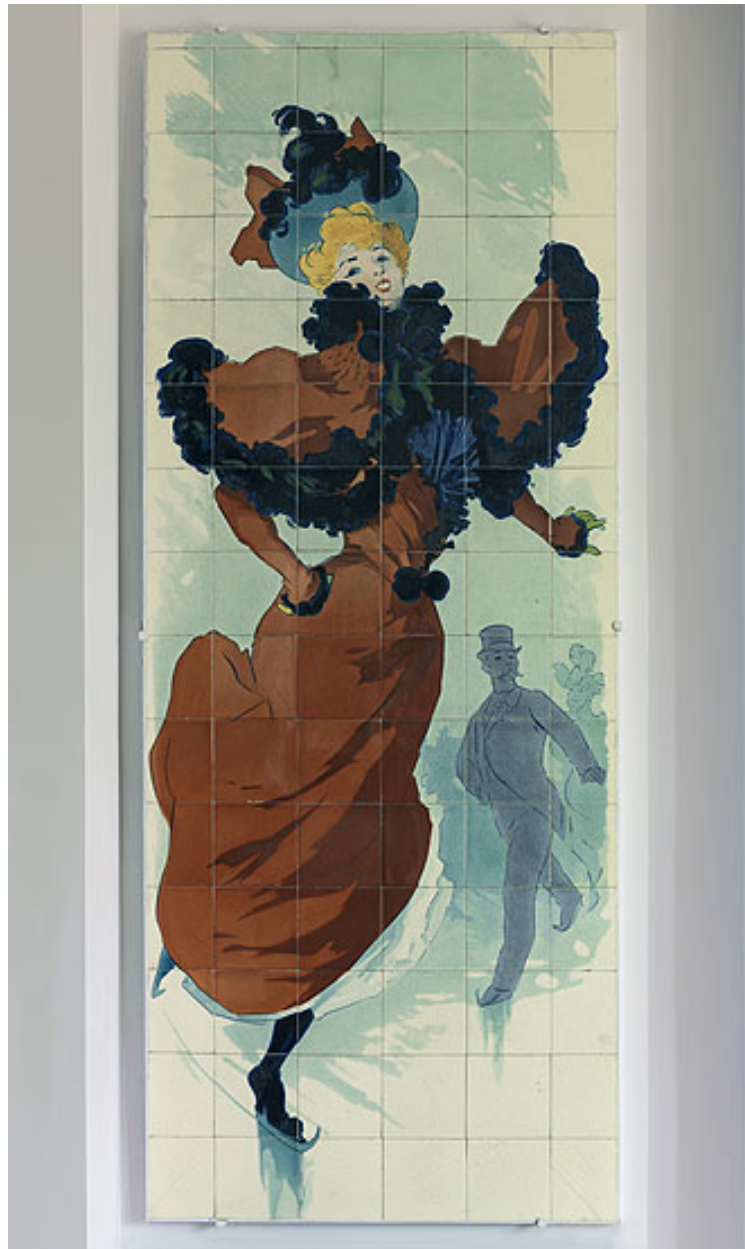
Vue de l'un des quatre panneaux exécutés par la faïencerie de Sarreguemines d'après des dessins de l'affichiste Jules Chéret, fin du XIXe siècle-début XXe siècle. Patineuse au manteau rouge.