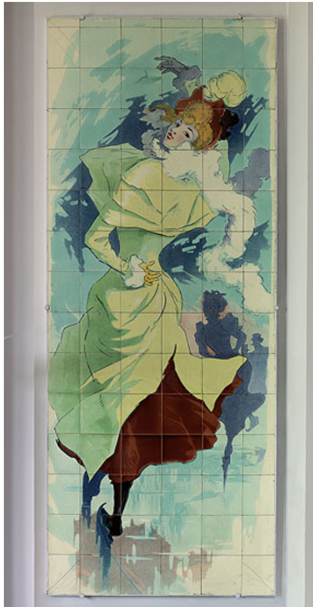
Vue de l'un des quatre panneaux exécutés par la faïencerie de Sarreguemines d'après des dessins de l'affichiste Jules Chéret, fin du XIXe siècle-début XXe siècle. Patineuse au manteau jaune.