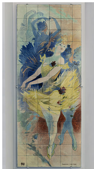
Vue de l'un des quatre panneaux exécutés par la faïencerie de Sarreguemines d'après des dessins de l'affichiste Jules Chéret, fin du XIXe siècle-début XXe siècle. Danseuse au tutu jaune. Autr. Jules (dessinateur) Chéret, Autr. Faïencerie de Sarreguemines (entreprise) IVR11_20089500227NUC4A