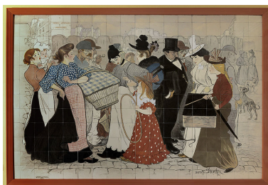
Vue du panneau ""La Rue"", 1896, exécuté par la faïencerie de Sarreguemines d'après une oeuvre de Théophile Alexandre Steinlen. Autr. Théophile Alexandre Steinlen, Autr. Faïencerie de Sarreguemines (entreprise) IVR11_20089500222NUC4A