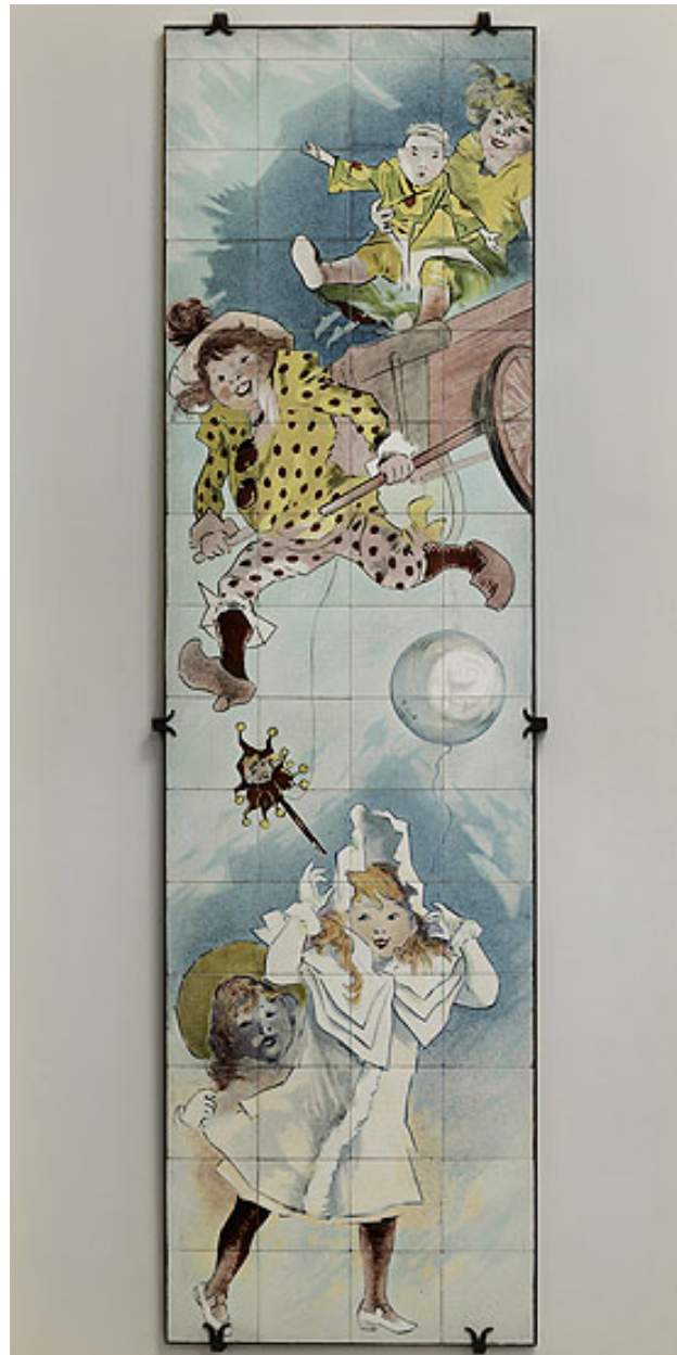
Vue d'ensemble du panneau avec une fillette et un garçonnet tirant un chariot.