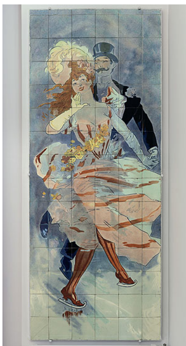
Vue de l'un des quatre panneaux exécutés par la faïencerie de Sarreguemines d'après des dessins de l'affichiste Jules Chéret, fin du XIXe siècle-début XXe siècle. Couple de patineurs. Autr. Jules (dessinateur) Chéret, Autr. Faïencerie de Sarreguemines (entreprise) IVR11_20089500226NUC4A