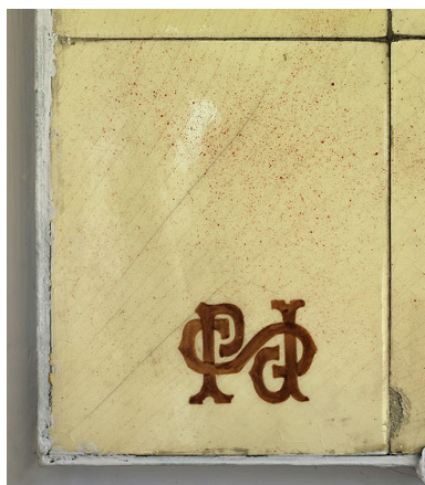
Détail de la marque de la faïencerie de Sarreguemines à l'angle inférieur gauche du panneau de la danseuse au tutu jaune.