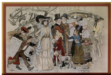
Vue du panneau ""Le Boulevard"", 1902, exécuté par la faïencerie de Sarreguemines d'après une oeuvre de Théophile Alexandre Steinlen. Autr. Théophile Alexandre Steinlen, Autr. Faïencerie de Sarreguemines (entreprise) IVR11_20089500223NUC4A