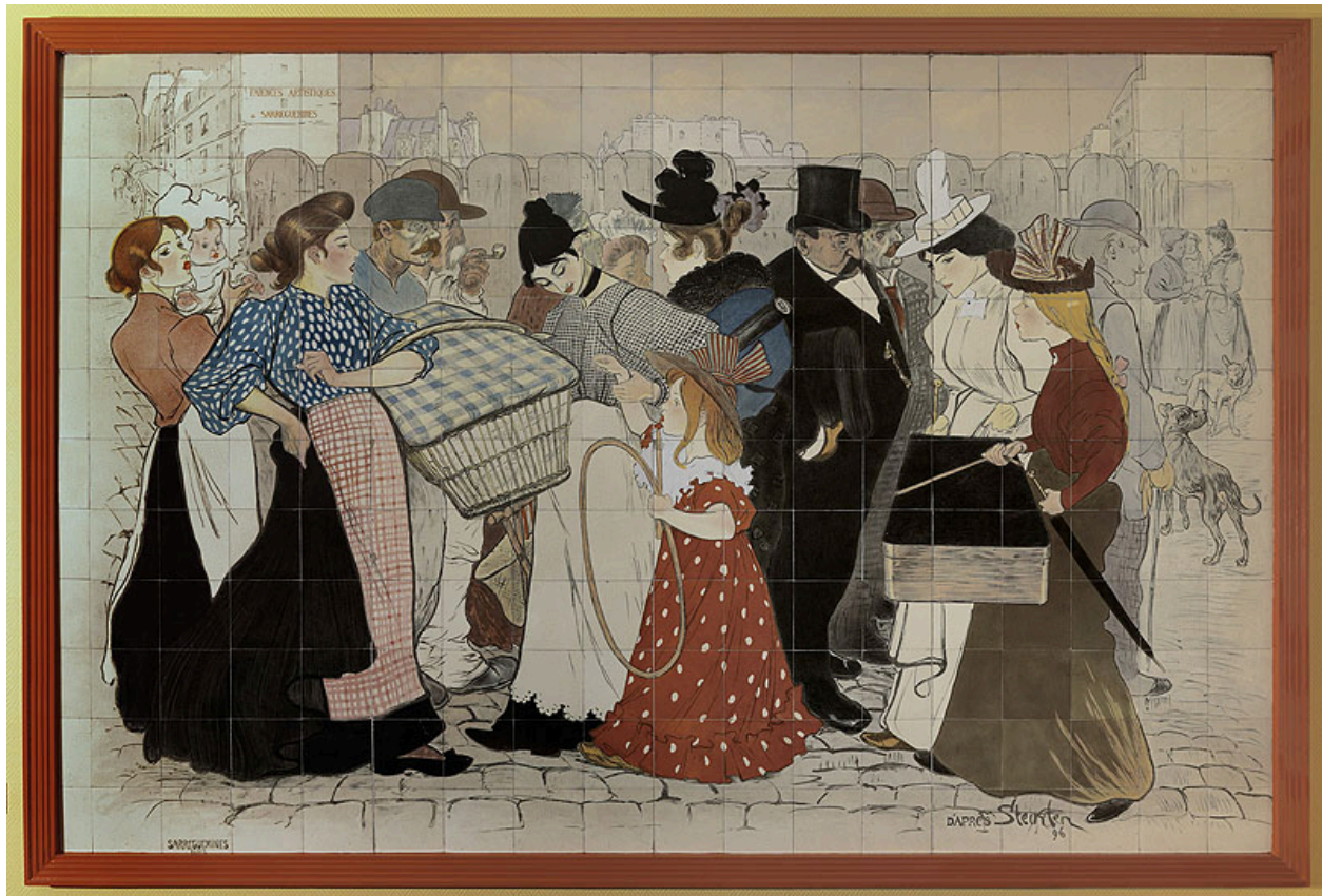
Vue du panneau ""La Rue"", 1896, exécuté par la faïencerie de Sarreguemines d'après une oeuvre de Théophile Alexandre Steinlen.