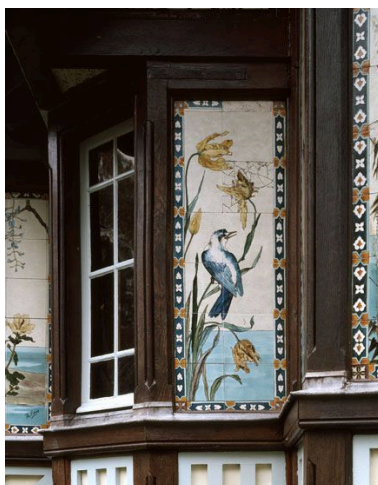
La façade nord est du pavillon chinois : détail de la céramique encadrant la grande fenêtre.