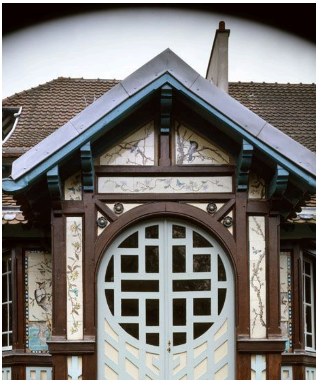
La façade orientale du pavillon chinois : détail des céramiques.