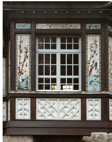
La façade nord est du pavillon chinois : détail des céramiques. IVR11_20067800778VA