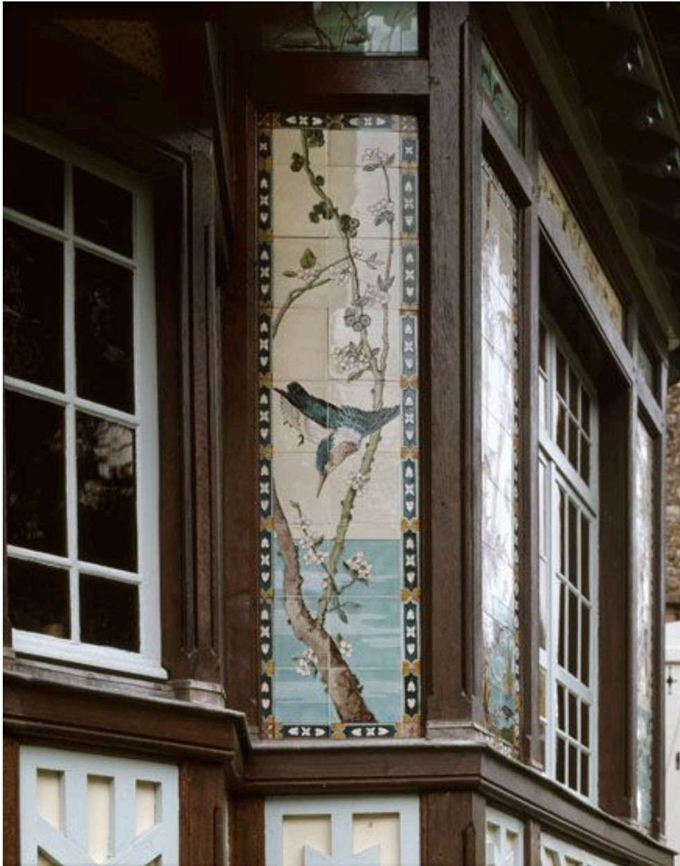
La façade nord est du pavillon chinois : détail de la céramique encadrant la petite fenêtre.