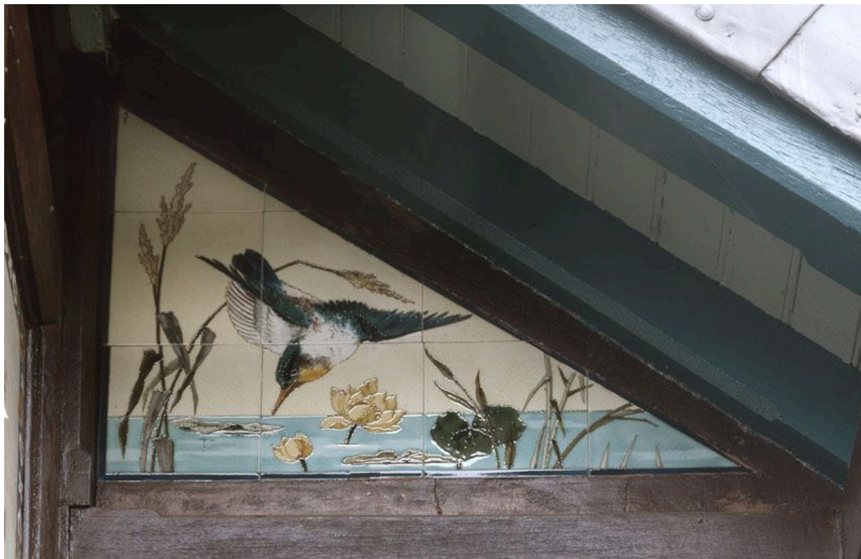
La façade nord est du pavillon chinois : détail de la céramique triangulaire.