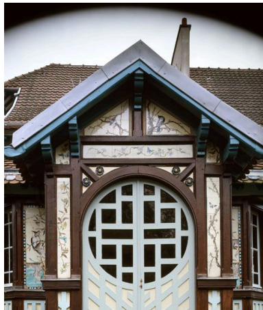
La façade orientale du pavillon chinois : détail des céramiques. IVR11_20067800774VA