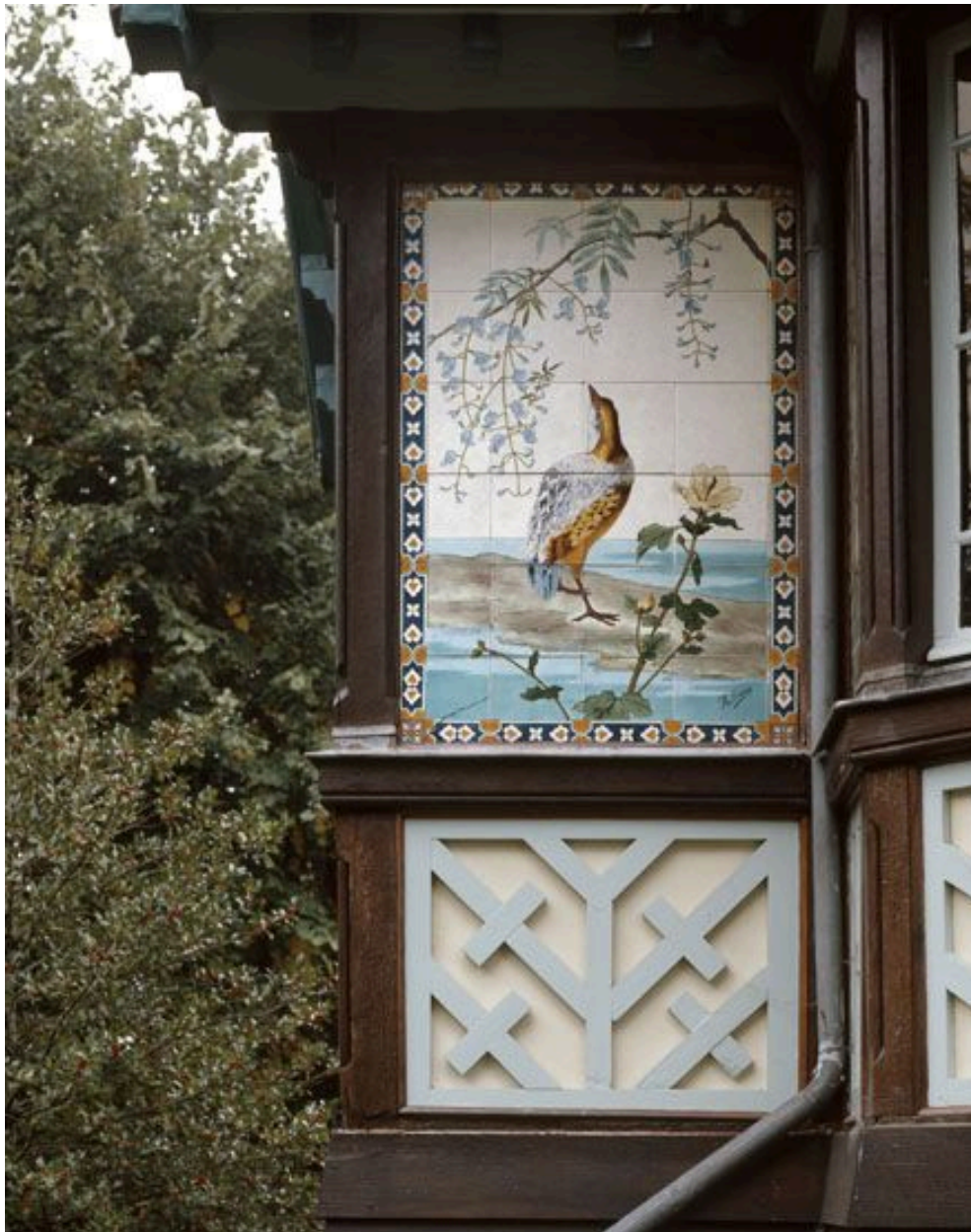
La façade nord est du pavillon chinois : détail des céramiques encadrant l'ancienne porte d'entrée.