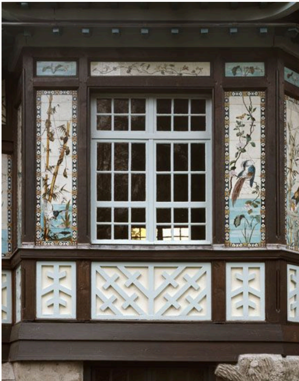
La façade nord est du pavillon chinois : détail des céramiques.