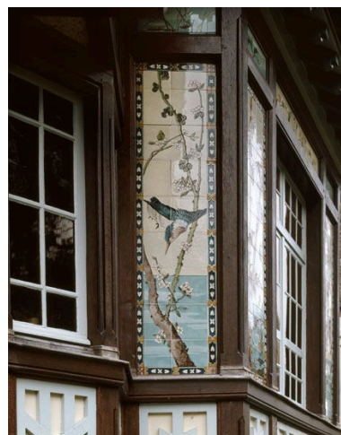
La façade nord est du pavillon chinois : détail de la céramique encadrant la petite fenêtre. IVR11_20067800784VA