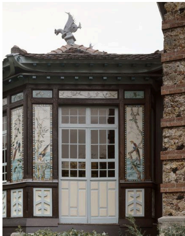
La façade nord ouest du pavillon chinois : détail des céramiques.