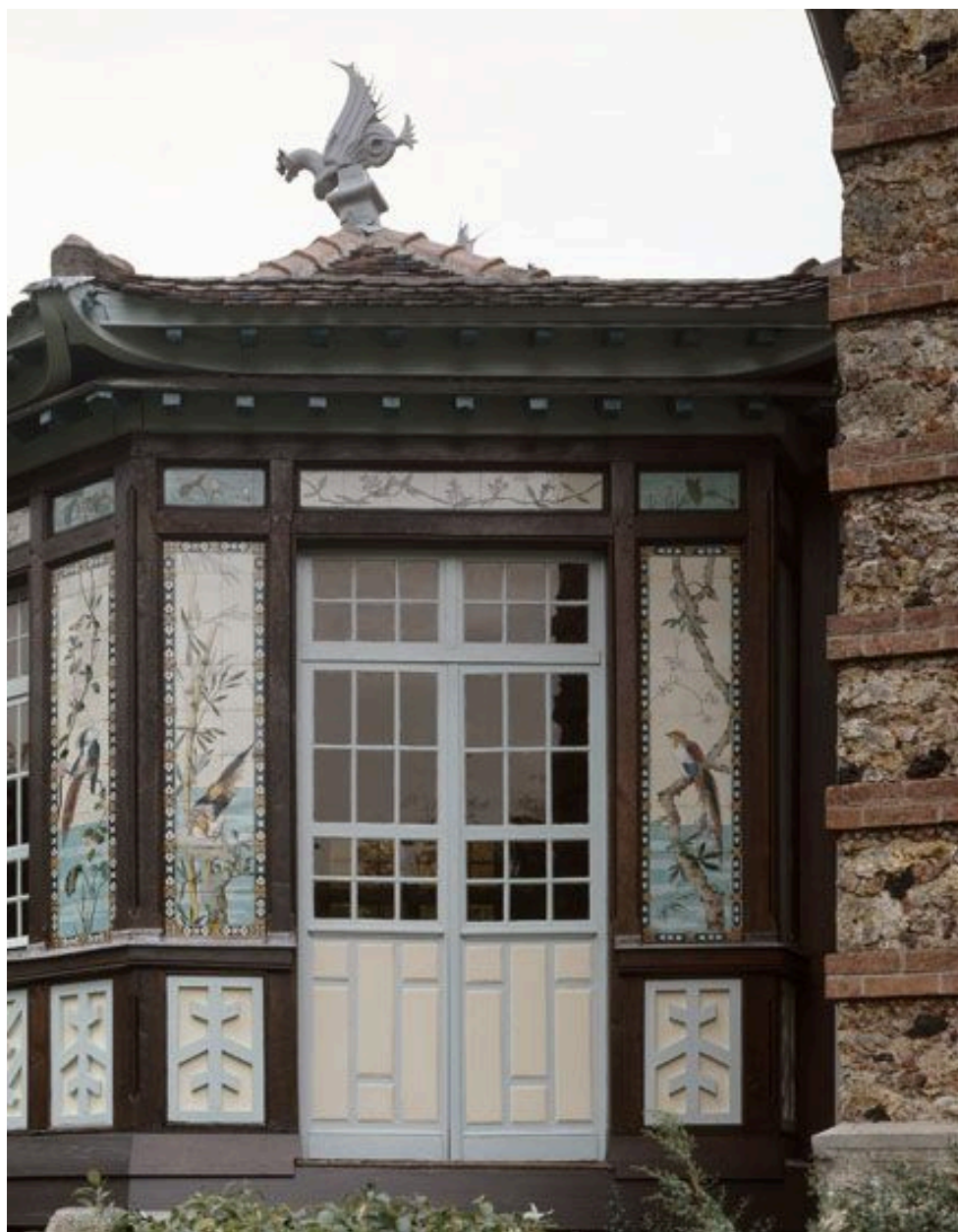
La façade nord ouest du pavillon chinois : détail des céramiques.