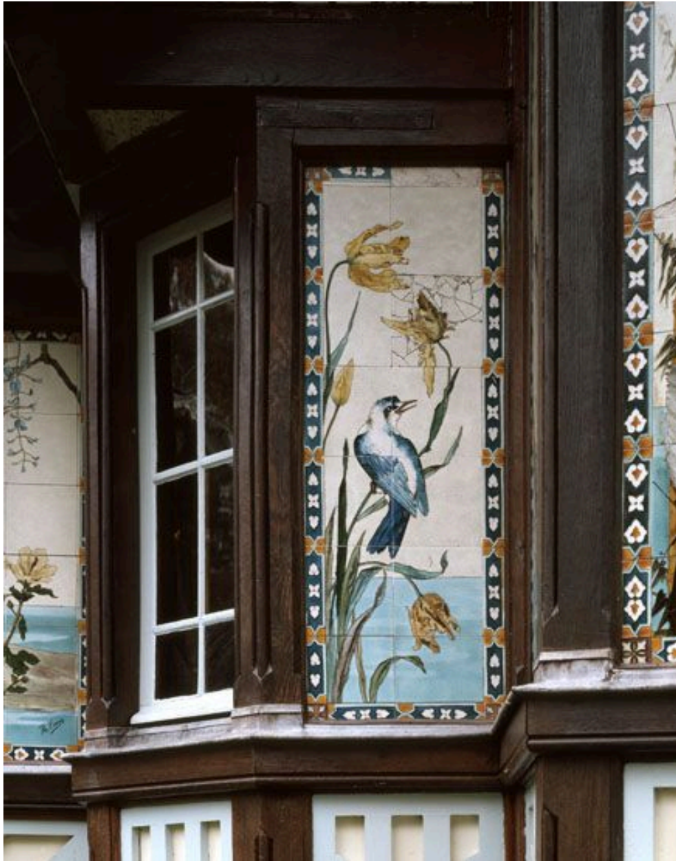
La façade nord est du pavillon chinois : détail de la céramique encadrant la grande fenêtre.