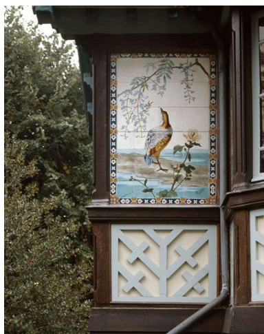
La façade nord est du pavillon chinois : détail des céramiques encadrant l'ancienne porte d'entrée. IVR11_20067800780VA