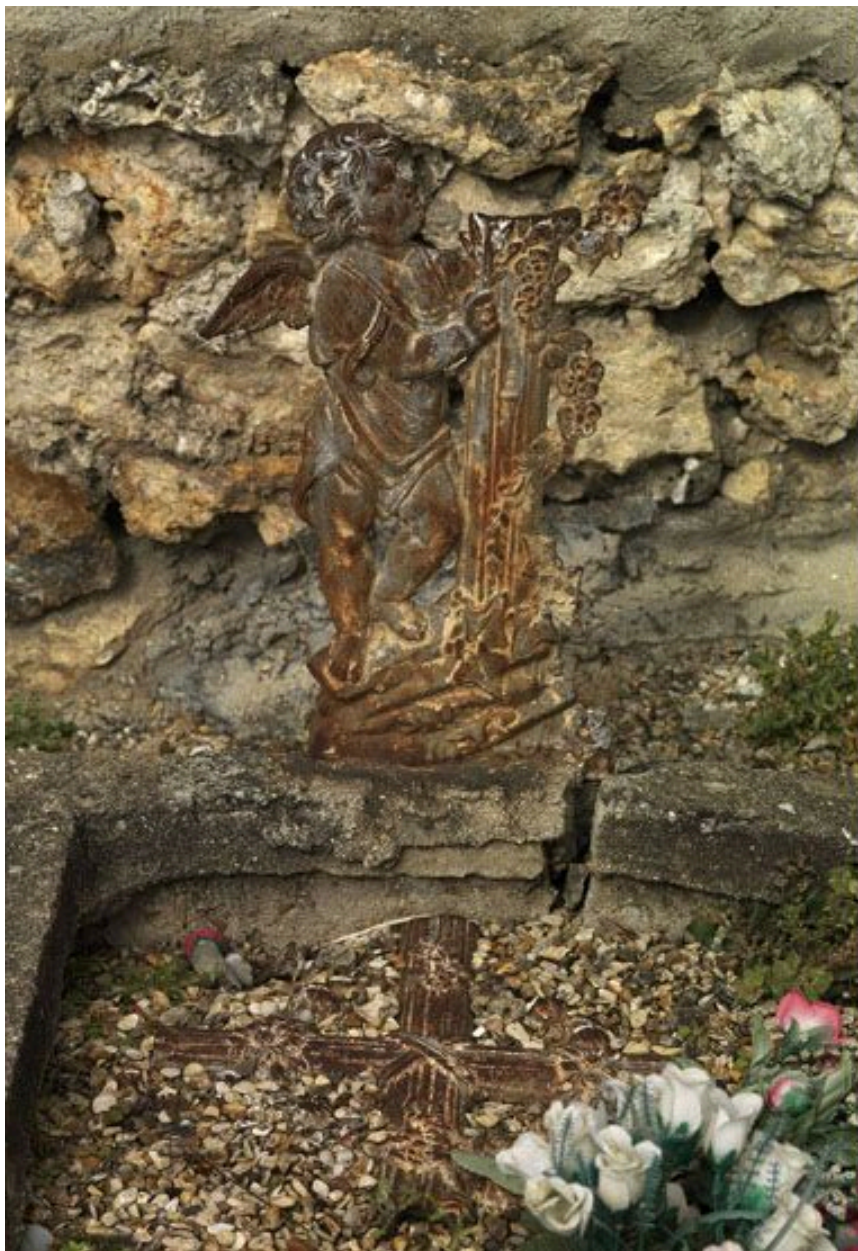
Une tombe en mauvais état.