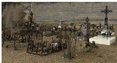
Une partie du cimetière est consacrée aux tombes d'enfants.