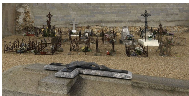
Vue d'ensemble. IVR11_20087800117NUC4A