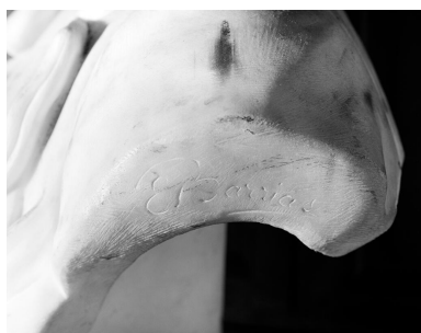
Détail de la signature de Barrias.