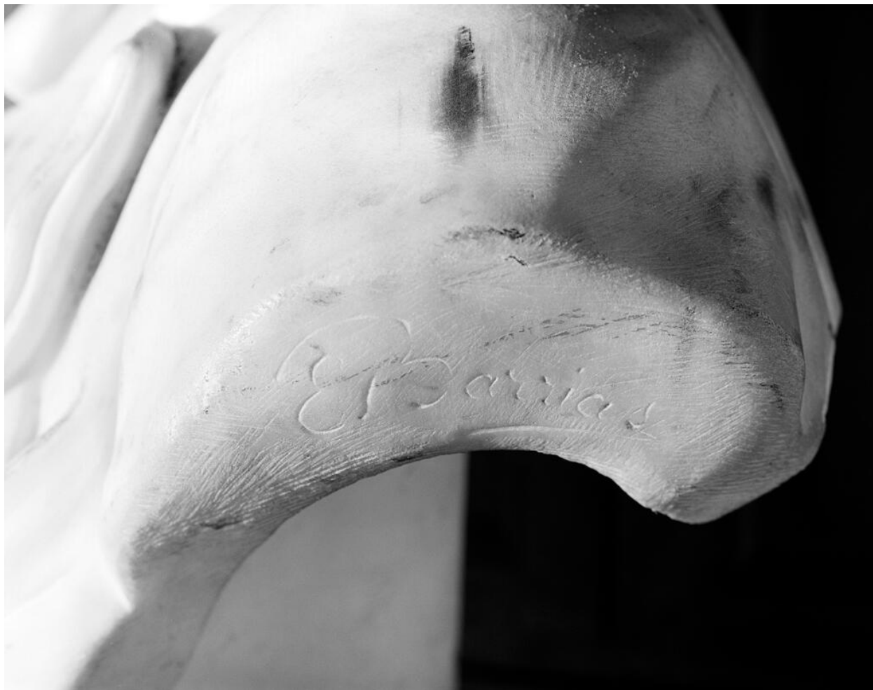
Détail de la signature de Barrias.