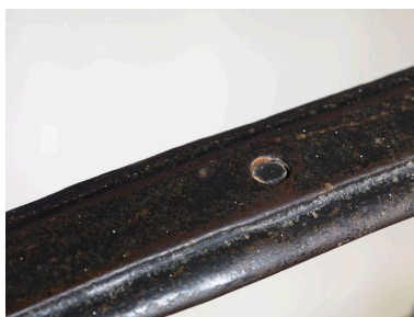
Détail du mode d'assemblage de la main courante à la plate-bande haute.