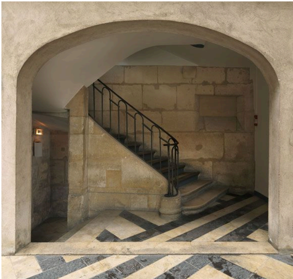
Départ ouvert de l'escalier.