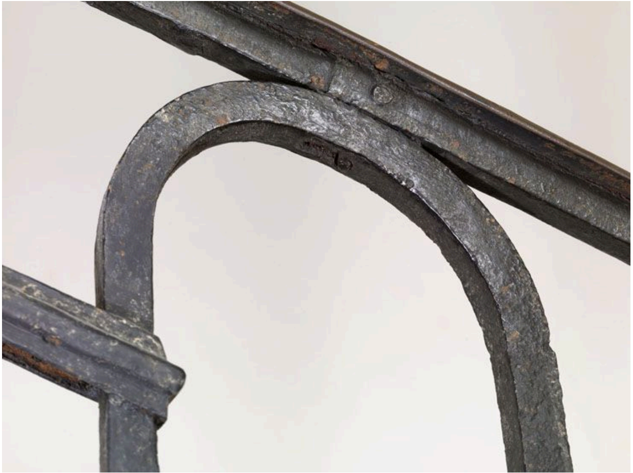
Détail du mode d'assemblage de l'arcade ainsi que des barres formant la plate-bande haute.