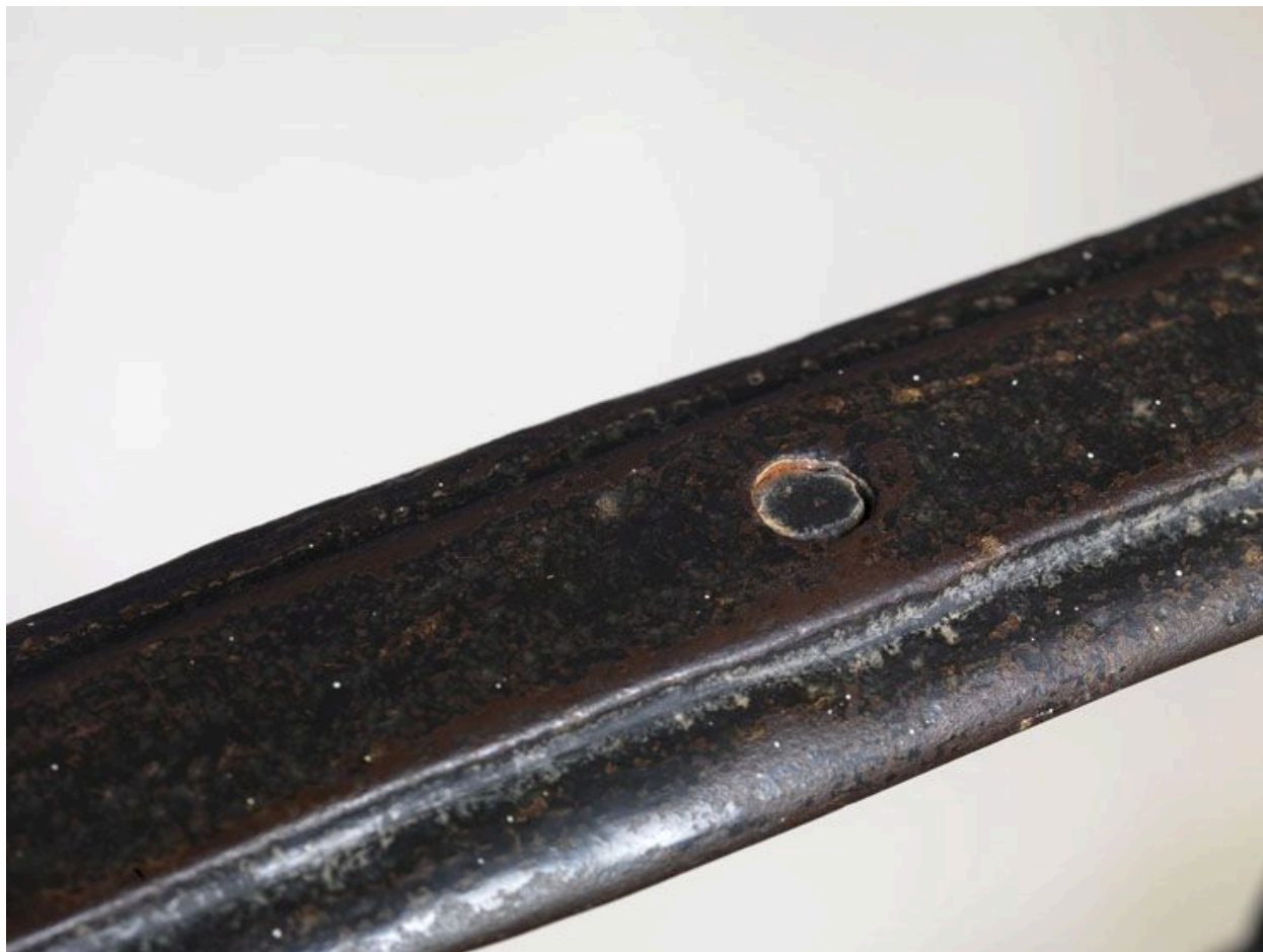
Détail du mode d'assemblage de la main courante à la plate-bande haute.