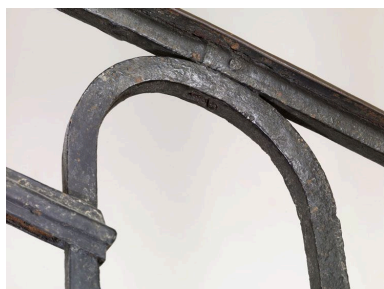
Détail du mode d'assemblage de l'arcade ainsi que des barres formant la plate-bande haute.