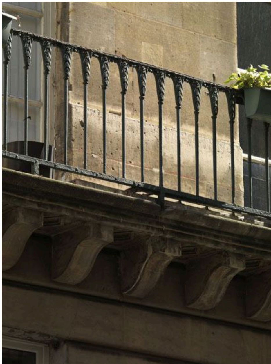
Détail du balcon de la façade sur rue.