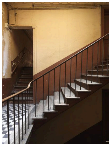
Les barreaux ronds pénètrent directement dans les marches.

IVR11_20097501412NUC4A