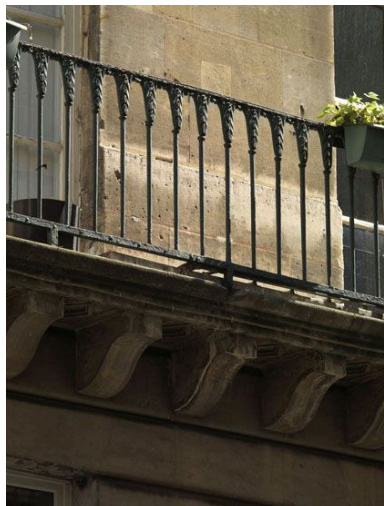
Détail du balcon de la façade sur rue.

Phot. Laurent Kruszyk IVR11_20097501412NUC4A