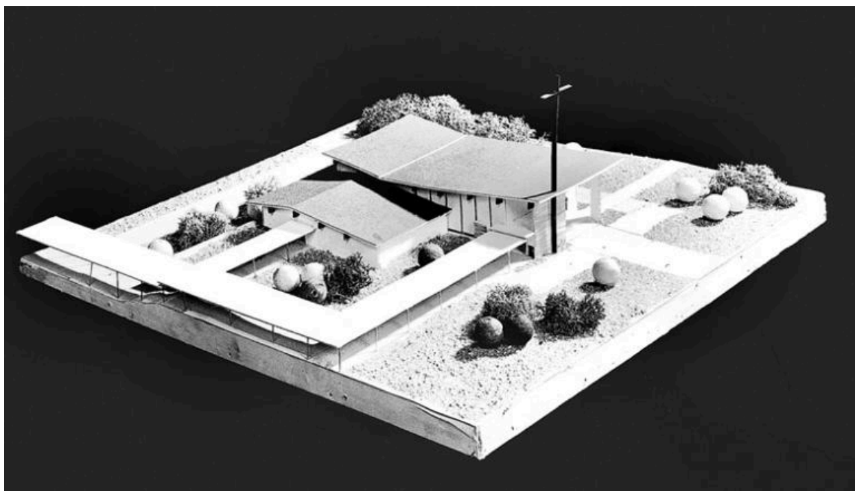
Maquette de l'église. (Fonds Bertin).