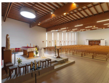
Vue latérale du chœur.