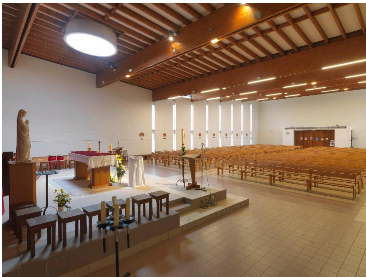
Vue latérale du choeur.