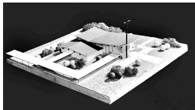
Maquette de l'église.