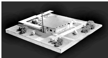
Maquette : la façade d'entrée. (Fonds Bertin). IVR11_20177800553NUC2B