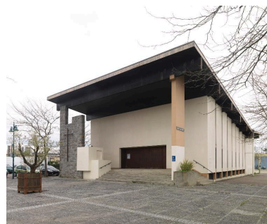
Vue de la façade principale d'une très grande simplicité. IVR11_20187800634NUC4A