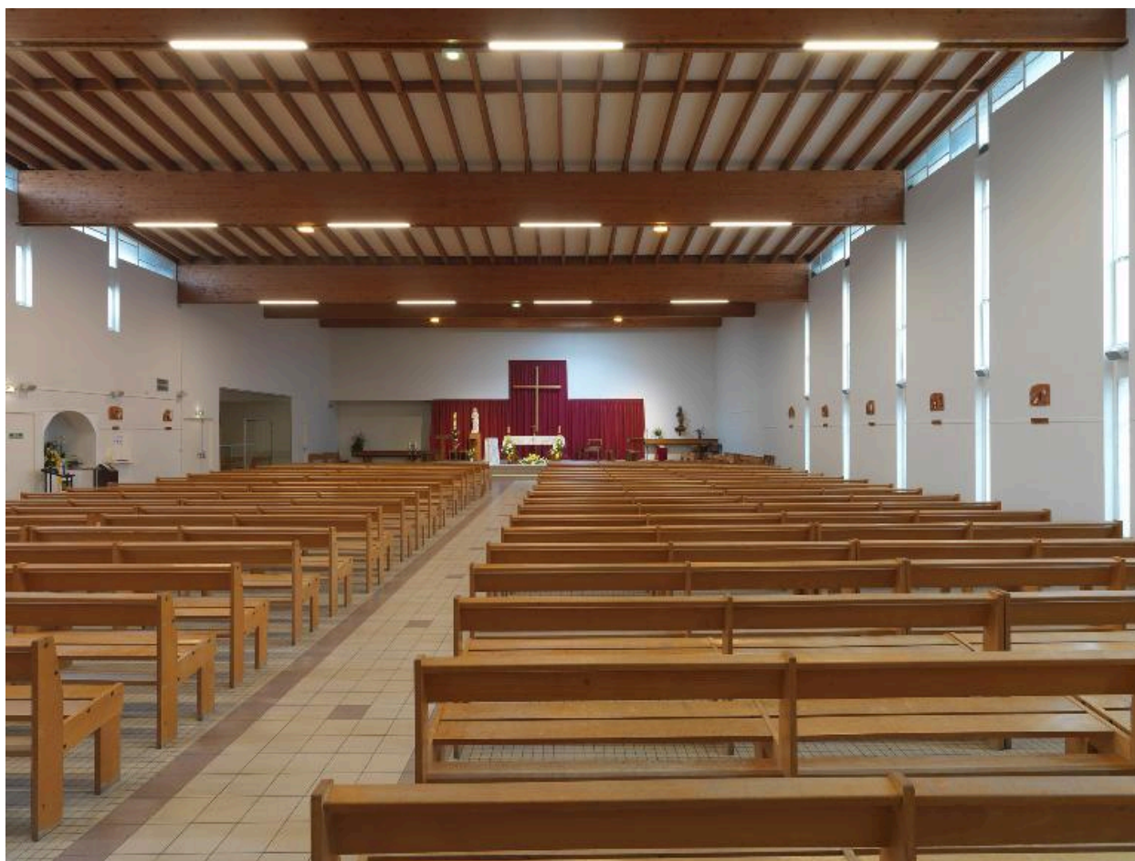
Vue d'ensemble de la nef principale en direction du chœur.