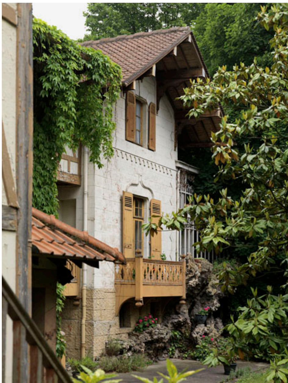
Façade d'entrée, détail du corps de bâtiment situé à droite.