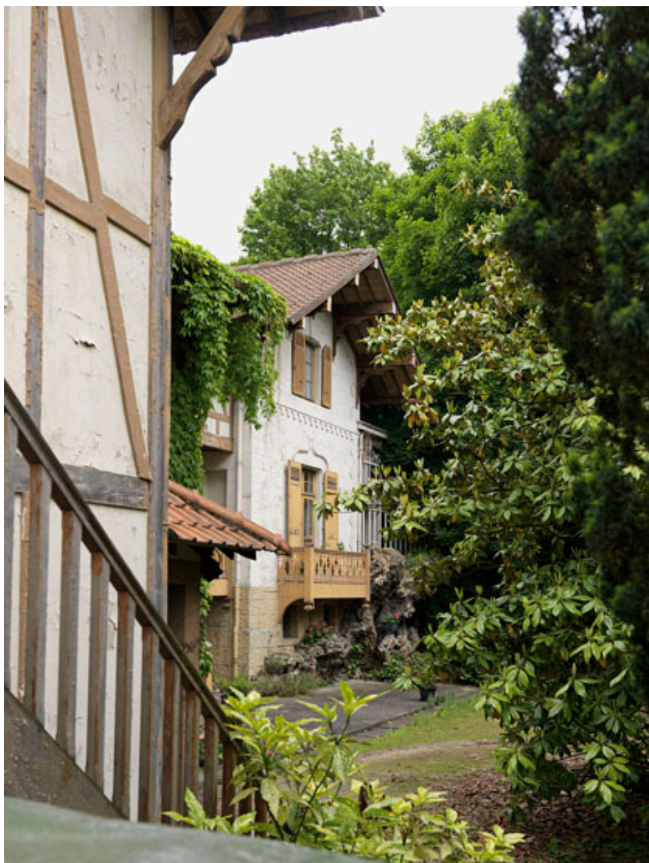
Détail de la façade d'entrée, corps de bâtiment situé à droite.