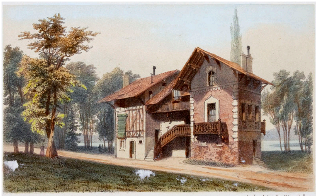
Détail de la planche de quatre maisons de villégiature. Vue de la maison en perspective depuis la rue. Chromolithographie, 2e quart du 19e siècle.