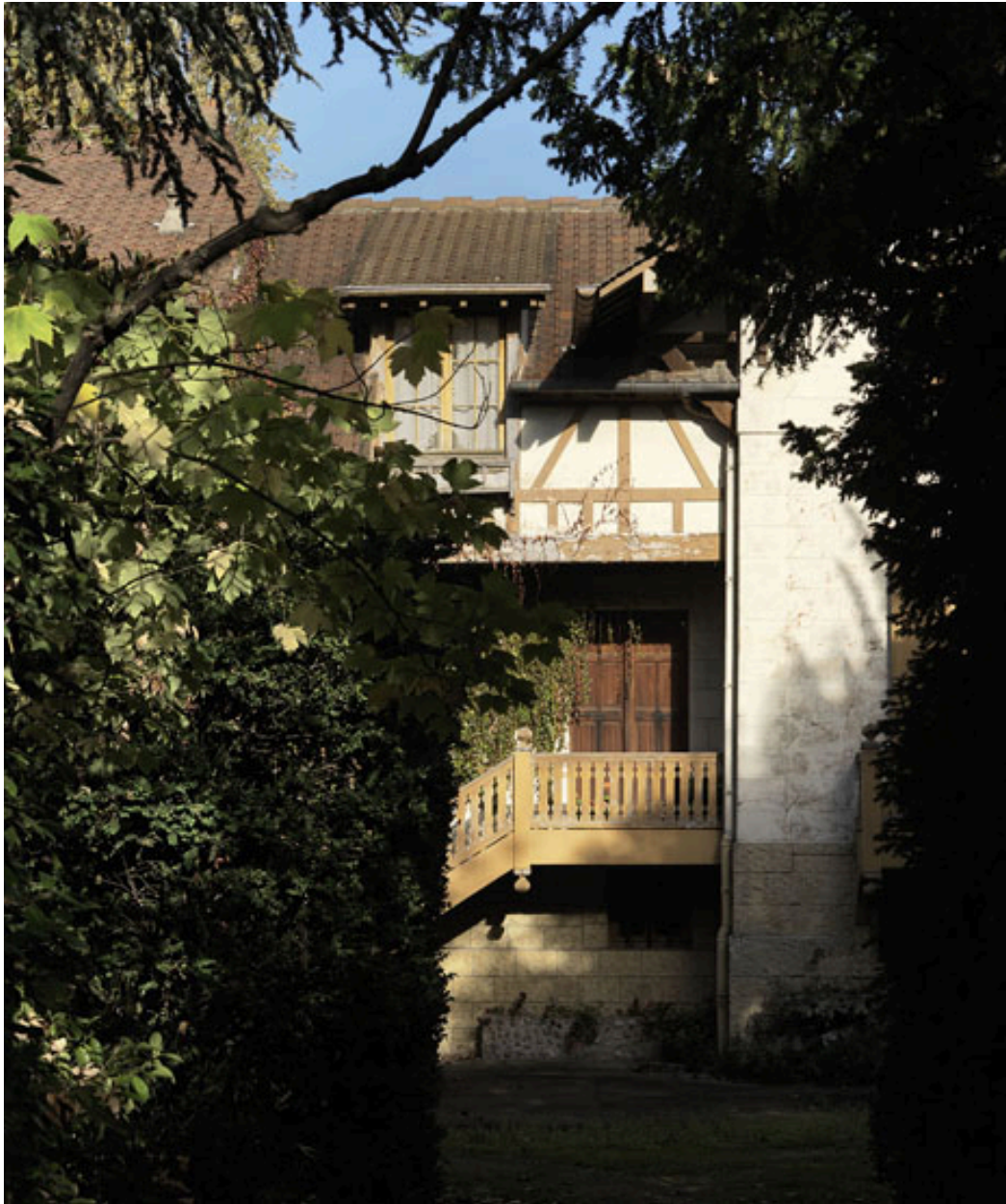
Façade d'entrée, détail du corps de bâtiment central avec la loggia et l'escalier de distribution extérieur