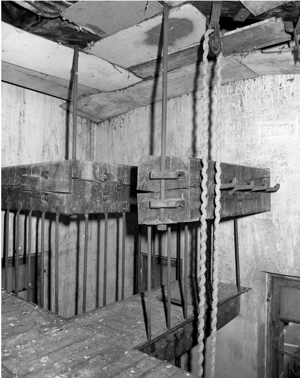
Intérieur. Détail de l'escalier. Madriers munis de crochets au sommet de la tour. Les tuyaux y sont placés pour sécher (au premier plan corde et poulie pour hisser les tuyaux. Gymnase, Remise (Gymnase Municipal, Remise de Pompiers)