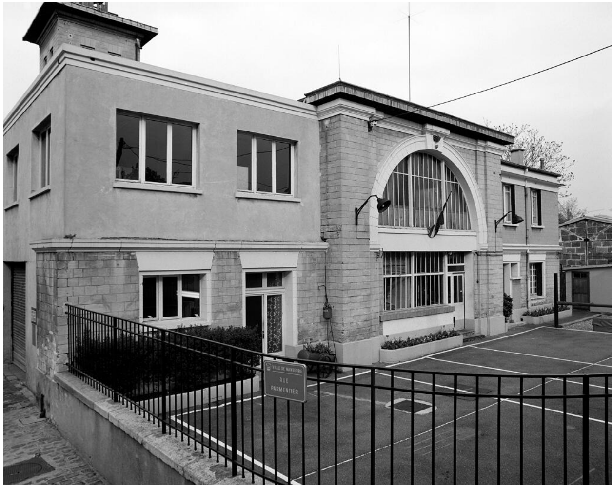
Vue depuis l'angle des rues de Stalingrad et Parmentier. Gymnase, Remise (Gymnase Municipal, Remise de Pompiers)