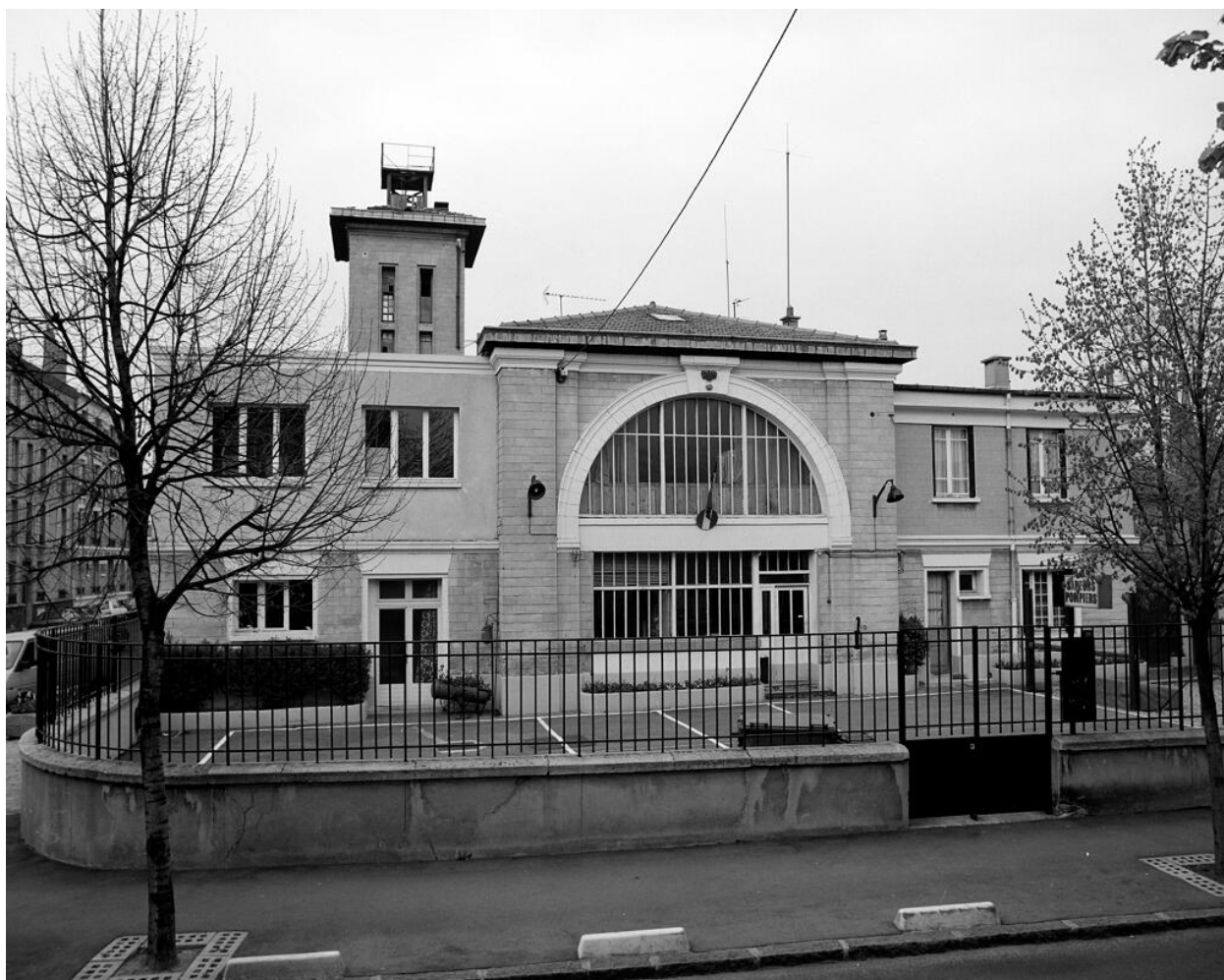
Vue d'ensemble depuis la rue de Stalingrad. Gymnase, Remise (Gymnase Municipal, Remise de Pompiers)