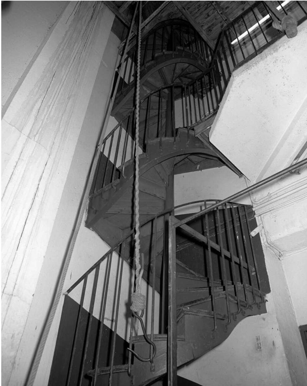
Intérieur de la tour. Escalier en vis, vu depuis la plateforme sommitale. Gymnase, Remise (Gymnase Municipal, Remise de Pompiers)