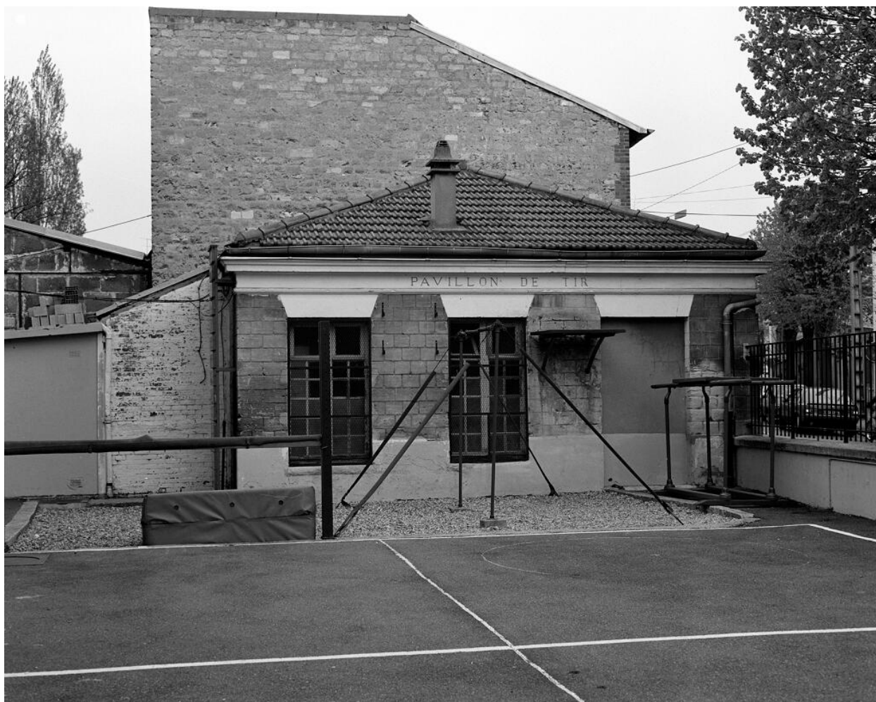
Entrée du stand de tir. Gymnase, Remise (Gymnase Municipal, Remise de Pompiers)