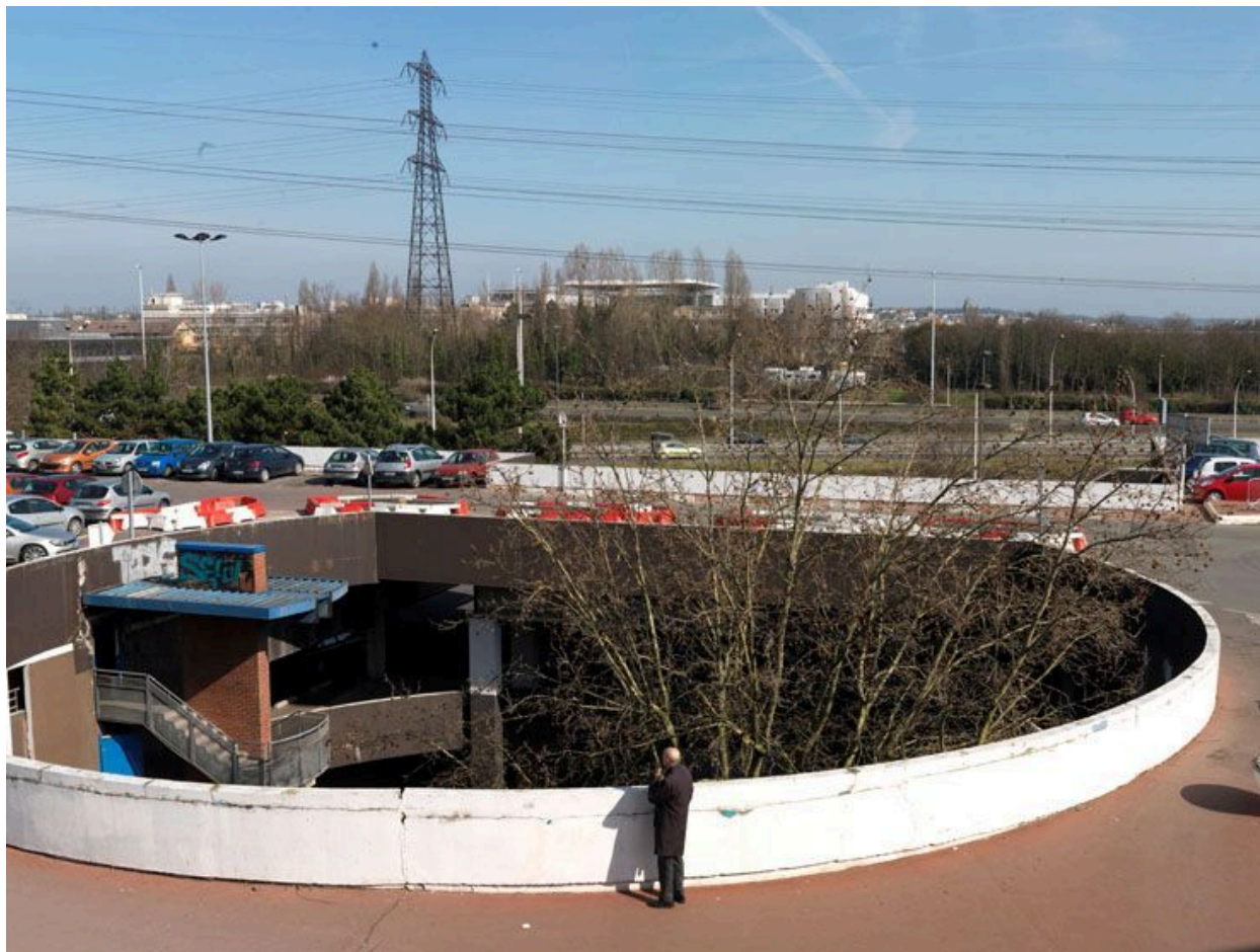
Vue de la descente vers les parkings souterrains.