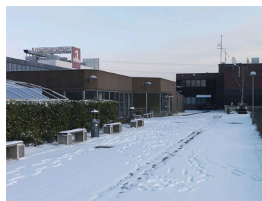
Vue sur les jardins situés sur le centre commercial.

IVR11_20129500327NUC4A