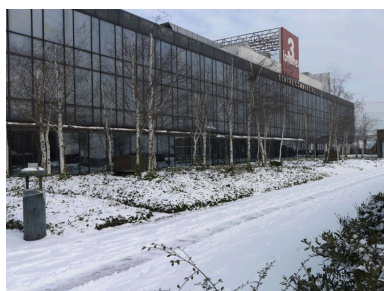
Façade du centre commercial donnant sur les jardins suspendus sur dalle.

IVR11_20129500328NUC4A