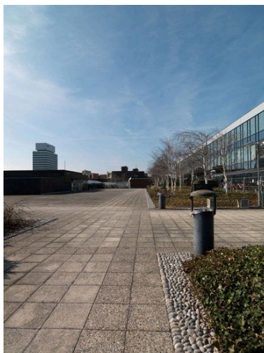
Vue des jardins suspendus sur dalle, au-dessus du Centre commercial. A droite le bâtiment de verre, au premier plan, observer le traitement des bordures avec des galets.

IVR11_20129500326NUC4A