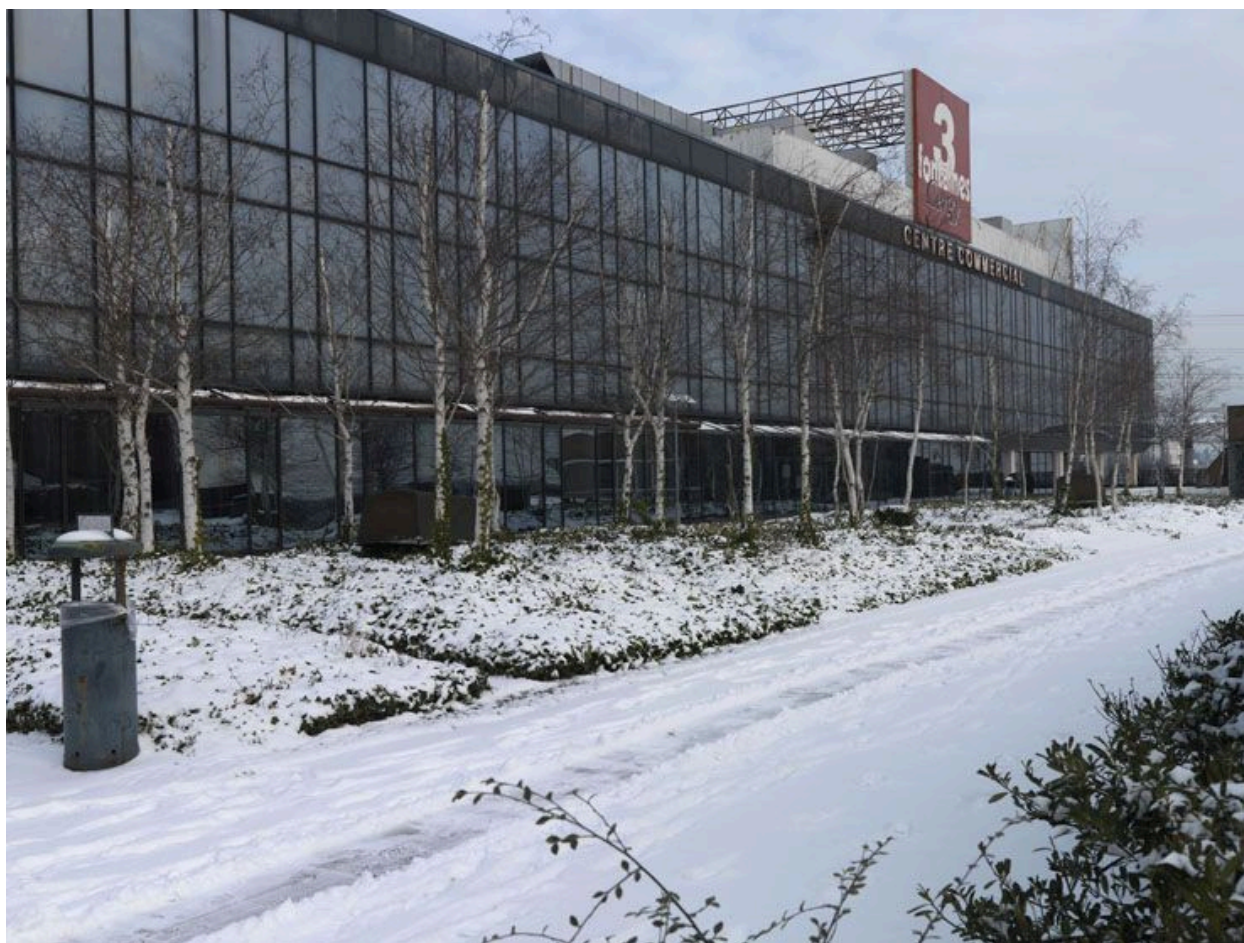
Façade du centre commercial donnant sur les jardins suspendus sur dalle.