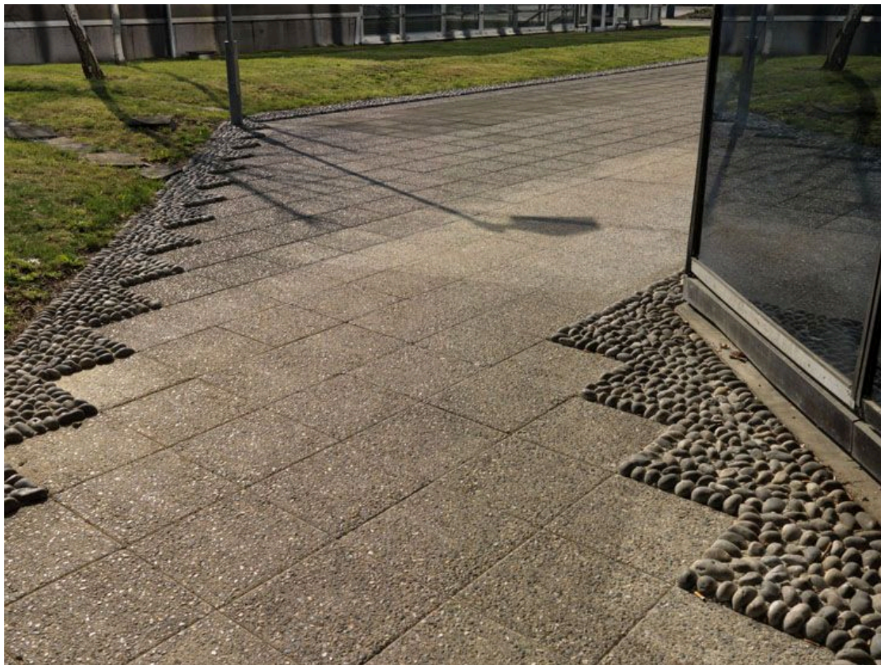
Allée des jardins suspendus sur dalle : détail des pavés et des bordures de galets formant des motifs géométriques.