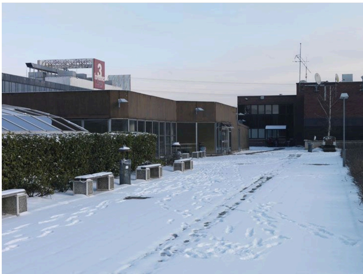
Vue sur les jardins situés sur le centre commercial.