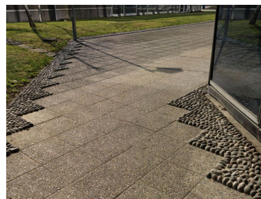
Allée des jardins suspendus sur dalle : détail des pavés et des bordures de galets formant des motifs géométriques.

Phot. Laurent Kruszyk IVR11_20129500325NUC4A