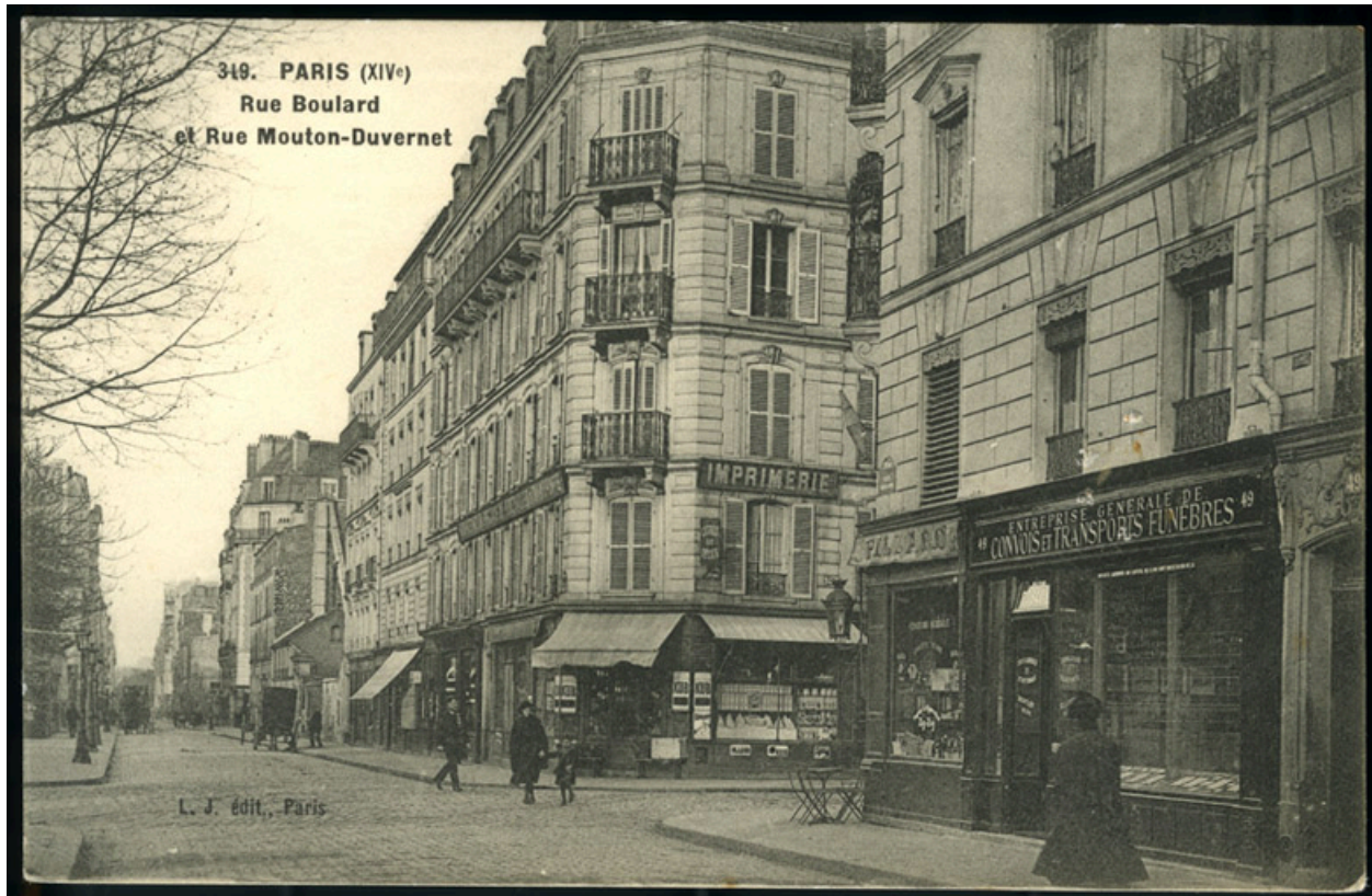
Vue de la rue Boulard vers 1900. Carte postale.