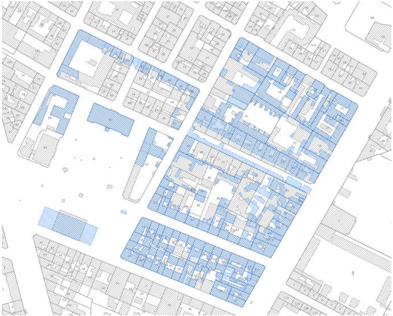
Report du cadastre de 1896 sur le cadastre actuel.