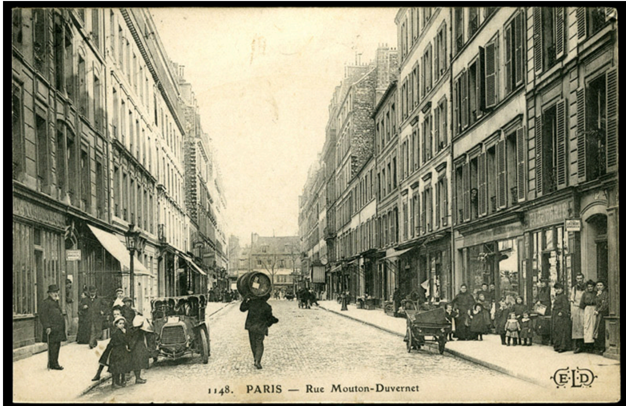
Vue de la rue Mouton Duvernet vers 1900. Carte postale.