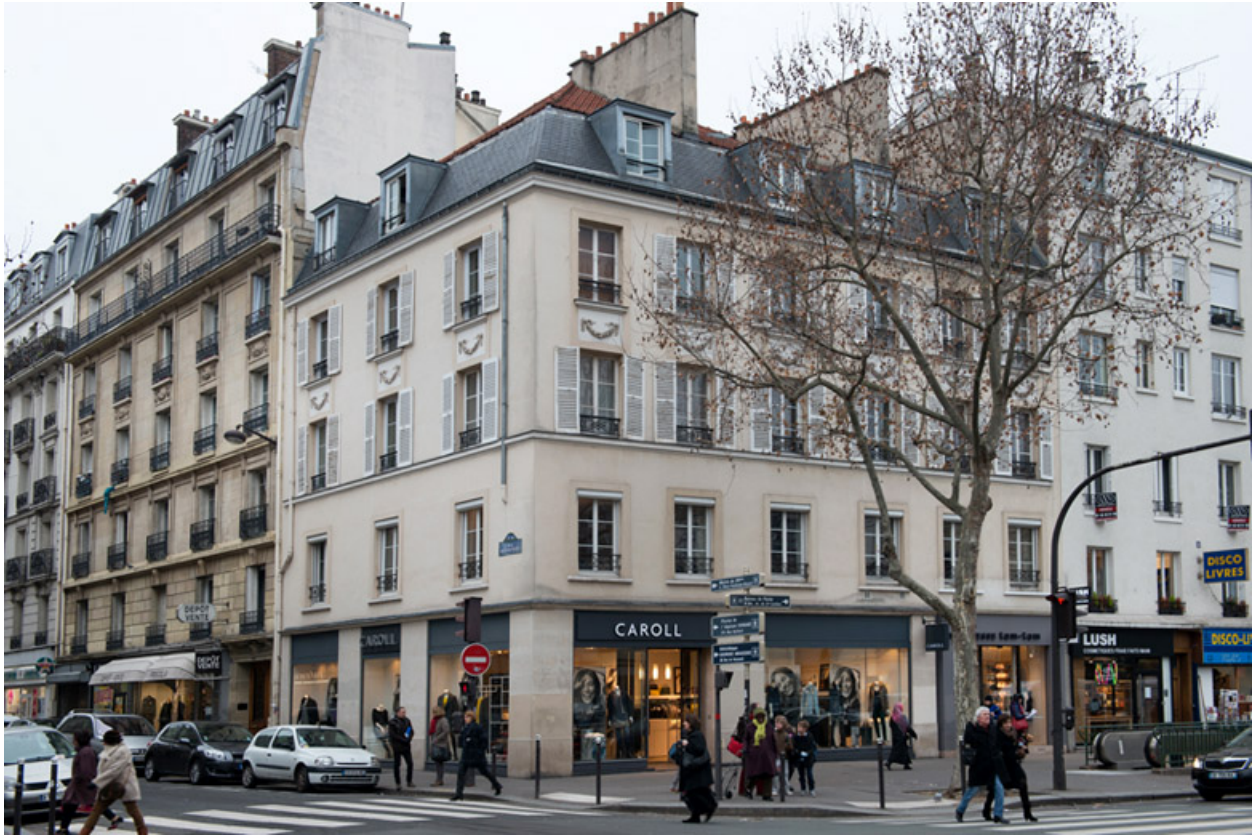
Vue d'un immeuble d'angle (rue Mouton-Duvernet, avenue du Général-Leclerc).