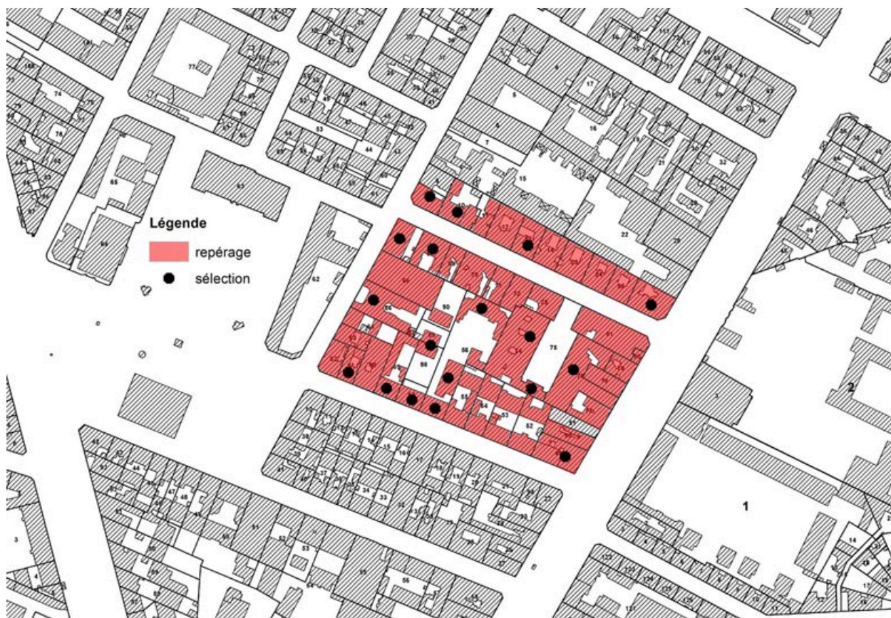
Immeubles repérés et sélectionnés .