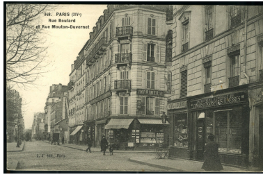
Vue de la rue Boulard vers 1900. Carte postale (collection particulière). IVR11_20157500540NUC4A