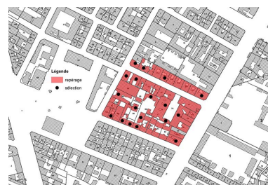
Immeubles repérés et sélectionnés. IVR11_20157500815NUC4A