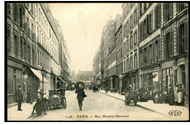
Vue de la rue Mouton Duvernet vers 1900. Carte postale (collection particulière). IVR11_20157500567NUC4A