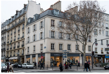
Vue d'un immeuble d'angle (rue Mouton-Duvernet, avenue du Général-Leclerc). IVR11_20157500028NUC4A