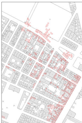
Report du cadastre napoléonien de 1845 sur le cadastre actuel. IVR11_20157500813NUC4A