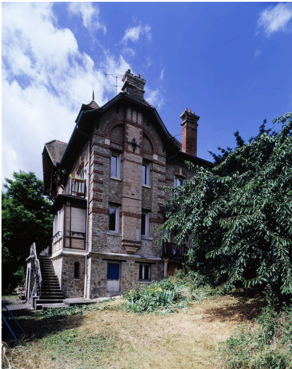
Vue latérale (façade est).