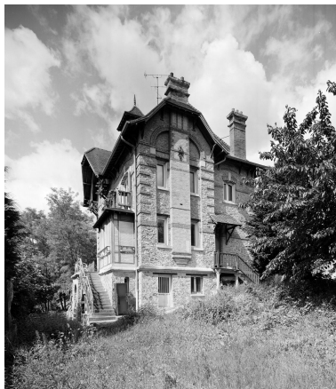
Vue de la façade latérale est. IVR11_20029100794V