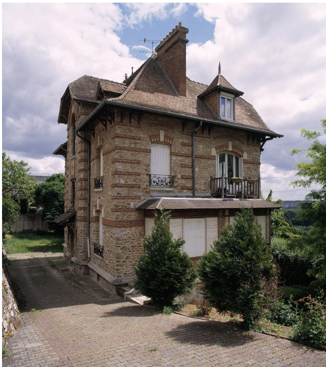
Vue de la façade latérale ouest.