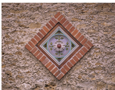
Détail d'un motif de céramique émaillée sur la façade sur rue.