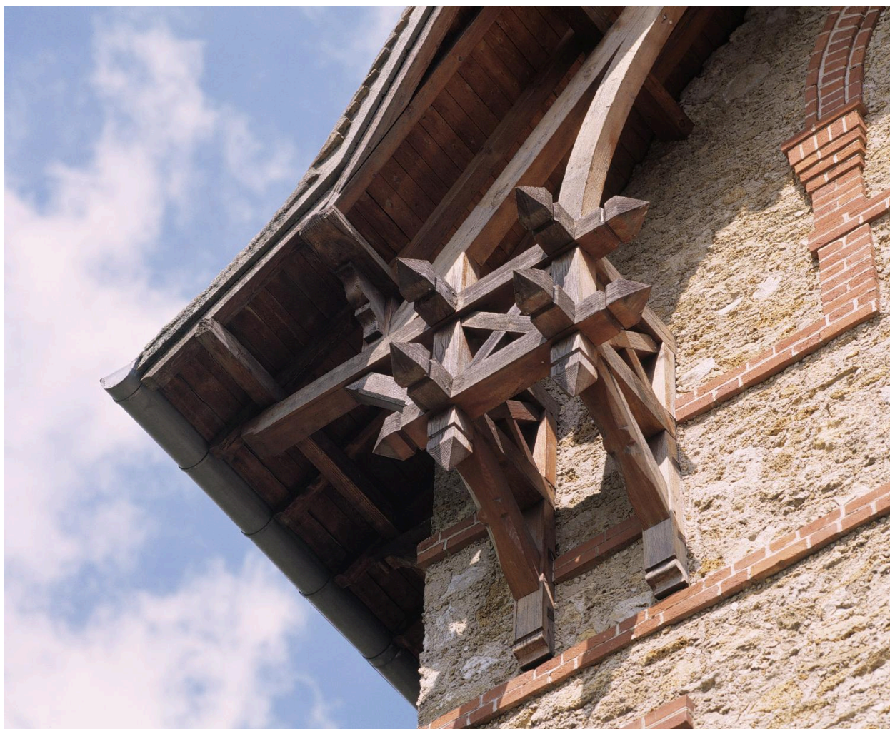
Détail d'un aisselier (façade sur jardin).