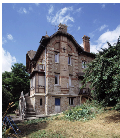
Vue latérale (façade est).