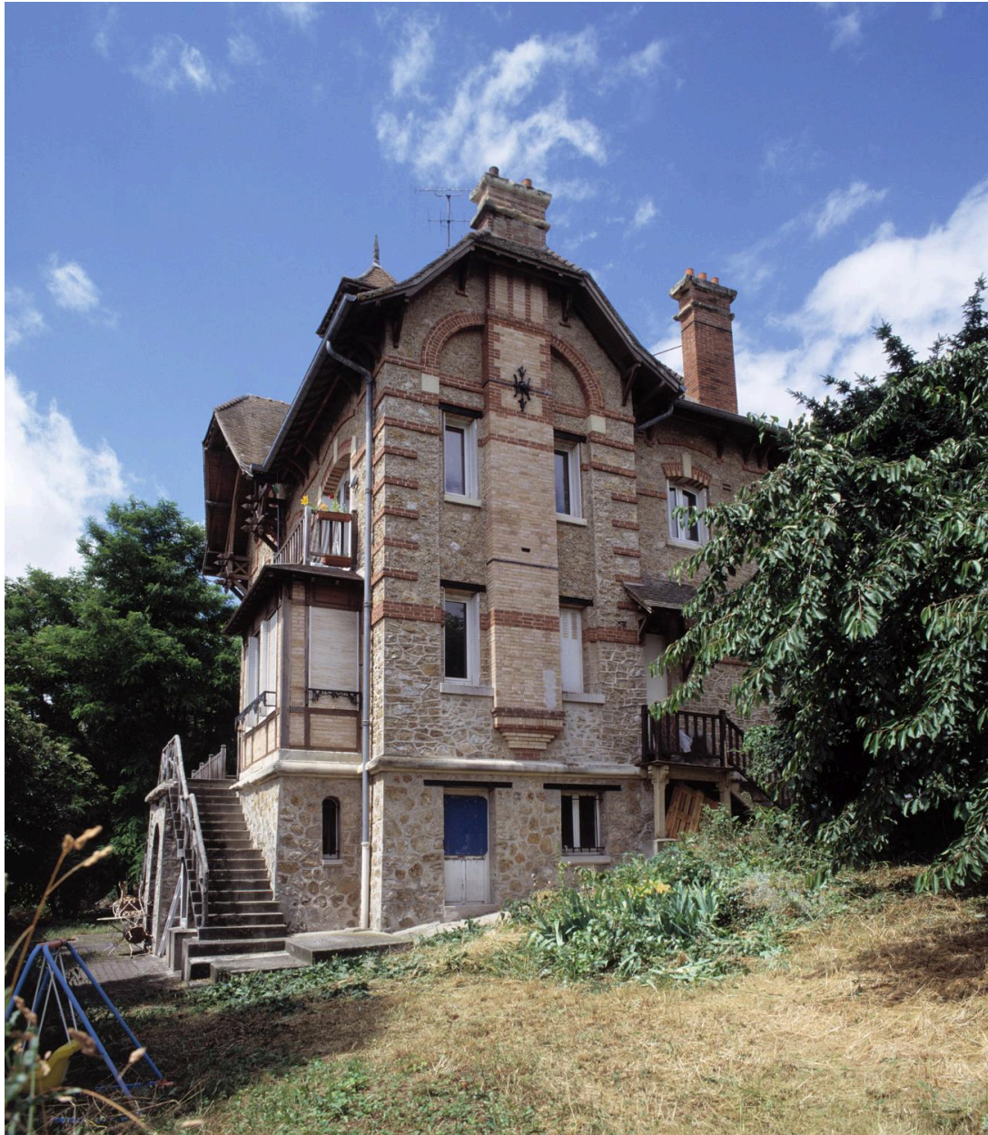
Vue latérale (façade est).