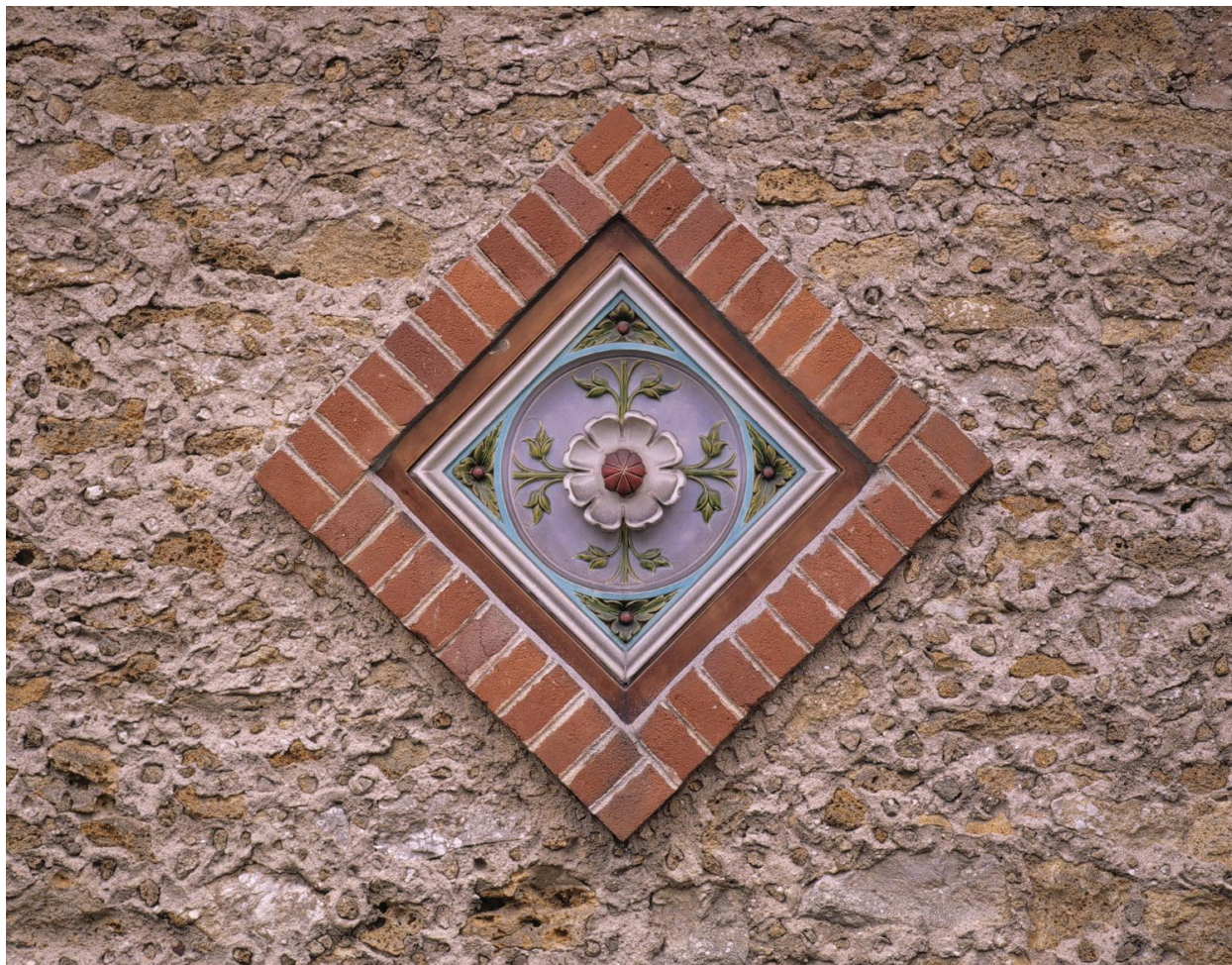
Détail d'un motif de céramique émaillée sur la façade sur rue.