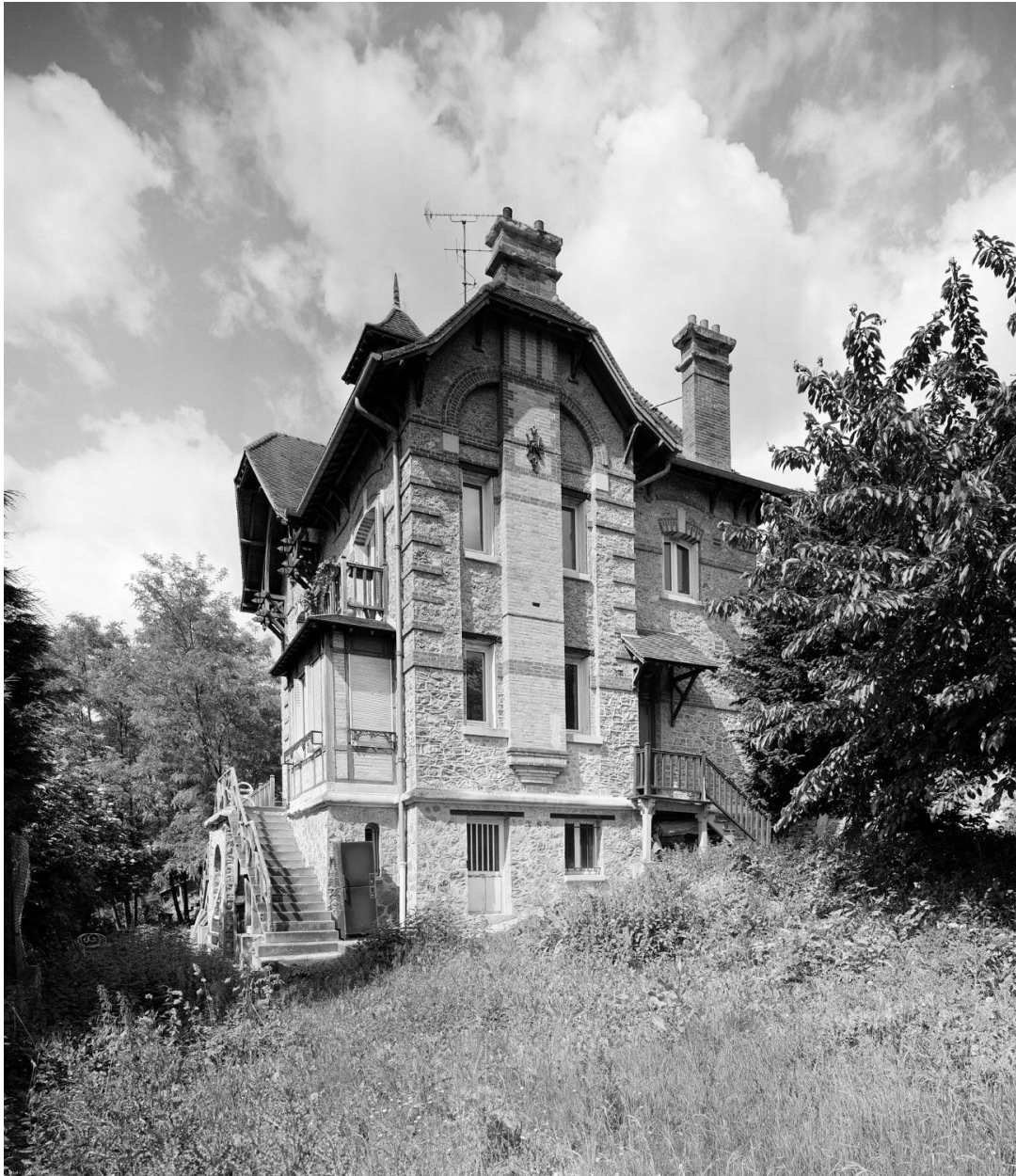
Vue de la façade latérale est.