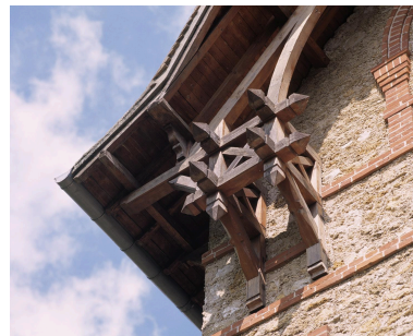
Détail d'un aisselier (façade sur jardin). IVR11_20029100799XA