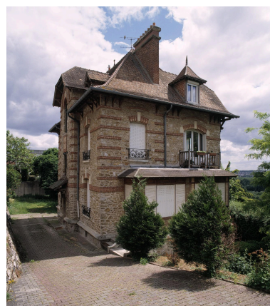
Vue de la façade latérale ouest. IVR11_20029100792XA