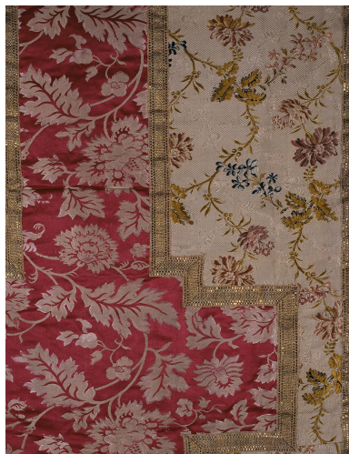
Détail du tissu de la chasuble.

Phot. Philippe Ayrault IVR11_20039100890XA