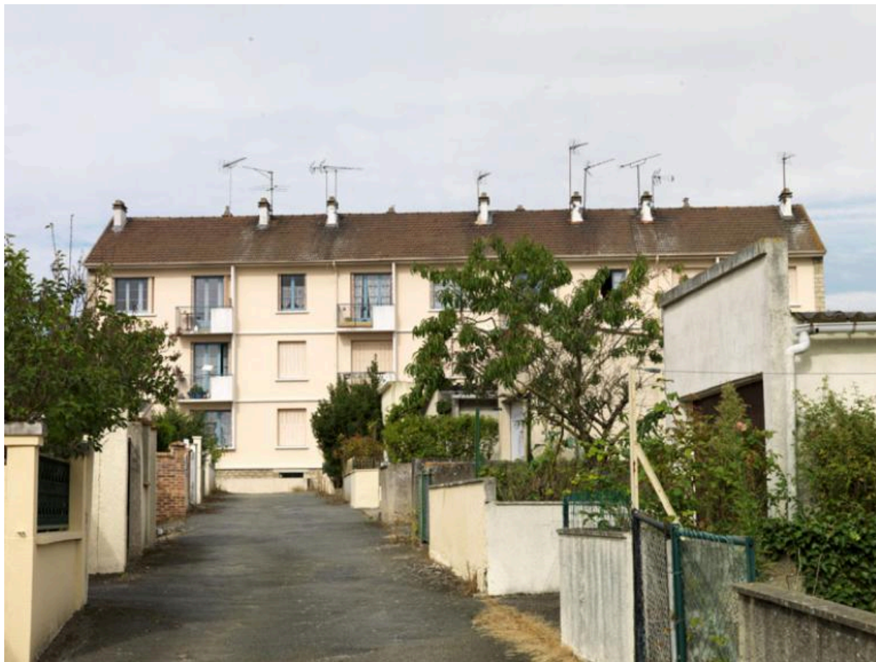
Voie privée desservant les jardins des pavillons.