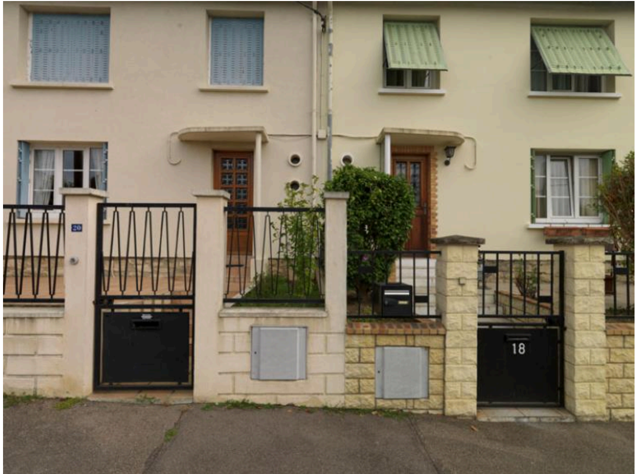
Détail de l'entrée des pavillons avec oculi et auvent.