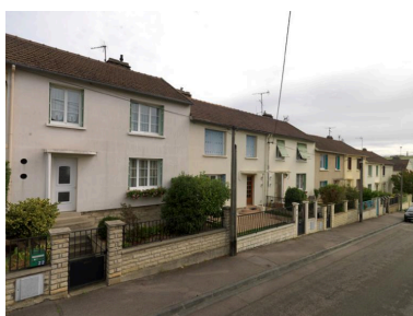
Vue d'ensemble des pavillons du lotissement. IVR11_20167800430NUC4A