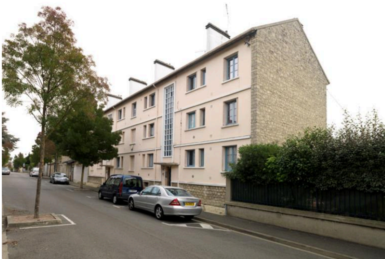
Façade sur rue de l'immeuble avec entrées et travées d'escalier.