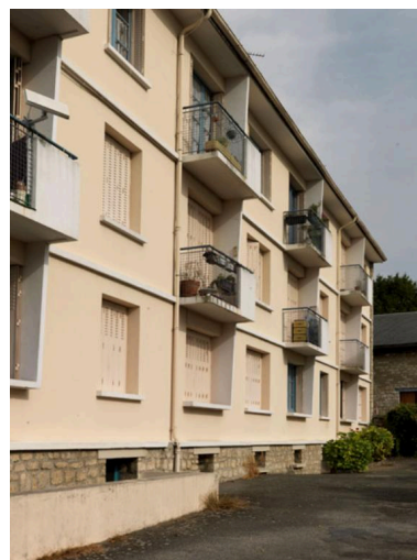
Façade principale tournée sur le jardin. IVR11_20167800429NUC4A