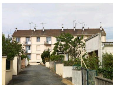
Voie privée desservant les jardins des pavillons.