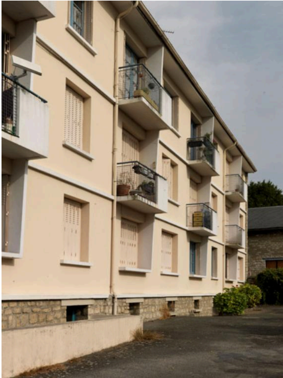
Façade principale tournée sur le jardin.