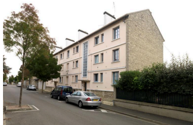
Façade sur rue de l'immeuble avec entrées et travées d'escalier. IVR11_20167800426NUC4A