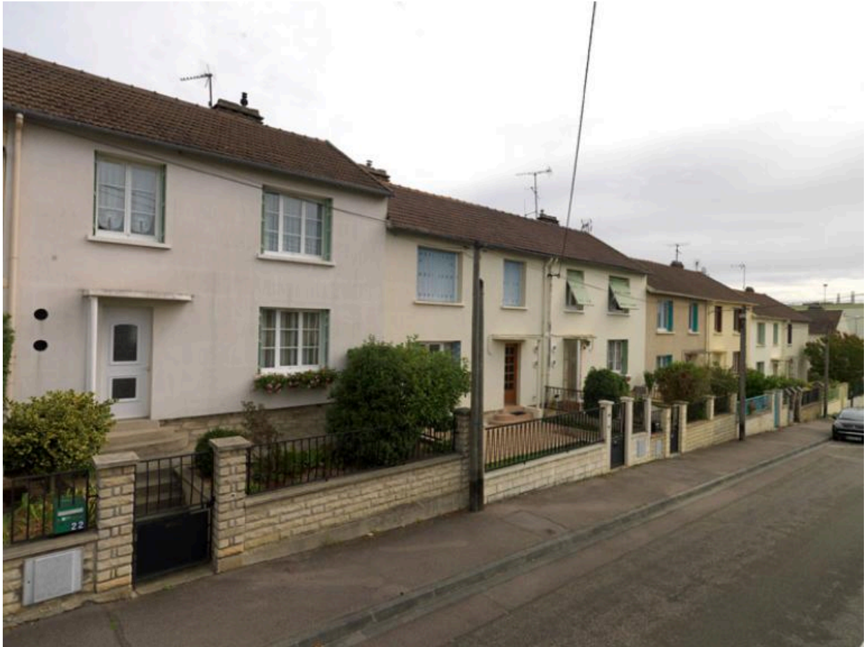
Vue d'ensemble des pavillons du lotissement.