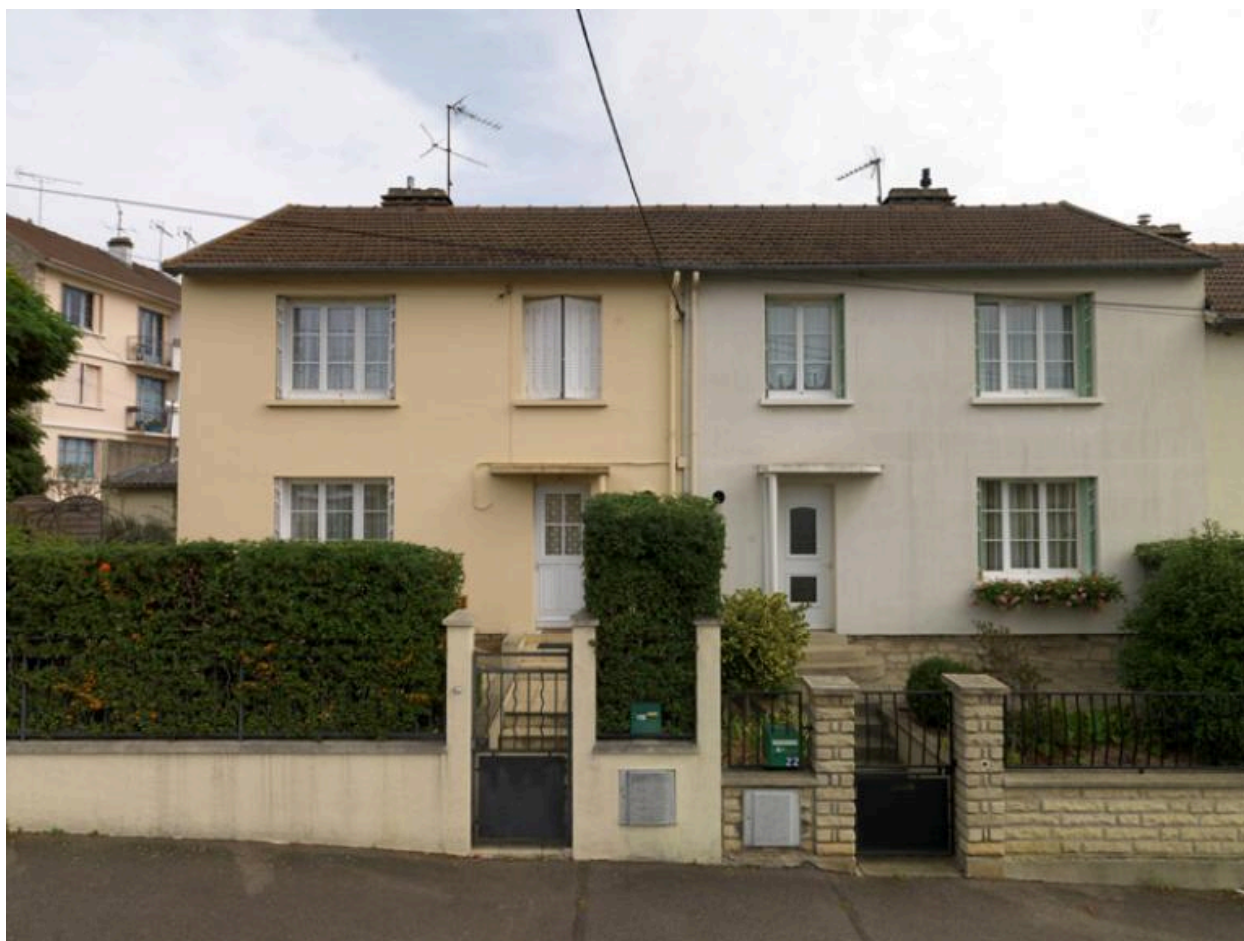
Vue d'un groupe de deux pavillons.