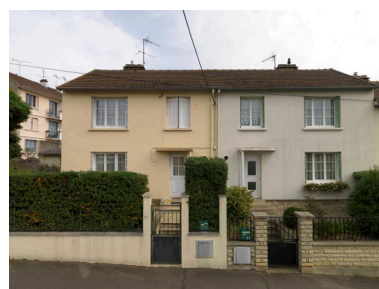
Vue d'un groupe de deux pavillons.