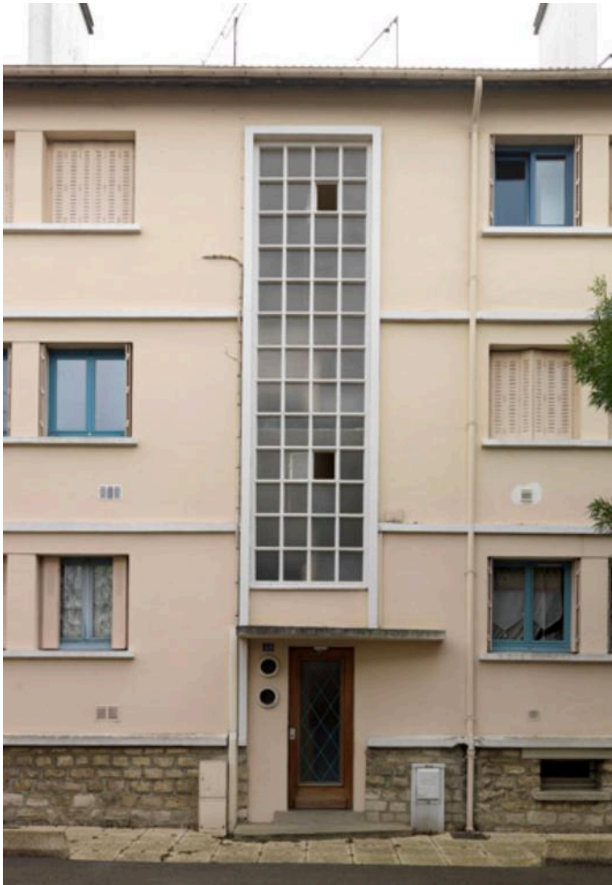
Détail de la haute baie marquant la cage d'escalier et entrée de l'immeuble.