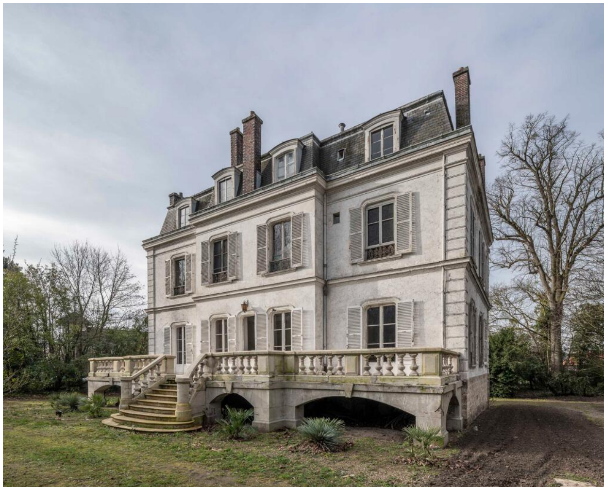
Façade sur le jardin.