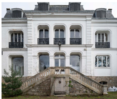
Façade d'entrée. Les fenêtres en retrait par rapport au mur apportent un fort relief. IVR11_20239100119NUC4A