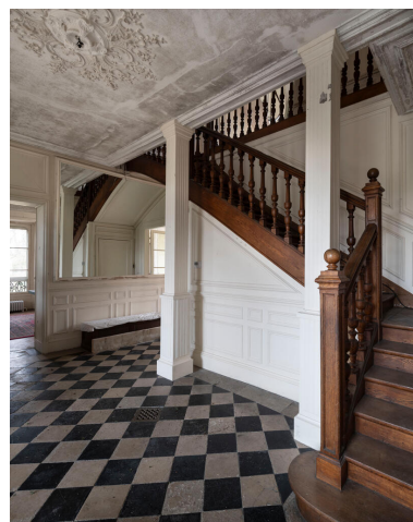
Le vestibule. La porte sous l'escalier permet d'accéder au sous-sol.