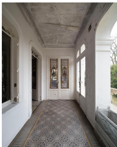
Une galerie, aujourd'hui vitrée, conduit à l'entrée.