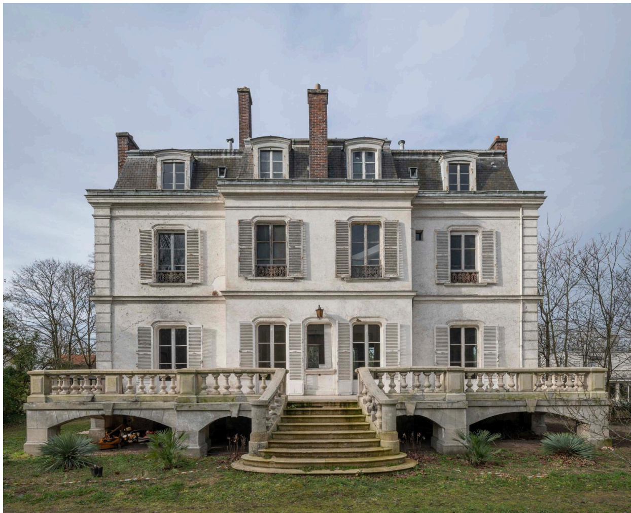
Façade sur jardin