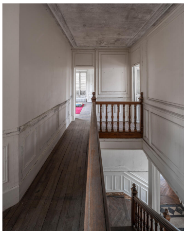
Palier du premier étage. IVR11_20239100105NUC4A