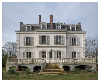
Façade sur jardin IVR11_20239100089NUC4A