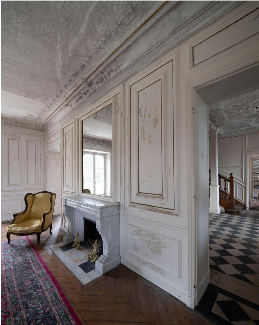
Pièce de réception et son accès vers le vestibule. La pièce à boiseries est ornée d'une cheminée de marbre.