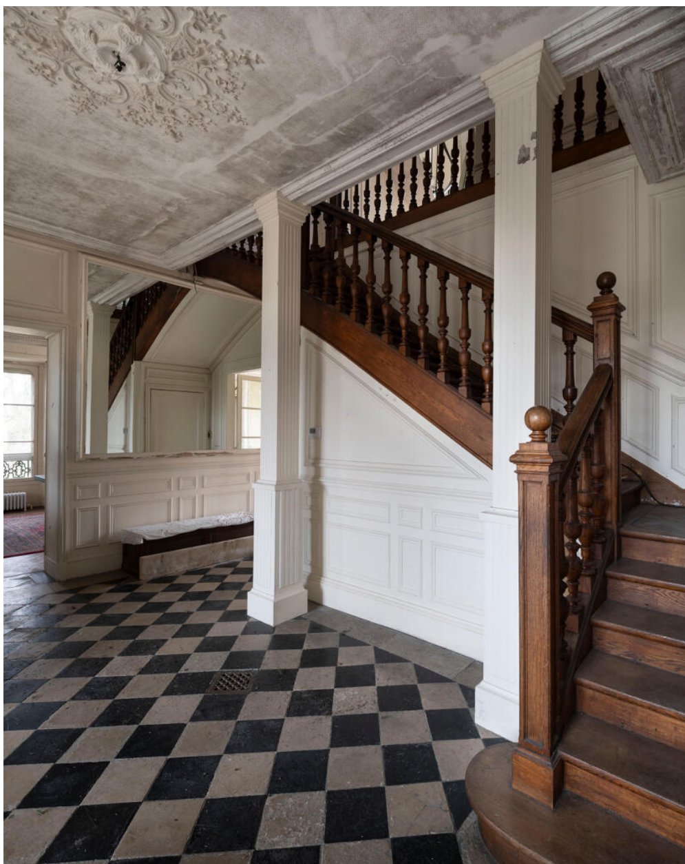
Le vestibule. La porte sous l'escalier permet d'accéder au sous-sol.