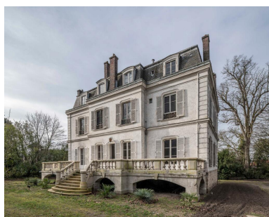
Façade sur le jardin. IVR11_20239100090NUC4A