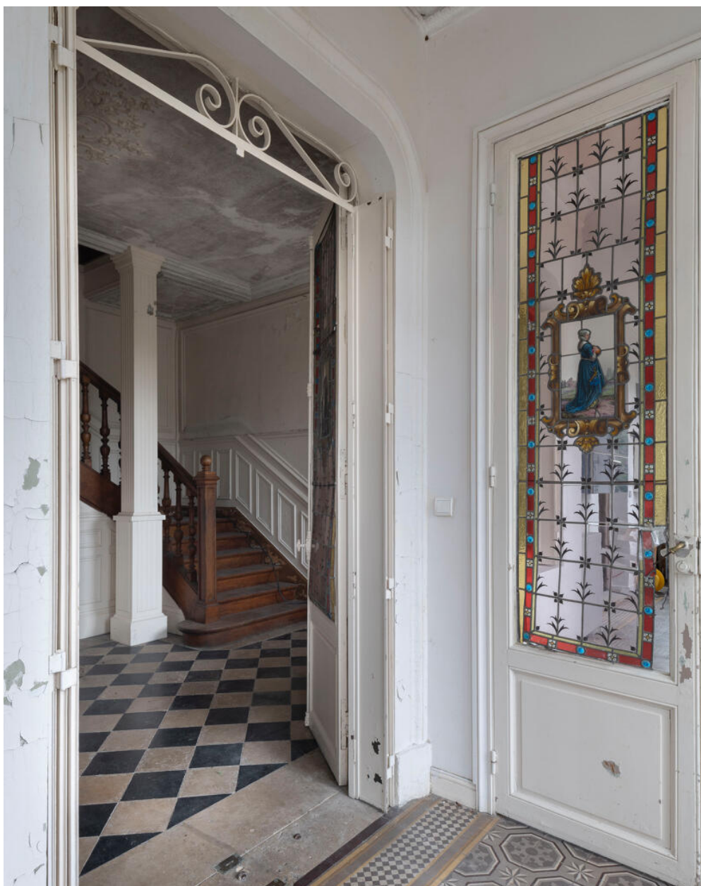
L'entrée et ses portes ornées de vitraux historiés.