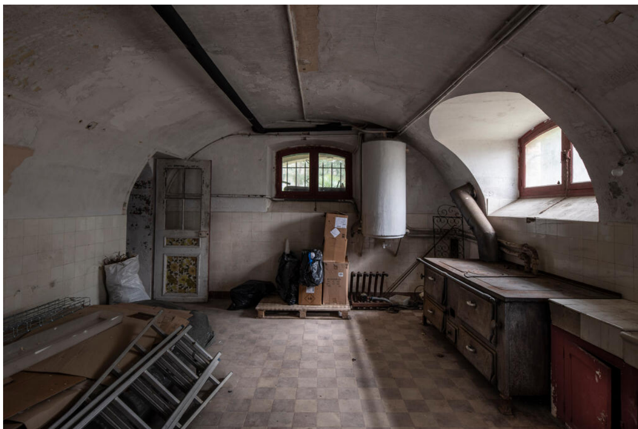
La cuisine au sous-sol.