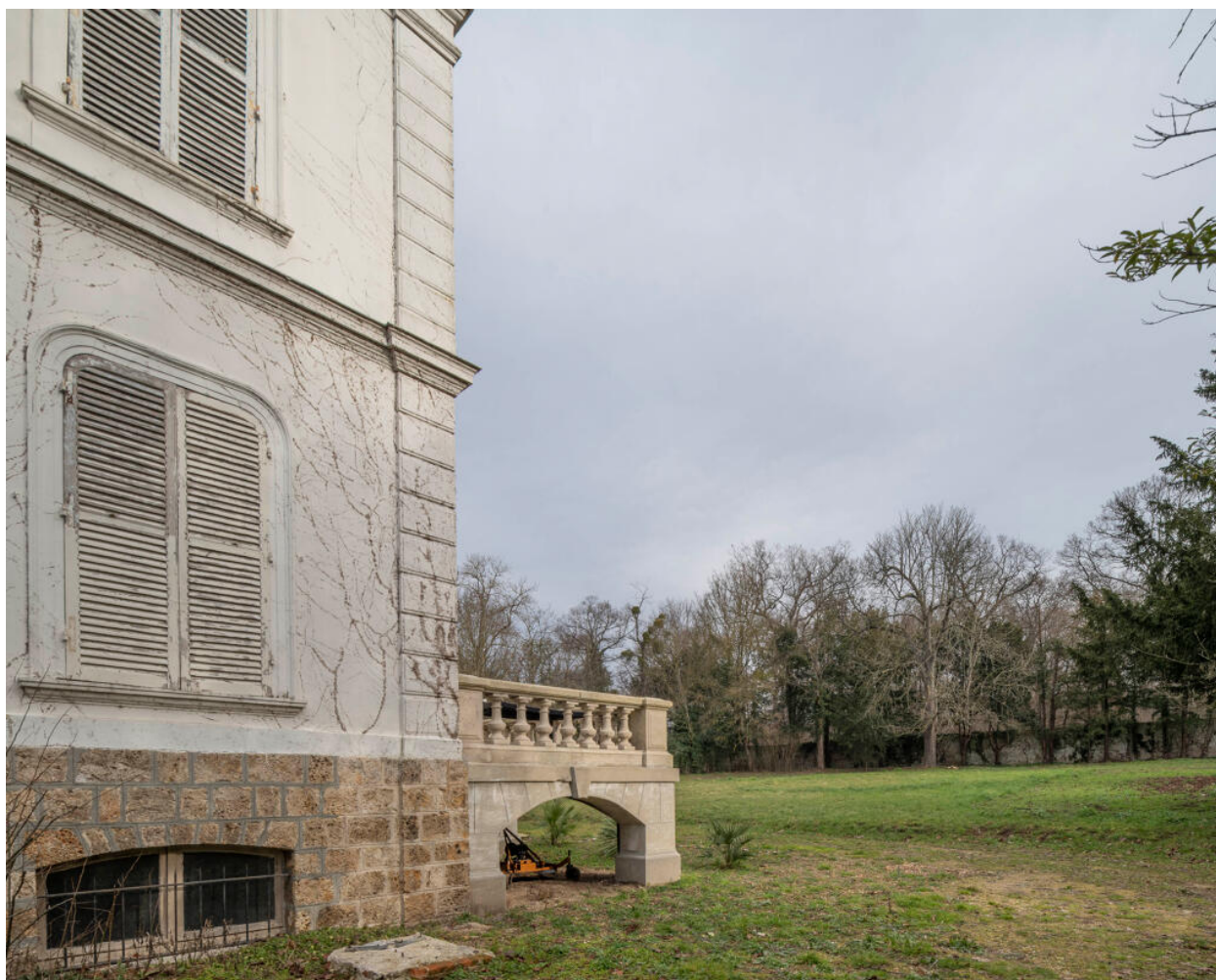
Extrémité de la façade sud. La terrasse vers le jardin est soutenue par des arcades de pierre.