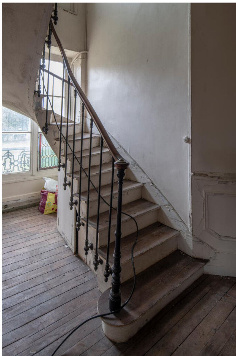
Escalier d'accès à l'étage de comble.