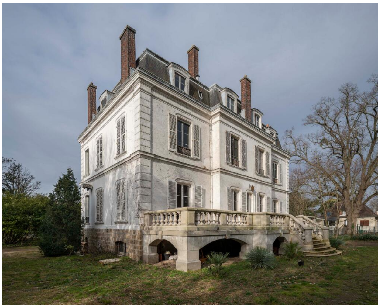
Façade vers le jardin.