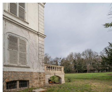
Extrémité de la façade sud. La terrasse vers le jardin est soutenue par des arcades de pierre. IVR11_20239100091NUC4A