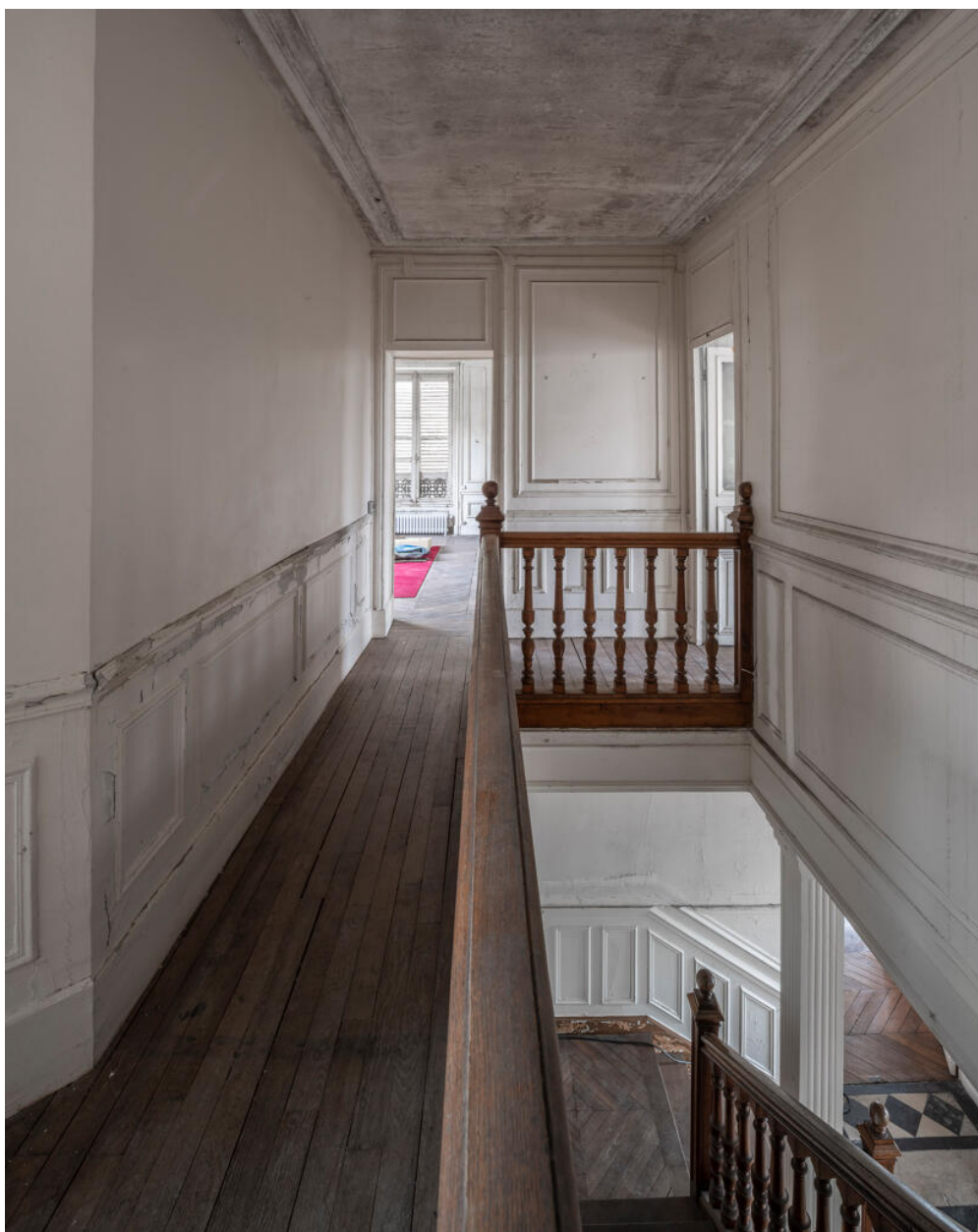
Palier du premier étage.