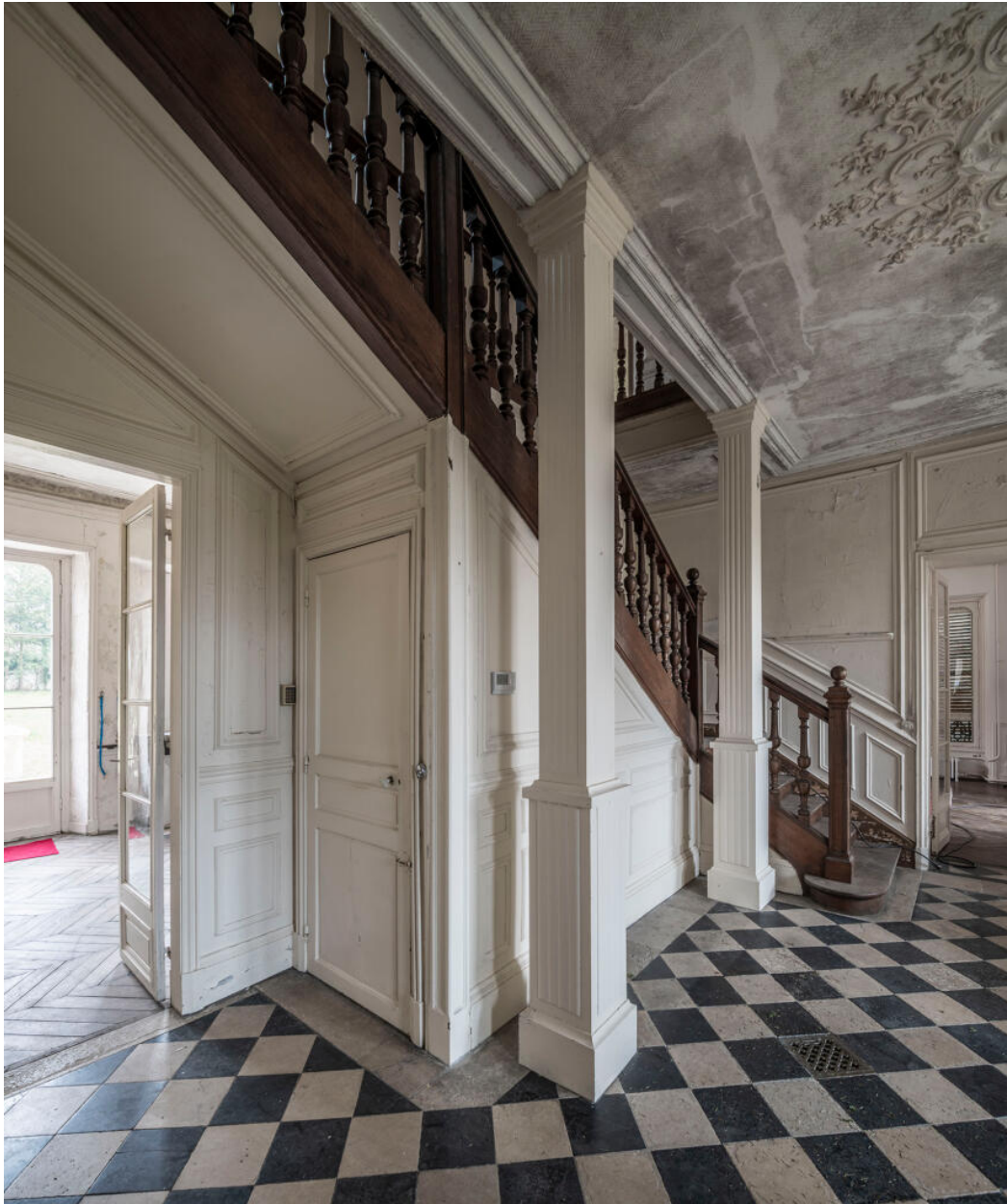
Vestibule d'entrée avec l'accès au sous-sol et aux pièces de réception.