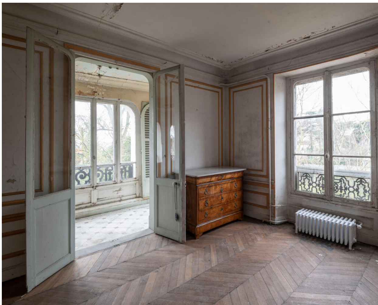
Chambre du premier étage. Les fenêtres de la maison ont des moustiquaires intégrées.