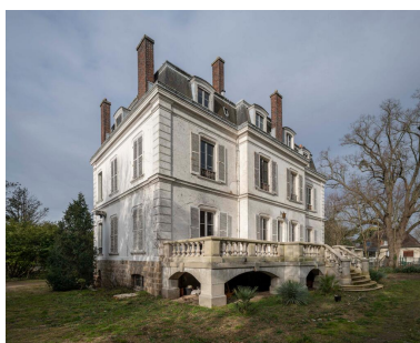
Façade vers le jardin. IVR11_20239100088NUC4A