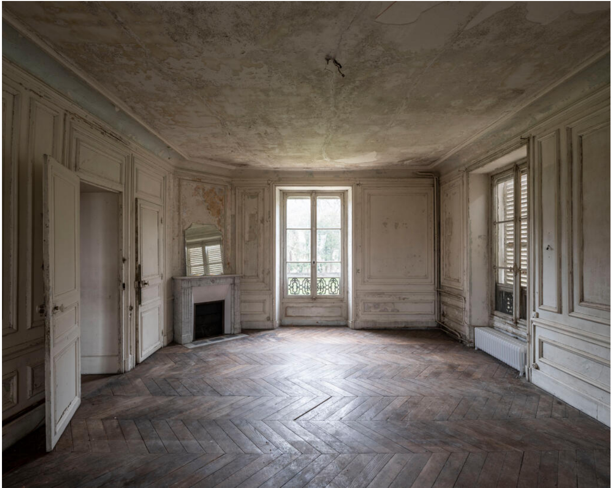
Chambre au premier étage.