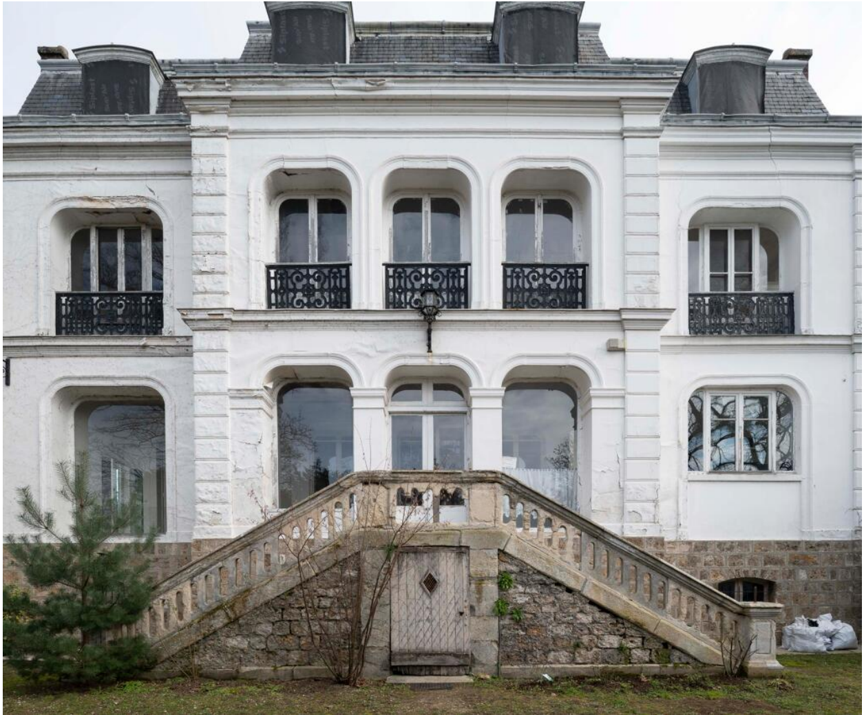
Façade d'entrée. Les fenêtres en retrait par rapport au mur apportent un fort relief.