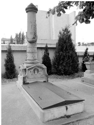
Vue d'ensemble. IVR11_19859401172X