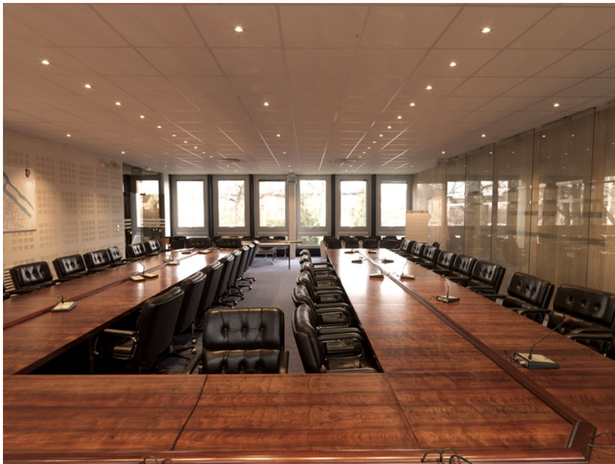
Vue actuelle de la salle du conseil dont le mobilier a été changé.