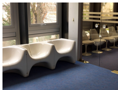
Sièges en plastique moulé très originaux. IVR11_20157800606NUC4A