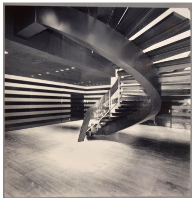
Si l'escalier est l'oeuvre de l'architecte, le décor environnant a été dessiné par les designers.