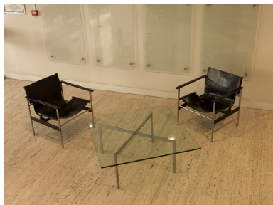
Sièges Wassili de Marcel Breuer et table "Barcelona" du designer Mies van der Rohe. IVR11_20157800611NUC4A