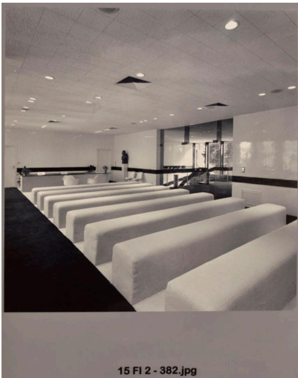
La salle des mariages.