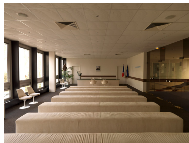
Vue actuelle de la salle des mariages. IVR11_20157800601NUC4A