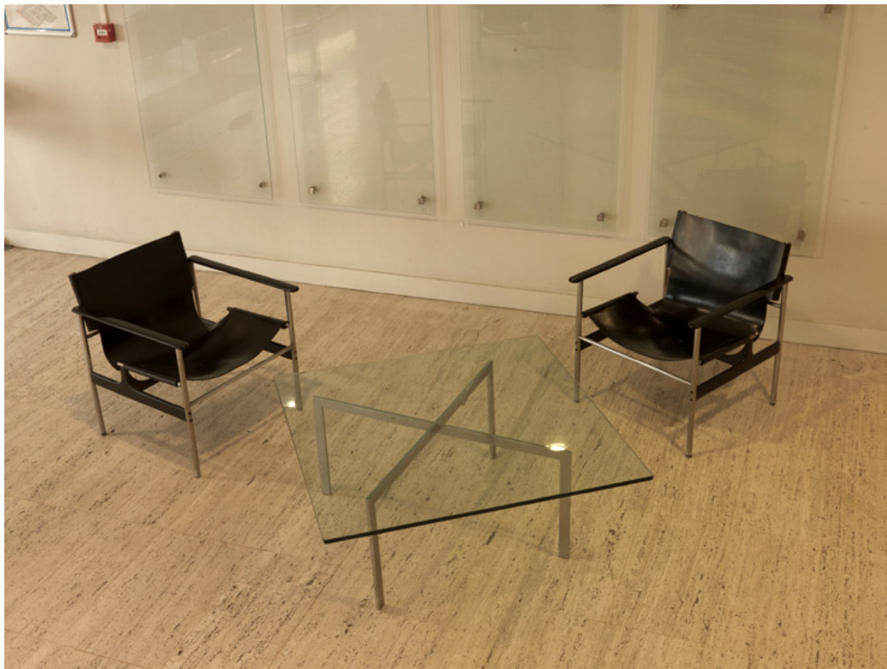
Sièges Wassili de Marcel Breuer et table "Barcelona" du designer Mies van der Rohe.