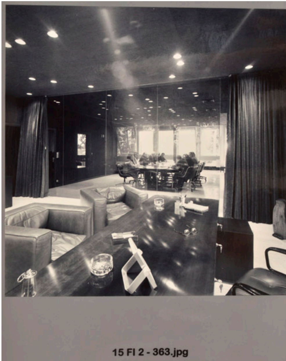
Le bureau du maire et la salle de conférences particulière.