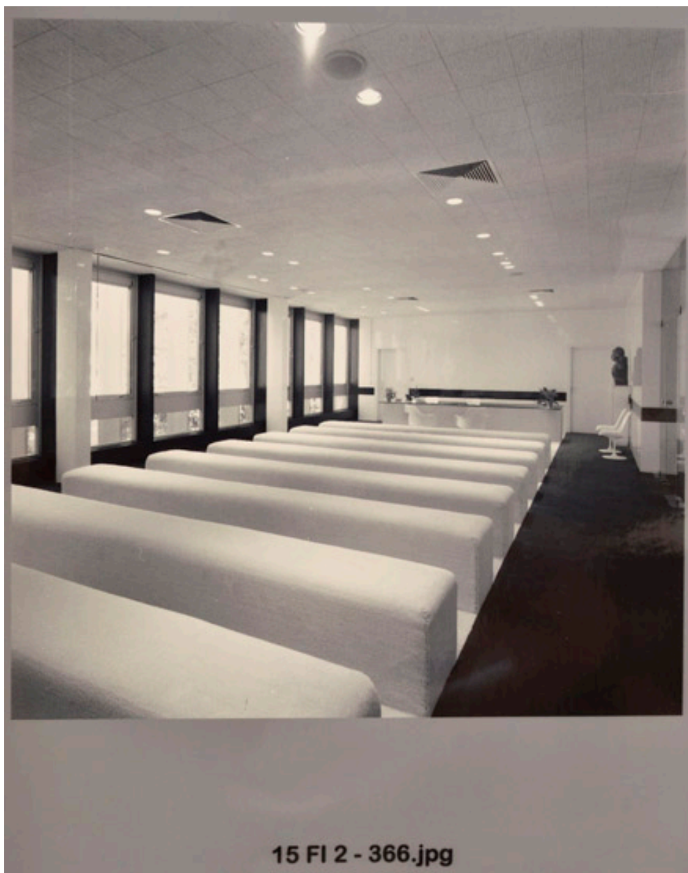
Bancs du public dans la salle des mariages.