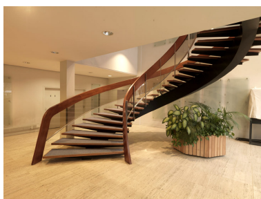
Le hall d'honneur a perdu les rayures horizontales qui sur le mur faisaient écho aux marches d'escalier.