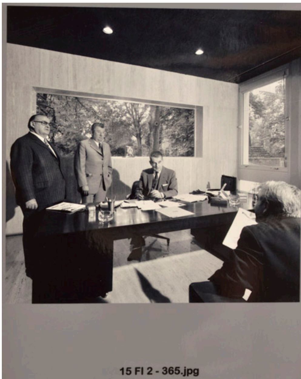
Le bureau du maire.