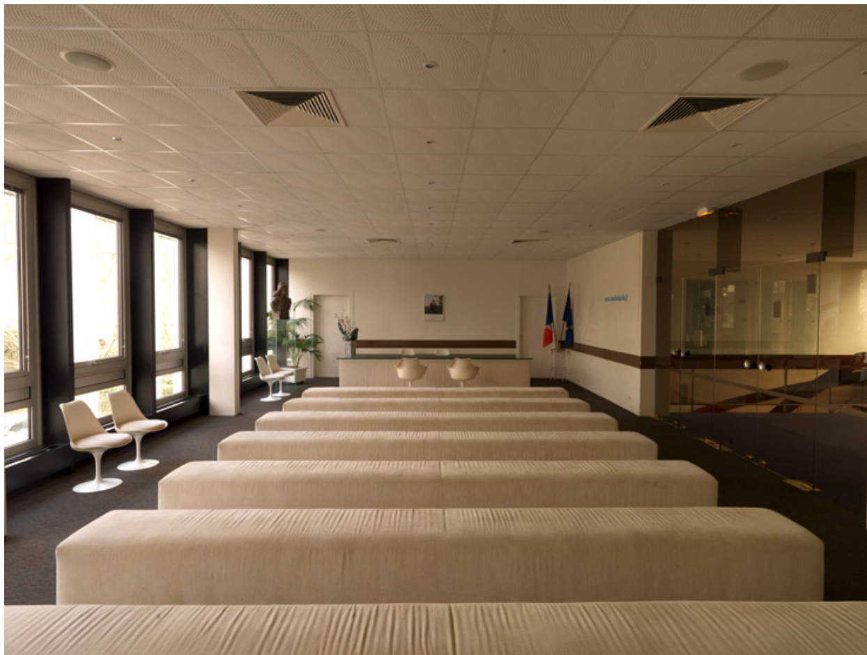
Vue actuelle de la salle des mariages.