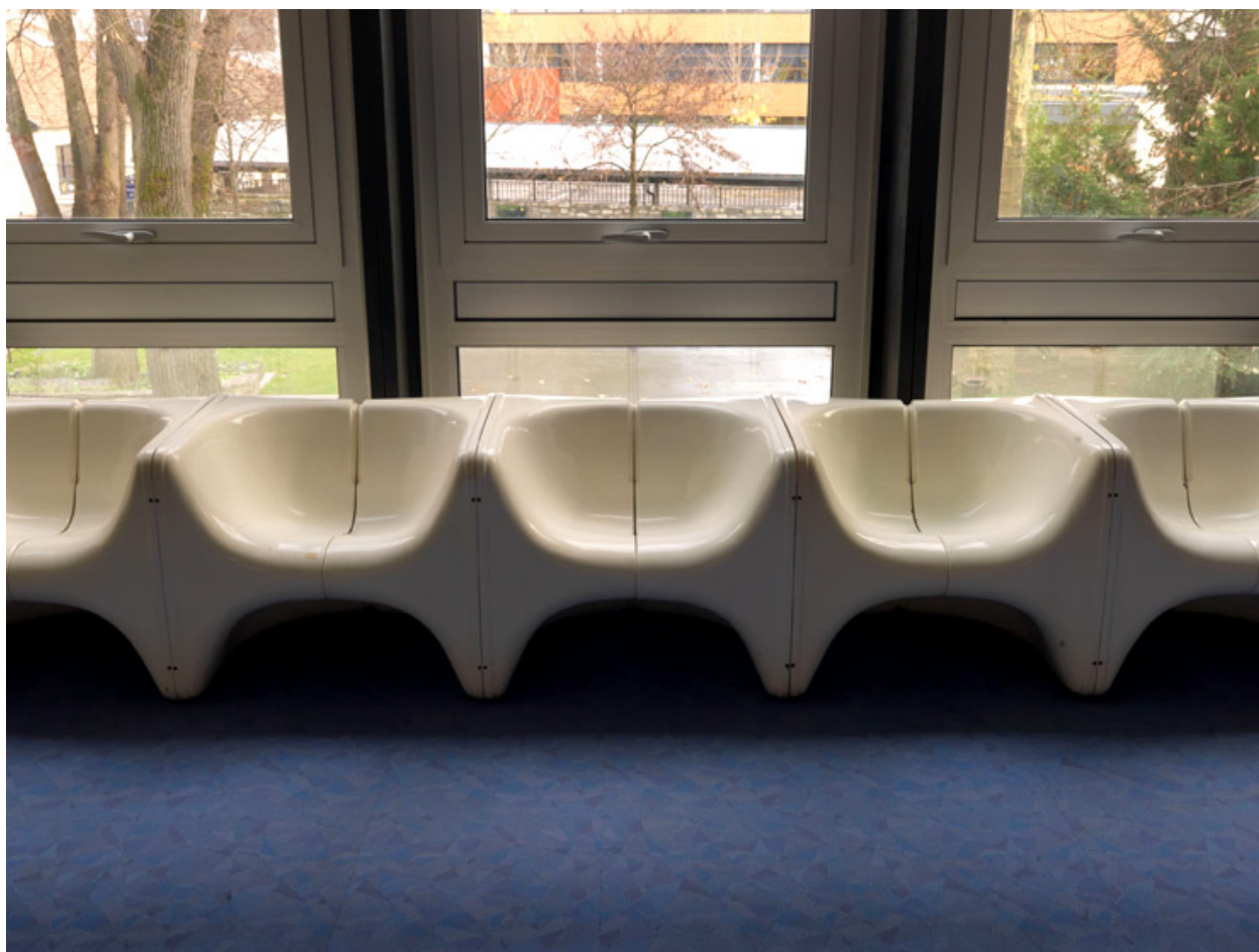
Sièges en plastique moulé dans le hall qui précède la salle des mariages et du conseil.