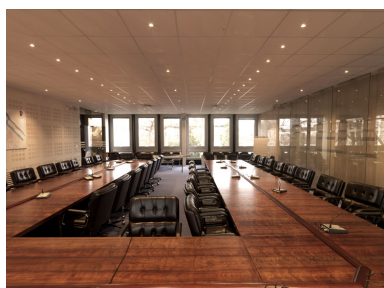
Vue actuelle de la salle du conseil dont le mobilier a été changé.