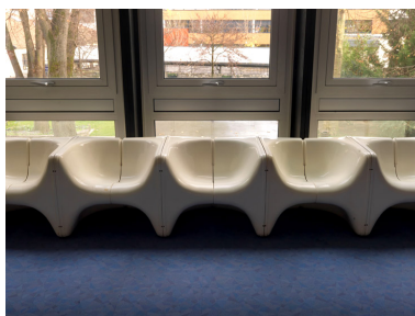
Sièges en plastique moulé dans le hall qui précède la salle des mariages et du conseil.