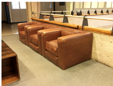
Ces fauteuils se trouvaient à l'origine dans le bureau du maire. IVR11_20157800612NUC4A