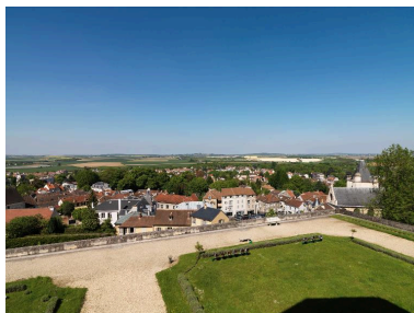
La vue sur le bourg d'Écouen (avec l'église Saint-Acceul à droite) et sur la plaine de France, depuis l'aile nord du château.

IVR11_20189500044NUC4A