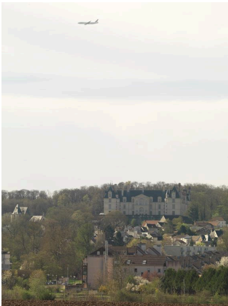
Le site de la butte d'Écouen, avec son couloir aérien menant vers les pistes de Roissy. Vue prise depuis la plaine de France.