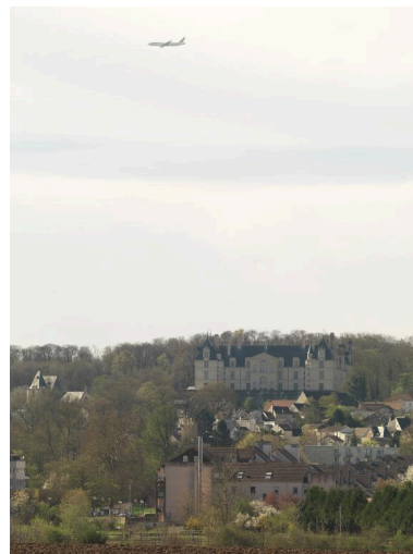
Le site de la butte d'Écouen, avec son couloir aérien menant vers les pistes de Roissy. Vue prise depuis la plaine de France.

Phot. Philippe Ayrault IVR11_20189500041NUC4A