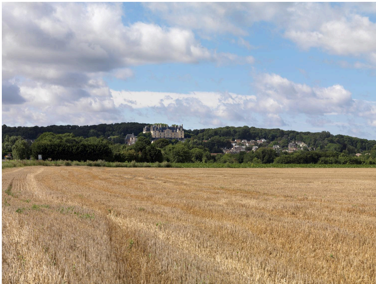
Le site de la butte d'Écouen, vu depuis la plaine de France, en été.