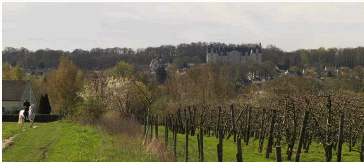
Vue panoramique sur le site de la butte d'Écouen, depuis la plaine de France, au printemps.