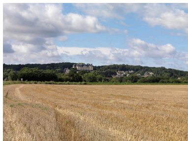
Le site de la butte d'Écouen, vu depuis la plaine de France, en été.

IVR11_20179500328NUC4A