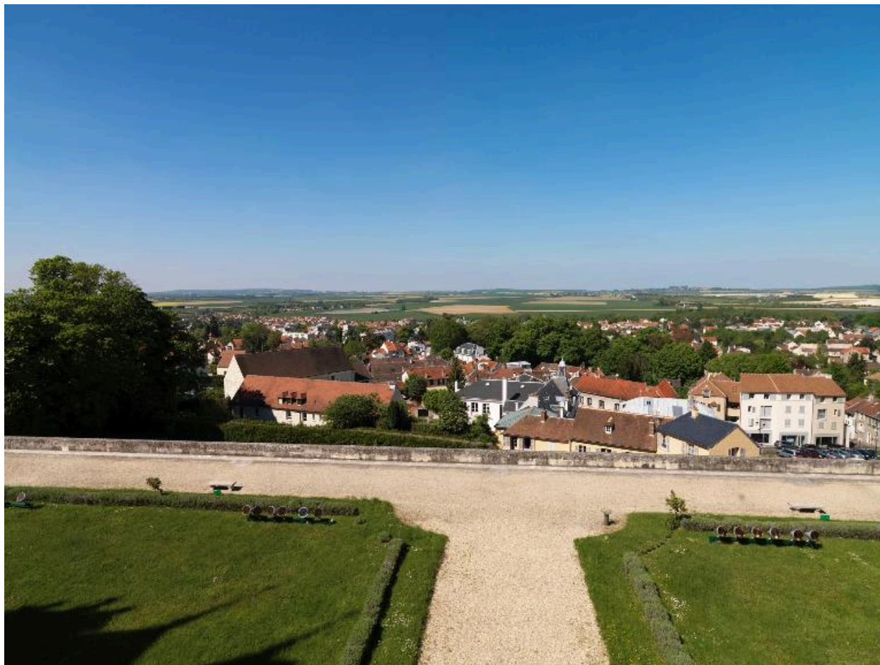
La vue sur le bourg d'Écouen (avec la mairie et la grange à dîmes) et sur la plaine de France, depuis l'aile nord du château.