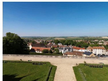
La vue sur le bourg d'Écouen (avec la mairie et la grange à dîmes) et sur la plaine de France, depuis l'aile nord du château.

IVR11_20179500093NUC4A