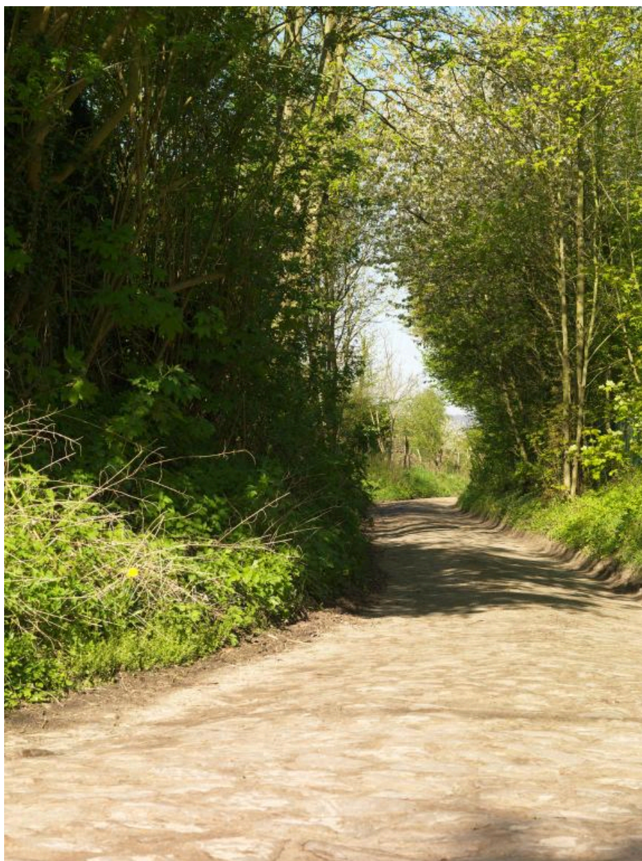
Le chemin du Buquet, ancienne route pavée au sud du bourg d'Écouen, dans la plaine de France.