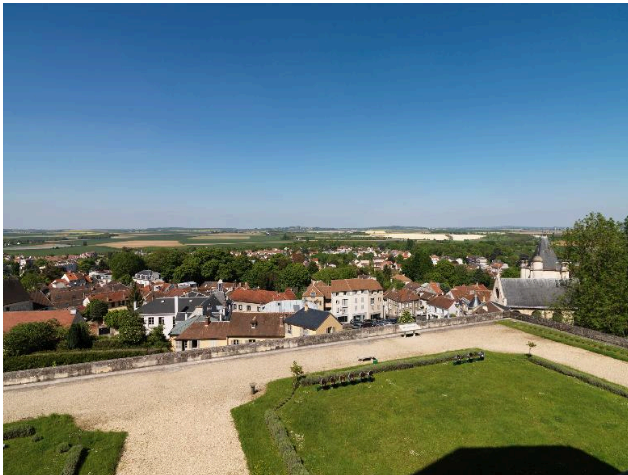
La vue sur le bourg d'Écouen (avec l'église Saint-Acceul à droite) et sur la plaine de France, depuis l'aile nord du château.