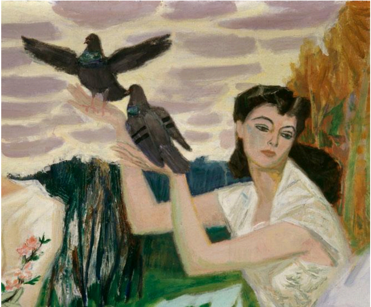
Détail de la toile marouflée intitulée "Le Couronnement du printemps", commandée en 1954 à Louis Berthommé-Saint-André pour orner le réfectoire.