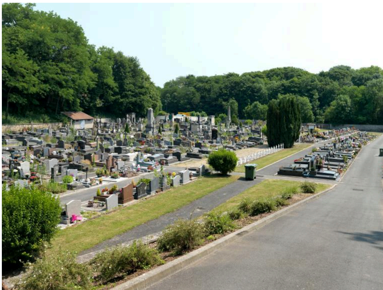
Vue d'ensemble, depuis le sud-ouest.