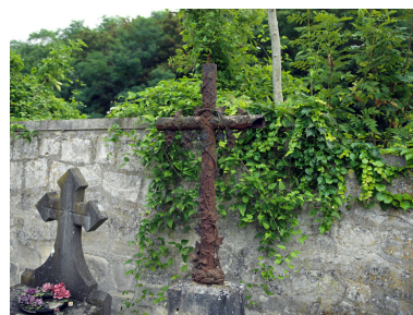
Vue d'une croix en fonte, le long du mur est. IVR11_20169500149NUC4A