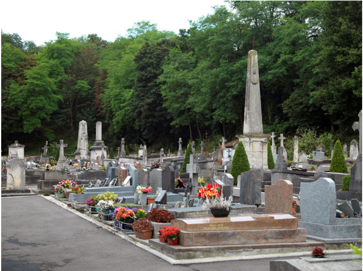
Vue d'ensemble, depuis l'est, avec l'obélisque élevé pour Eléonore Antheaume, ancien maire d'Ecouen, et dans le fond, le monument aux morts communal.