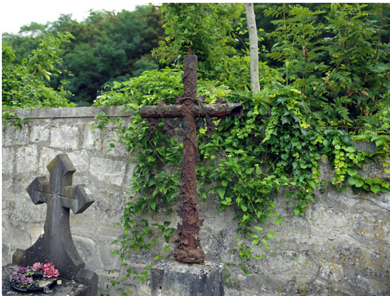
Vue d'une croix en fonte, le long du mur est.