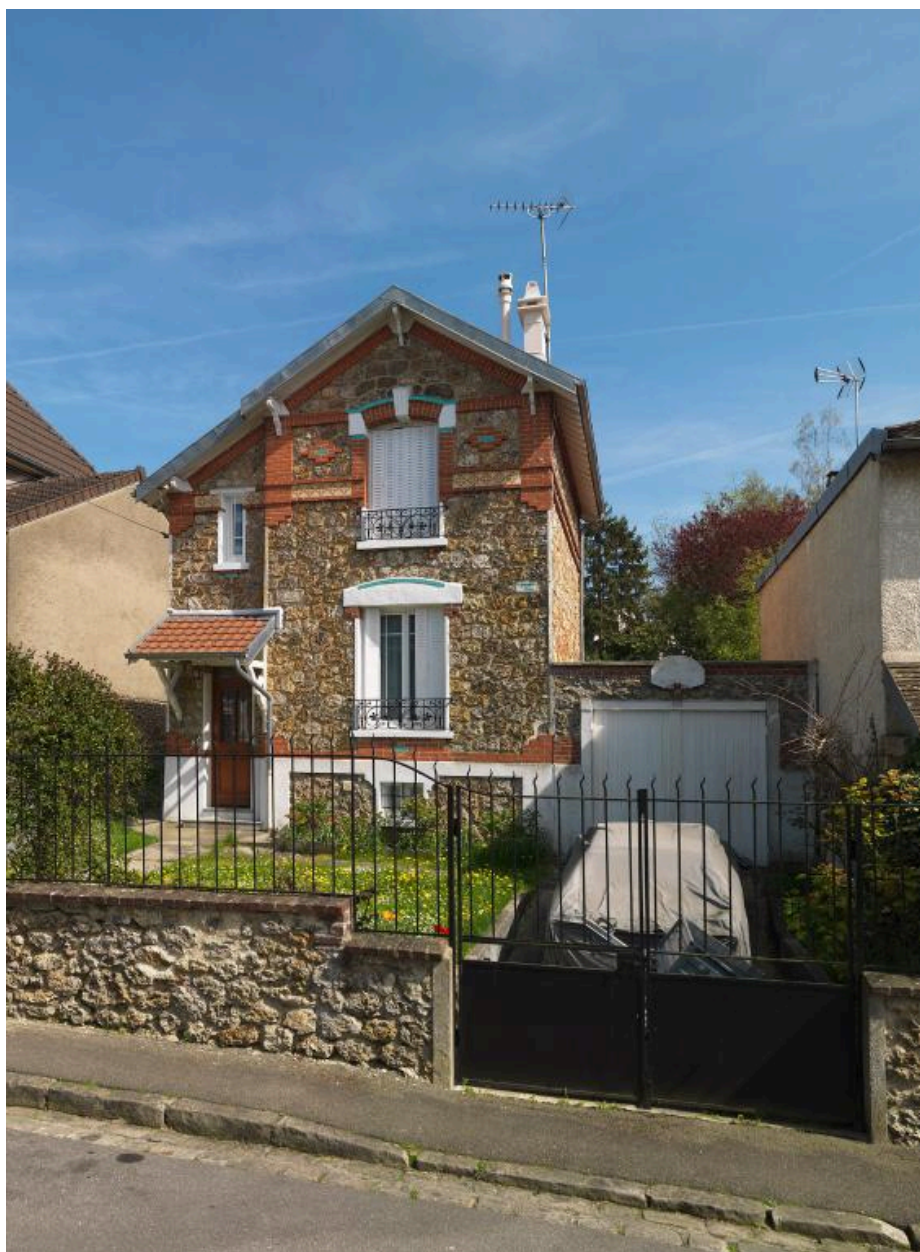
Pavillon 7, rue du Pré-Curé, construit par l'architecte écouennais Albert Bourgeois.