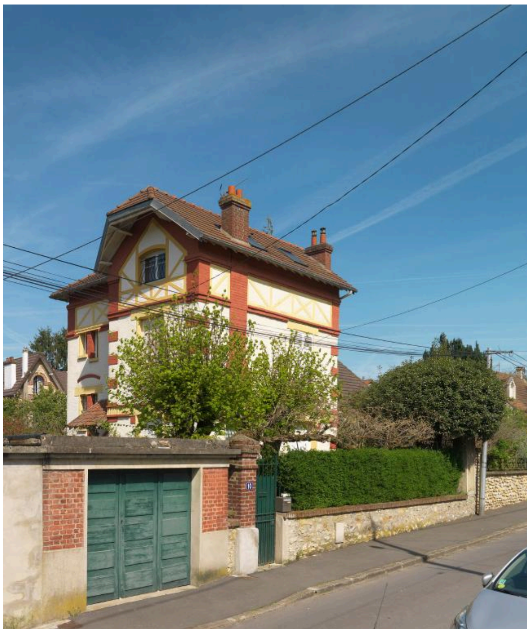
Maison "Mon désir" au 10, rue de la Résistance, construite par l'architecte écouennais Albert Bourgeois.