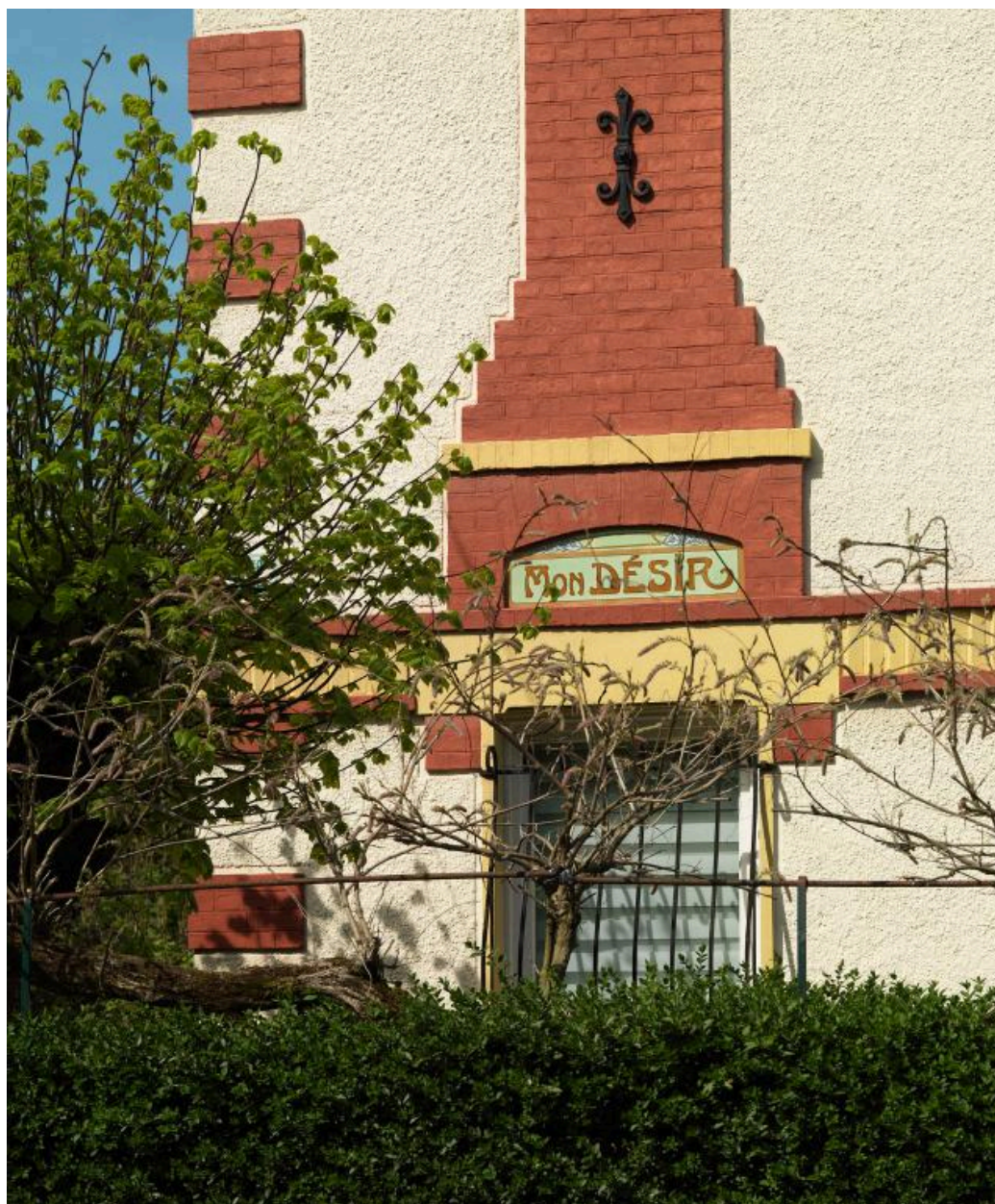
Détail de la plaque en céramique portant le nom de la maison 10, rue de la Résistance : "Mon désir."