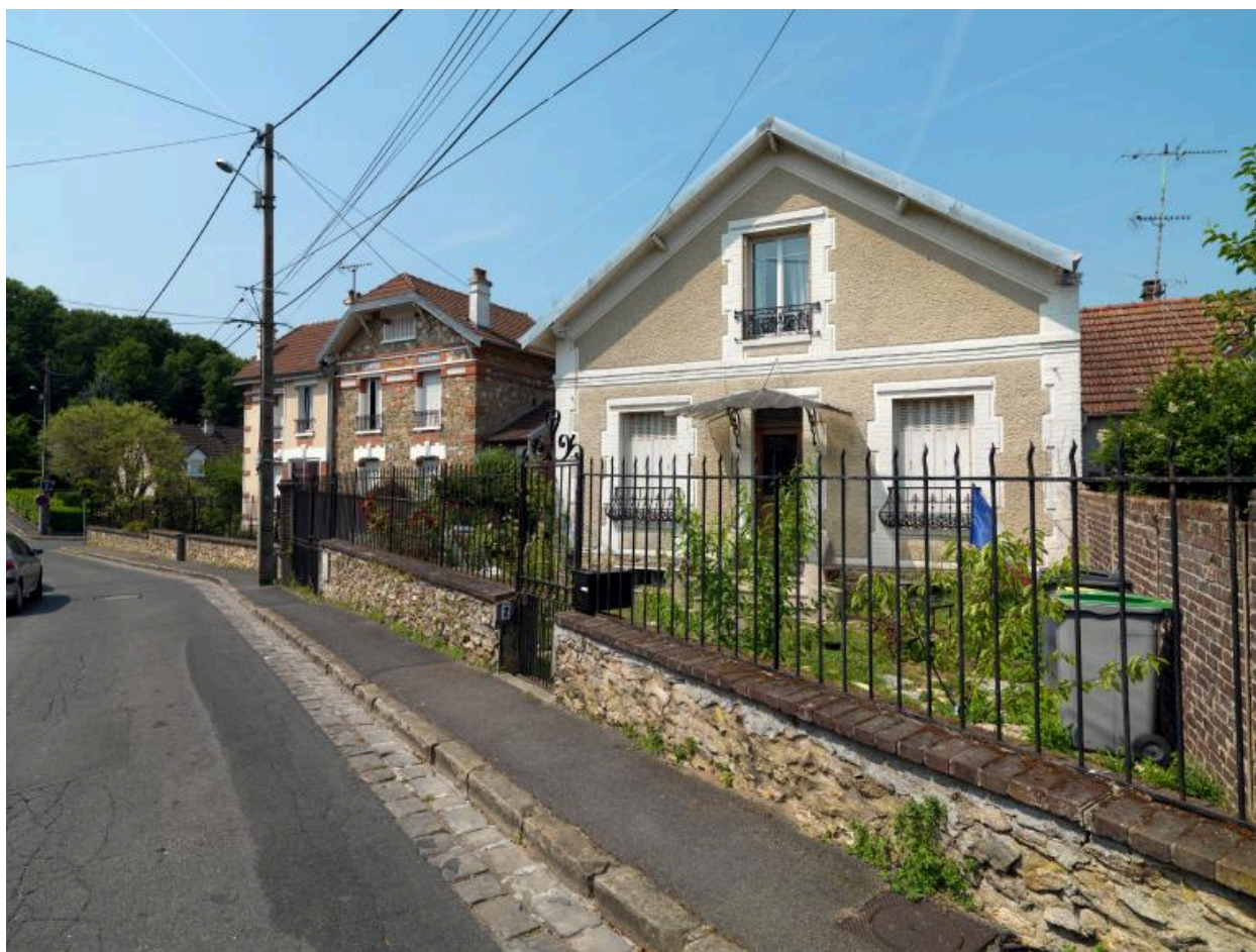
La rue du Pré-Curé : vue générale.