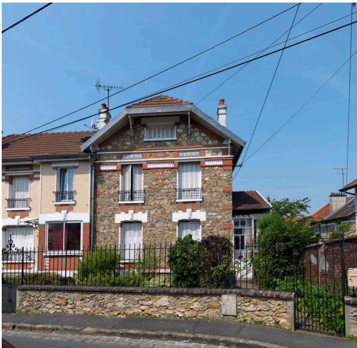
Maison 4, rue du Pré-Curé, construite par l'architecte écouennais Albert Bourgeois, 1er quart du XXe s.