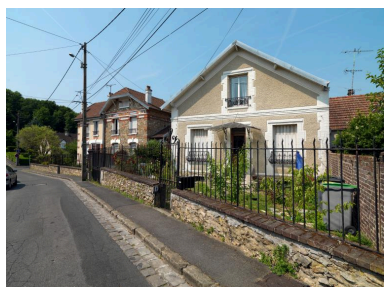
La rue du Pré-Curé : vue générale. IVR11_20179500316NUC4A