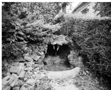
Un bassin en forme de petite grotte situé dans le parc.