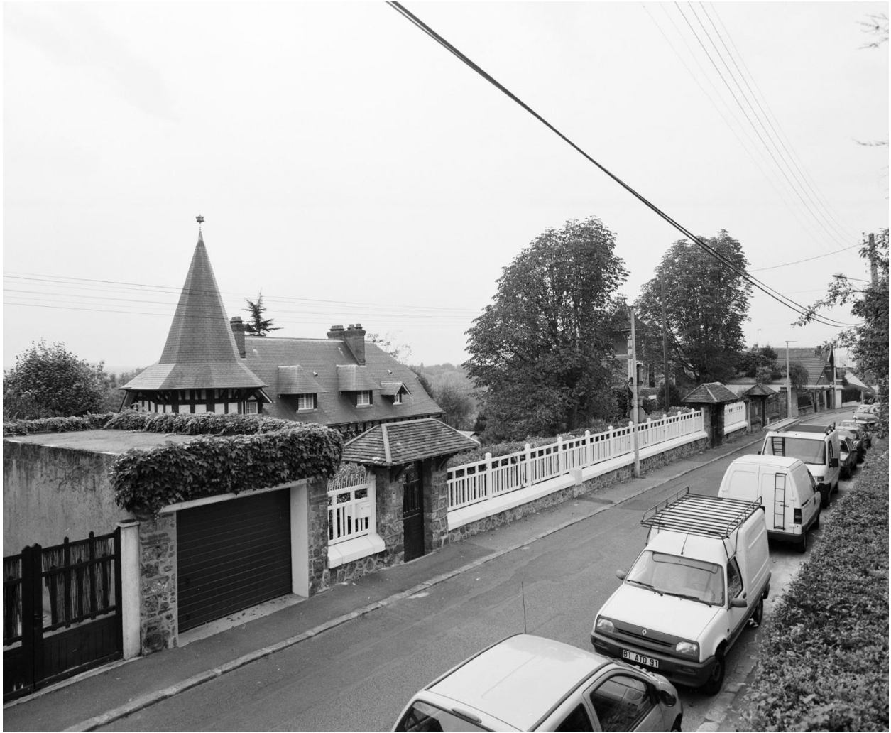
La maison derrière sa clôture percée de deux portes à chaperon couvert de tuiles.