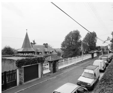
La maison derrière sa clôture percée de deux portes à chaperon couvert de tuiles. IVR11_20029101422X