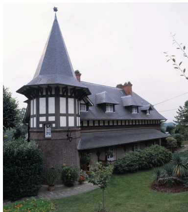
Vue d'ensemble. IVR11_20029101403XA