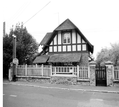
Vue d'ensemble depuis la rue de l'ancienne maison de gardien de la villa située au 106 ; elle forme aujourd'hui une autre propriété. IVR11_20029101421X