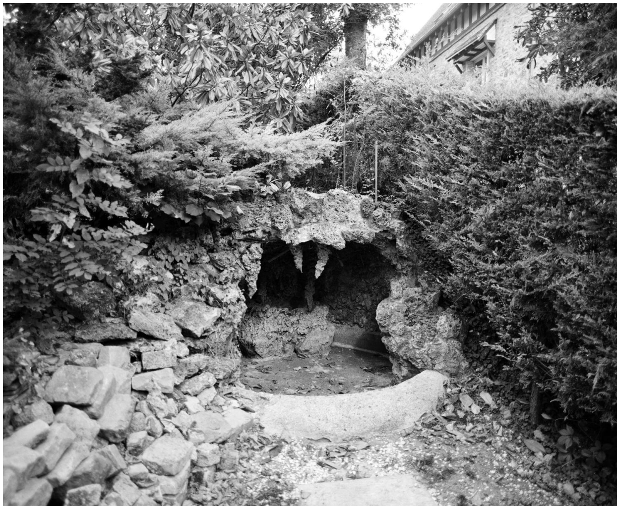
Un bassin en forme de petite grotte situé dans le parc.