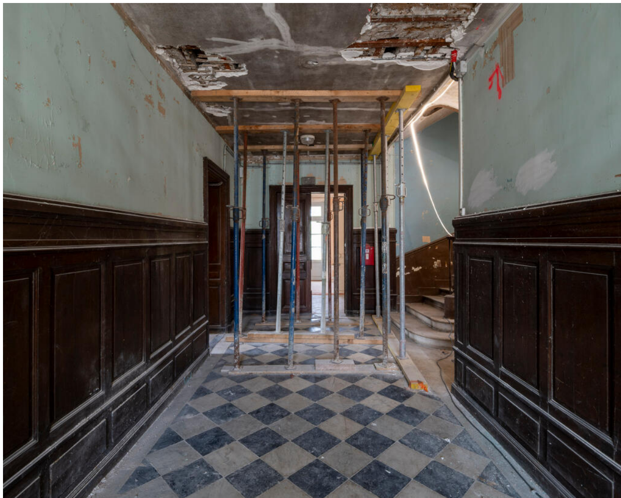
Le vestibule vu depuis l'entrée. Au fond, le grand salon ouvrant sur la terrasse et le parc.