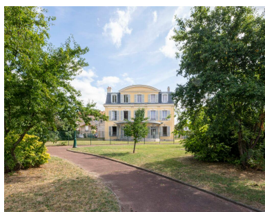
Vue générale depuis le parc, devenu jardin public. Maison Blanche était placé à l'extrémité est du domaine et dominait un vaste parc qui s'étendait à l'ouest, avant d'être loti dans les années 1930.

Phot. Philippe Ayrault IVR11_20239300554NUC4A