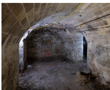
Les caves du château, qui remontent à la première implantation.