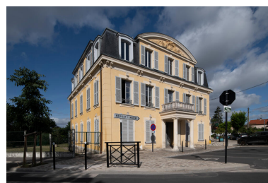
Vue de trois quarts, façades nord-est, donnant sur la place, et façade sud-est. IVR11_20239300545NUC4A