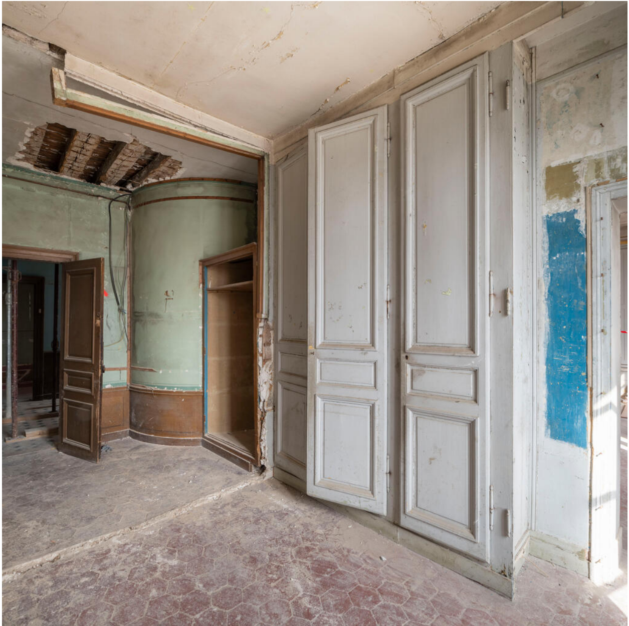
Premier étage, une chambre. Sur la gauche on aperçoit le palier.