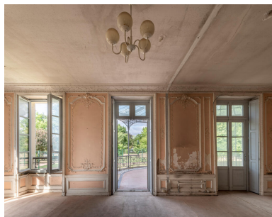
Le grand salon et son décor de gypserie. Les trois portes-fenêtres centrales ouvrent sur la terrasse. IVR11_20239300549NUC4A