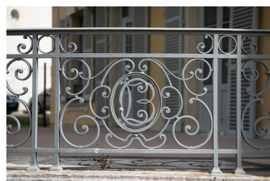
Détail du garde-corps de la terrasse.

Phot. Philippe Ayrault IVR11_20239300552NUC4A