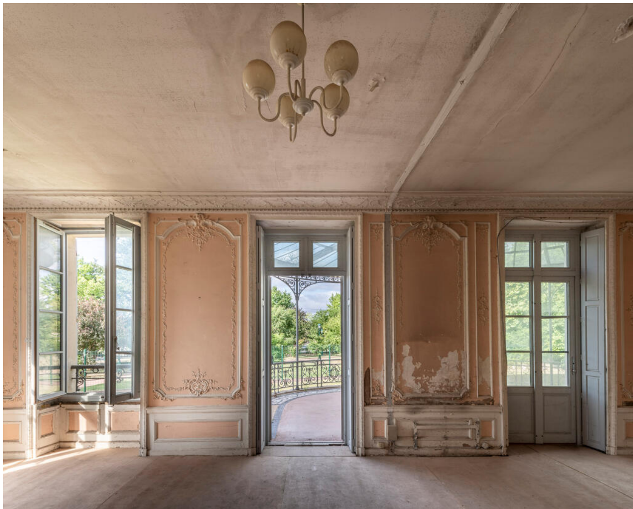
Le grand salon et son décor de gypserie. Les trois portes-fenêtres centrales ouvrent sur la terrasse.