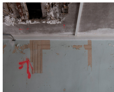
Premier étage. Sondage ayant mis au jour un encadrement de porte en trompe-l'oeil (non daté). IVR11_20239300561NUC4A