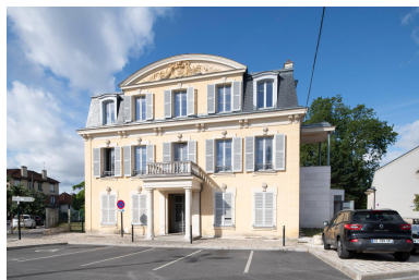
Façade principale, avec sur la gauche un escalier des années 1990. A l'origine, une aile plus basse occupait ce côté.

IVR11_20239300548NUC4A