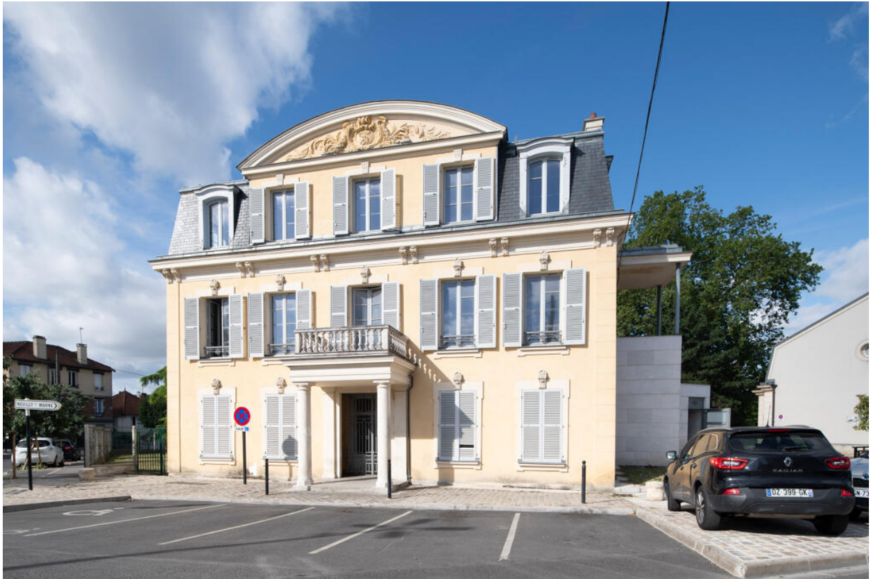
Façade principale, avec sur la gauche un escalier des années 1990. A l'origine, une aile plus basse occupait ce côté.