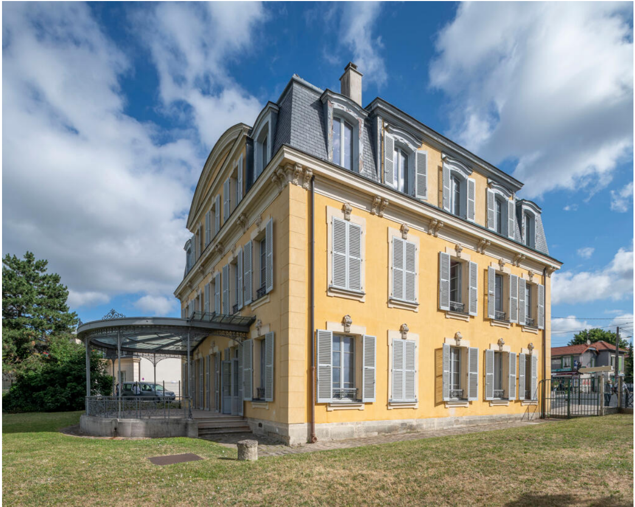
Façade latérale sud-est, et façade sud-ouest avec sa terrasse et sa marquise, construite par les Cartier-Bresson.