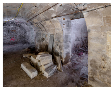
Caves du château.