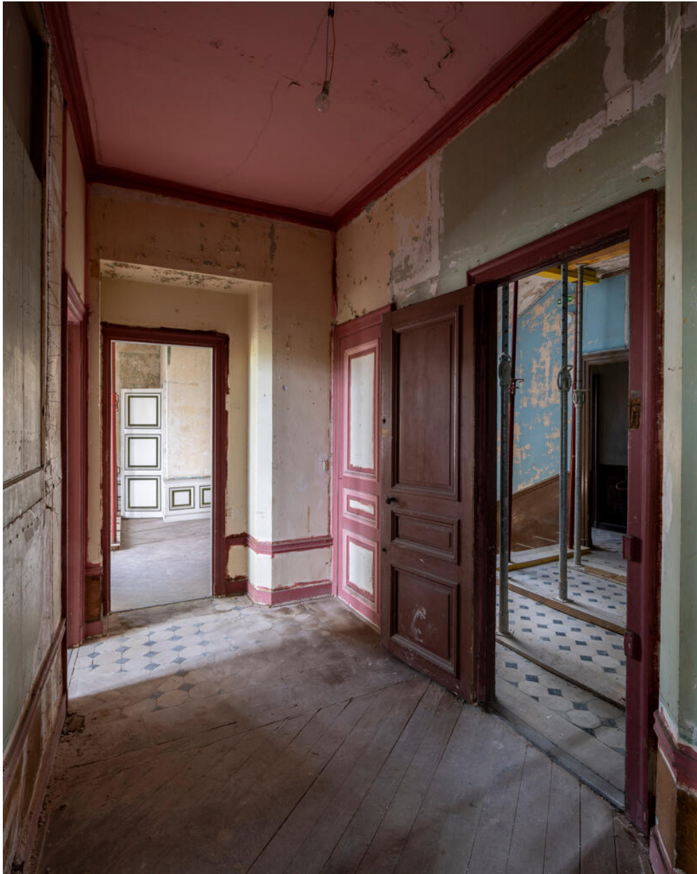
Au premier étage, enfilade de pièces. Sur la droite, le premier palier.