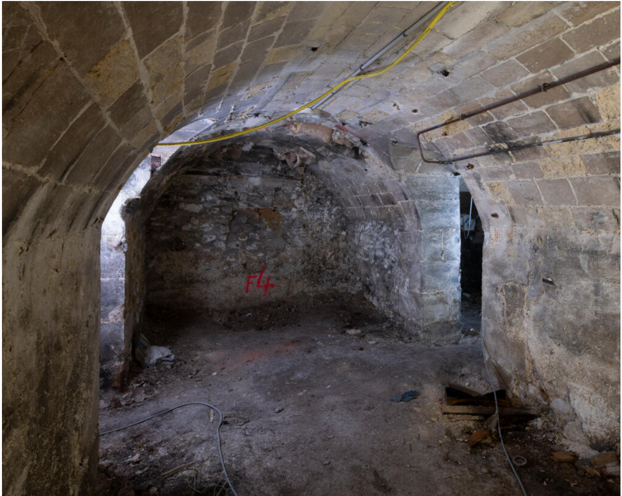
Les caves du château, qui remontent à la première implantation.