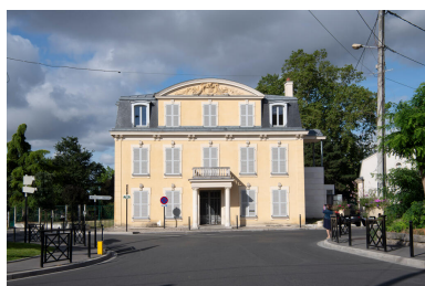
Vue générale, depuis la place des fêtes. Les abords sont désormais entièrement dégagés mais la propriété était close de murs, devancée par une cour, fermée par une grille qui ouvrait sur le village.