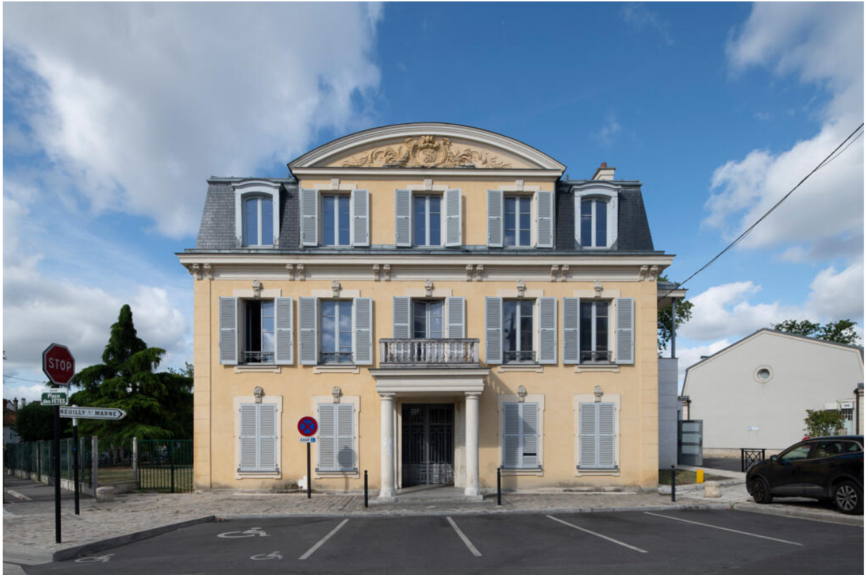
Vue générale de la façade principale.