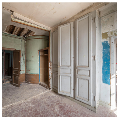
Premier étage, une chambre. Sur la gauche on aperçoit le palier. IVR11_20239300558NUC4A