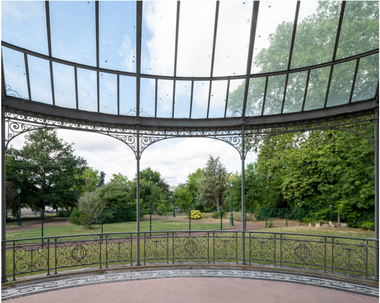
La terrasse, orientée sud-ouest, décorée au chiffre des Cartier-Bresson.