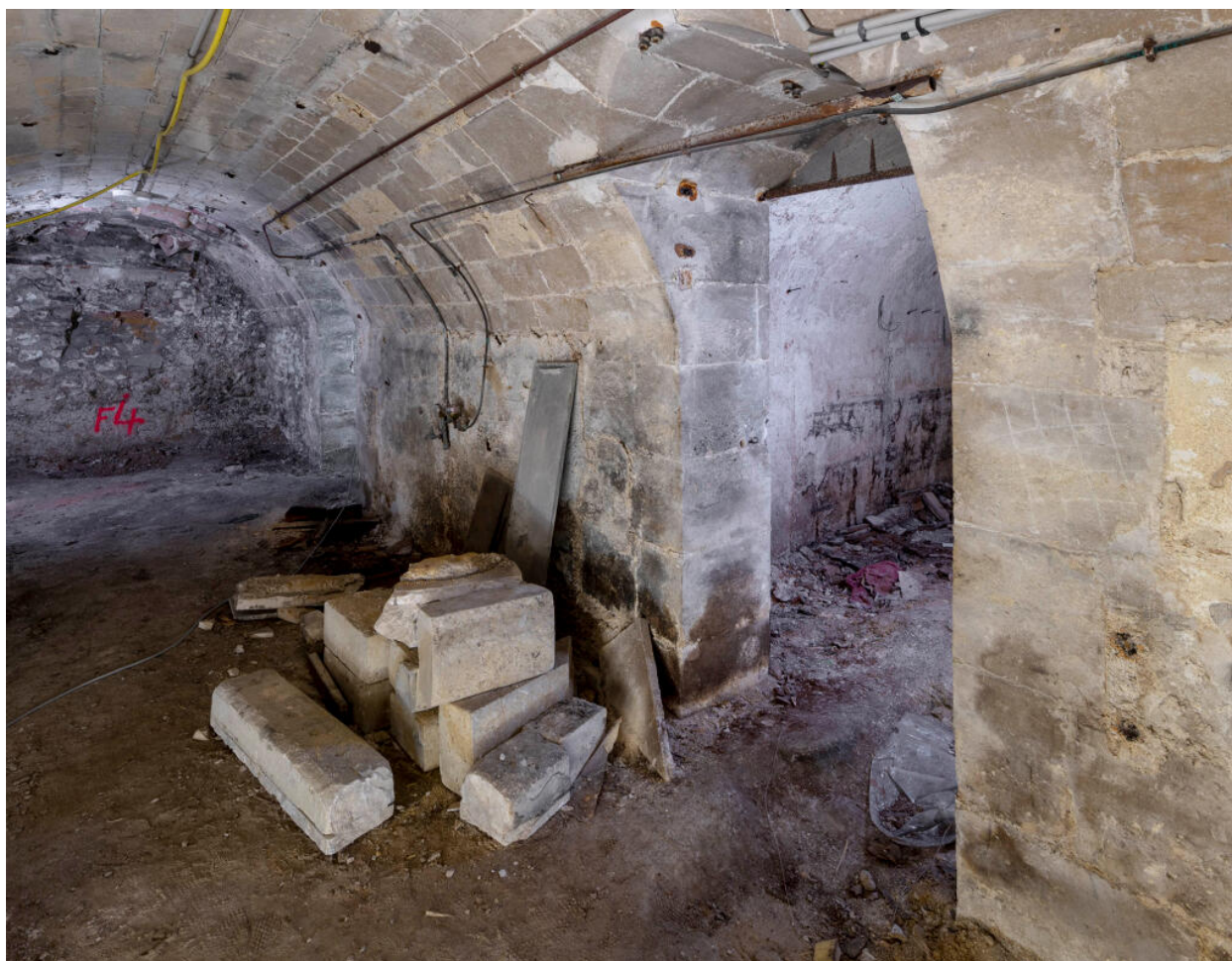
Caves du château.