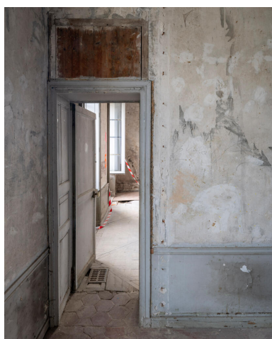
Premier étage. Deux chambres contigües donnant sur la place