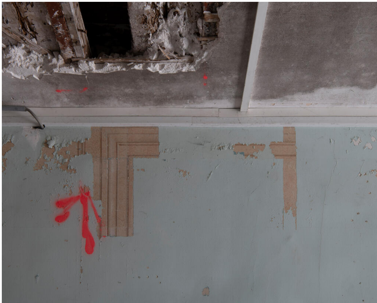
Premier étage. Sondage ayant mis au jour un encadrement de porte en trompe-l'oeil (non daté).