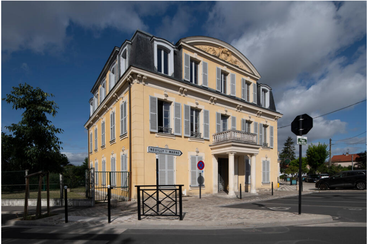
Vue de trois quarts, façades nord-est, donnant sur la place, et façade sud-est.