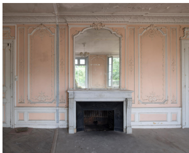
La cheminée du grand salon en marbre blanc. IVR11_20239300550NUC4A