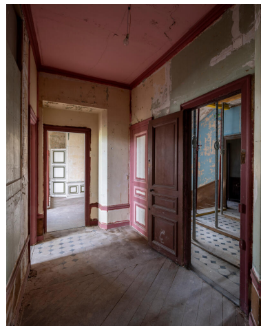
Au premier étage, enfilade de pièces. Sur la droite, le premier palier.