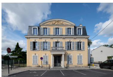
Vue générale de la façade principale. IVR11_20239300547NUC4A