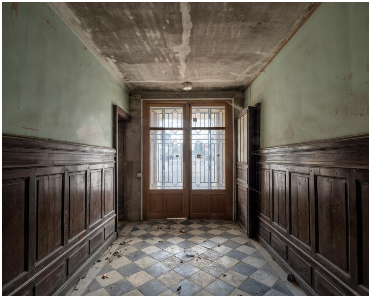
La double porte d'entrée, qui ouvre sur un vestibule à boiseries, tout en longueur.