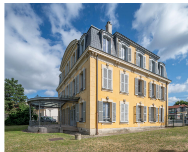
Façade latérale sud-est, et façade sud-ouest avec sa terrasse et sa marquise, construite par les Cartier-Bresson.

Phot. Philippe Ayrault IVR11_20239300564NUC4A