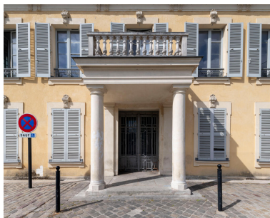
Détail du perron, construit probablement dans la deuxième moitié du XIXe s., par les Cartier-Bresson ou par les Teutsch.

IVR11_20239300548NUC4A