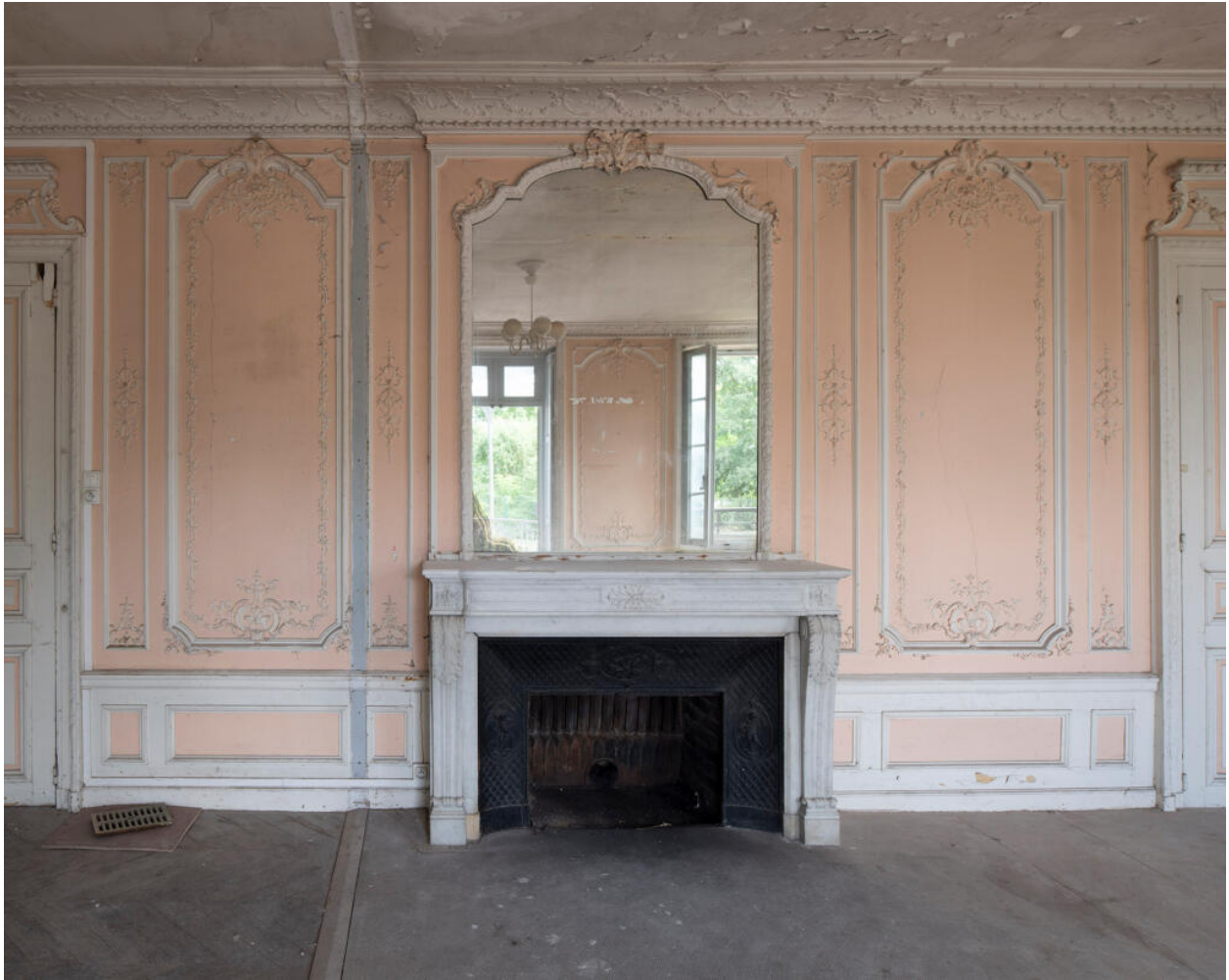
La cheminée du grand salon en marbre blanc.