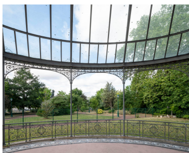
La terrasse, orientée sud-ouest, décorée au chiffre des Cartier-Bresson.

Phot. Philippe Ayrault IVR11_20239300563NUC4A