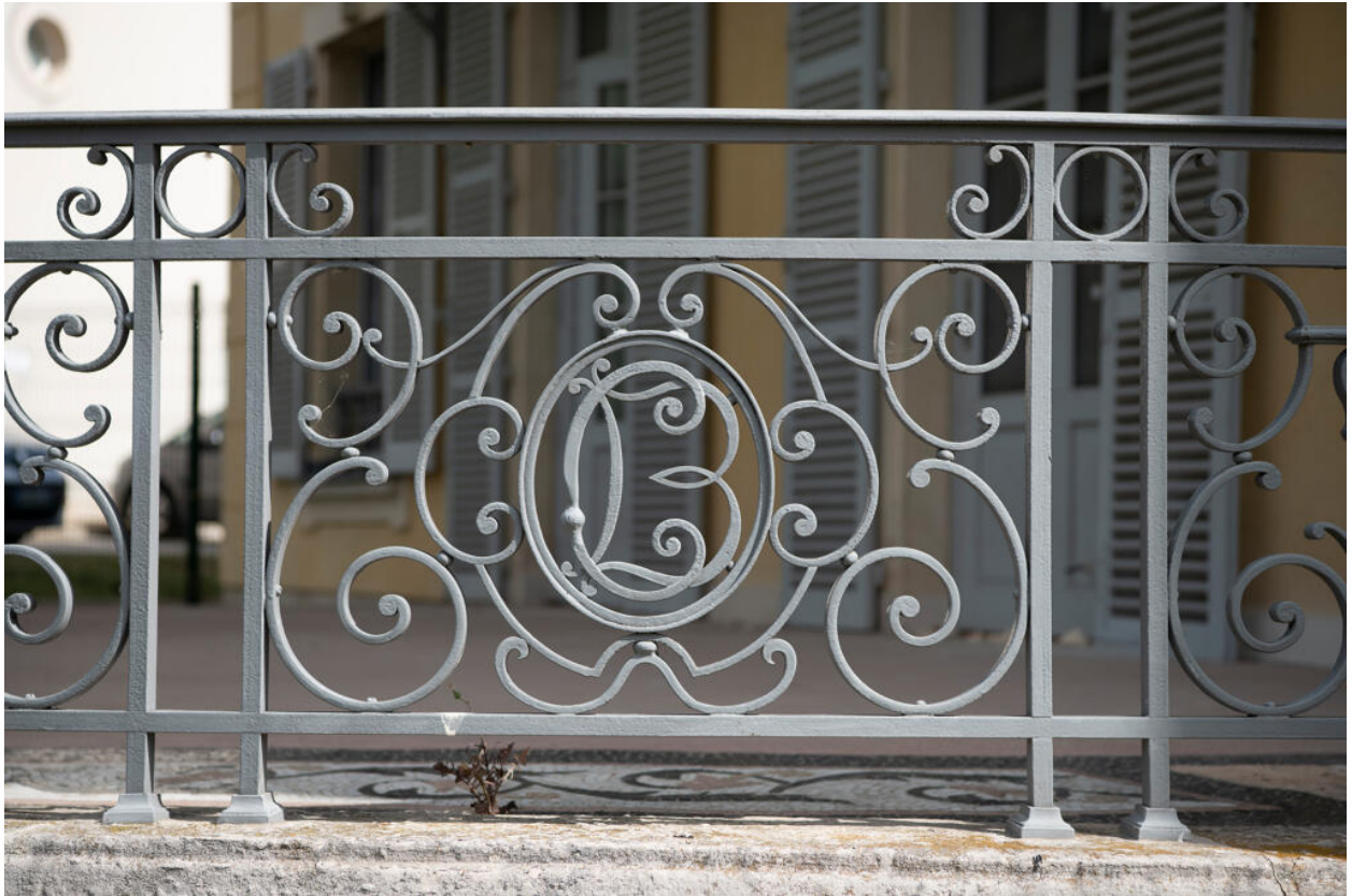
Détail du garde-corps de la terrasse.