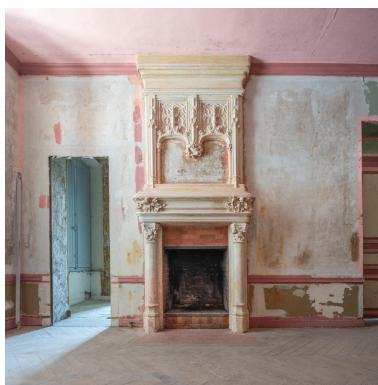
Extraordinaire cheminée néo-gothique dans une chambre de l'étage, côté est. Les riches remplages du manteau surmontent un linteau encadré de figures d'enfants accompagnés l'un d'un chien, l'autre d'un bouc, dans un décor de feuillages. Les chapiteaux des jambages sont ornés de dragons. IVR11_20239300488NUC4A