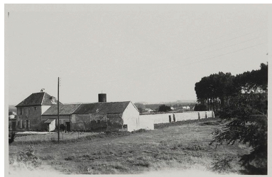
Vestiges de la léproserie, photographie ancienne. Photographie, 19e siècle.