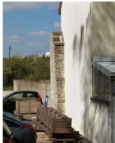
Ce contrefort est l'ultime vestige subsistant de la léproserie aujourd'hui.