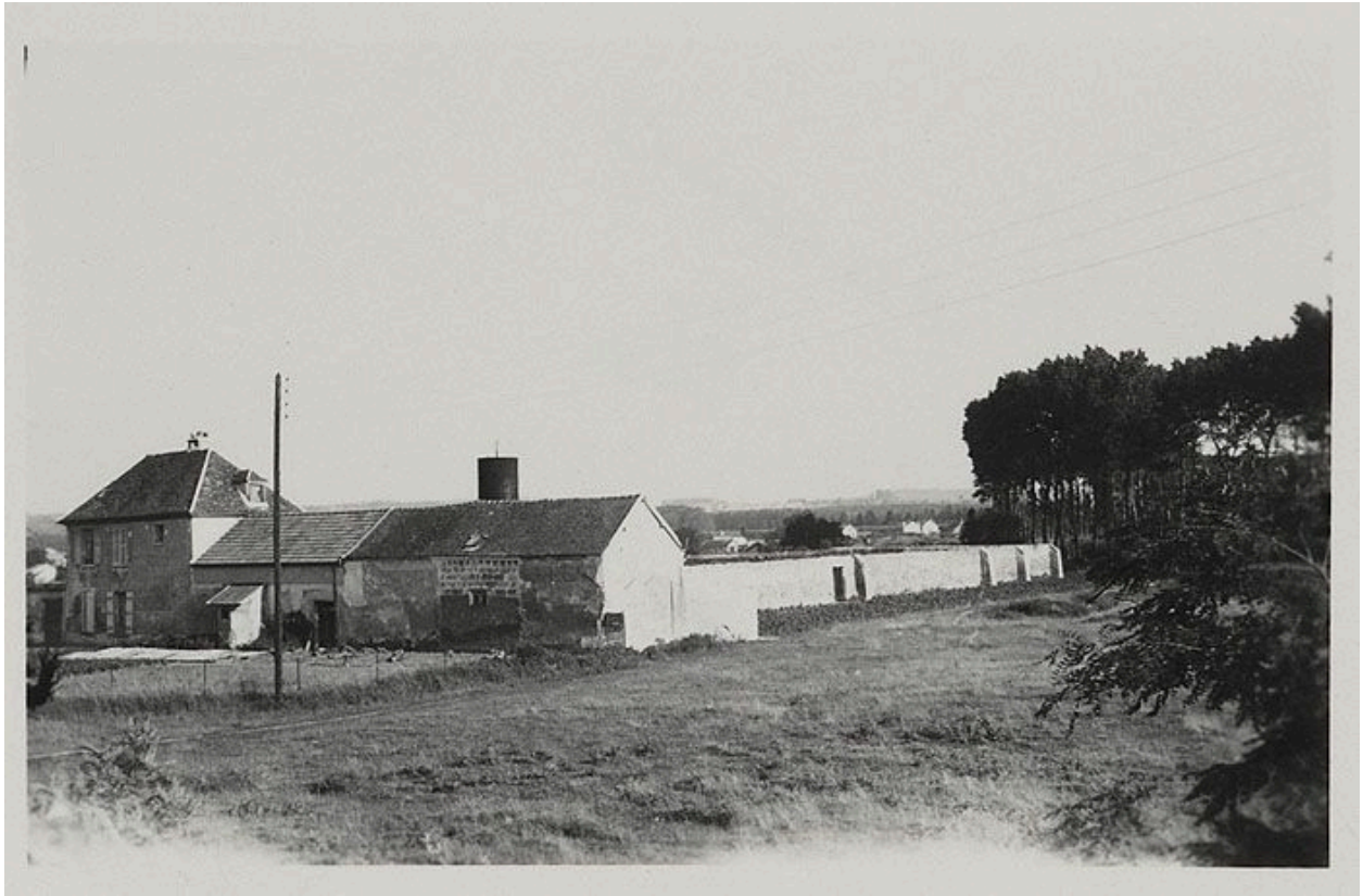
Vestiges de la léproserie, photographie ancienne. Photographie, 19e siècle.