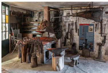
La forge du Musée de l'outil.