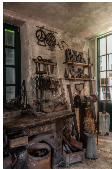
Détail de la forge du Musée de l'outil.