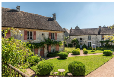
Vue générale depuis le sud-ouest. IVR11_20249500094NUC4A