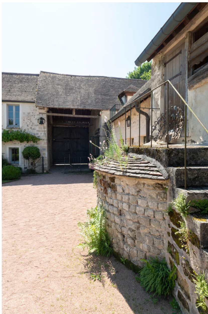
Vue de la porte charretière depuis l'extrémité ouest de la cour.