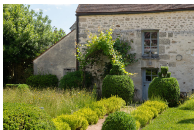
Détail du bâtiment fermant la cour à l'ouest. IVR11_20249500110NUC4A