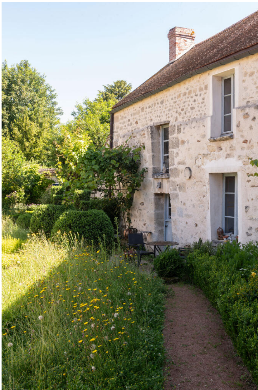
Détail du bâtiment fermant la cour à l'ouest.