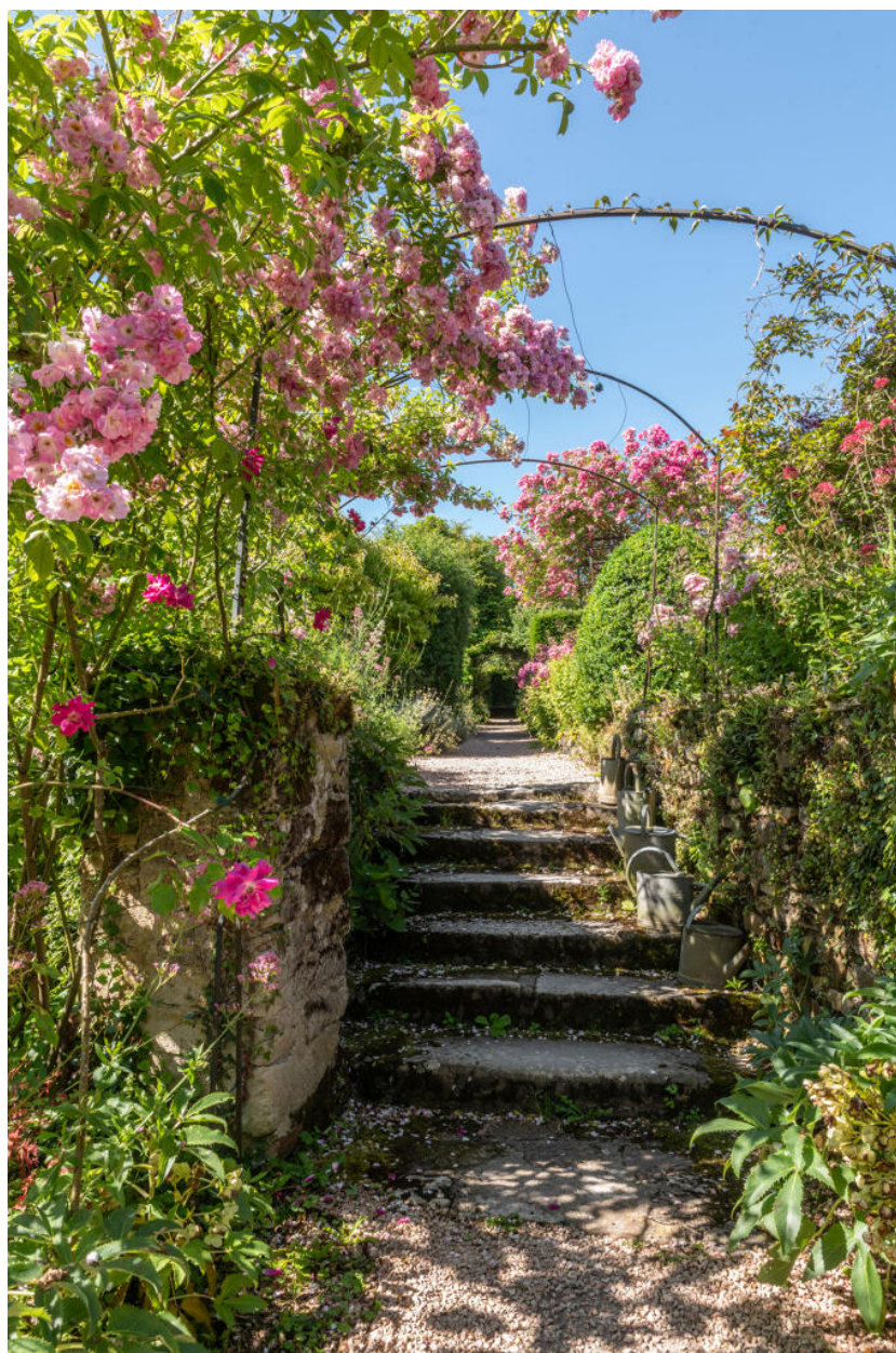
Le jardin du Musée de l'outil.