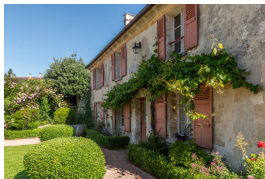
Vue de la façade sud de l'ancien presbytère, depuis le sud-est. IVR11_20249500090NUC4A