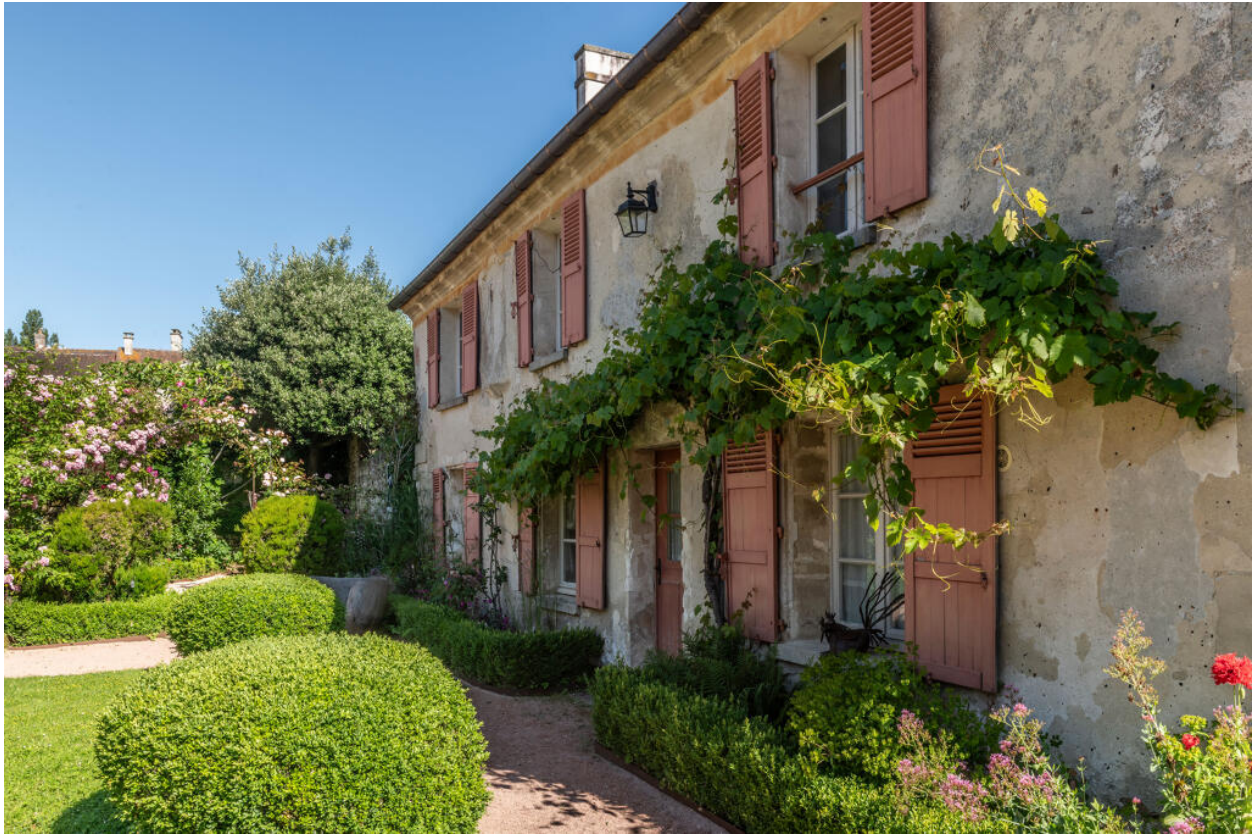
Vue de la façade sud de l'ancien presbytère, depuis le sud-est.