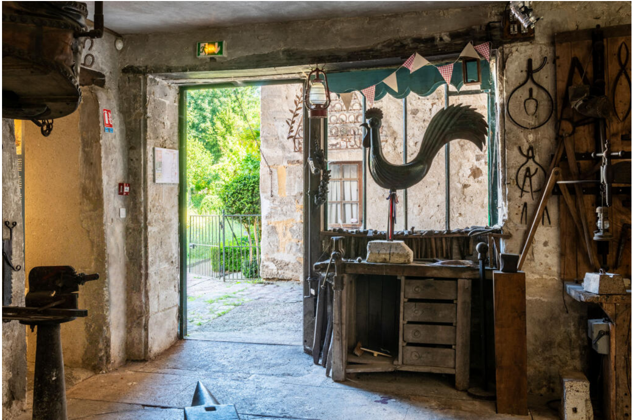
Vue depuis la forge du Musée de l'outil.