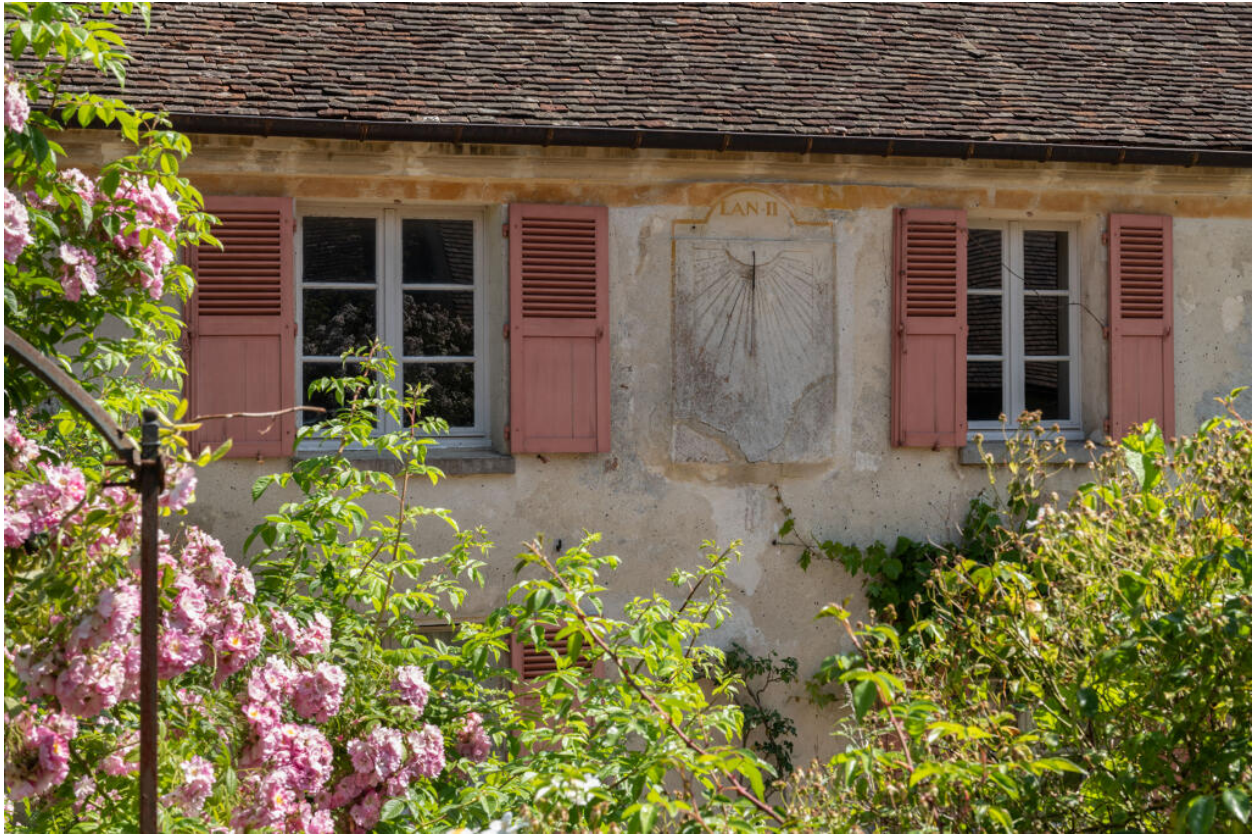
Détail de la façade sud de l'ancien presbytère.