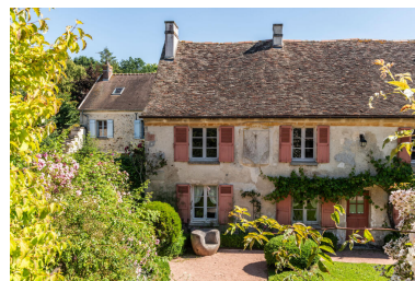
Vue de la façade sud de l'ancien presbytère. IVR11_20249500091NUC4A