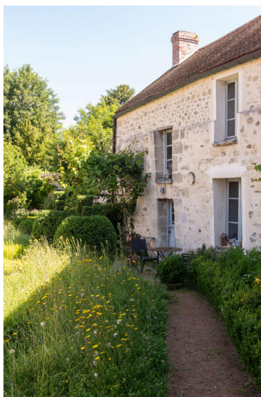
Détail du bâtiment fermant la cour à l'ouest.