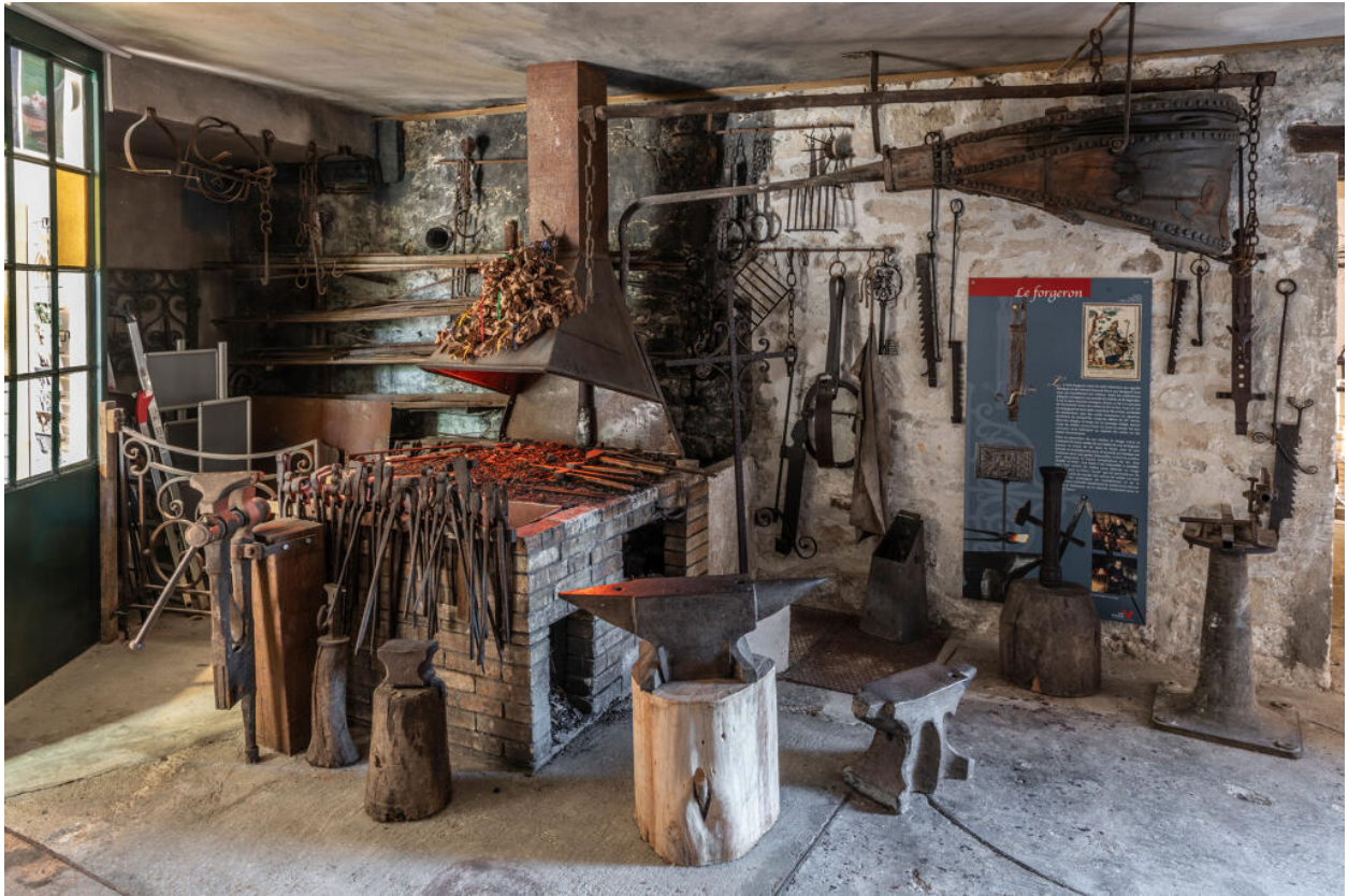
La forge du Musée de l'outil.