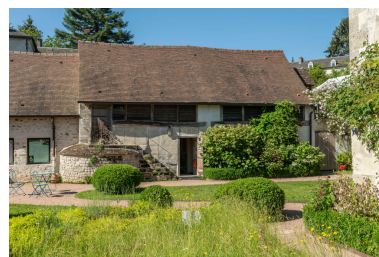
Partie ouest du bâtiment en L abritant le Musée de l'outil, depuis le nord. IVR11_20249500095NUC4A