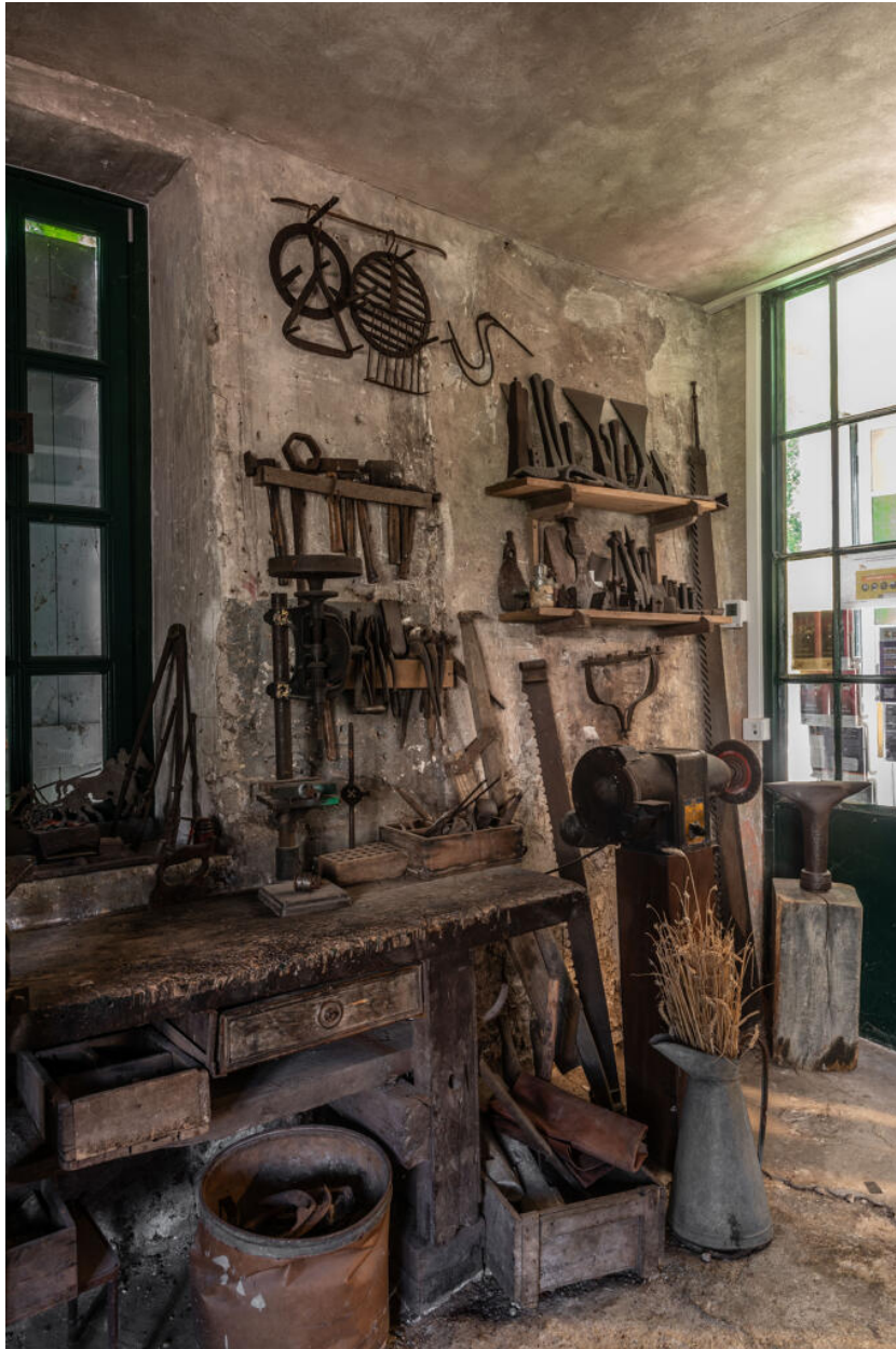
Détail de la forge du Musée de l'outil.