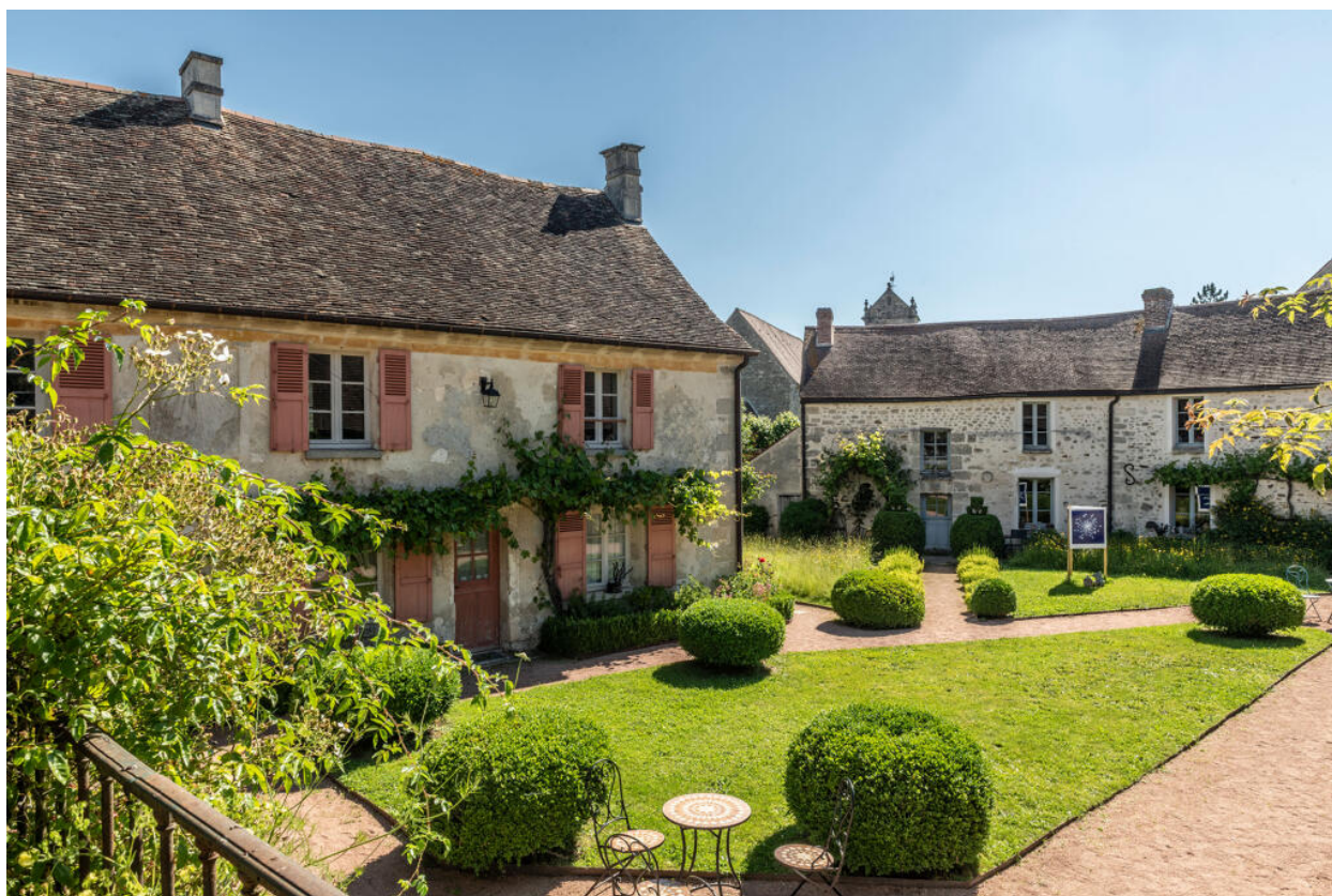
Vue générale depuis le sud-ouest.