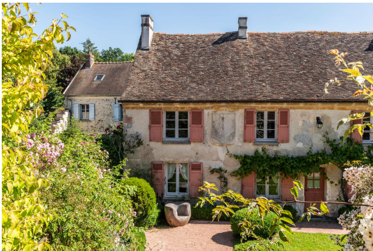
Vue de la façade sud de l'ancien presbytère.