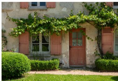
Détail de la façade sud de l'ancien presbytère. IVR11_20249500093NUC4A