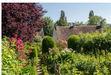
Le jardin du Musée de l'outil. IVR11_20249500122NUC4A