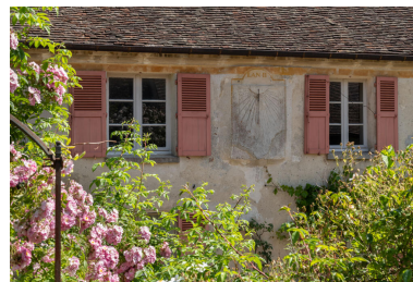
Détail de la façade sud de l'ancien presbytère.