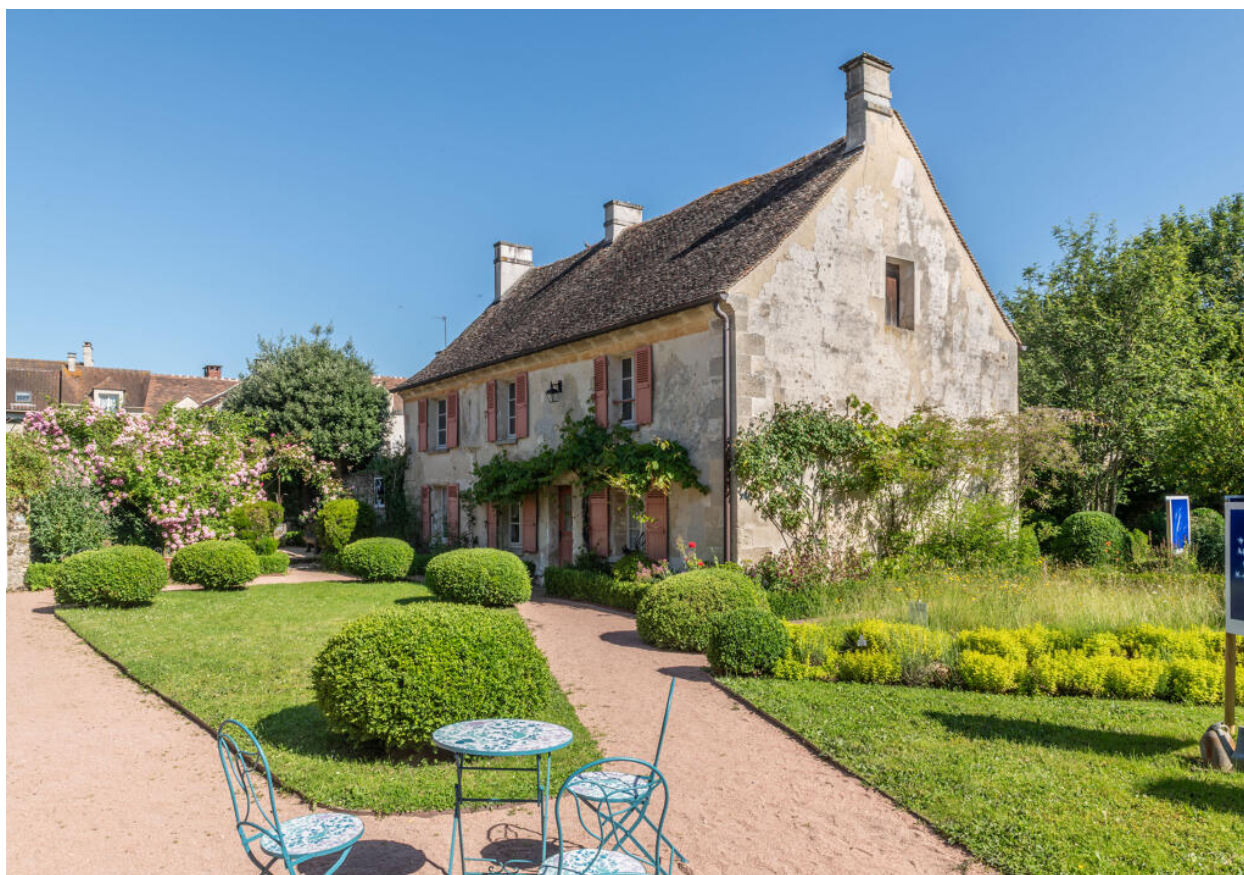
Vue générale de l'ancien presbytère, depuis le sud-est.