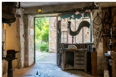
Vue depuis la forge du Musée de l'outil.