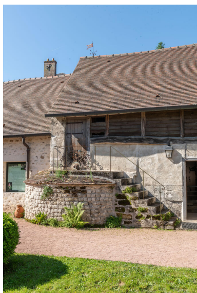
Vue rapprochée de la partie ouest du bâtiment en L. IVR11_20249500096NUC4A