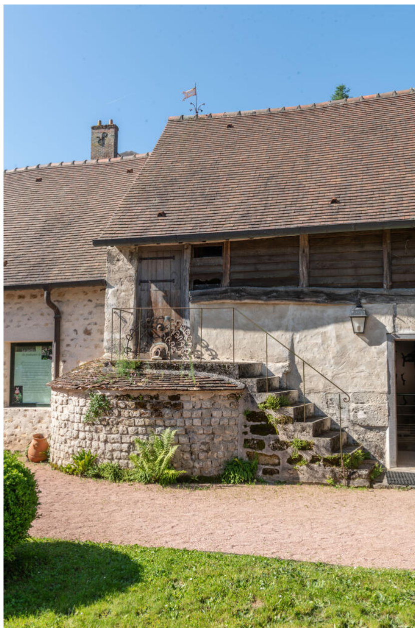
Vue rapprochée de la partie ouest du bâtiment en L.