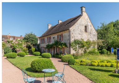
Vue générale de l'ancien presbytère, depuis le sud-est. IVR11_20249500087NUC4A