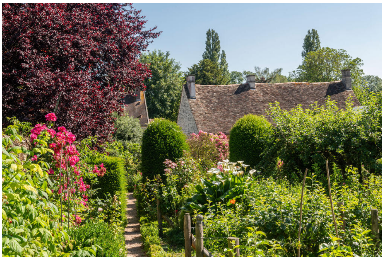
Le jardin du Musée de l'outil.