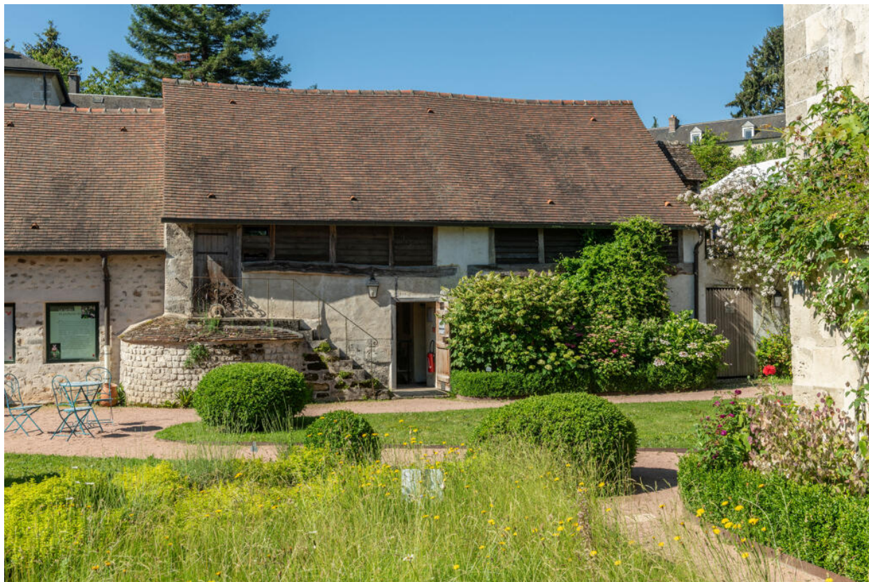
Partie ouest du bâtiment en L abritant le Musée de l'outil, depuis le nord.