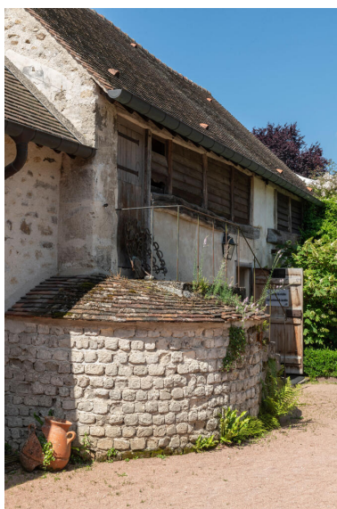
Vue rapprochée de la partie ouest du bâtiment en L. IVR11_20249500098NUC4A