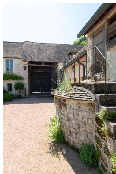
Vue de la porte charretière depuis l'extrémité ouest de la cour. IVR11_20249500097NUC4A