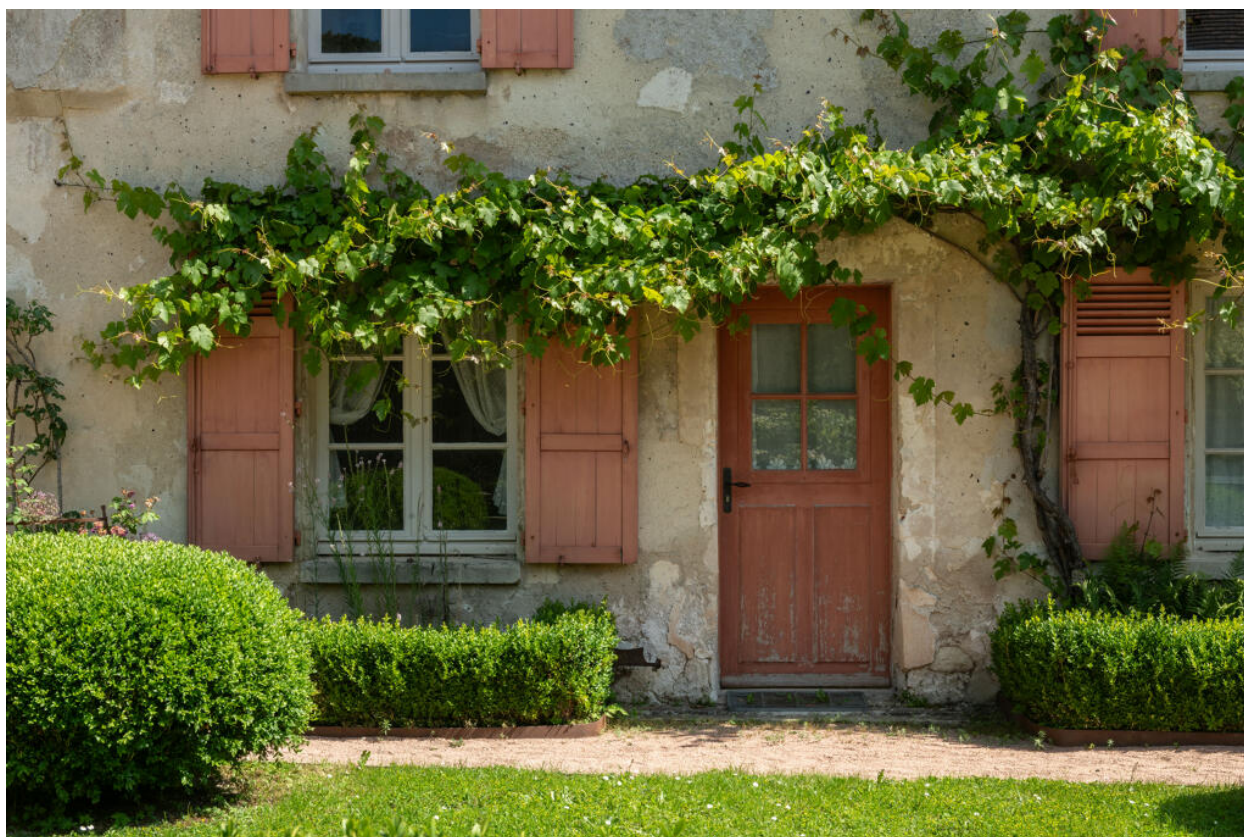
Détail de la façade sud de l'ancien presbytère.