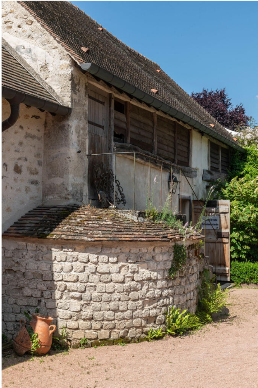
Vue rapprochée de la partie ouest du bâtiment en L.