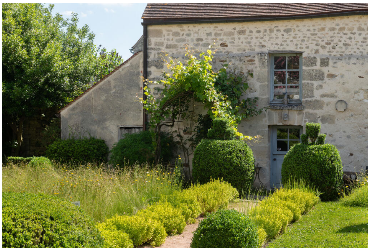
Détail du bâtiment fermant la cour à l'ouest.