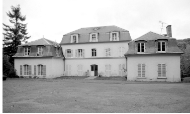
Vue d'ensemble. IVR11_20007800728X