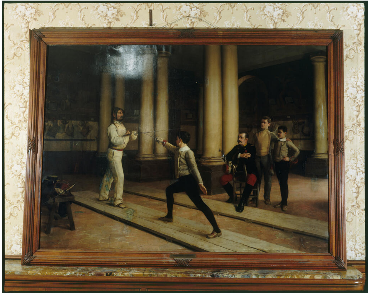
Vue d'ensemble. Peinture : Leçon d'escrime