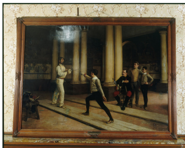
Vue d'ensemble. Peinture : Leçon d'escrime