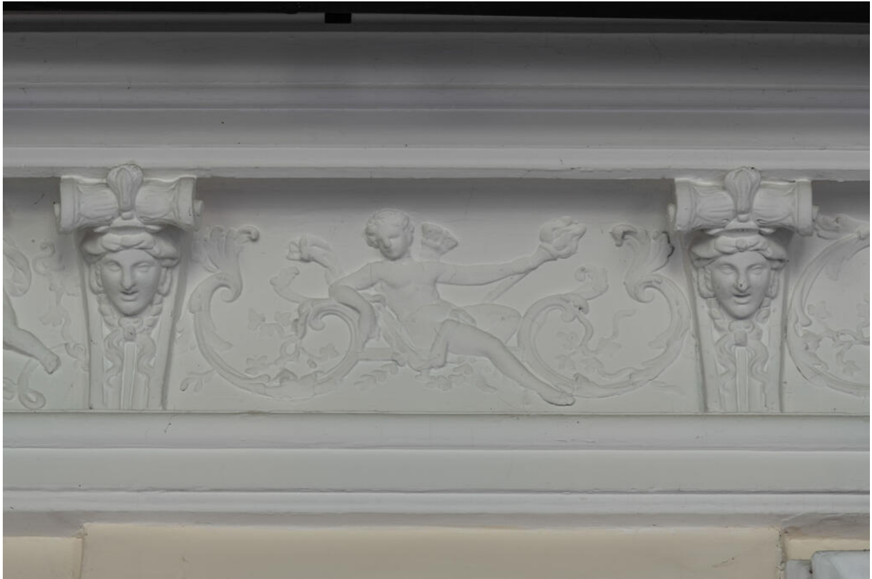
Décor de la corniche de la galerie : putto entre deux consoles à têtes humaines