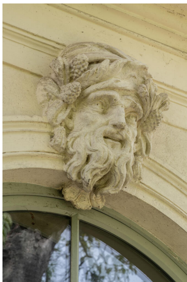
Mascaron à l'extérieur de la galerie : tête de vieillard IVR11_20249200058NUC4A