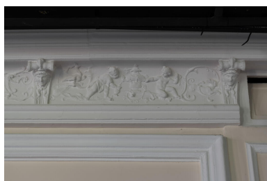
Décor de la corniche de la galerie : putti tirant de l'eau IVR11_20249200084NUC4A