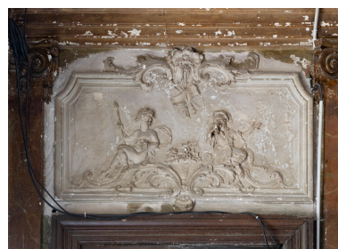
Imposte du vestibule représentant l'automne IVR11_20249200067NUC4A