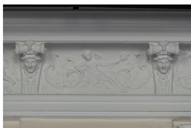
Décor de la corniche de la galerie : putto entre deux consoles à têtes humaines IVR11_20249200086NUC4A