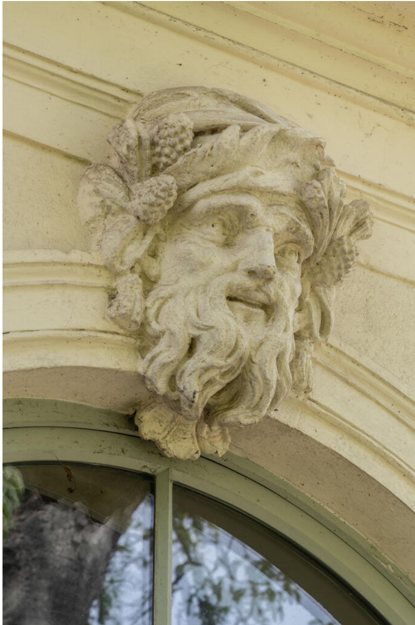
Mascaron à l'extérieur de la galerie : tête de vieillard