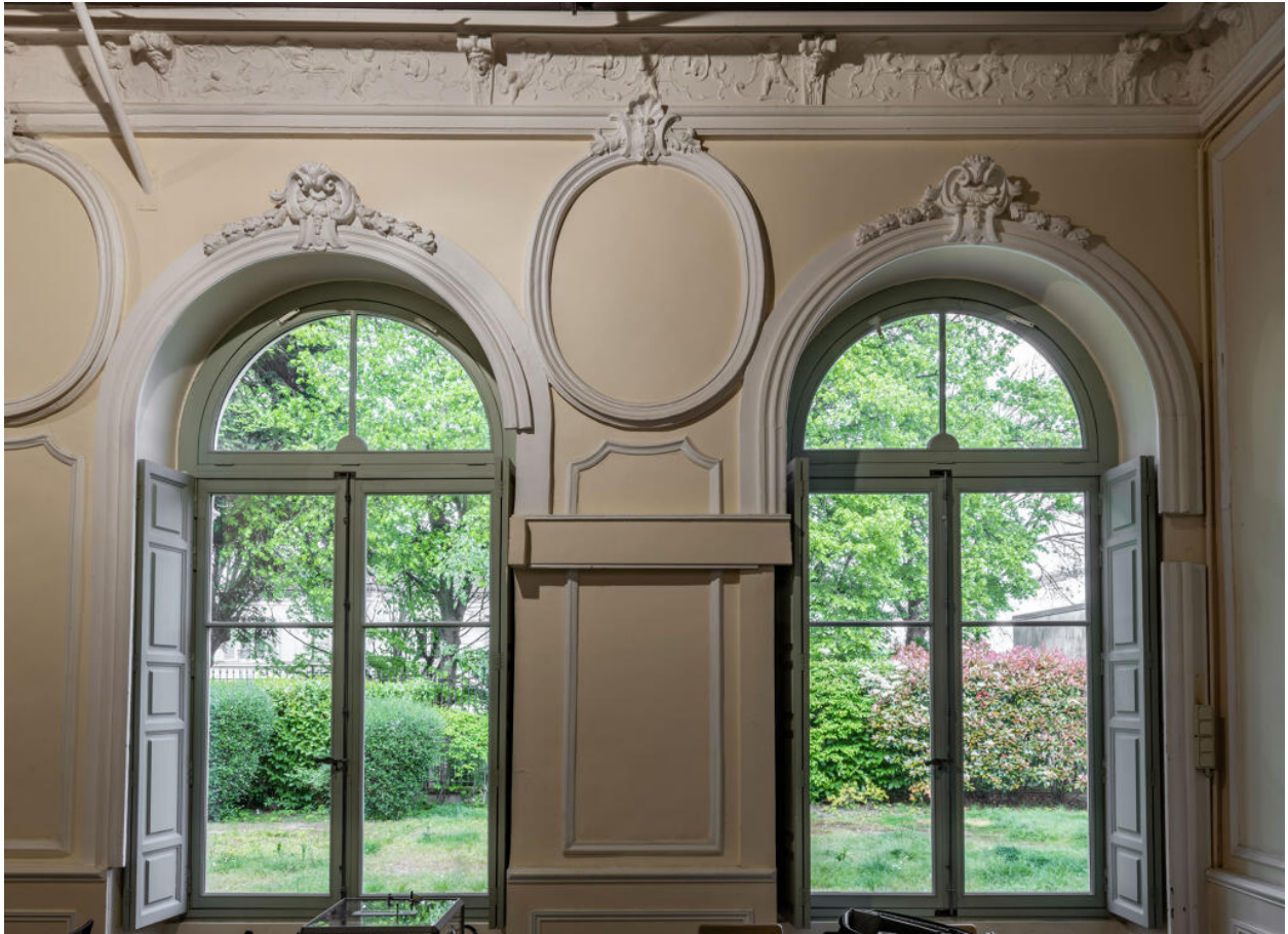
Décor de deux baies de la galerie