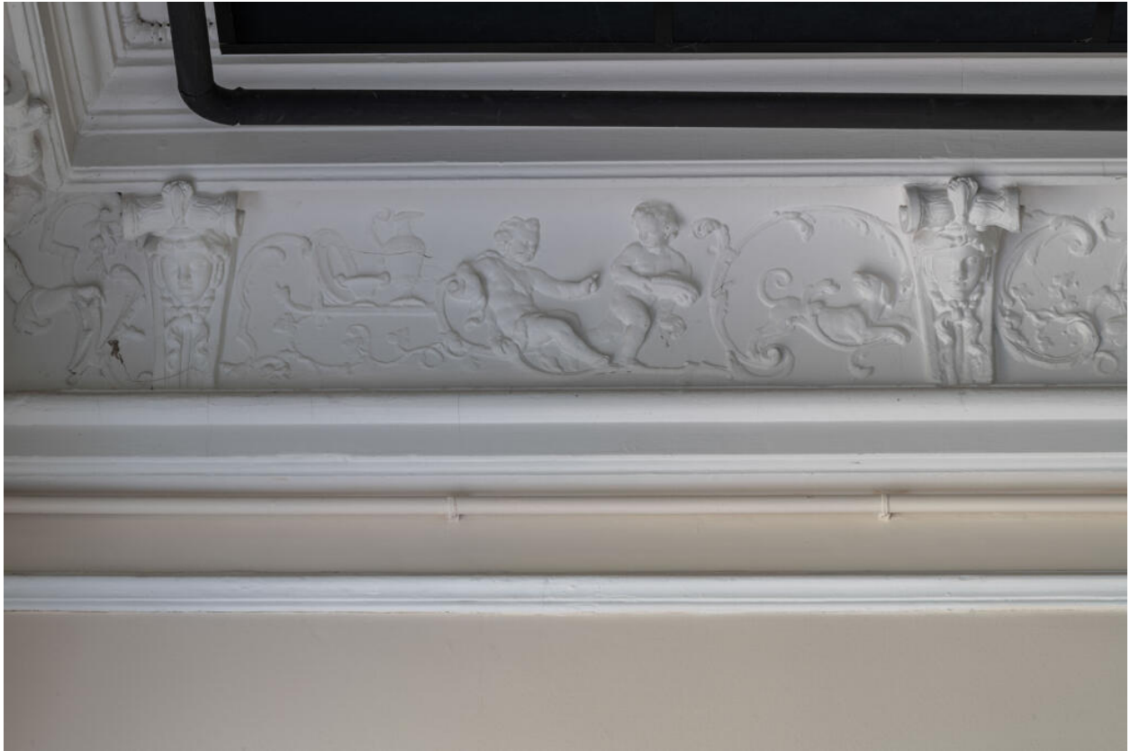
Décor de la corniche de la galerie : arabesques ornées de putti