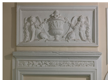
Décor de la galerie : un des deux impostes représentant des sphinxes autour d'une urne