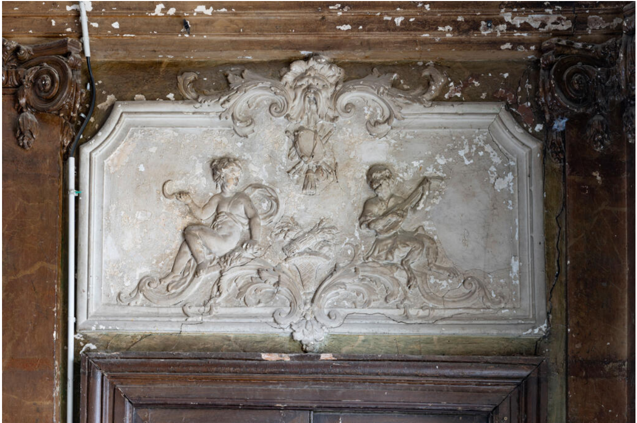
Imposte du vestibule représentant l'été