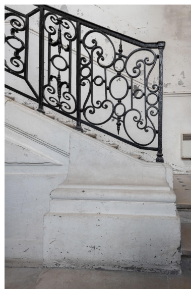
Panneau carré et pilastre en serrurerie du départ de l'escalier