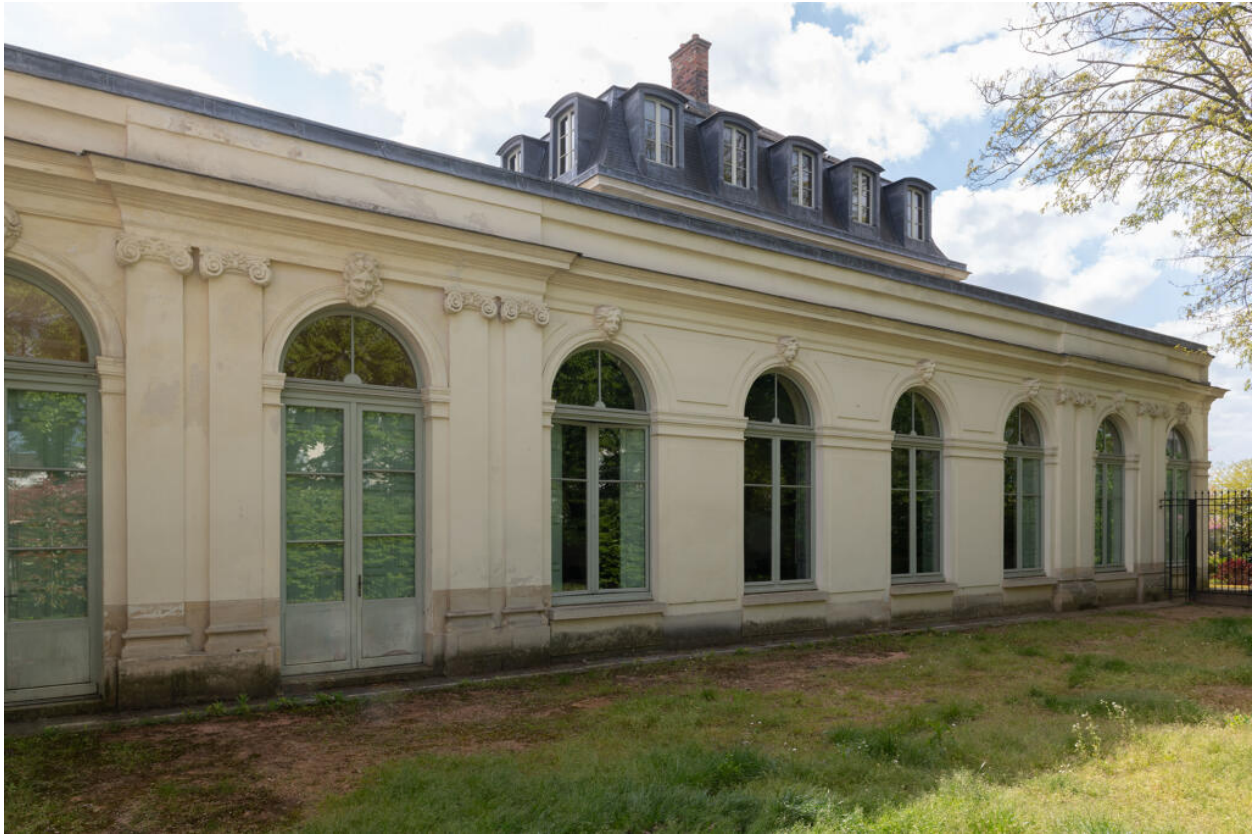
Vue extérieure de la galerie