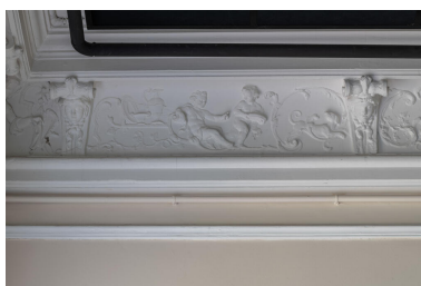
Décor de la corniche de la galerie : arabesques ornées de putti IVR11_20249200081NUC4A