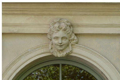
Mascaron à l'extérieur de la galerie : tête de femme IVR11_20249200055NUC4A