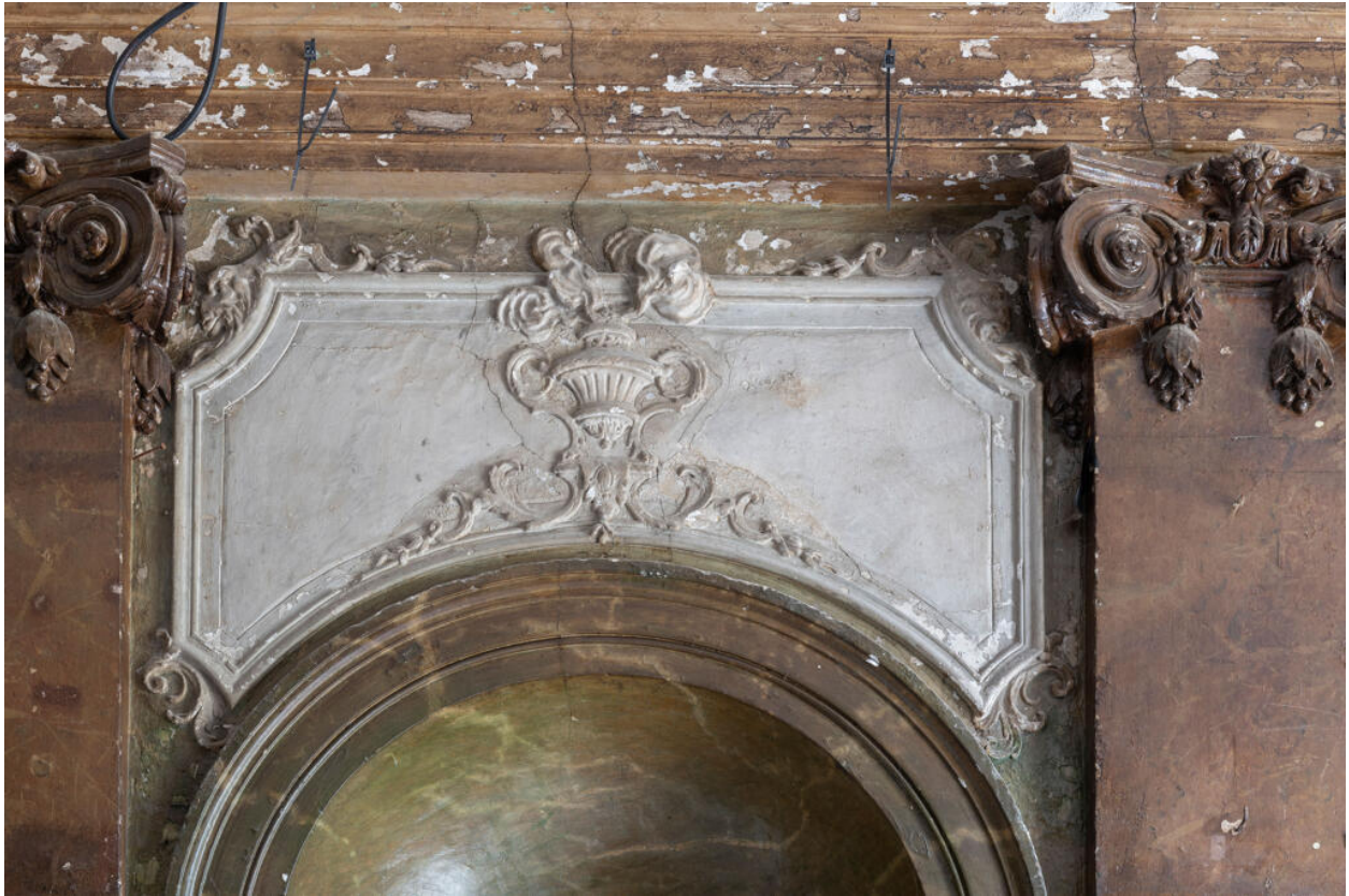
Décor du vestibule : bas-relief représentant une urne fumante