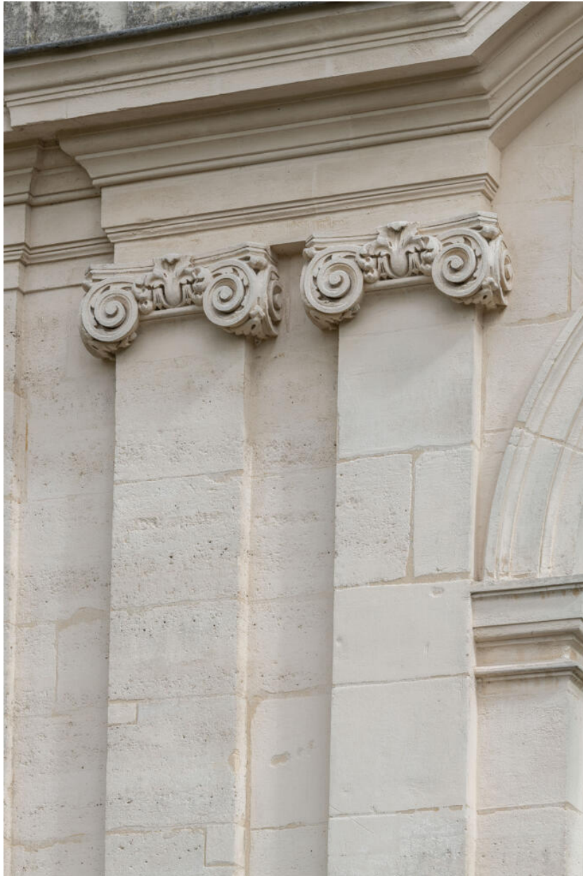
Pilastres ioniques encadrant une baie de la galerie