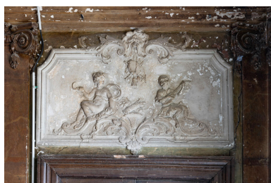
Imposte du vestibule représentant l'été IVR11_20249200068NUC4A