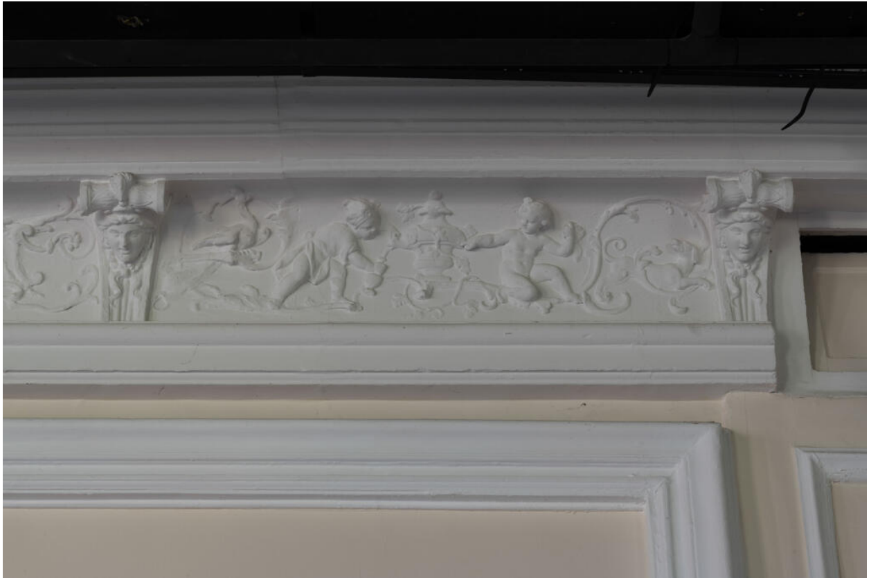
Décor de la corniche de la galerie : putti tirant de l'eau