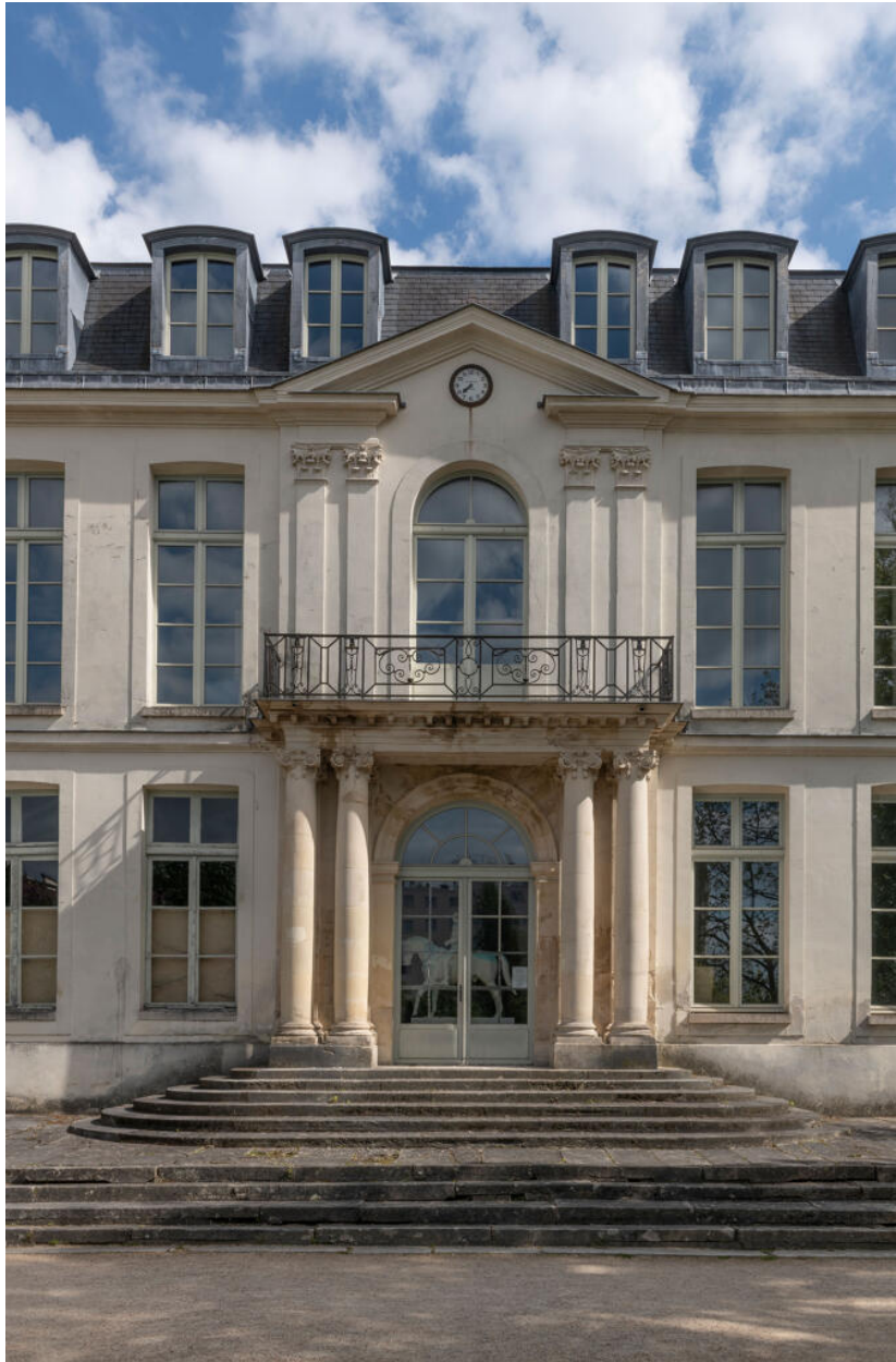
Axe central de la façade sur jardin marqué par un balcon et un fronton