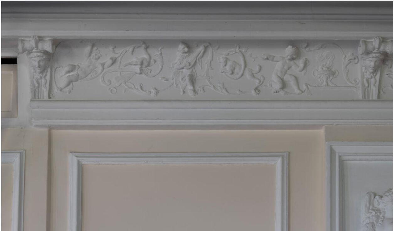
Décor de la corniche de la galerie : singe jouant du luth