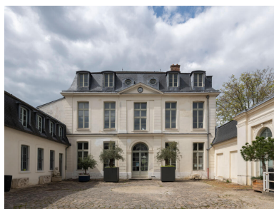
La façade sur cour IVR11_20249200047NUC4A