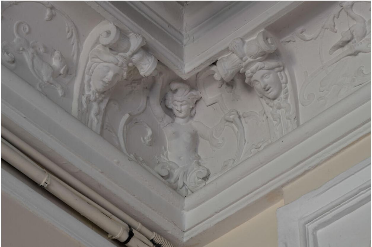
Décor de la corniche de la galerie : figure féminine dans l'angle