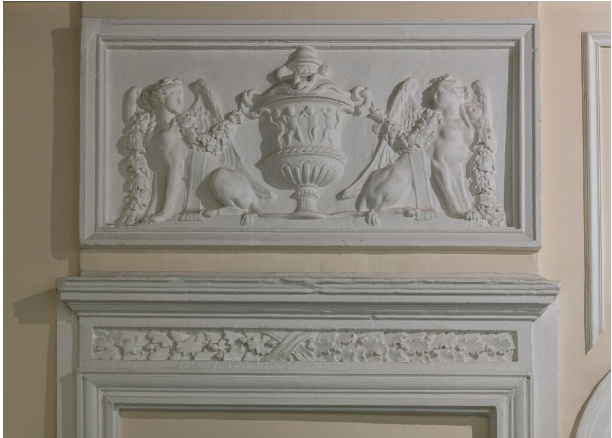
Décor de la galerie : un des deux impostes représentant des sphynxes autour d'une urne