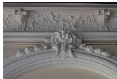
Décor de la corniche de la galerie : putti jouant avec des chiens IVR11_20249200079NUC4A