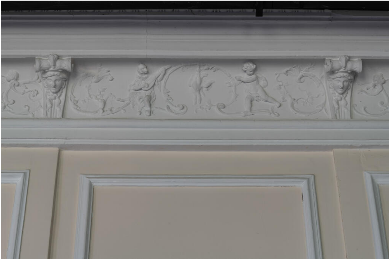
Décor de la corniche de la galerie : singe jouant du luth