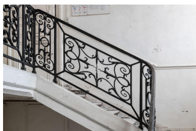
Panneau en serrurerie de la rampe de l'escalier d'honneur IVR11_20249200063NUC4A