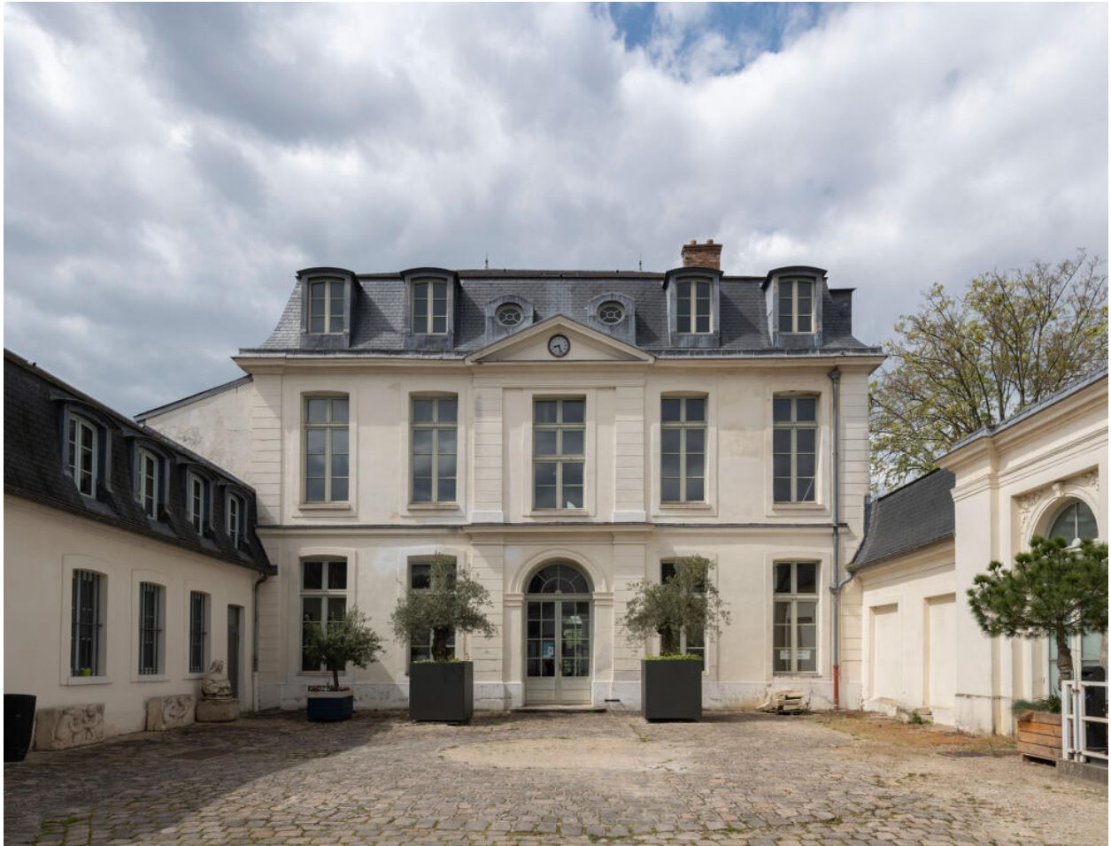
La façade sur cour