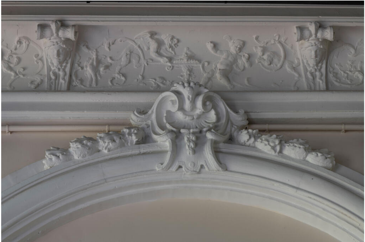
Décor de la corniche de la galerie : putti jouant avec des chiens