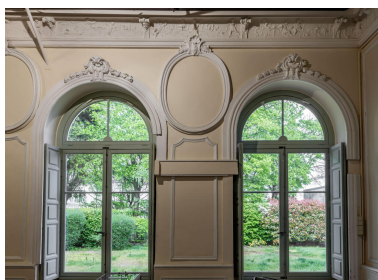
Décor de deux baies de la galerie IVR11_20249200071NUC4A