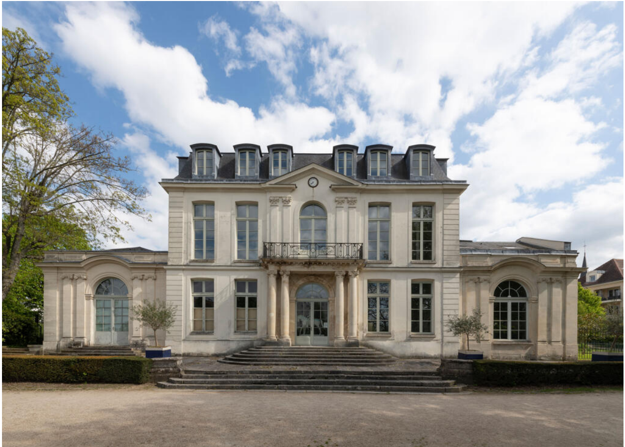
La façade sur jardin du bâtiment central flanqué de ses deux adjonctions : à gauche la galerie, à droite la chambre de la comédienne