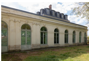
Vue extérieure de la galerie IVR11_20249200054NUC4A