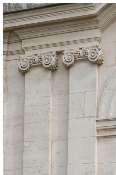
Pilastres ioniques encadrant une baie de la galerie IVR11_20249200052NUC4A