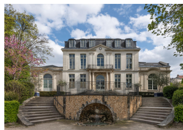
La façade sur jardin qui domine une fausse grotte en rocaille abritant un bassin IVR11_20249200049NUC4A