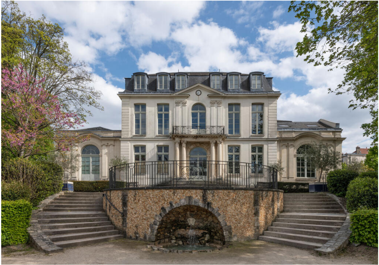
La façade sur jardin qui domine une fausse grotte en rocaille abritant un bassin