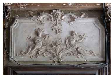
Imposte du vestibule représentant le printemps IVR11_20249200065NUC4A