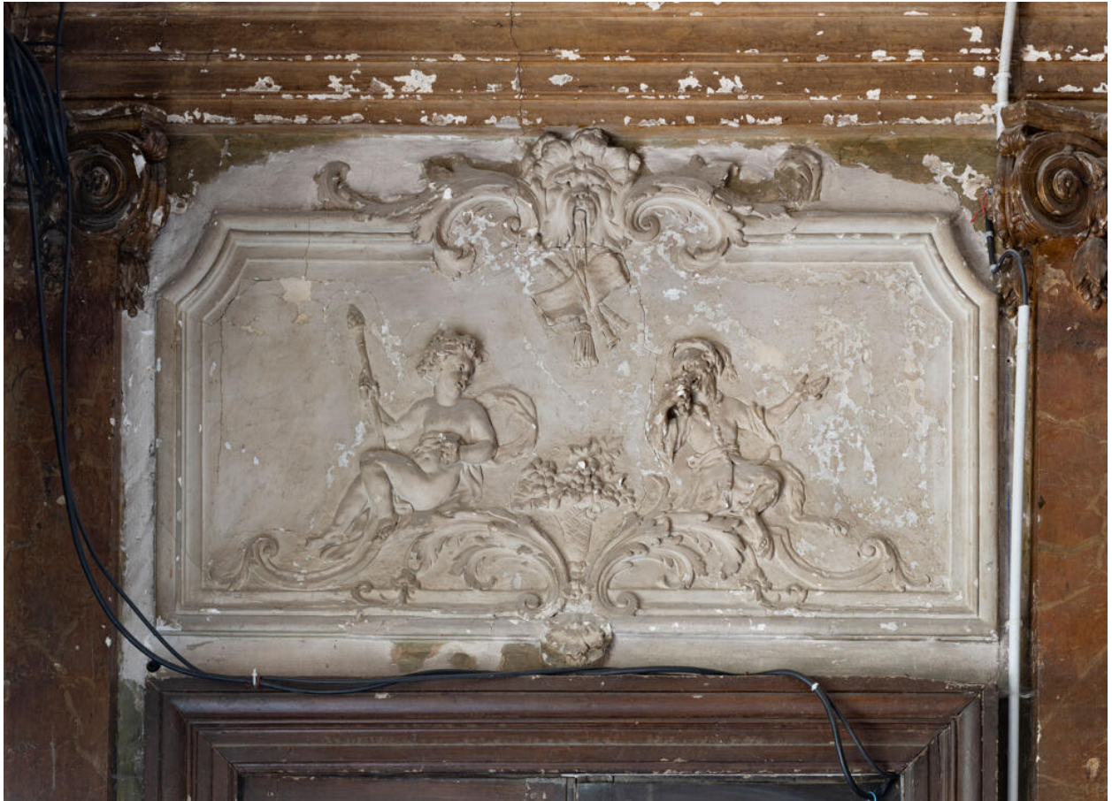
Imposte du vestibule représentant l'automne