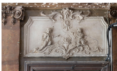
Imposte du vestibule représentant l'hiver IVR11_20249200066NUC4A