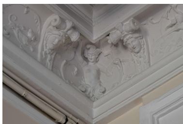
Décor de la corniche de la galerie : figure féminine dans l'angle IVR11_20249200076NUC4A