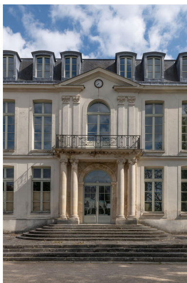
Axe central de la façade sur jardin marqué par un balcon et un fronton IVR11_20249200051NUC4A