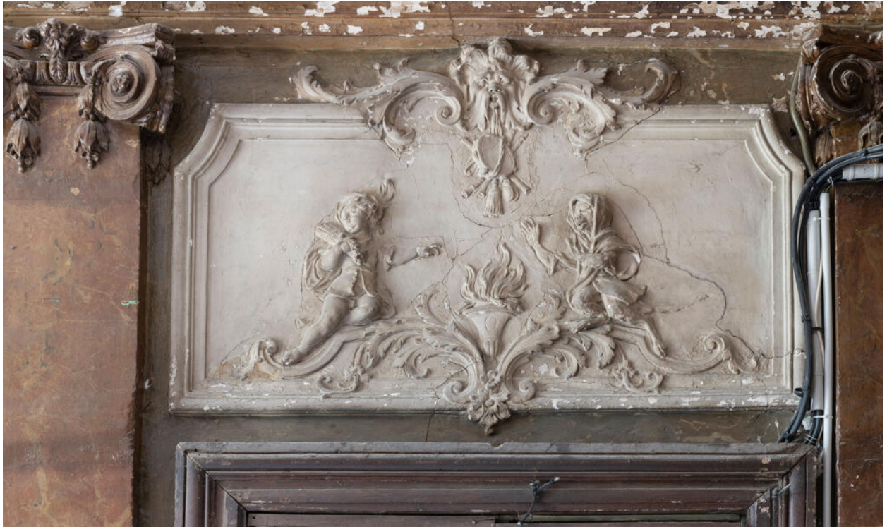
Imposte du vestibule représentant l'hiver