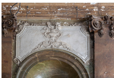
Décor du vestibule : bas-relief représentant une urne fumante IVR11_20249200064NUC4A