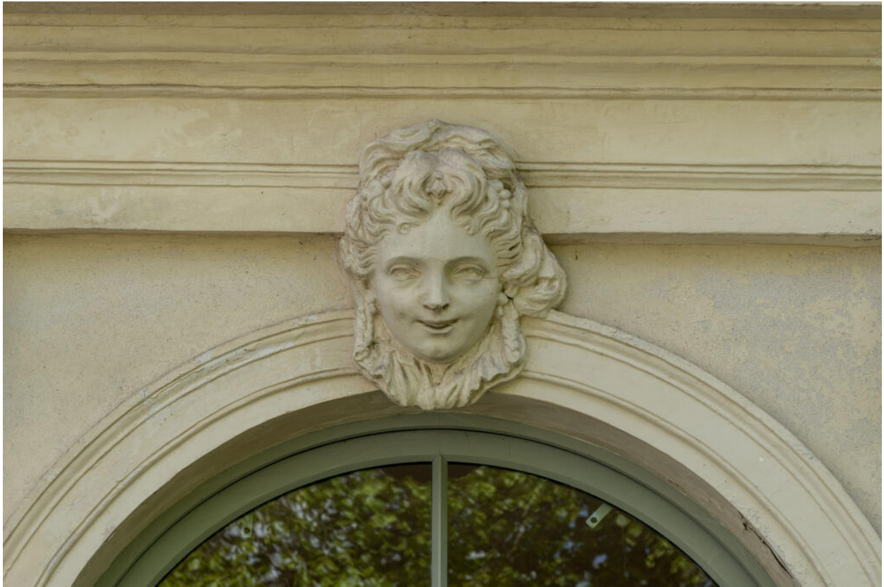
Mascaron à l'extérieur de la galerie : tête de femme