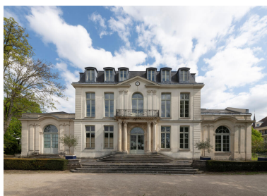
La façade sur jardin du bâtiment central flanqué de ses deux adjonctions : à gauche la galerie, à droite la chambre de la comédienne IVR11_20249200050NUC4A