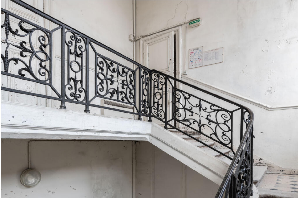
Vue d'ensemble de l'escalier d'honneur avec sa rampe de serrurerie d'une grande qualité