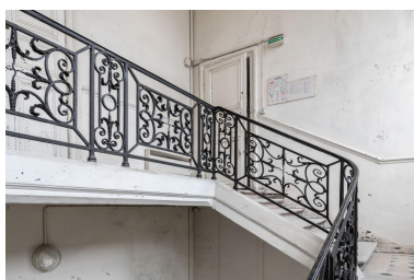
Vue d'ensemble de l'escalier d'honneur avec sa rampe de serrurerie d'une grande qualité IVR11_20249200060NUC4A