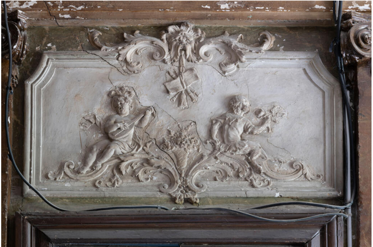
Imposte du vestibule représentant le printemps