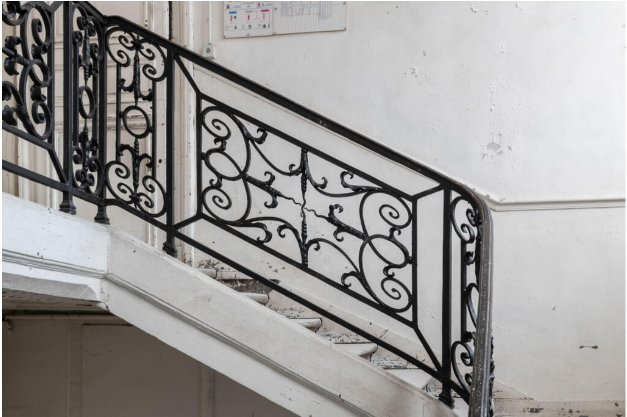
Panneau en serrurerie de la rampe de l'escalier d'honneur