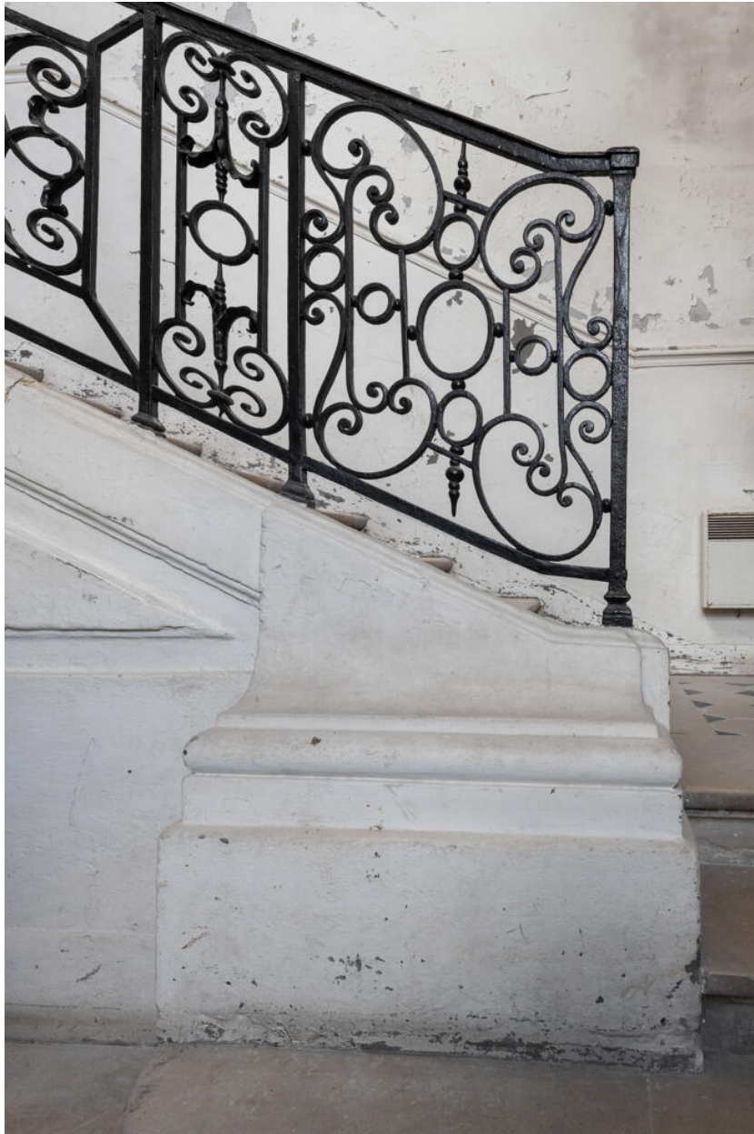
Panneau carré et pilastre en serrurerie du départ de l'escalier