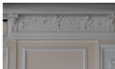
Décor de la corniche de la galerie : singe jouant du luth