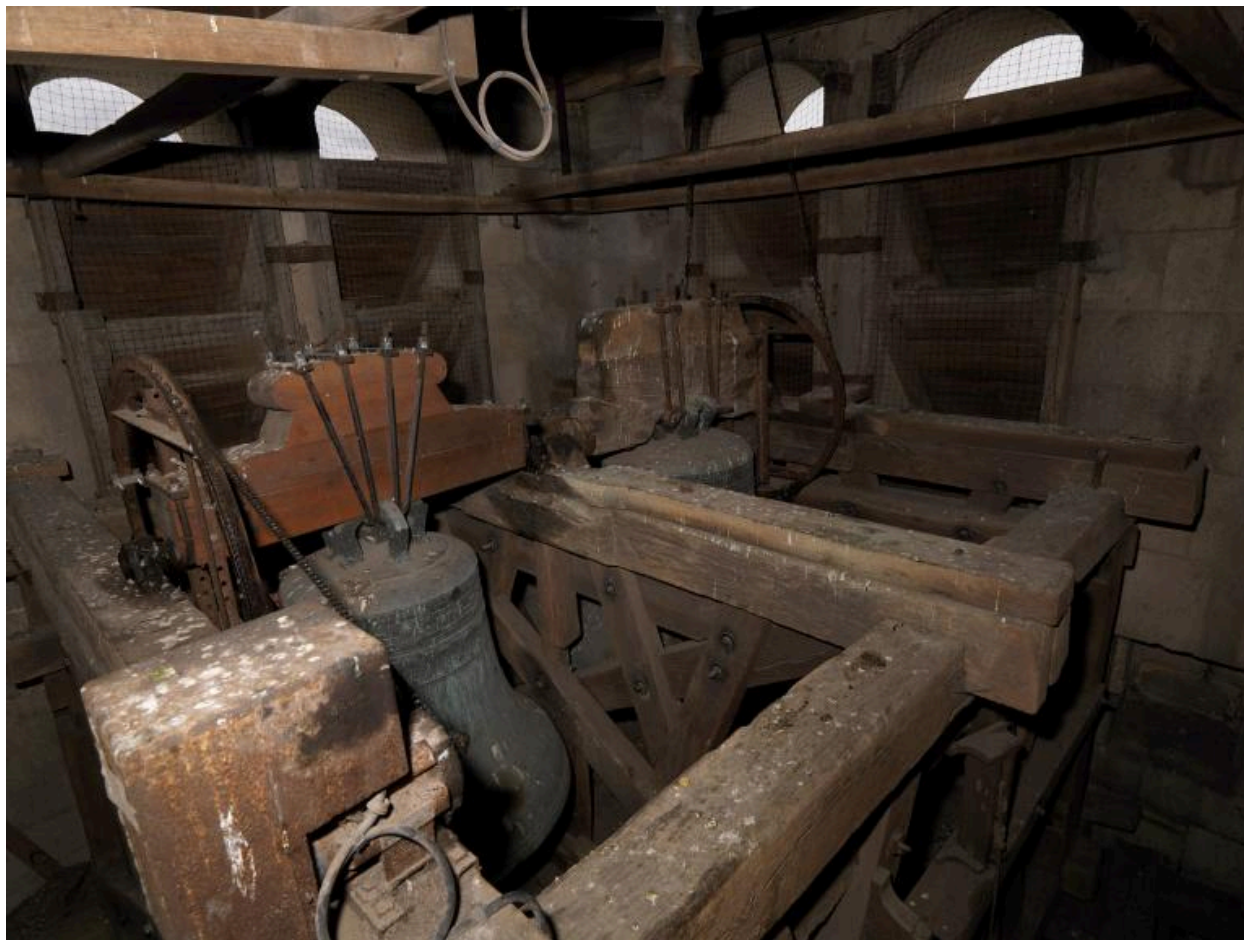
Au premier plan, la cloche "Alexandrine" (1878) ; au second plan, "Anne" (1554).