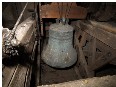
La cloche "Alexandrine" (1878).