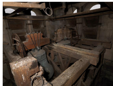
Au premier plan, la cloche "Alexandrine" (1878) ; au second plan, "Anne" (1554). IVR11_20179500057NUC4A