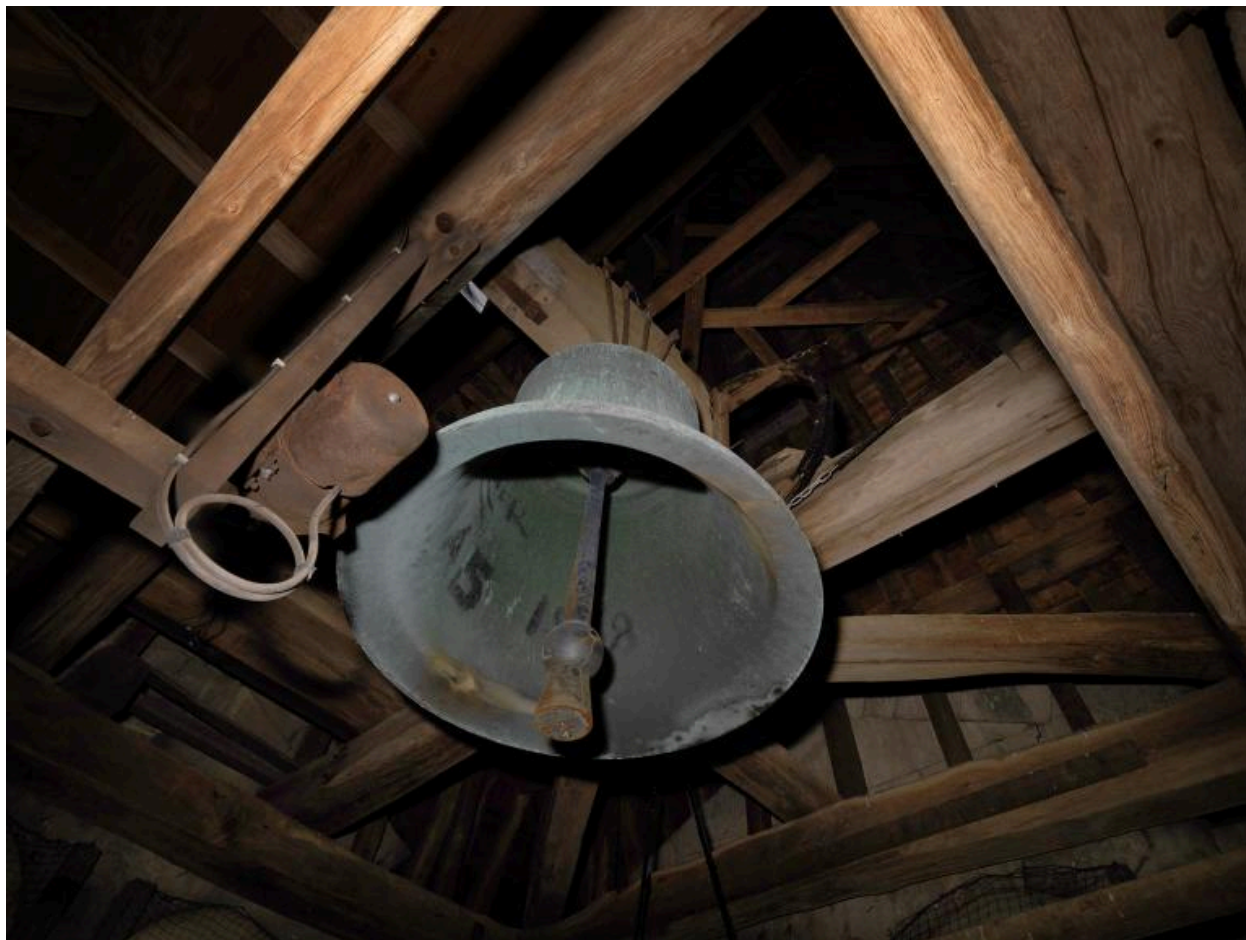
La cloche "Louise Gabrielle" (1878).