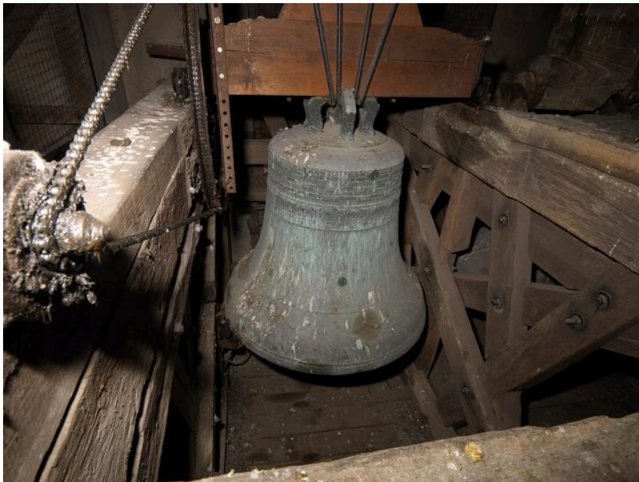
La cloche "Alexandrine" (1878).