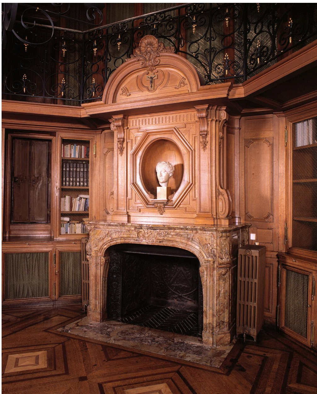
Bibliothèque du baron de Courcel : détail de la cheminée.