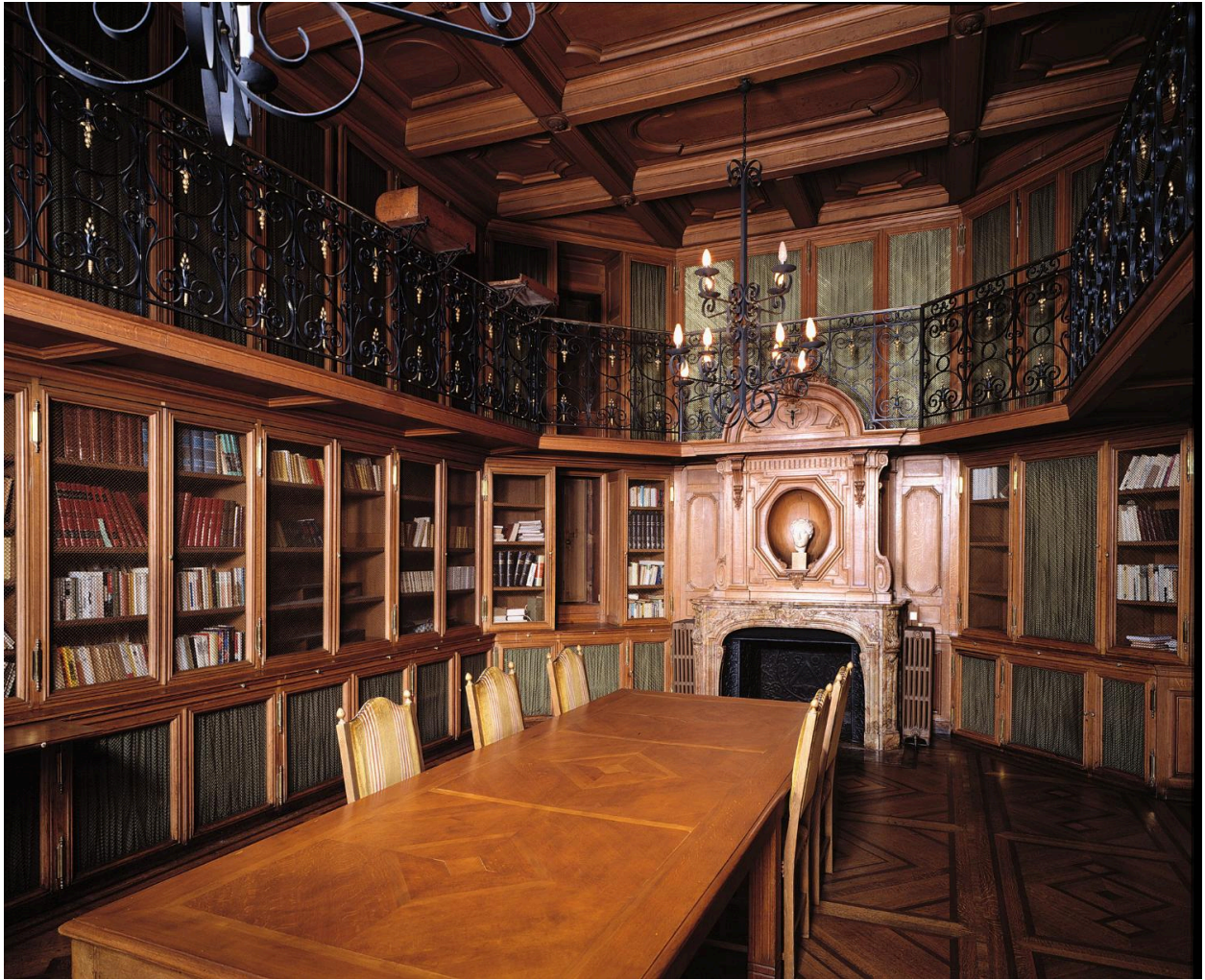
Vue d'ensemble de la bibliothèque aménagée par Alphonse de Courcel en 1906 ; les boiseries sont dues à l'entreprise Ruzé, 64 rue Mademoiselle à Paris, sous la direction de l'architecte Georges Lisch.