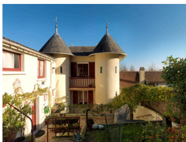
Façade arrière. IVR11_20167800748NUC4A