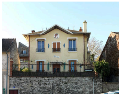
Façade principale tournée vers la Seine.