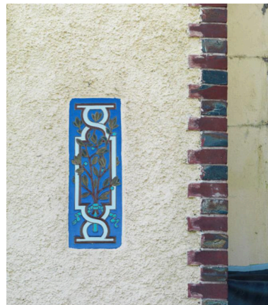
Décor de façade : Cartouche décoratif à feuillages et chaînage de briques vernissées.