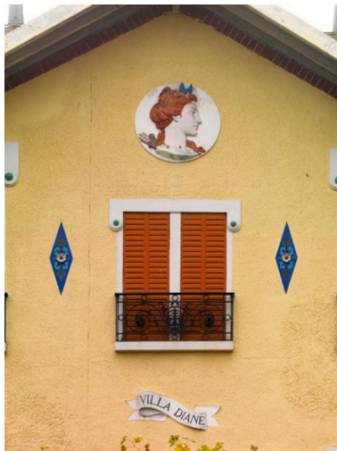
Vue de détail de la façade principale : médaillon de Diane chasseresse et losanges décoratifs.