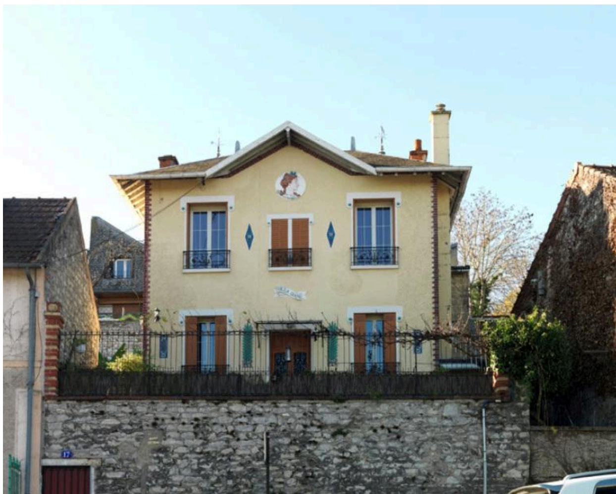
Façade principale tournée vers la Seine.