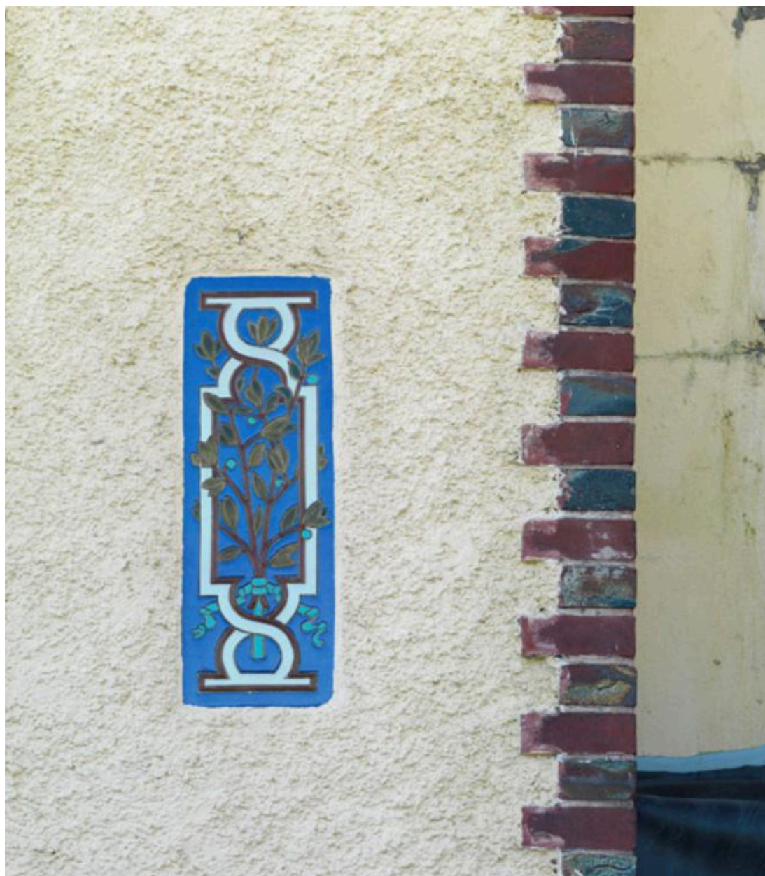
Décor de façade : Cartouche décoratif à feuillages et chaînage de briques vernissées.