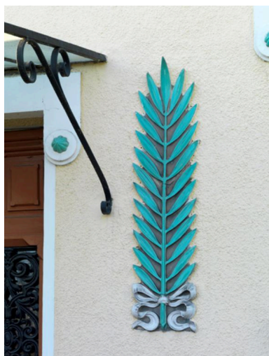
Décor céramique de palme à rubans et de cabochon décorant l'entrée.