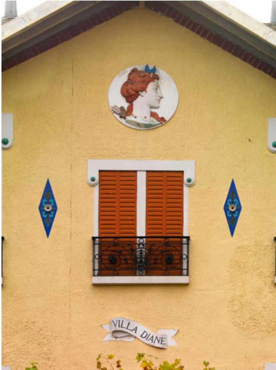
Vue de détail de la façade principale : médaillon de Diane chasseresse et losanges décoratifs.