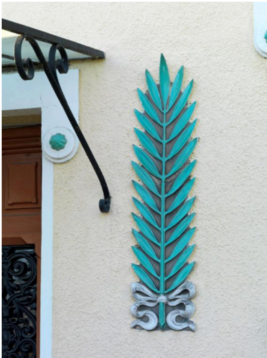
Décor céramique de palme à rubans et de cabochon décorant l'entrée.